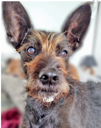
Bruce, o cão barbudo