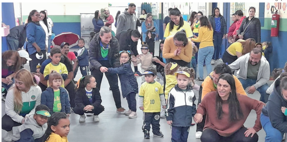
A participação das famílias dos alunos foi um dos pilares do projeto

A iniciativa reforça o compromisso do CMEI Yolanda Immediato Fryling com uma educação integral, que valoriza o desenvolvimento das crianças em todas as suas dimensões e fortalece os vínculos entre escola, família e comunidade.