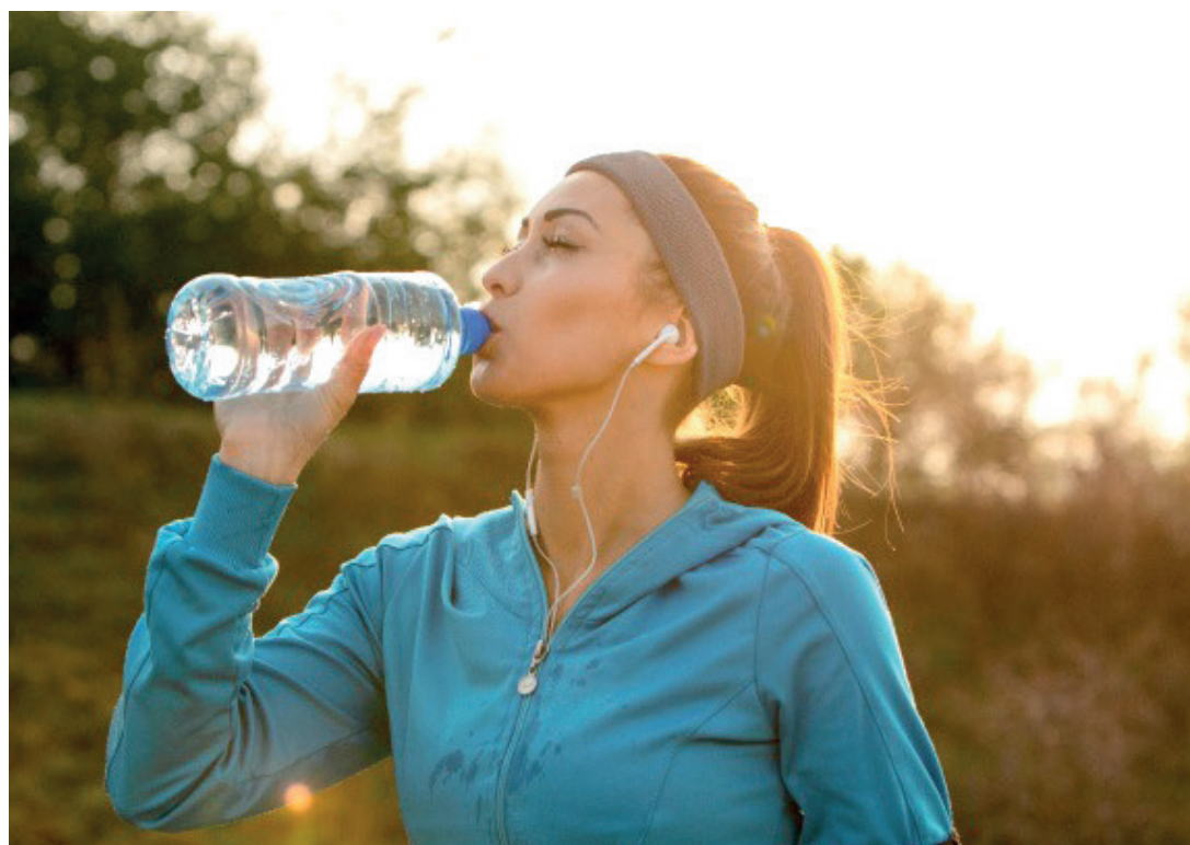
Com o frio, muitas pessoas bebem menos líquidos, o que causa dores de cabeça e cansaço, além de outros sintomas

Por isso, pessoas com histórico de doenças cardiovasculares devem manter o acompanhamento médico em dia e não abandonar hábitos saudáveis durante a estação.