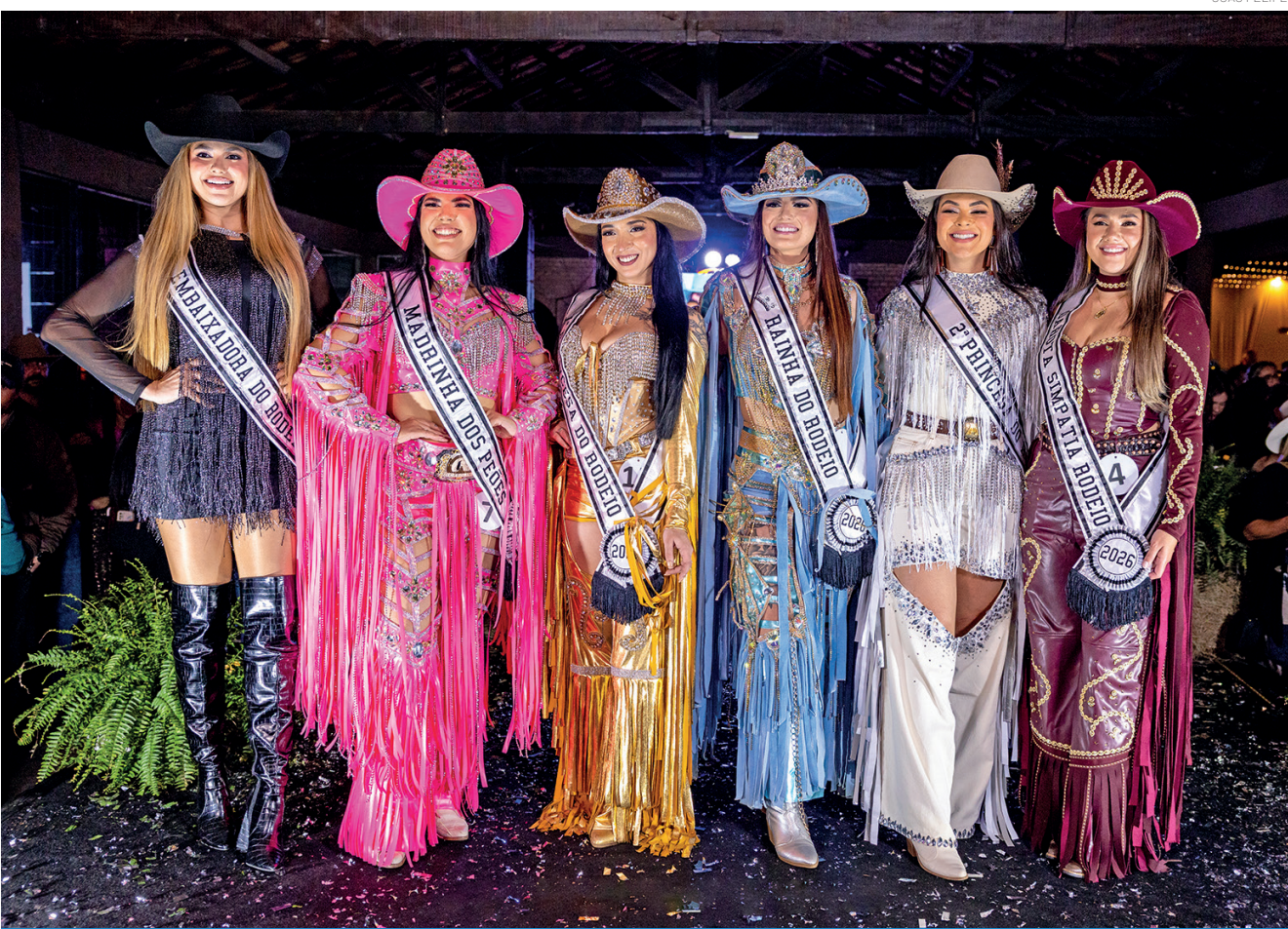
Corte do Pinda Rodeio Fest 2026, eleita na noite do último sábado (26), no Bar Paiol