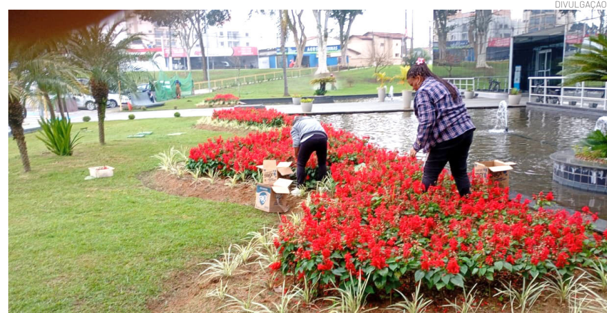
A primeira espécie escolhida para o projeto foi a sálvia-vermelha

A primeira espécie escolhida para o projeto foi a sálvia-vermelha, amplamente utilizada na composição dos jardins da cidade. Todo o processo, desde a coleta das sementes até a triagem, germinação e cultivo das mudas, é realizado pela