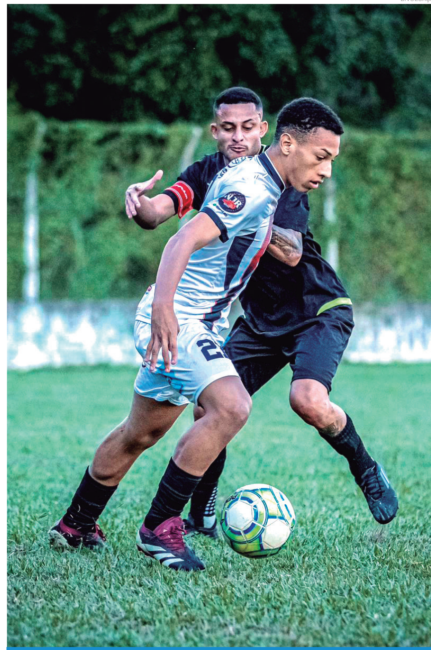
O fim de semana teve jogos espalhados por diversos campos da cidade

Pelo Sub-13 diversas goleadas também tomaram conta, na Chave A quem goleou foi o Araretama que fez 3 a 0 no Fluxo, na chave B 2 goleadas foram destaque, Santa Luzia fez 6 a 0 no Gerezim B, e o Gerezim A fez 4 a 0 no Fluminense. No Sub-17, Marca da Promessa conseguiu uma vitória elástica contra o Cidade Jardim, partida válida pela chave A, na Chave B o Maec conseguiu a impressionante vitória de 10 a 0 contra o Cantareira.