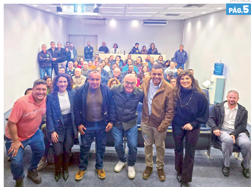
Programa foi lançado na quinta-feira (25), no auditório do Paço Municipal