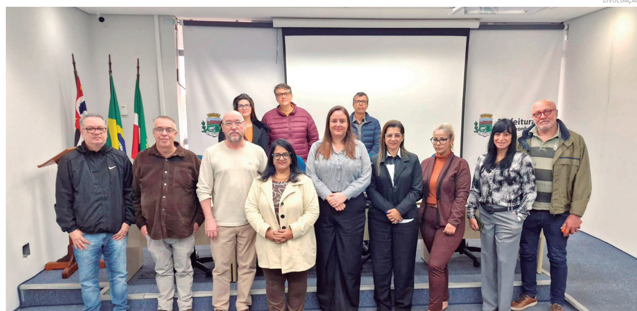
O objetivo do encontro é apresentar orientações sobre a destinação de recursos por meio das leis de incentivo fiscal