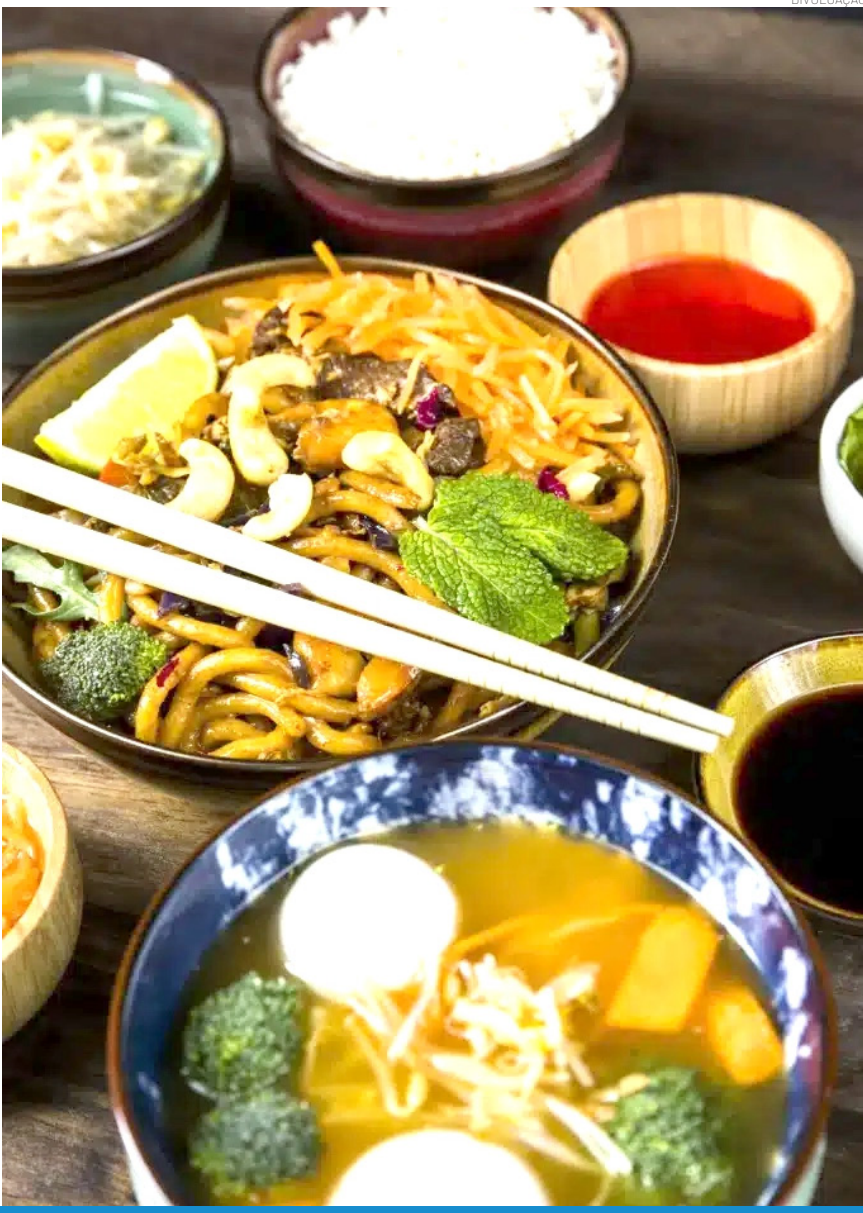
Além da gastronomia, o evento terá uma programação cultural diversificada

Pindamonhangaba será palco, entre os dias 3 e 5 de julho, do Festival Mundo Asiático, considerado um dos maiores eventos dedicados à gastronomia e à cultura oriental no país. Com entrada gratuita, a programação acontece das 10h às 22h, no Shopping Pátio Pinda, reunindo culinária típica, apresentações culturais e atrações voltadas aos fãs da cultura pop asiática.