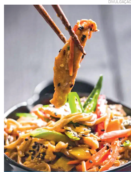
Evento acontece no Pátio Pinda