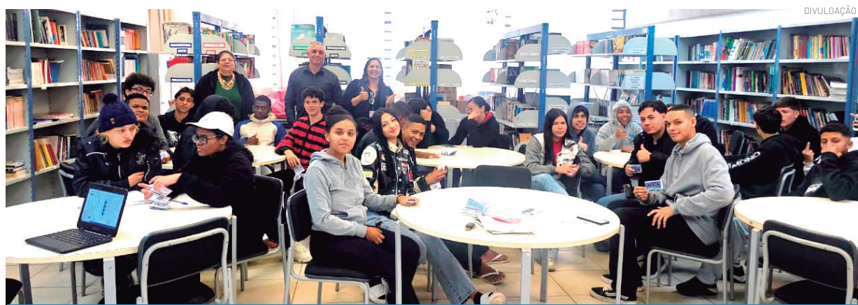
A iniciativa leva aos estudantes informações sobre direitos, deveres e consumo consciente

O Procon de Pindamonhangaba informa que a iniciativa será ampliada e está à disposição das demais escolas da cidade interessadas em receber a atividade. As instituições de ensino podem agendar uma roda de conversa entrando em contato pelo telefone (12) 3644-5600. O objetivo é fortalecer a educação para o consumo e ampliar o conhecimento dos estudantes sobre seus direitos e responsabilidades nas relações de consumo.