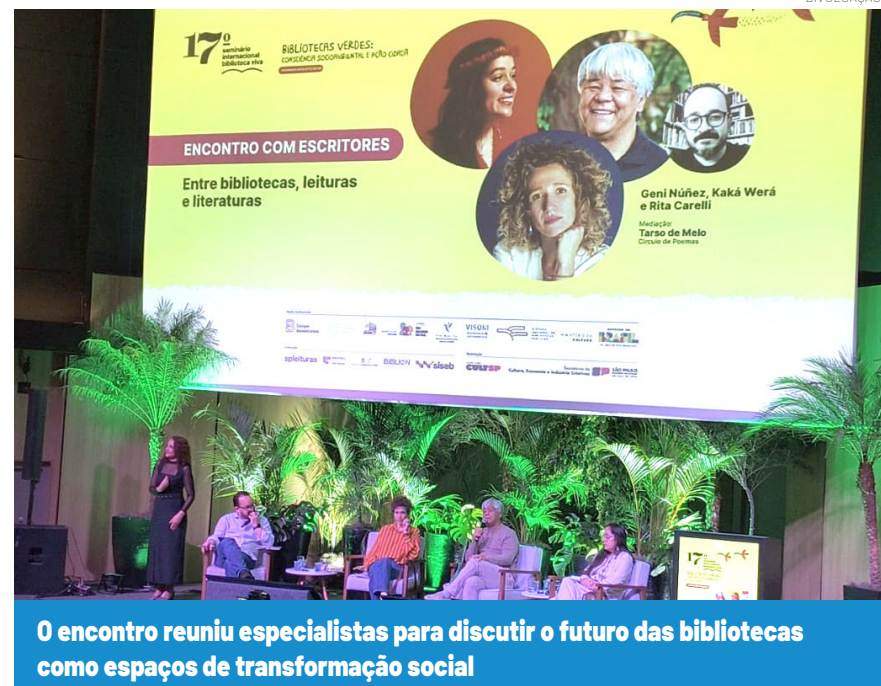
O encontro reuniu especialistas para discutir o futuro das bibliotecas como espaços de transformação social