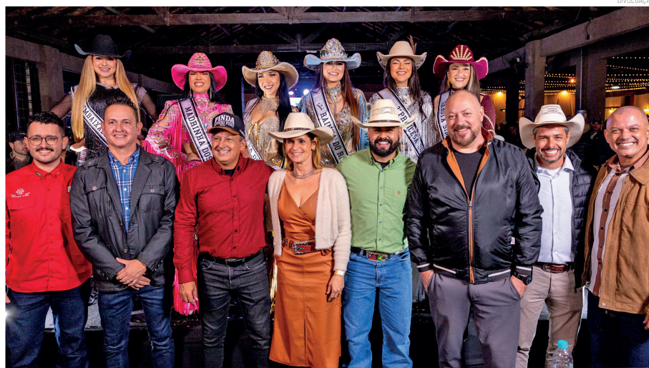
A corte do Pinda Rodeio Fest 2026 eleita na noite da última quinta-feira, no Bar Paiol e os organizadores do evento