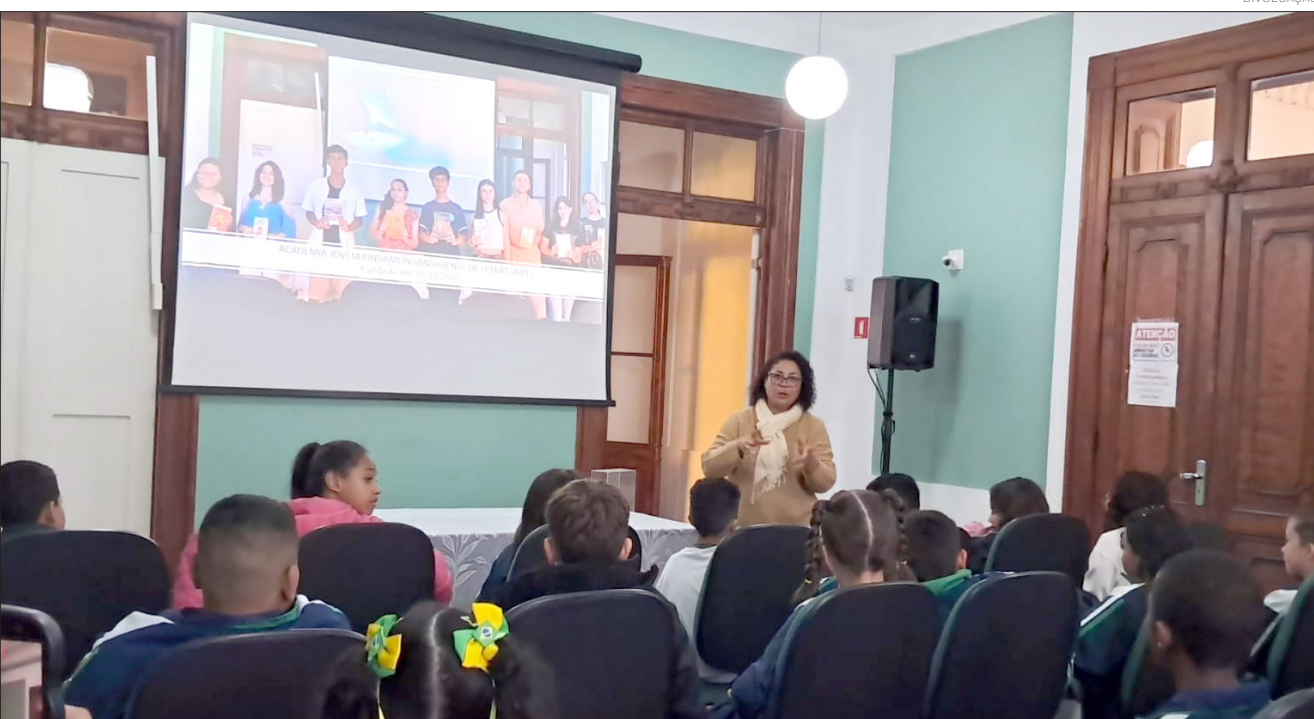
A atividade reforça a importância da leitura, da escrita e da valorização da produção artística