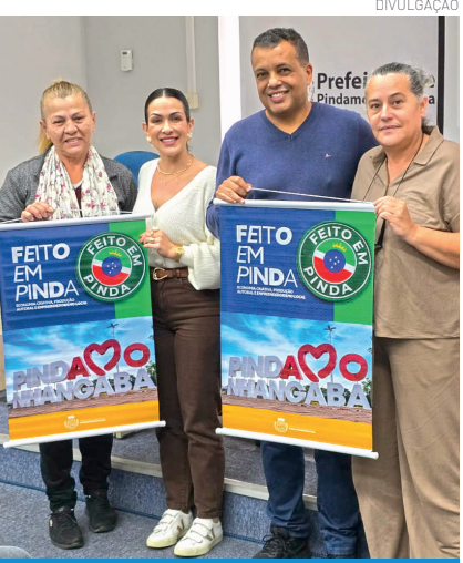
Programa valoriza produção local