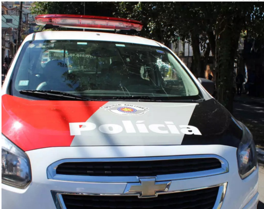
Até o momento, nenhum suspeito foi identificado

A equipe do Samu confirmou a morte no local. A perícia da Polícia Científica também foi acionada e encontrou duas cápsulas de calibre 380 próximas ao corpo. Até o momento, nenhum suspeito foi identificado, e o caso segue sendo investigado pela Polícia Civil.