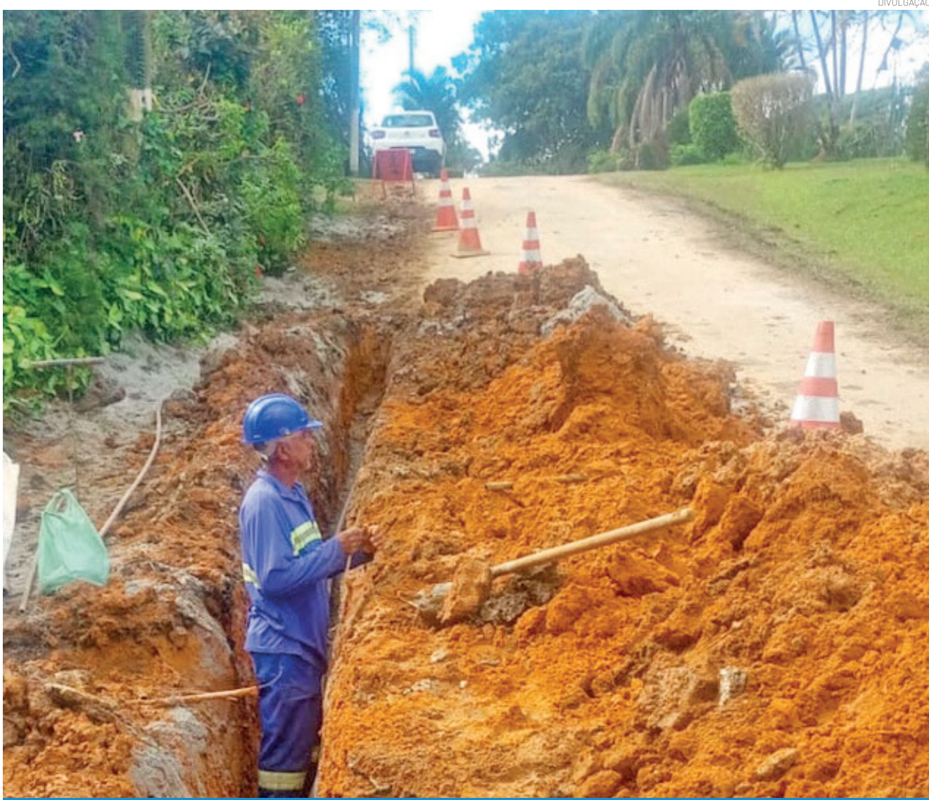
Serão sete quilômetros de rede de água tratada, acabando com a dependência de mina e poço particular

Obra substitui água de mina por rede pública no bairro e, com o sistema de esgotamento sanitário, protege o meio ambiente