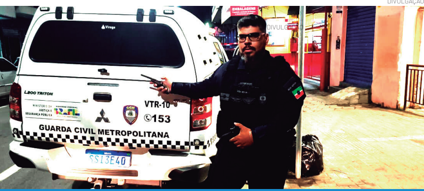
A parceria entre as instituições buscam a segurança dos frequentadores e a tranquilidade dos comerciantes

Com a nova vocação voltada ao entretenimento noturno, o Centro Comercial 10 de Julho tem recebido grande público aos finais de semana em seus bares e estabelecimentos gastronômicos. Para garantir a manutenção da ordem, a segurança dos frequentadores e a tranquilidade dos comerciantes, a Secretaria Municipal de Segurança, por meio da Guarda Civil Metropolitana (GCM), em parceria com a Polícia Militar, segue realizando ações de monitoramento e atendimento a ocorrências na região.