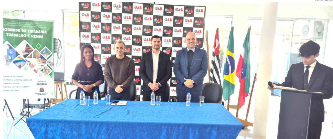
A ação busca ampliar o acesso a serviços essenciais, promovendo a reinserção social e profissional