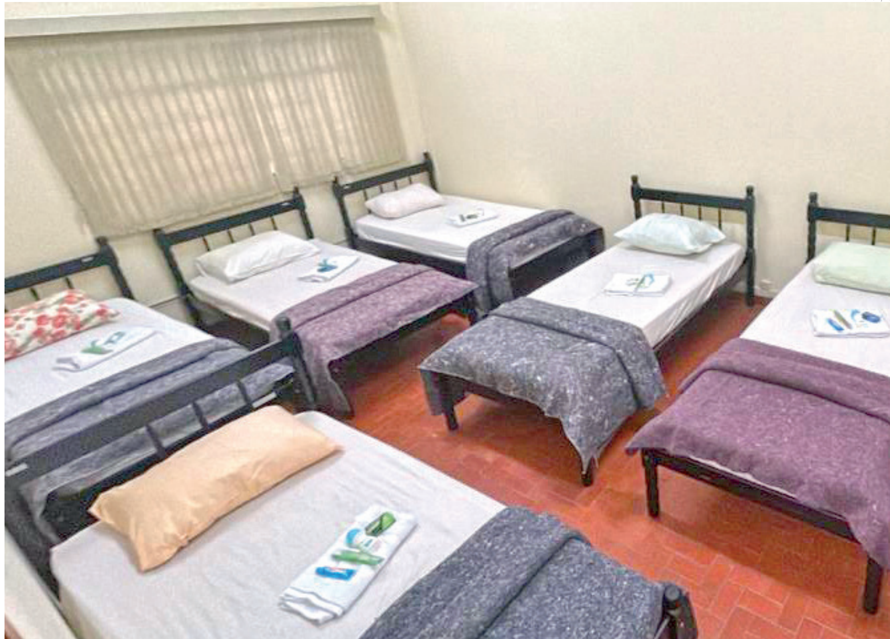
A iniciativa integra as ações da Prefeitura voltadas à proteção da população em situação de rua e de extrema vulnerabilidade social durante o inverno