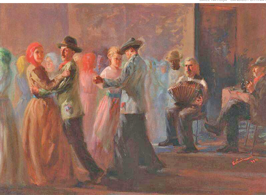
BAILE NA ROÇA - CÂNDIDO PORTINARI