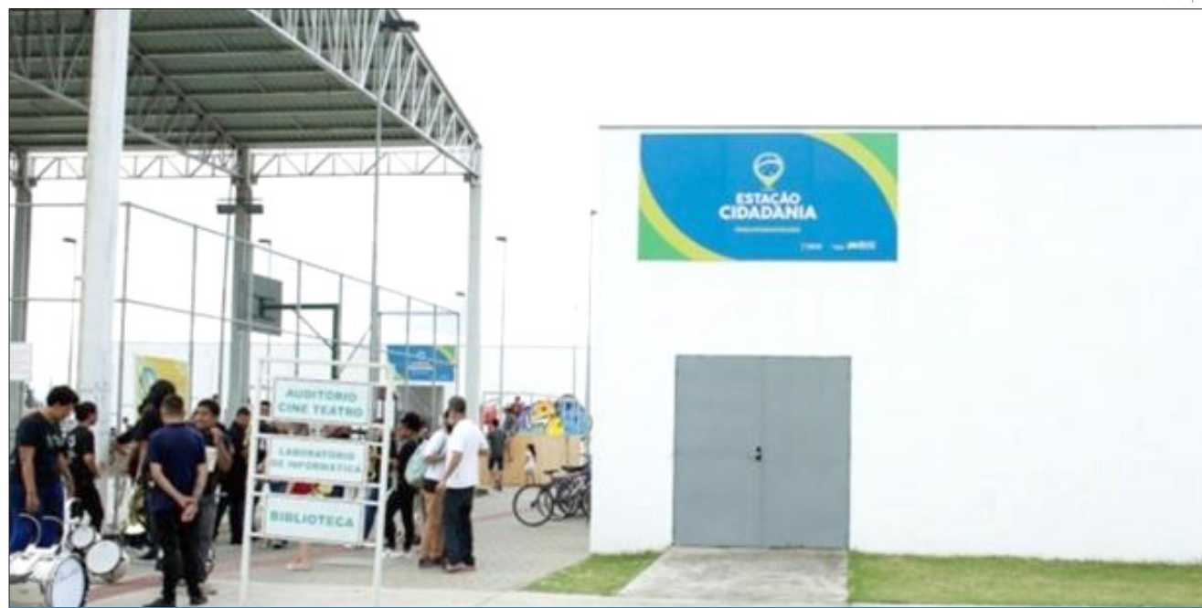
A ação tem como objetivo incentivar a leitura e valoriza a diversidade cultural

Por meio da arte, da literatura e da oralidade, a iniciativa amplia o acesso à cultura e promove o contato com diferentes tradições e saberes, fortalecendo o respeito à diversidade cultural e proporcionando experiências enriquecedoras para crianças, jovens e adultos.