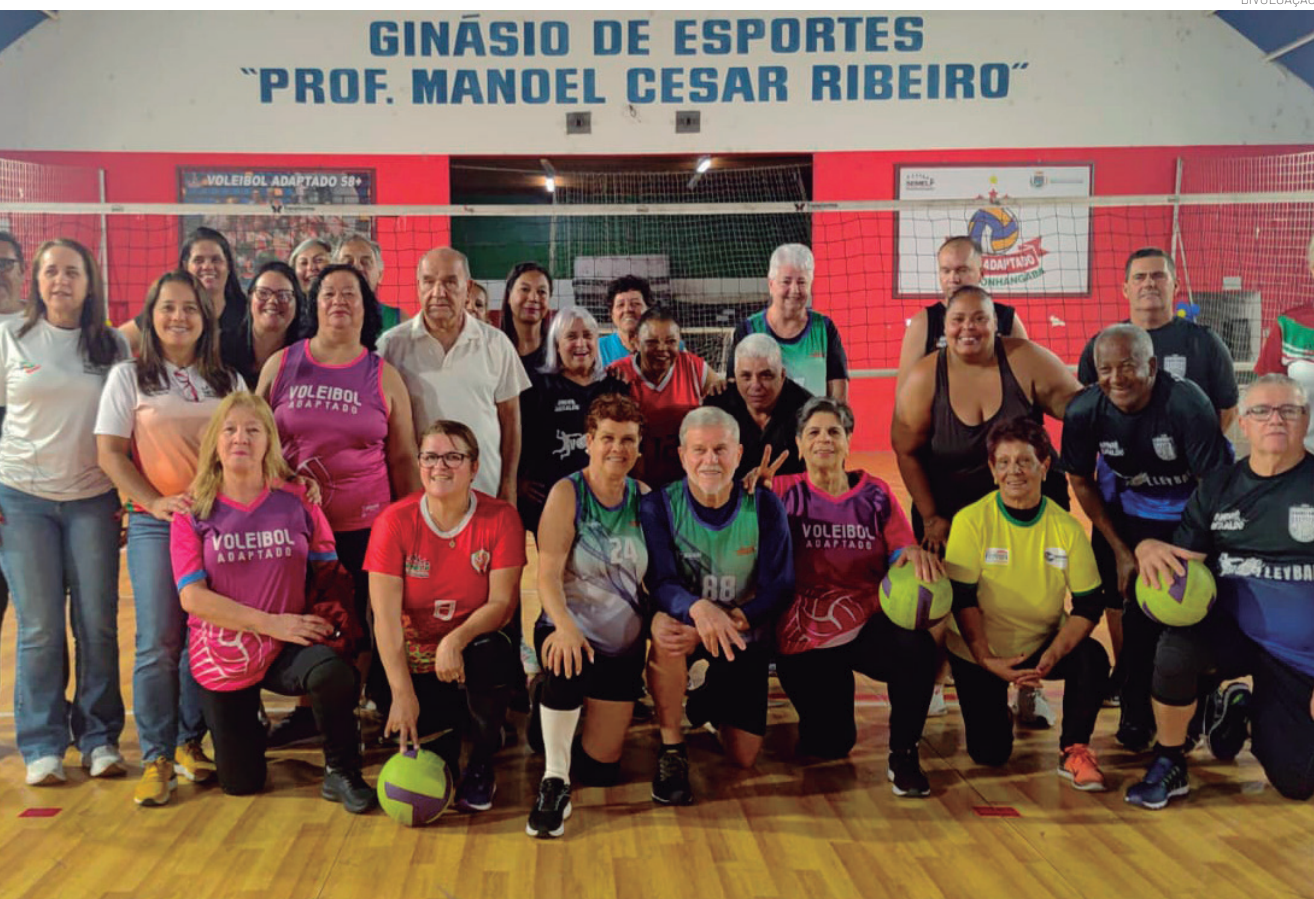
O encontro fortaleceu a integração entre os alunos com muitos momentos de lazer