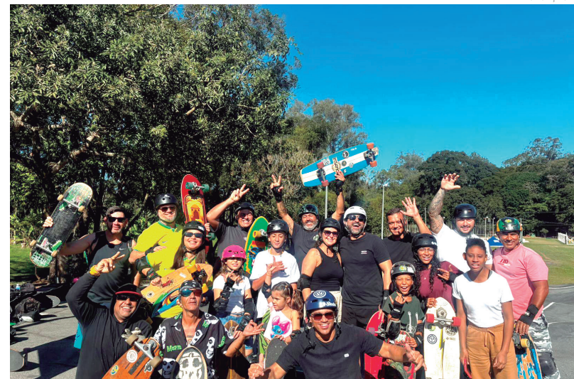
O dia foi marcado por esporte, música, lazer e valorização da cultura urbana

O Parque da Cidade recebeu, no último domingo (21), uma programação especial em comemoração ao Dia Mundial do Skateboard. O FLOW Festival integrou o projeto Domingo no Parque e reuniu praticantes da modalidade, famílias e visitantes em um dia marcado por esporte, música, lazer e valorização da cultura urbana.