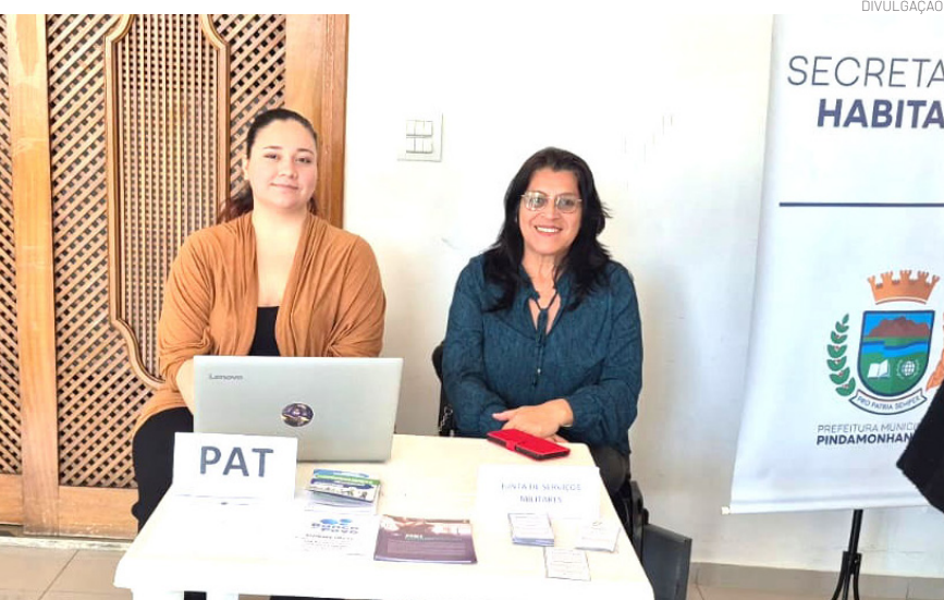
A iniciativa fortalece a inclusão produtiva

brou ainda da parceria entre a Prefeitura e a Fundação de Amparo ao Preso (Funap) já contribuiu para a reintegração social por meio da oferta de oportunidades de trabalho e qualificação a reeducandos e egressos do sistema prisional. Atualmente, o município conta com 243 reeducandos atuando em frentes de trabalho ligadas aos serviços de zeladoria, limpeza e manutenção de espaços públicos, promovendo benefícios tanto para os participantes quanto para a cidade. A iniciativa fortalece a inclusão produtiva, estimula a construção de novas perspectivas de vida e contribui para a redução da reincidência criminal.