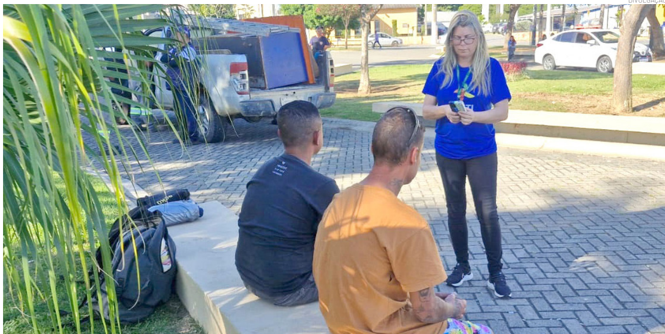
O alojamento representa uma ação de cuidado e proteção às pessoas em situação de rua

Renegociação Quem já possui acordo de pagamentos, como parcelamento em até 60 vezes, por exemplo, mas sem os descontos em juros e multas, pode pedir a anistia normalmente e cancelar o acordo anterior. Neste caso, o contribuinte deverá verificar qual opção caberá em seu bolso, anistia de juros e multas e pagamento em até 24 vezes, ou parcelamento em até 60 meses, mas sem os descontos em multas e juros.