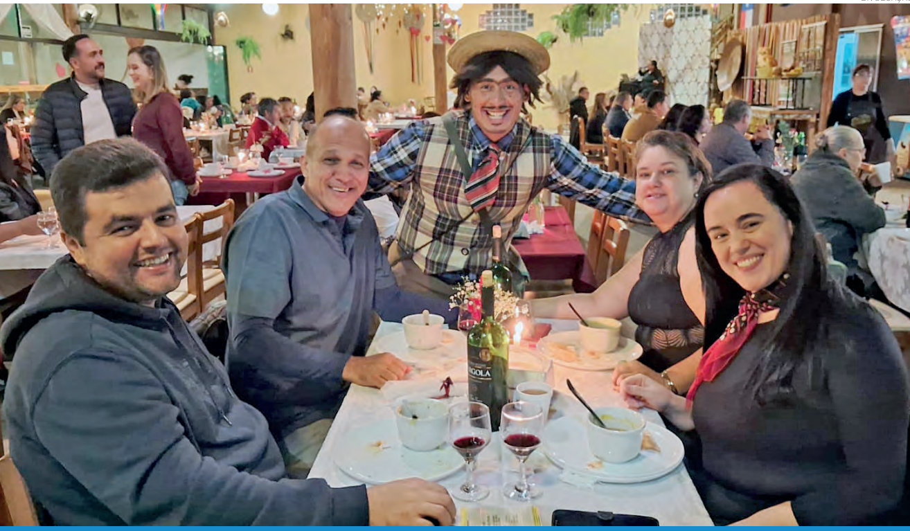
O Festival de Inverno segue até o final de julho, com diversas atrações e experiências gastronômicas