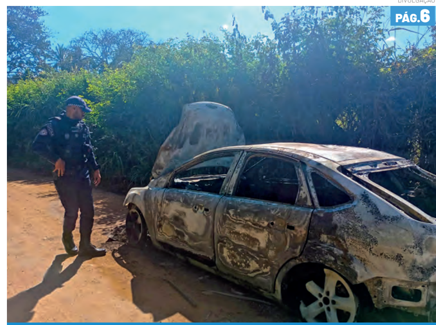
Veículo envolvido na ocorrência na noite de quarta-feira (17)