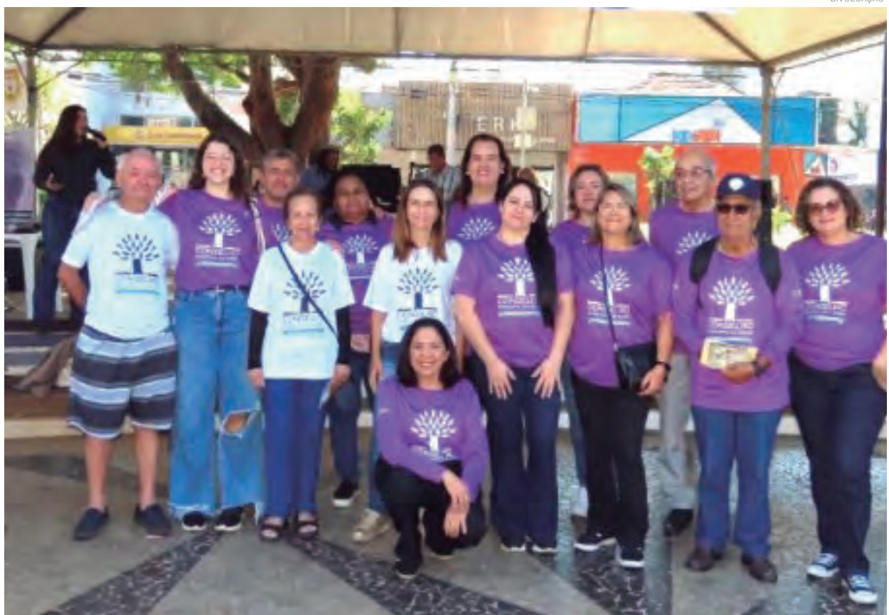
A campanha busca conscientizar a população sobre a necessidade de identificar e prevenir qualquer tipo de violação com pessoas idosas

* Delegacia de Polícia de Pindamonhangaba – rua Antônio Pinto Monteiro, 133, Alto do Cardoso. Telefone: (12) 3642-2299.