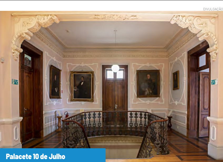
Palacete 10 de Julho