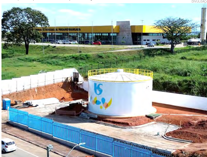
A Sabesp está com investimentos de R$ 20 milhões em obras estruturantes

Implantação de uma moderna Estação de Tratamento de Água ao lado do Rio Paraíba, com tecnologia modular e automatizada, ampliando a capacidade de produção e distribuição de água