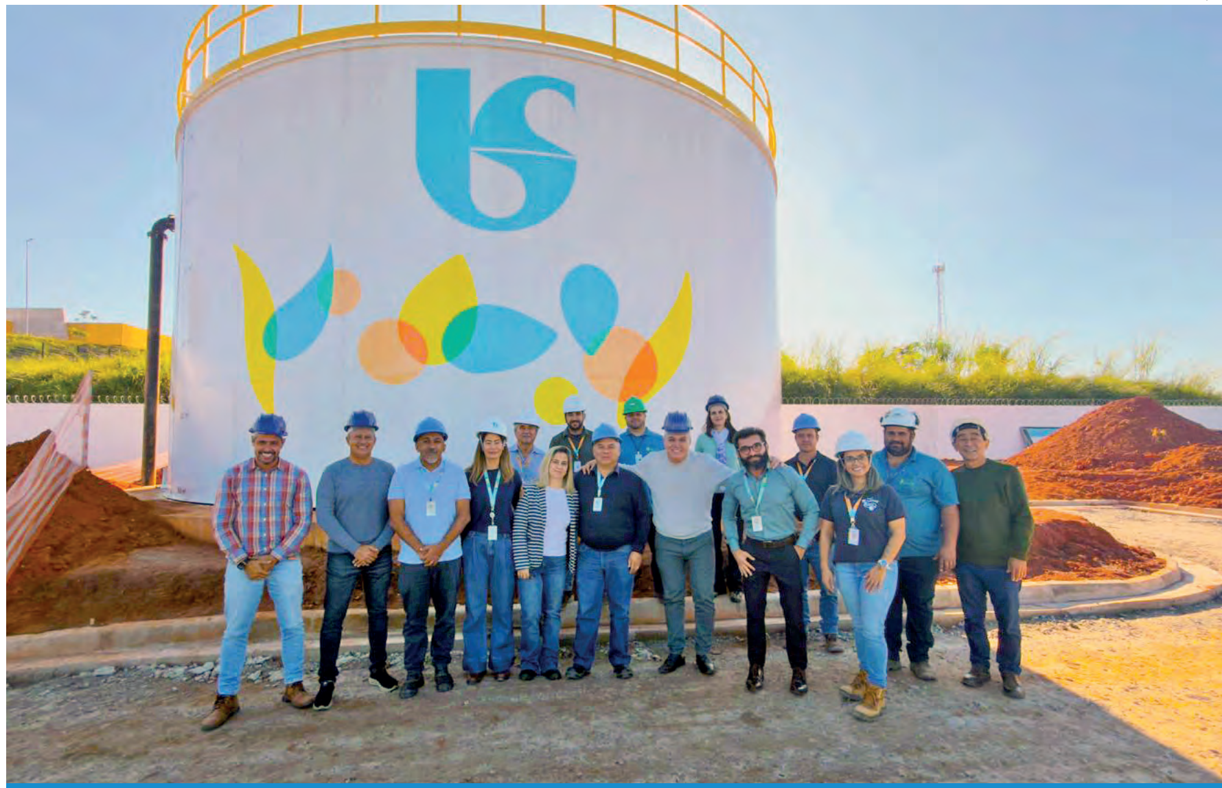
Investimentos em saneamento são essenciais para que Pinda mantenha os indicadores que o colocam entre as cidades com melhor qualidade de vida do país