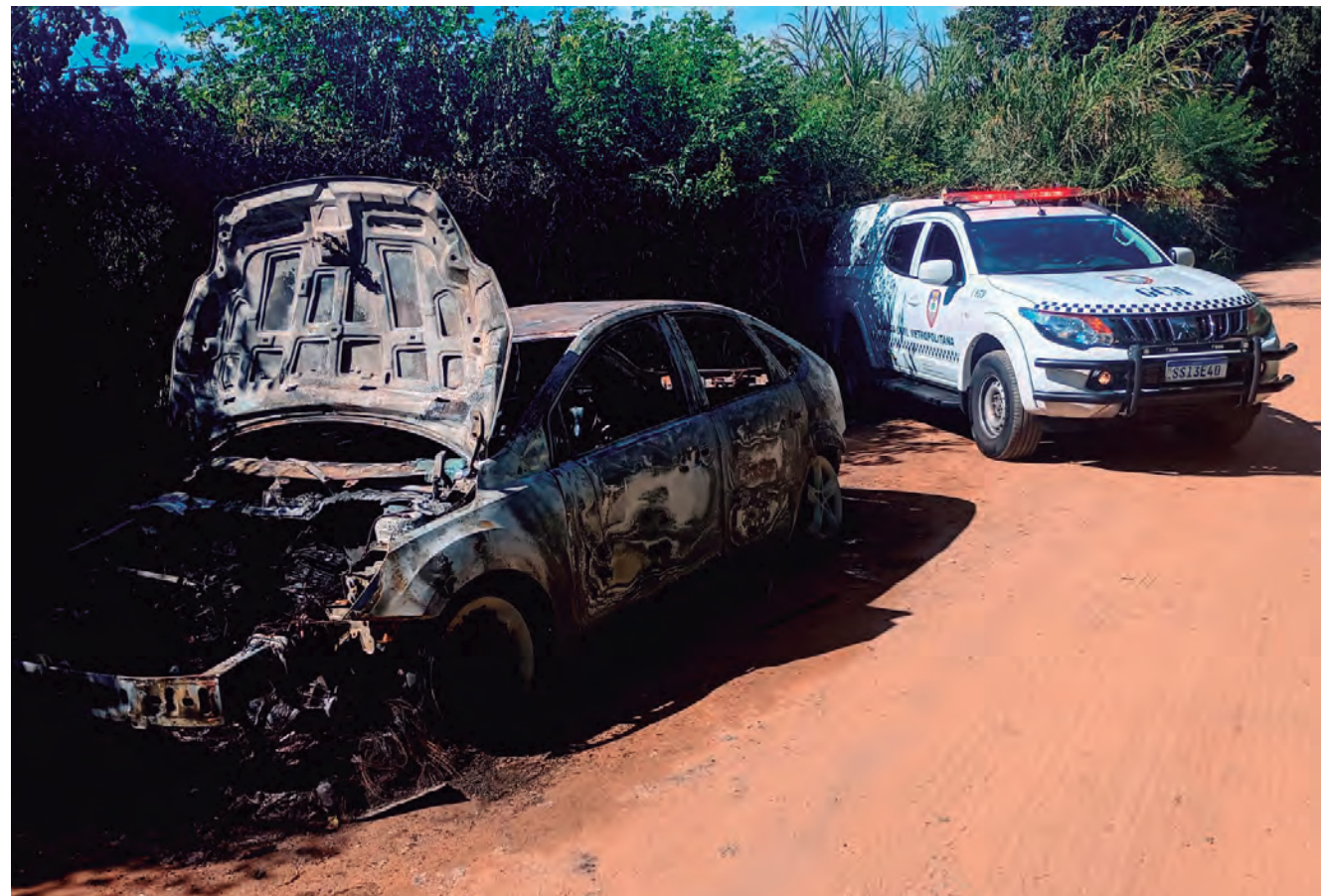
O carro utilizado foi encontrado queimado, às margens da Estrada do Tanque

Corporação encontra veículo envolvido na ocorrência.