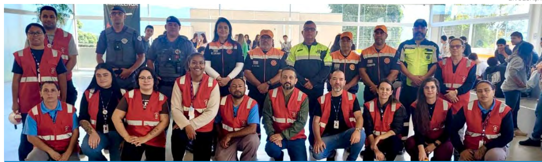
A prática constante desses treinamentos é fundamental para uma resposta adequada em situações reais

fundamental para garantir uma resposta adequada em situações reais. "A realização periódica de simulados é essencial para que a população esteja preparada e saiba como agir diante de uma emergência. Esse tipo de treinamento faz com que as pessoas deixem de agir pelo impulso e passem a seguir procedimentos previamente estabelecidos, aumentando a segurança de todos", afirmou.