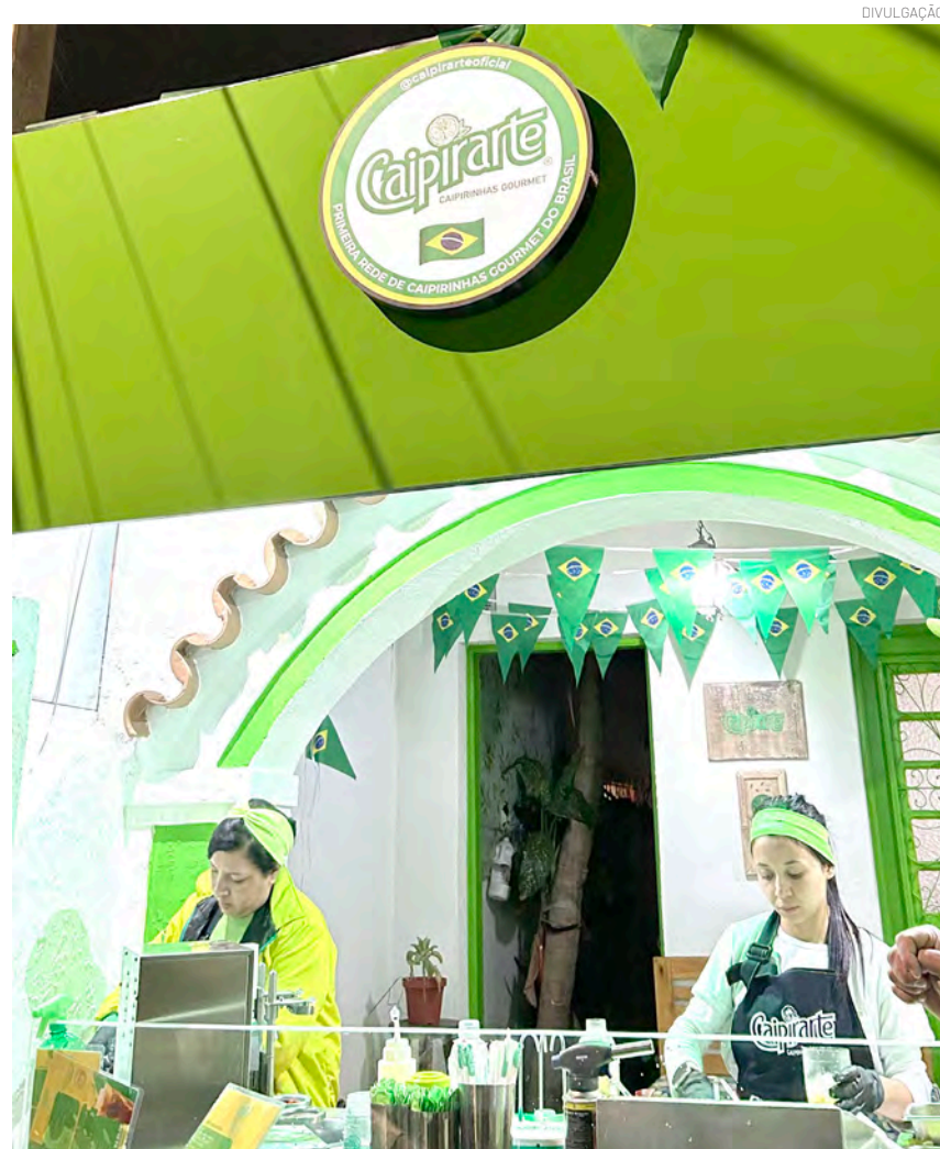
São diversos sabores de caipirinhas tradicionais e também as completamente inovadoras