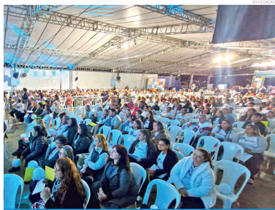
Os alunos aguardaram ansiosos pelos certificados de conclusão dos cursos