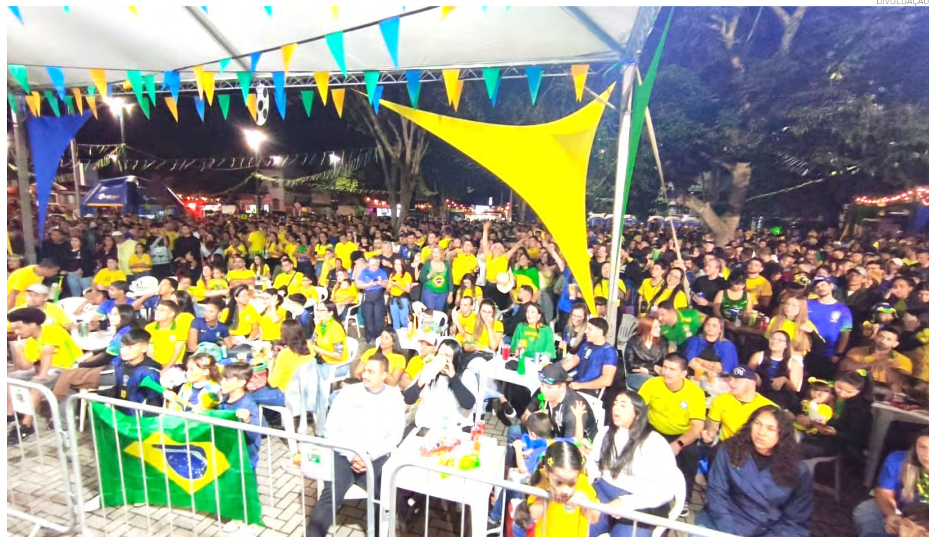
O clima foi de confraternização, valorizando o comércio local

Para o segundo jogo, a organização irá alinhar novas diretrizes e reforçar medidas para manter o evento seguro para todos, como a proibição da venda de bebidas