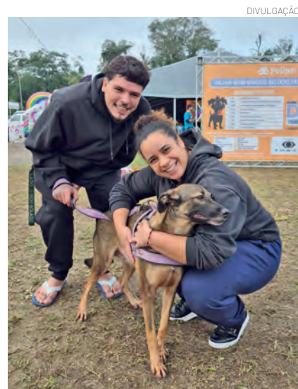
Maura, uma cadelinha do Cepatas, foi adotada no evento

animal: Maura, uma cadelinha do Cepatas, foi adotada durante