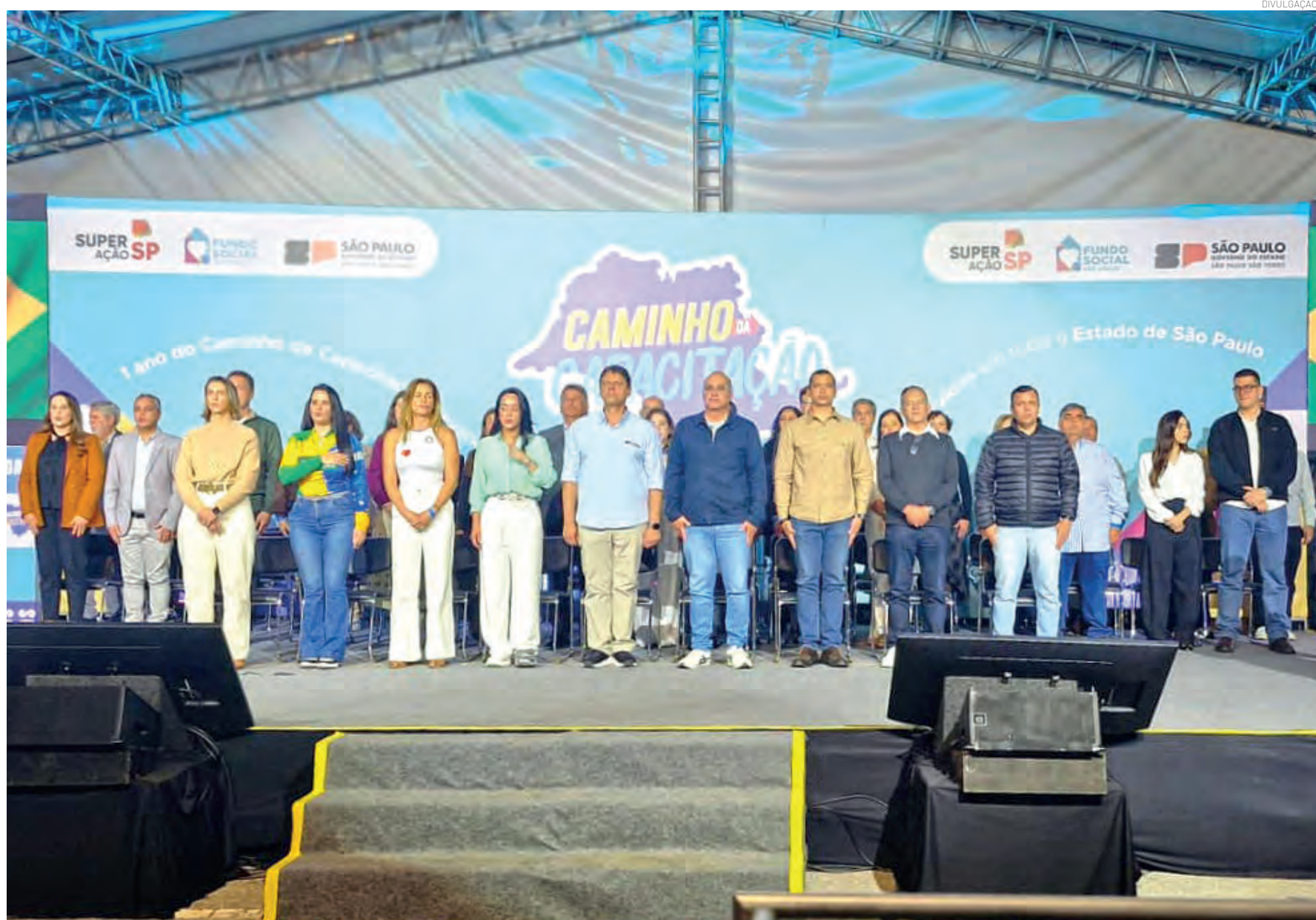
O evento, realizado no Parque da Cidade, reuniu autoridades estaduais e municipais, formandos e representantes de diversos municípios da região