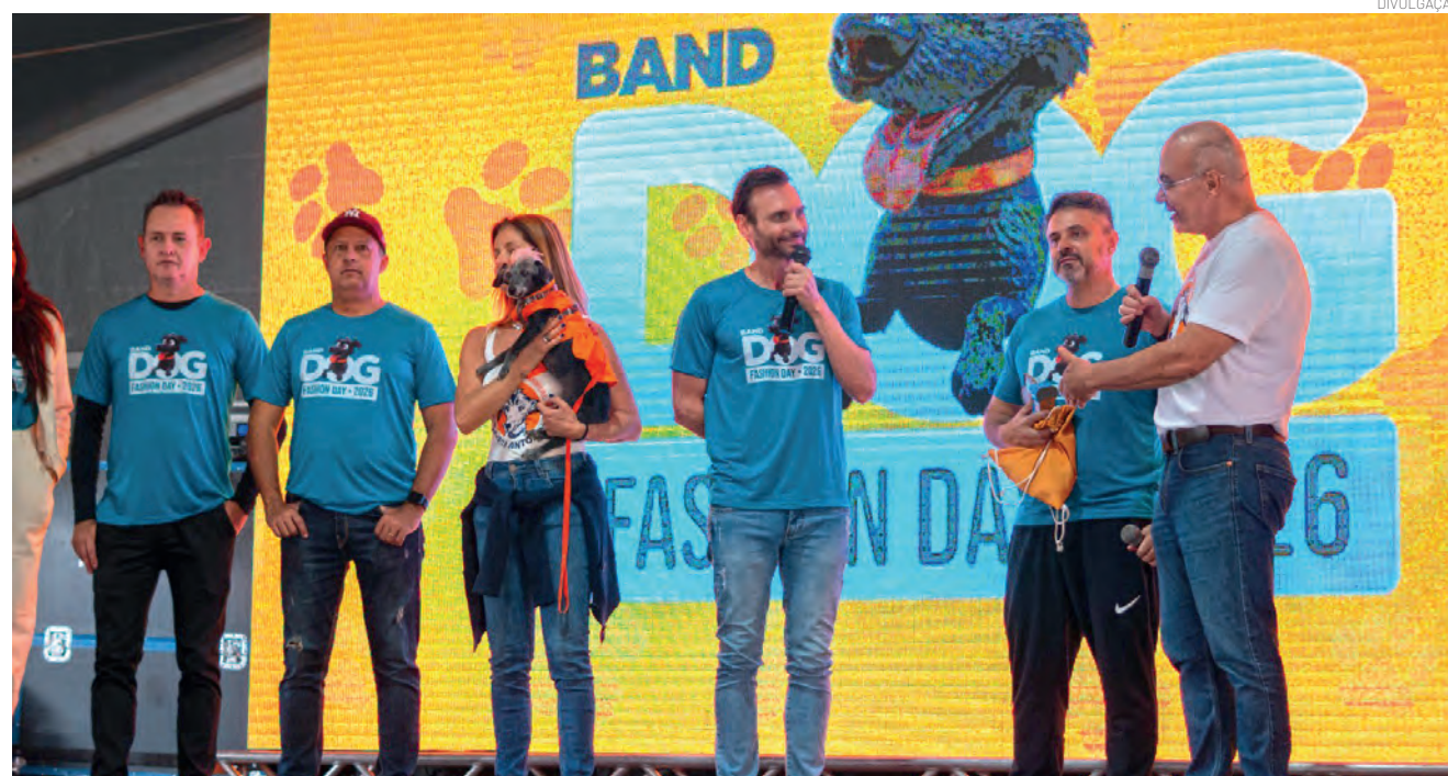
Evento no Parque da Cidade contou com sólida estrutura e a colaboração de cerca de 30 parceiros