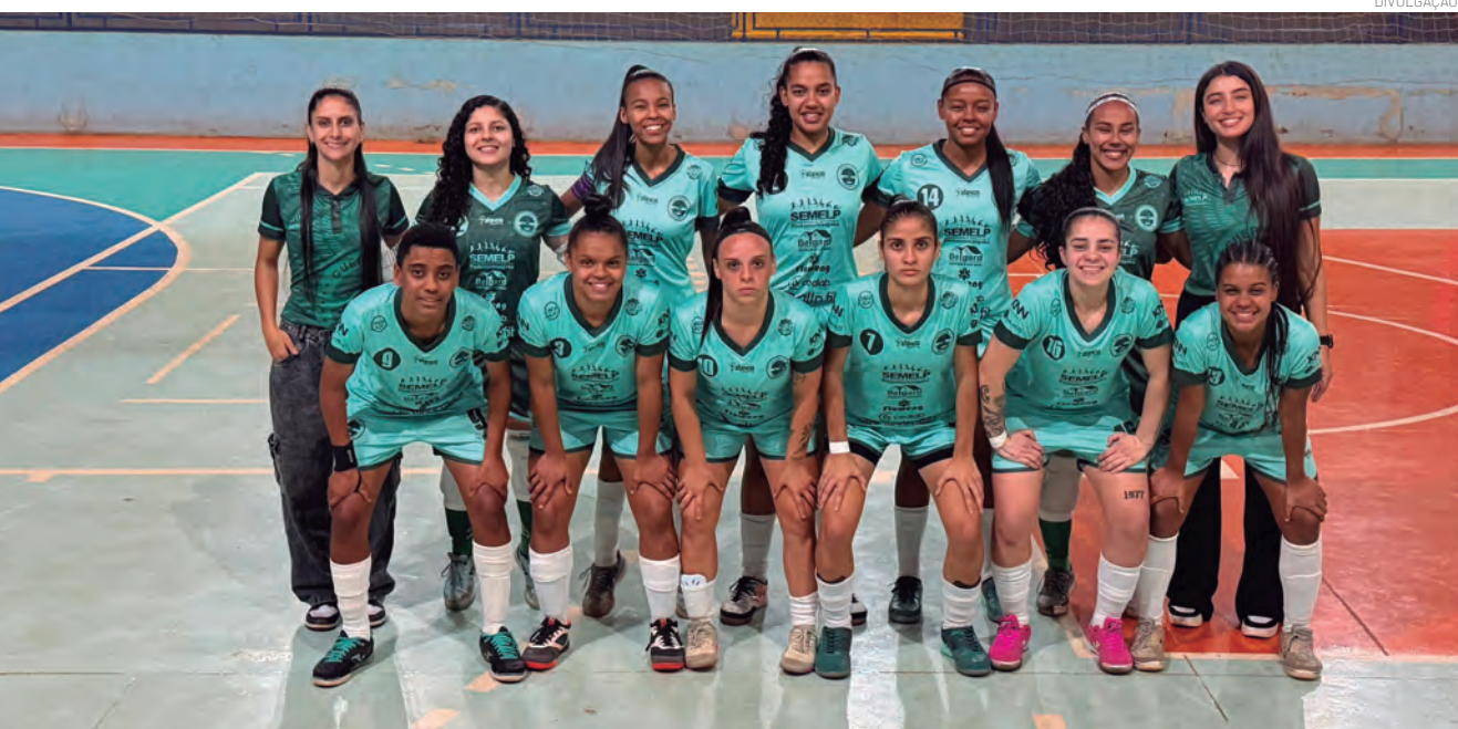
Equipe sub-20 fez grande campanha na competição adulta, enquanto categorias de base venceram todos os confrontos disputados fora de casa

taçou o desempenho das atletas e o comprometimento de toda a equipe. "Esses resultados são fruto de muito trabalho, dedicação e amor pela ginástica rítmica. Cada medalha representa a evolução das nossas atletas e o esforço diário de professoras, comissão técnica e famílias, que caminham conosco em cada conquista. Ver Pindamonhangaba conquistando cinco ouros em uma competição tão importante é motivo de muito orgulho para todos nós", afirmou.