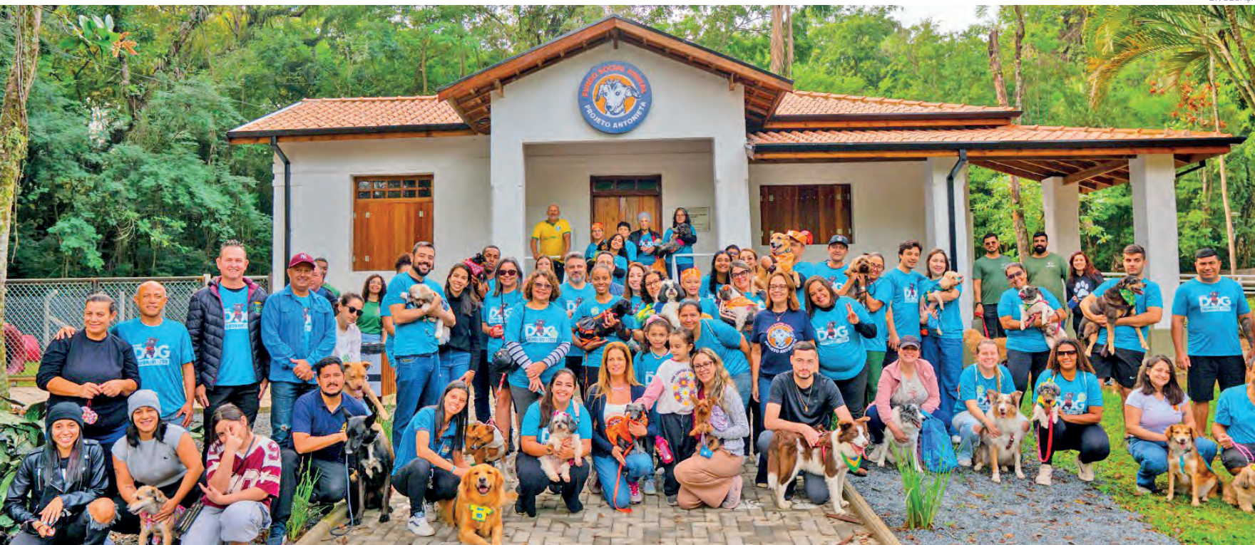
A segunda edição do Dog Fashion Day consolidou o evento como uma das principais ações voltadas para o universo pet em Pindamonhangaba

O prefeito Ricardo Piorino destacou que o sucesso da segunda edição reforça a importância de eventos que aproximam a população dos espaços públicos e fortalecem ações de conscientização. "O Dog Fashion Day é um evento que reúne famílias, valoriza o Parque da Cidade e também leva uma mensagem muito importante sobre cuidado, responsabilidade e respeito aos animais. Ver a participação do público e a mobilização dos parceiros mostra que Pindamonhangaba está no caminho certo, promovendo eventos que unem lazer, solidariedade e cidadania", afirmou o prefeito Ricardo Piorino.