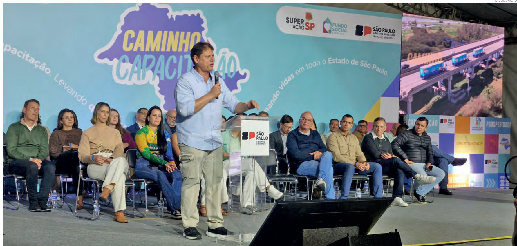
Para o governador Tarcísio de Freitas, o programa acredita no potencial de cada um dos formandos

A cerimônia reforçou a importância da parceria entre Estado e