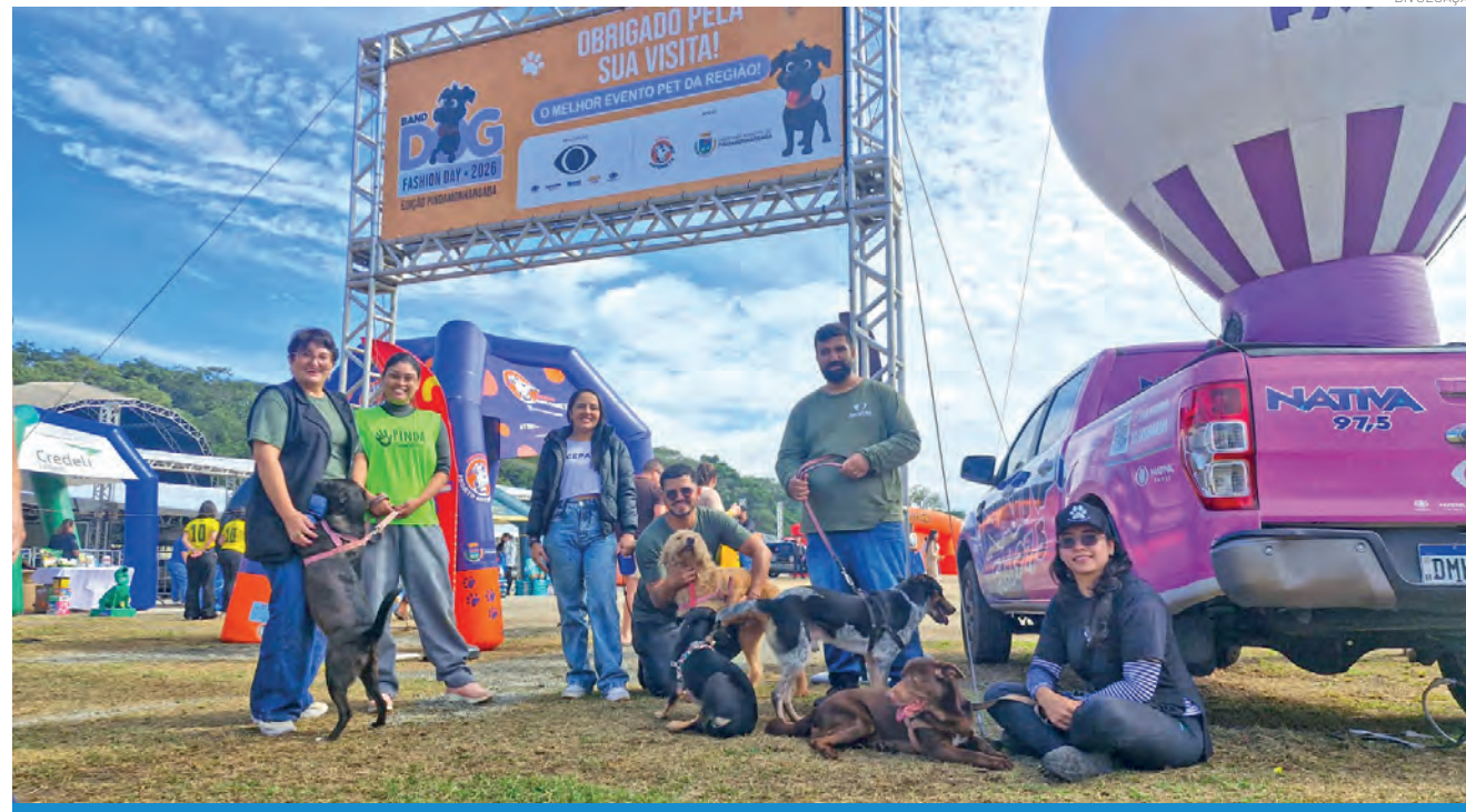
O Dog Fashion Day proporcionou momentos de convivência familiar e valorização da causa animal no último domingo

Além das atrações, o Dog Fashion Day também teve um resultado especial para a causa