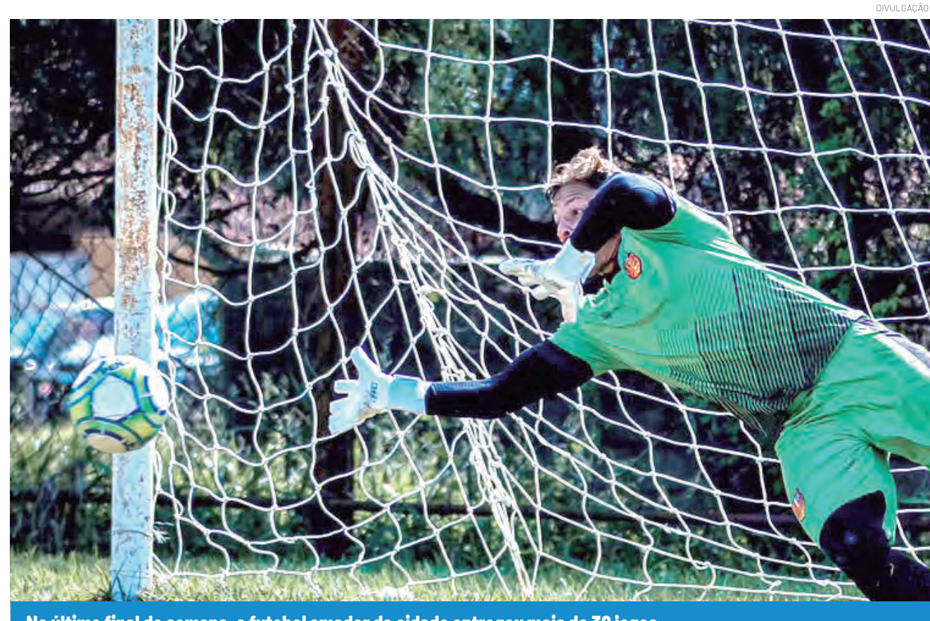
No último final de semana, o futebol amador da cidade entregou mais de 30 jogos

No sábado (13), em jogo único realizado em Marília, as meninas de Pindamonhangaba enfrentaram a equipe adulta da casa em busca de uma vaga na decisão.