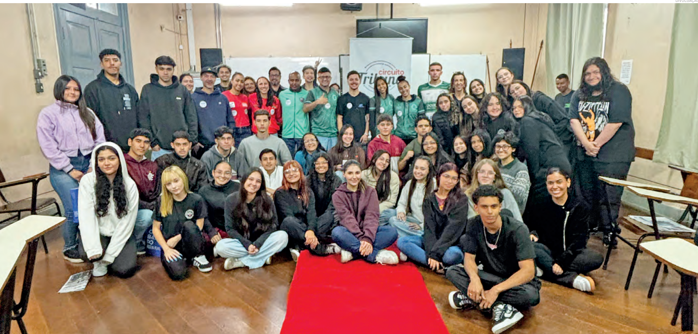
Equipe da Tribuna do Norte, representantes da direção da EE Dr Alfredo Pujol e da Diretoria Regional de Ensino, e convidados para a conversa com os estudantes da escola