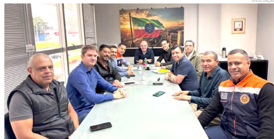
Durante o encontro foram tratadas demandas importantes para a cidade

O pedido de um caminhão-pipa também foi destacado como uma importante demanda para o município, contribuindo para ações da Defesa Civil, atendimento em situações