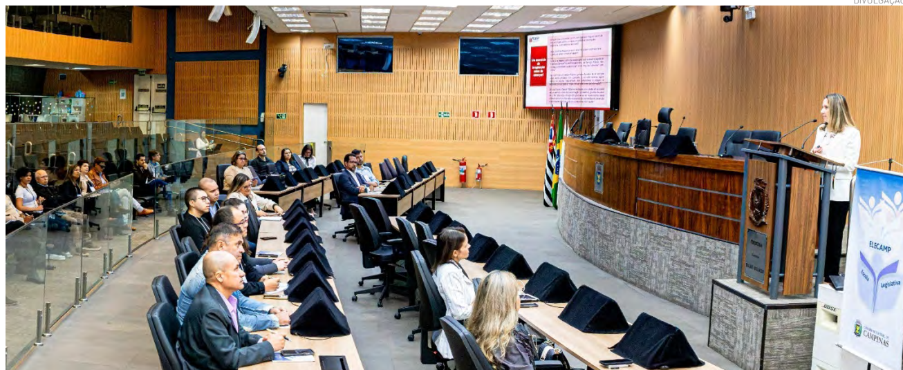
Durante o seminário, a transparência foi destacada como um dos pilares para o fortalecimento das instituições públicas