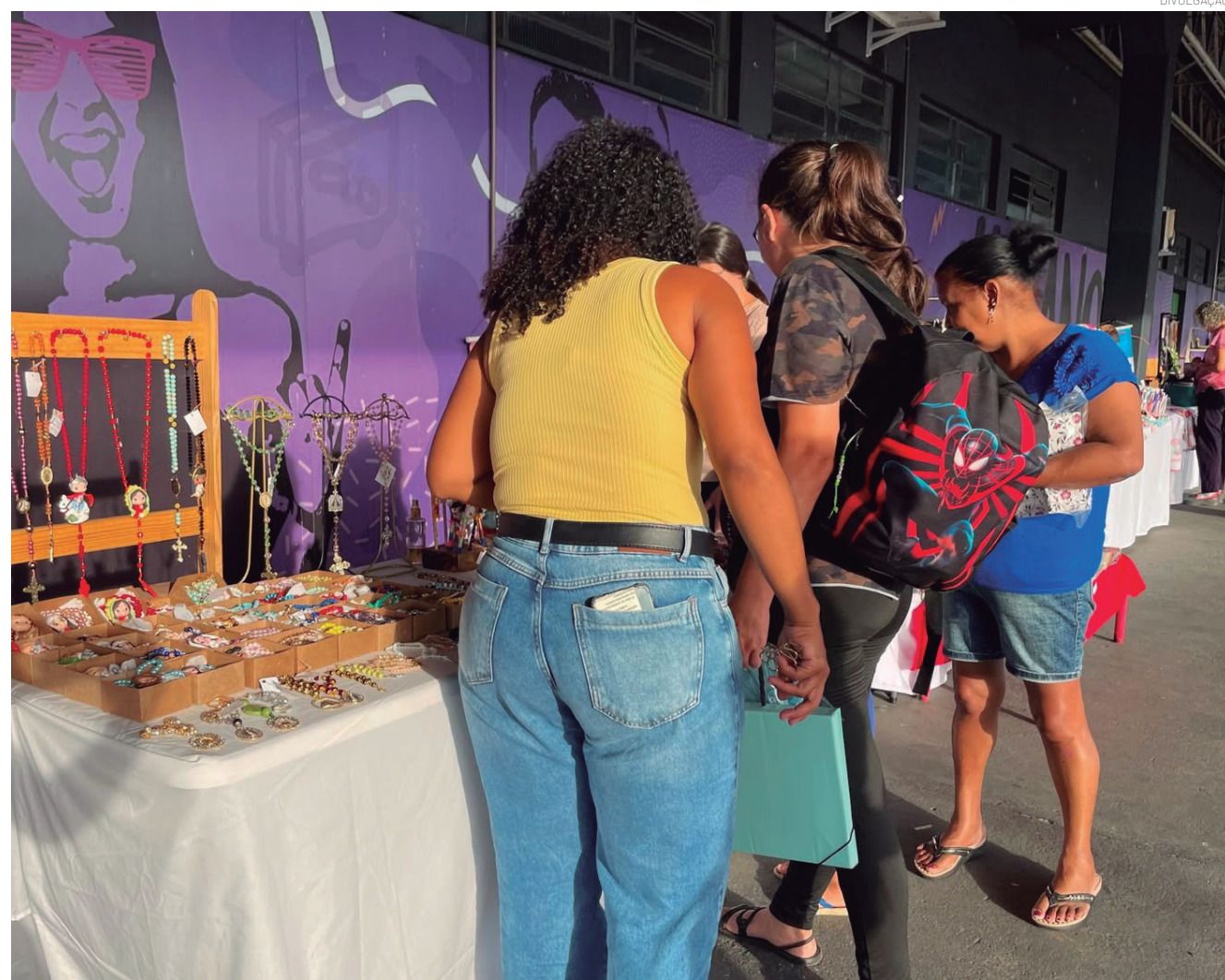
A feira vai reunir produtos, serviços e iniciativa desenvolvidas por mulheres empreendedoras do município

Evento acontece no dia 12 de junho, no Espaço Humano, com palestra sobre conscientização e combate à violência contra a pessoa idosa