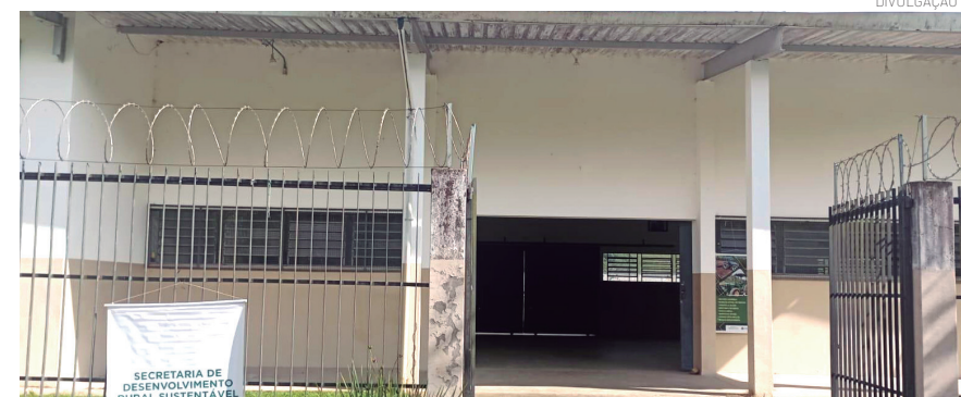
O Ponto Rural oferece suporte em diversas áreas e contribui para reduzir a burocracia

Programa da Secretaria de Desenvolvimento Rural Sustentável e Clima leva serviços diretamente às comunidades rurais e orienta produtores sobre a atualização do rebanho, que segue até 14 de junho