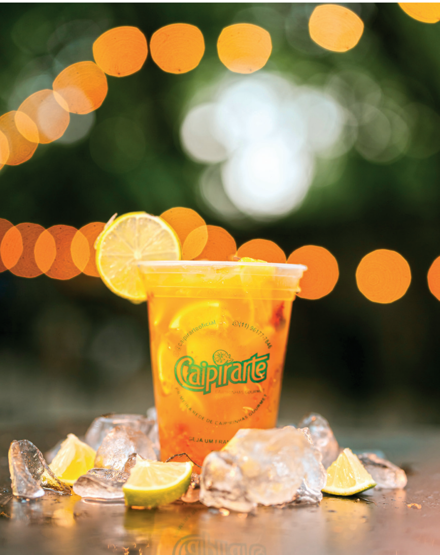
Inauguração da CaipirArte acontece no dia 11 de junho, às 18 horas