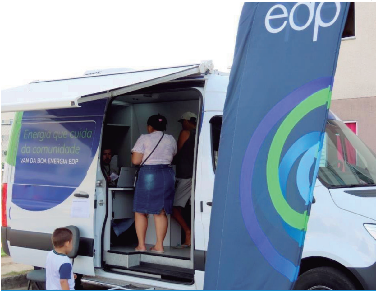
A Van leva serviços essenciais de forma itinerante

A Prefeitura orienta os interessados a aproveitarem a presença da unidade móvel para esclarecer dúvidas e resolver pendências sem a necessidade de deslocamento para outras regiões.