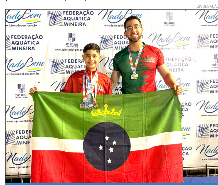
A competiçã reuniu 648 atletas de diversos estados do Brasil

esses jovens. Ver Pindamonhangaba se destacar em uma competiçã nacional tão importante nos enche de orgulho e reforça que estamos no caminho certo, investindo na formaçã esportiva e no desenvolvimento de novos talentos", destacou.