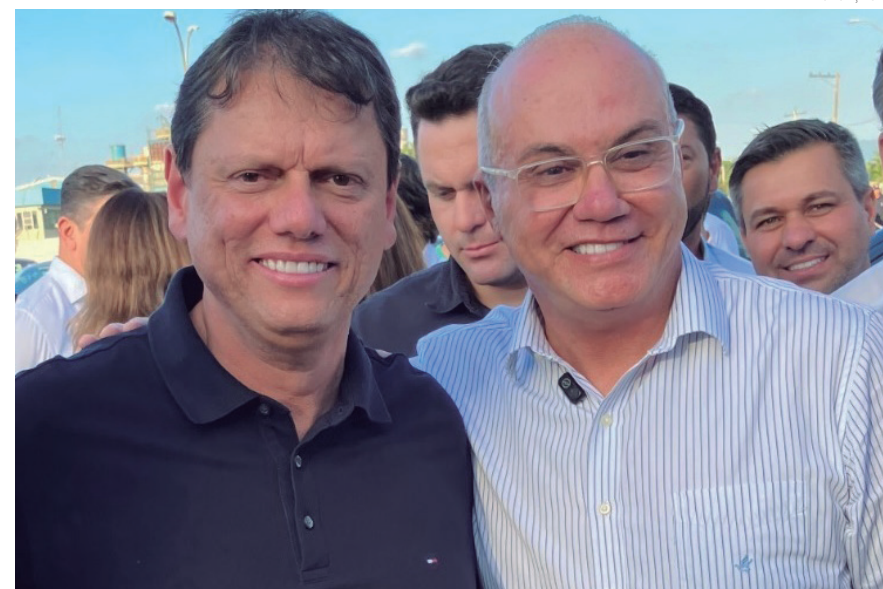
O evento será um momento de reconhecimento aos alunos que concluíram sua formação