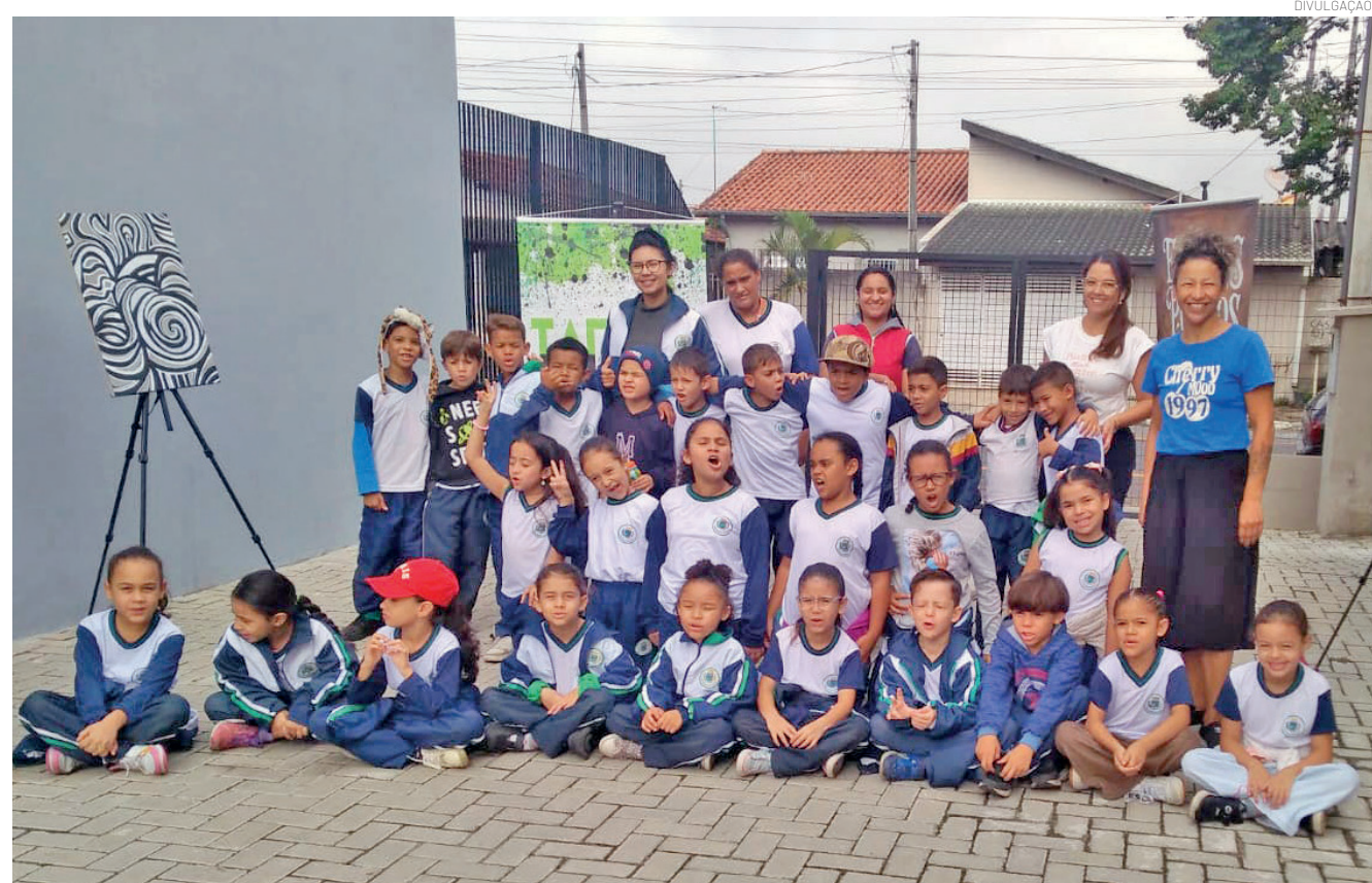
Projeto desenvolveu atividades voltadas à literatura, inclusão e incentivo à leitura durante o mês de maio