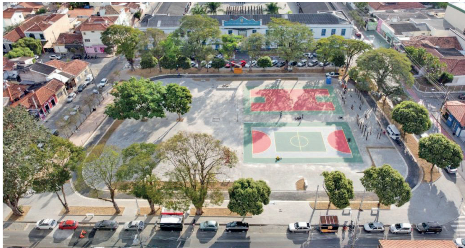
Praça do Quartel contará com telão de alta definição e sistema de som para acompanhar a Seleção contra Marrocos neste sábado (13), às 19 horas

Para garantir a segurança e a organização do evento, a Secre-