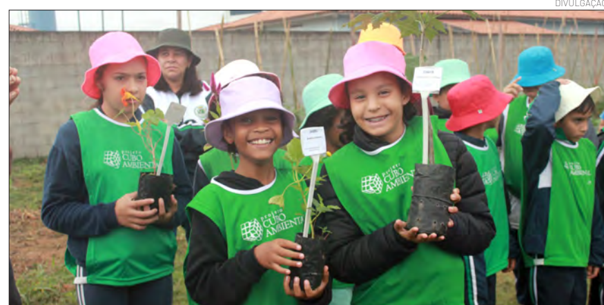
A participação das crianças é muito importante