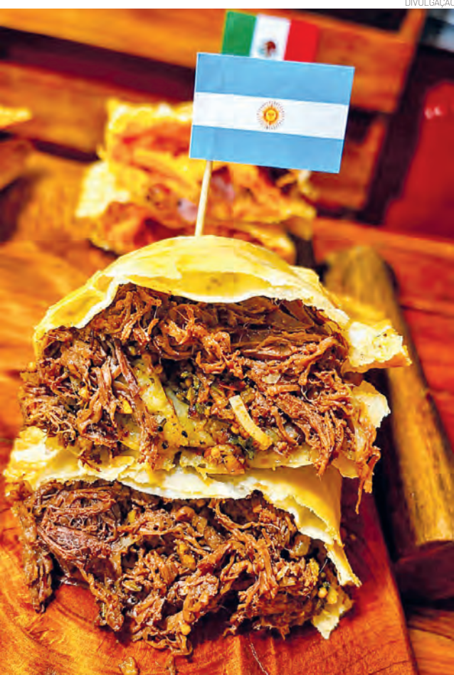
O pastel Argentina traz uma combinação de costela desfiada, queijo provolone e chimichurri

E a experiência no Cantinho do Pastel vai além da comida. O clima de Copa tomou conta do local, que viralizou nas redes sociais nos últimos dias, após pintar a rua em frente especialmente para a Copa. E mais uma novidade é que os donos estão preparando uma programação especial para os dias de jogos do Brasil.