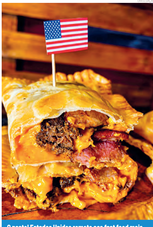
O pastel Estados Unidos remete aos fast food mais famosos do mundo, com cheddar cremoso, carne gourmet, picles e bacon