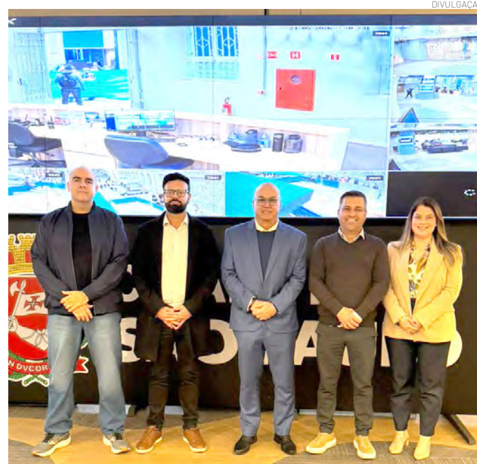
O Smart Pinda vai ampliar o número de câmeras e diversas soluções integradas para modernizar a gestão pública

"O Smart Pinda nasce com uma visão moderna e estratégica, conectando inovação, inteligência