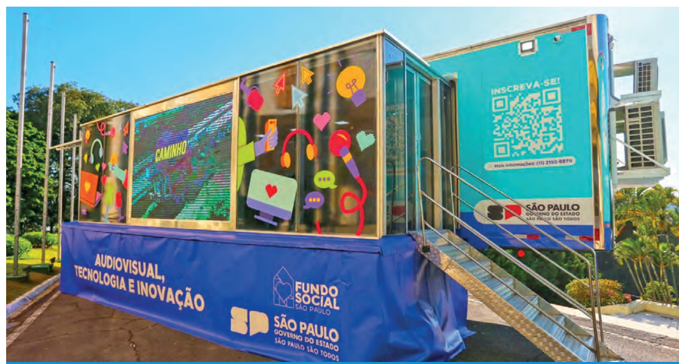
O programa Caminho da Capacitação leva cursos a diversos municípios paulistas por meio de carretas adaptadas