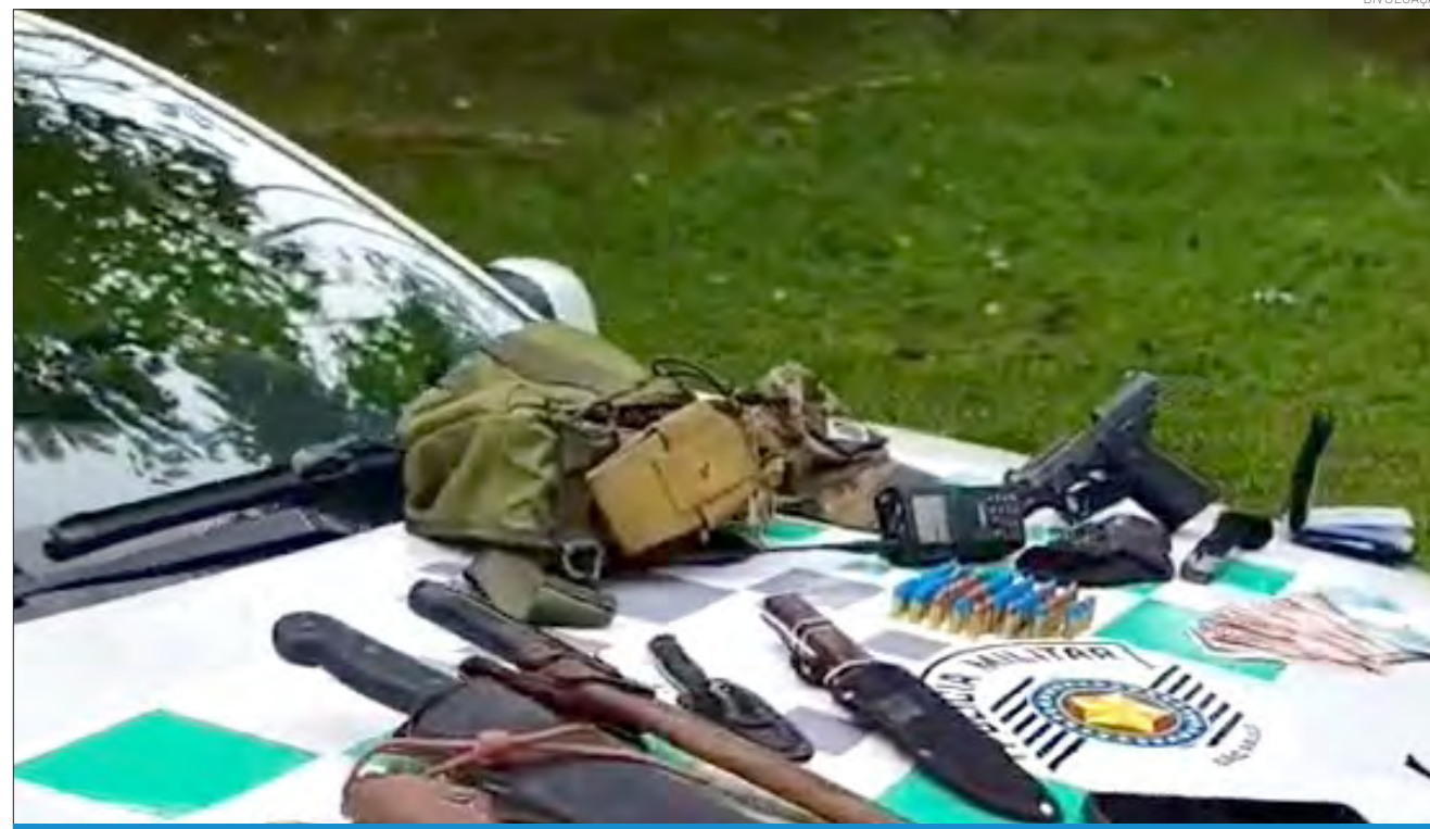
Itens encontrados durante a fiscalização

Com o segundo abordado, foram localizados facão, facas de caça, equipamentos de acampamento, perneiras, materiais para produção de fogo e um rádio comunicador. Questionados, os ho-