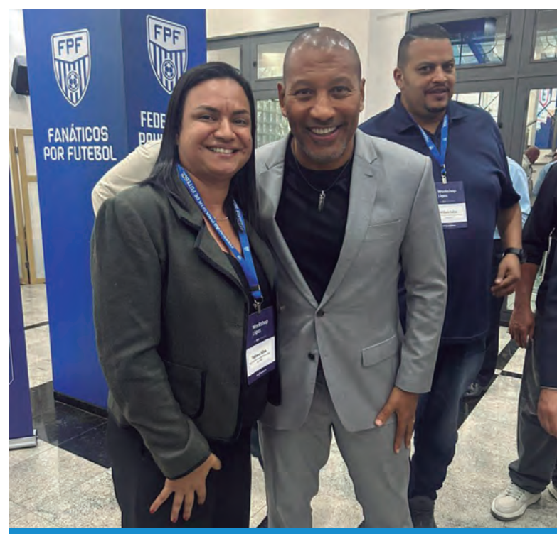
O evento reuniu experiências e aproximou as ligas amadoras

A ideia do Workshop é reunir experiências e aproximar as ligas amadoras da estrutura profissional do futebol paulista, debatendo temas como: organização e gestão de campeonatos amadores, arbitragem e atualização das regras, registro de atletas e documentação, entre muitos outros assuntos, com uma liga ajudando a outra, havendo uma grande troca de conhecimentos.