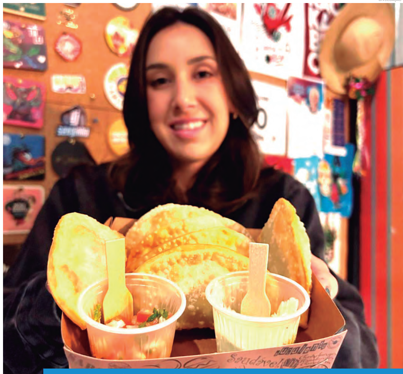
A proposta cria novos roteiros dentro do município, incentivando o consumo local

A programação completa do Festival BBB pode ser acompanhada pelos canais oficiais da Prefeitura de Pindamonhangaba.