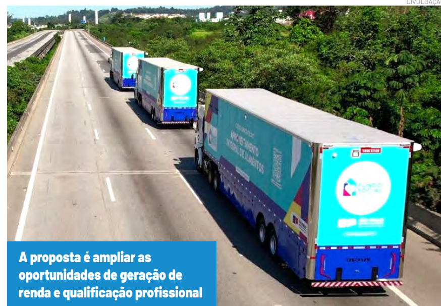
A proposta é ampliar as oportunidades de geração de renda e qualificação profissional

O programa Caminho da Capacitação é uma iniciativa do Fundo Social de São Paulo que leva cursos gratuitos e profissionalizantes a diversos municípios paulistas por meio de carretas adaptadas como salas de aula itinerantes. A proposta é ampliar as oportunidades de geração de renda, empregabili-