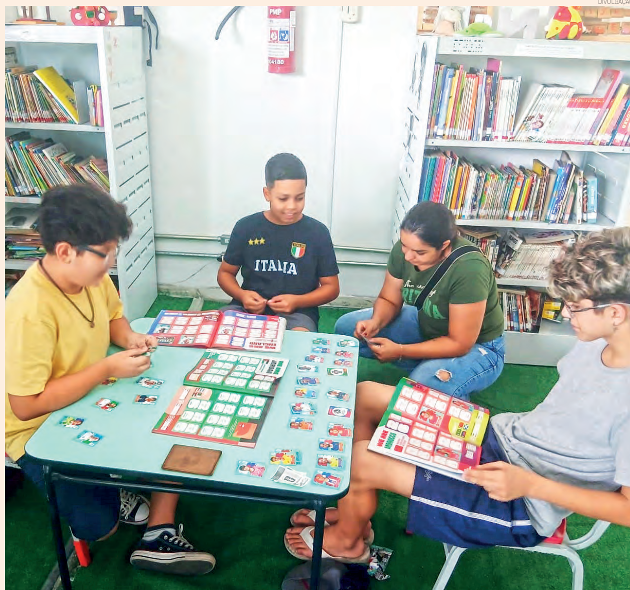
Além dos encontros na biblioteca, haverá o 'Super Troca de Figurinhas da Copa' na praça Monsenhor Marcondes

A participação é gratuita e aberta ao público. Para entrar em campo nessa brincadeira, basta levar o álbum, as figurinhas repetidas e a torcida para conseguir encontrar aquela peça que falta para completar a coleção.