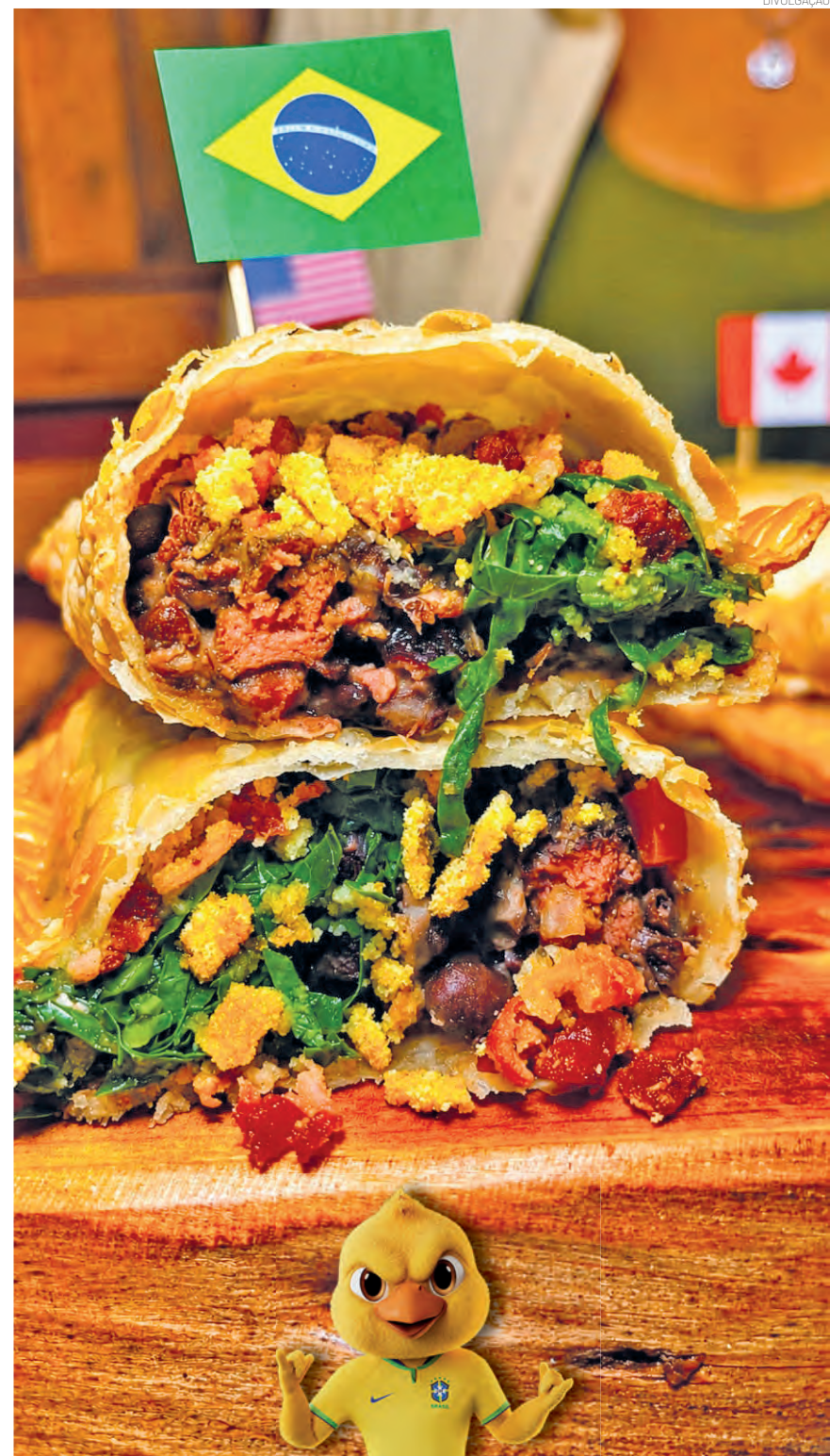
O pastel Brasil leva feijoada, vinagrete, couve refogada e farofa de milho