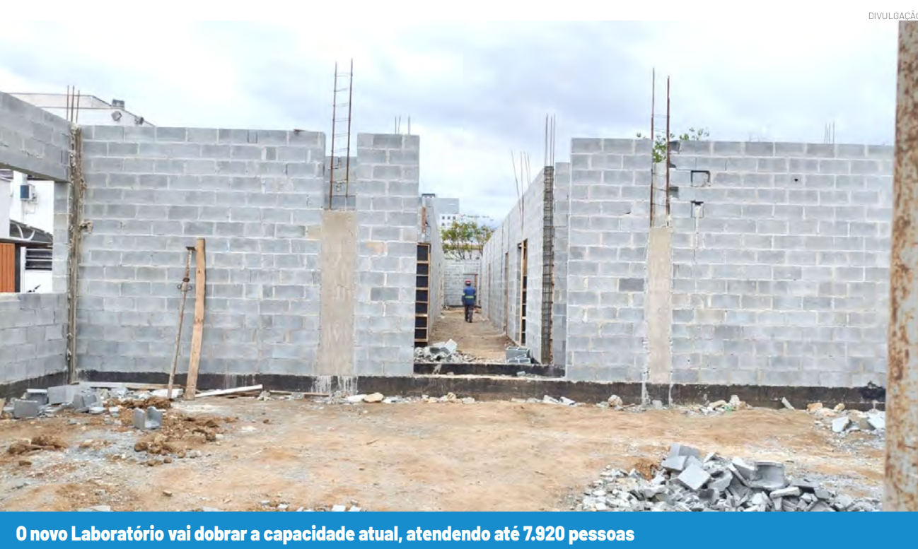
O novo Laboratório vai dobrar a capacidade atual, atendendo até 7.920 pessoas

Inspirado nas melhores práticas das grandes capitais, mas adaptado à realidade local, o Smart Pinda pretende transformar Pindamonhangaba em referência nacional em inteligência urbana, conectividade e segurança pública.