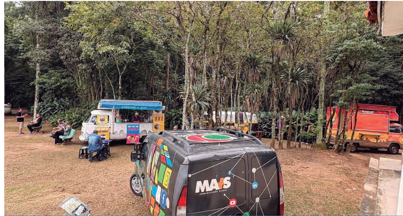
O Parque da Cidade recebeu atrações para diferentes idades, fortalecendo a ocupação do espaço

Programação contou com Feira de Vinil, atividades recreativas, esportivas e apresentação de DJs no Café Literário