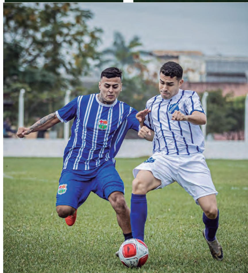
Muitos jogos movimentam os campos de Pinda