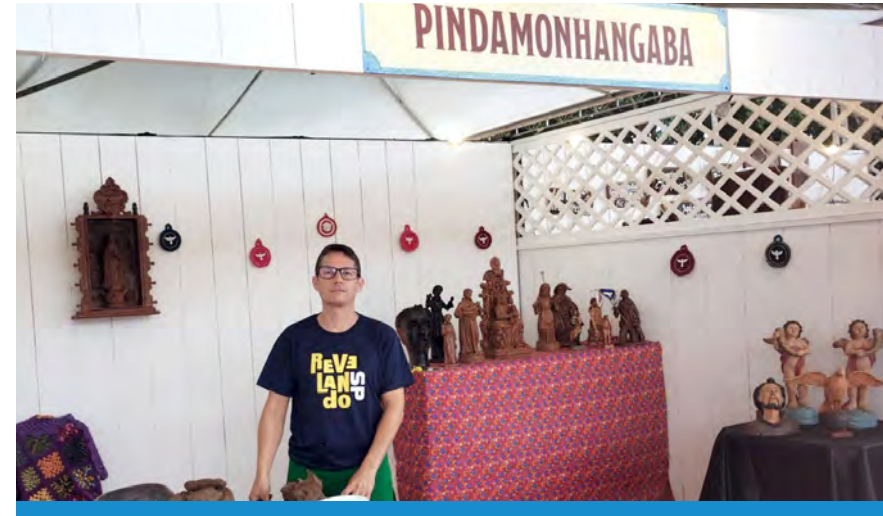
A participação do município mostra que Pinda faz parte do circuito cultural do festival

Para os interessados em conhecer e acompanhar as atividades, a Casa Patchô fica na rua Ignácio Henrique Romeiro, 16, no bairro Chácara Galega, em Pindamonhangaba. A programação completa do projeto “Patchô – Casa de Criar” é divulgada no Instagram @casa.patcho.