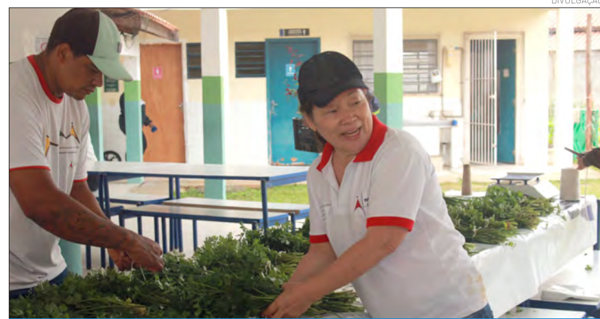
A ação busca a conscientização ambiental dos estudantes

ticipação ativa dos alunos. Algumas crianças relataram inclusive, o desejo de cultivar plantas em suas próprias casa após a experiência vivenciada na escola.