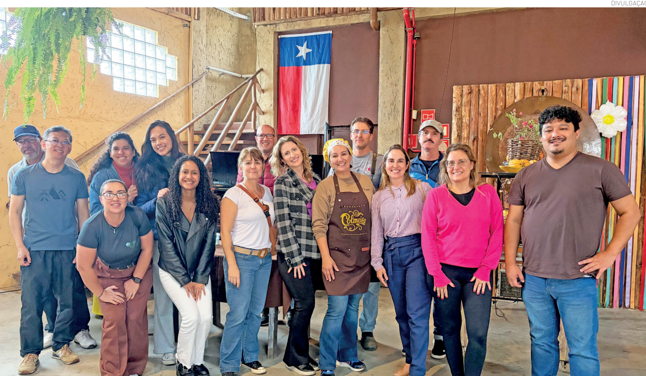
Grupo de jornalistas, influenciadores digitais e agentes do setor turístico visitaram o Restaurante Colmeia