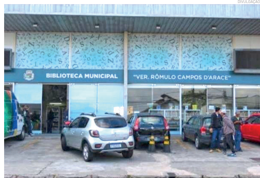
Voltado para crianças e jovens, projeto mostra conceitos de educação financeira de forma acessível, dinâmica e adaptada ao público

A atividade é gratuita e integrada a programação cultural e educativa promovida no município.