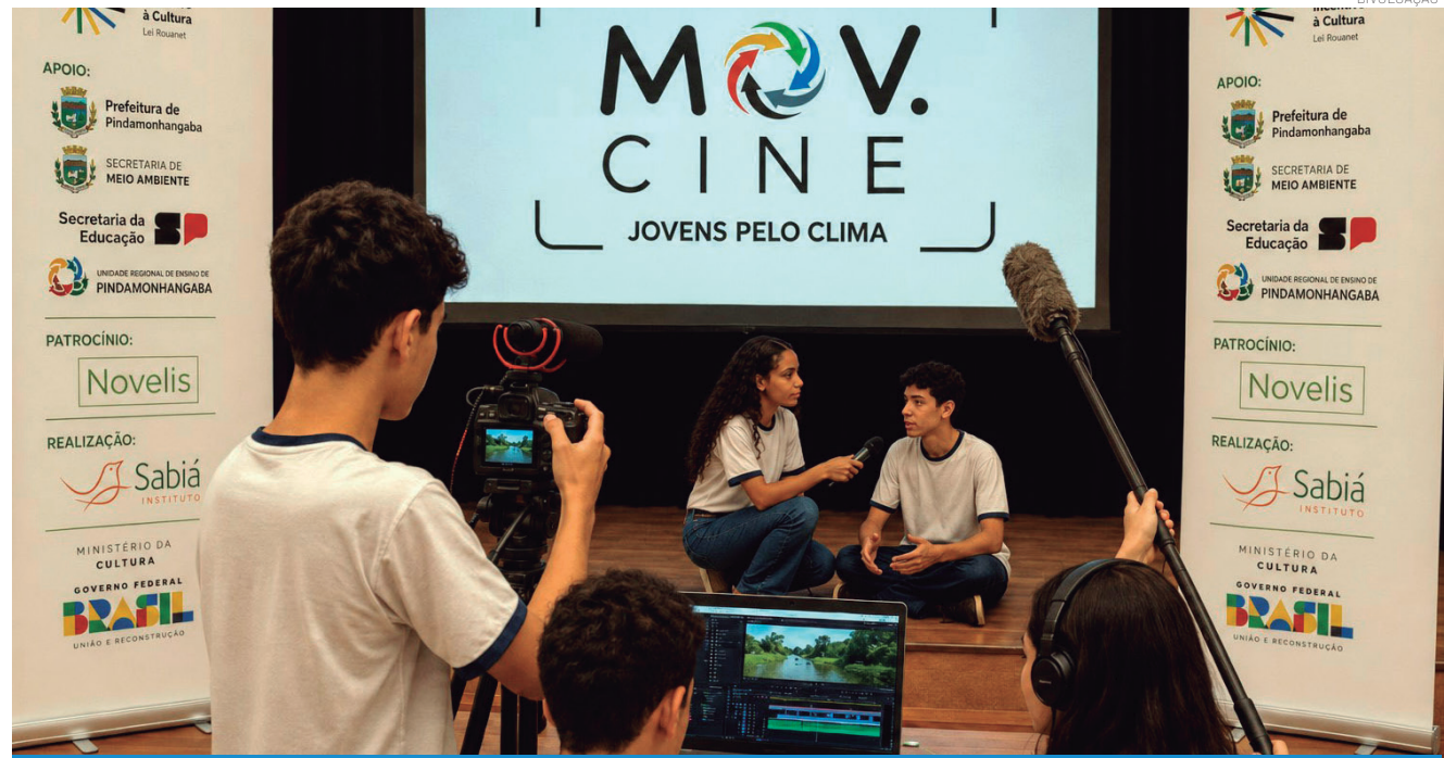
O projeto contempla oficinas com educadores da rede estadual, agentes comunitários e o Conselho da Juventude local