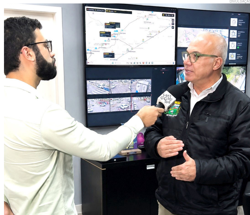
Pindamonhangaba disparou no ranking e lidera no Vale do Paraíba

As ações voltadas à saúde mental, prevenção ao suicídio, inclusão social, proteção às minorias e preservação ambiental também aparecem entre os fatores analisados pelo levantamento nacional.