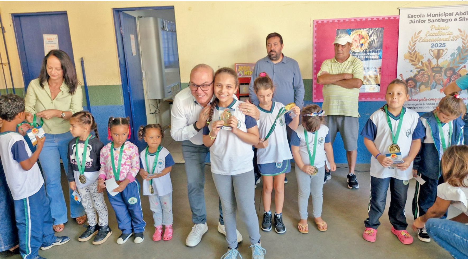
Um dos indicadores nos quais Pindamonhangaba aparece bem avaliada no ranking nacional é o da Educação, onde se destaca a baixa evasão escolar

educação, saúde, segurança, saneamento, meio ambiente, acesso à cultura, direitos sociais e oportunidades. PÁG.5