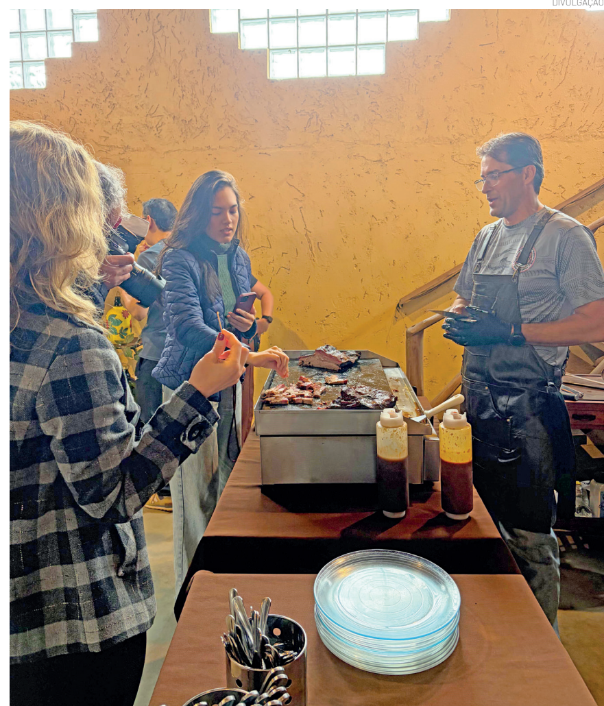
Restaurante se destaca na tradicional cozinha caipira

Além do Colmeia, a Massaropi Pizzas, em Pindamonhangaba, que é parada de peregrinos a caminho de Aparecida também faz parte da rota.