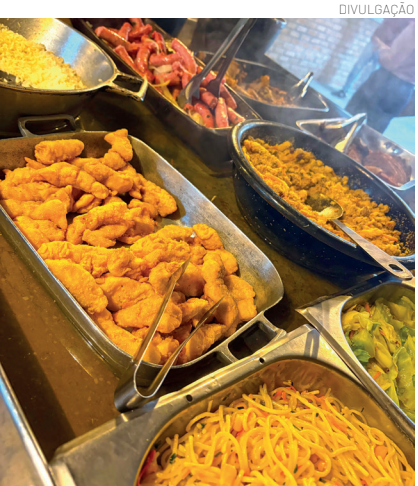
A participação coloca Pindamonhangaba dentro das rotas turísticas Mantiqueira Paulista e Rios do Vale