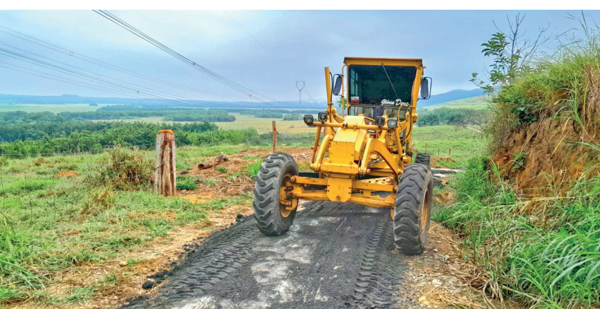
Ações incluem recuperação de vias, limpeza de drenagem e melhorias para facilitar o transporte e a segurança nas áreas rurais

diversas estradas rurais, aproveitando o período de estiagem e menor volume de chuvas. PÁG.3