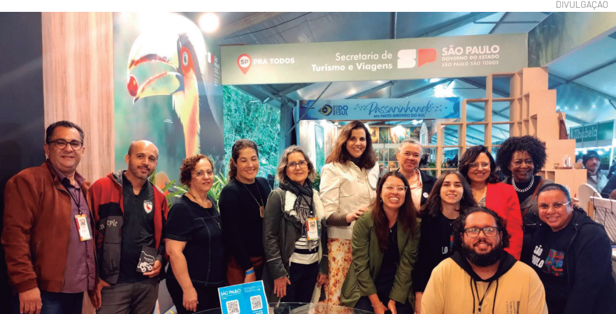
A participação reforça o trabalho desenvolvido para ampliar o potencial turístico local

reúne pesquisadores, guias, fotógrafos, operadores turísticos e amantes da natureza em uma grande rede de troca de conhecimento, debates sobre conservação ambiental e desenvolvimento do turismo de observação de aves, conhecido internacionalmente como birdwatching.