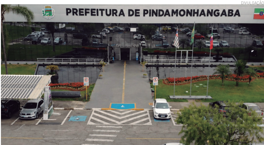
Sede da Prefeitura

O programa também prevê a criação do Selo Feito em Pinda, dividido em níveis Bronze, Prata e Ouro, conforme critérios de formalização, sustentabilidade e impacto local.