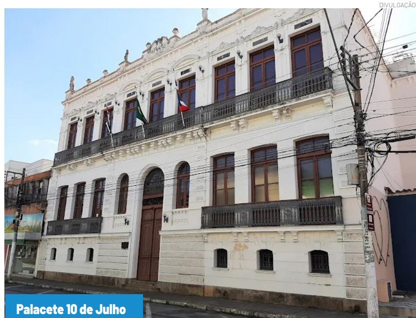
Palacete 10 de Julho

A previsão é que o processo de revisão do Plano Diretor de Turismo seja concluído até novembro de 2026. A expectativa é reunir representantes do poder público, empresários, profissionais do turismo e moradores interessados em contribuir com o futuro do setor em Pindamonhangaba.