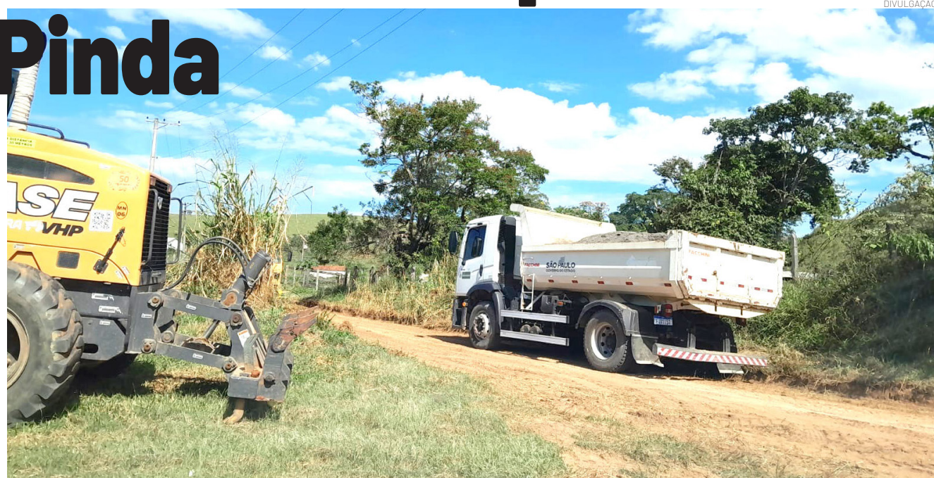
Os trabalhos de recuperação e melhorias nas vias são intensificados aproveitando o período de estiagem

As intervenções têm como objetivo garantir melhores condições de trafegabilidade para moradores e produtores rurais, contribuindo diretamente para o escoamento da produção agrícola, transporte escolar, circulação de caminhões de leite e desloca-