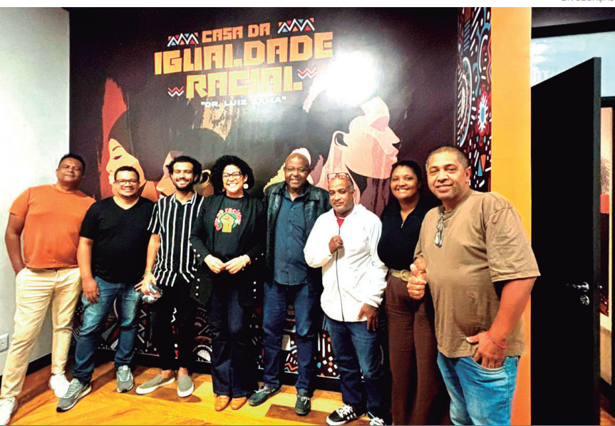
O encontro foi um momento de diálogo, aprendizado e troca de experiências

Ação fortaleceu reflexões sobre combate ao racismo, diversidade e promoção da equidade racial