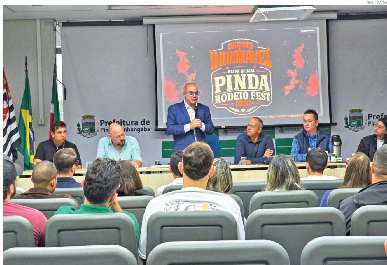
Os encontros tiveram como objetivo apresentar o projeto deste ano a diferentes setores da cidade

Encontros reuniram secretários municipais, influenciadores digitais e empresários para destacar o potencial do evento PÁG.7