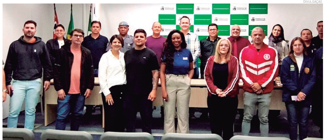
A Prefeitura apoia a iniciativa, com a segurança necessária para as pessoas que estarão assistindo os jogos

Durante o encontro foram tratadas de normas de segurança e de fiscalização no local, para garantir tranquilidade e segurança