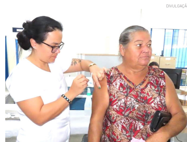
Educação, saúde e segurança consagram Pinda como a melhor cidade do Vale no IPS