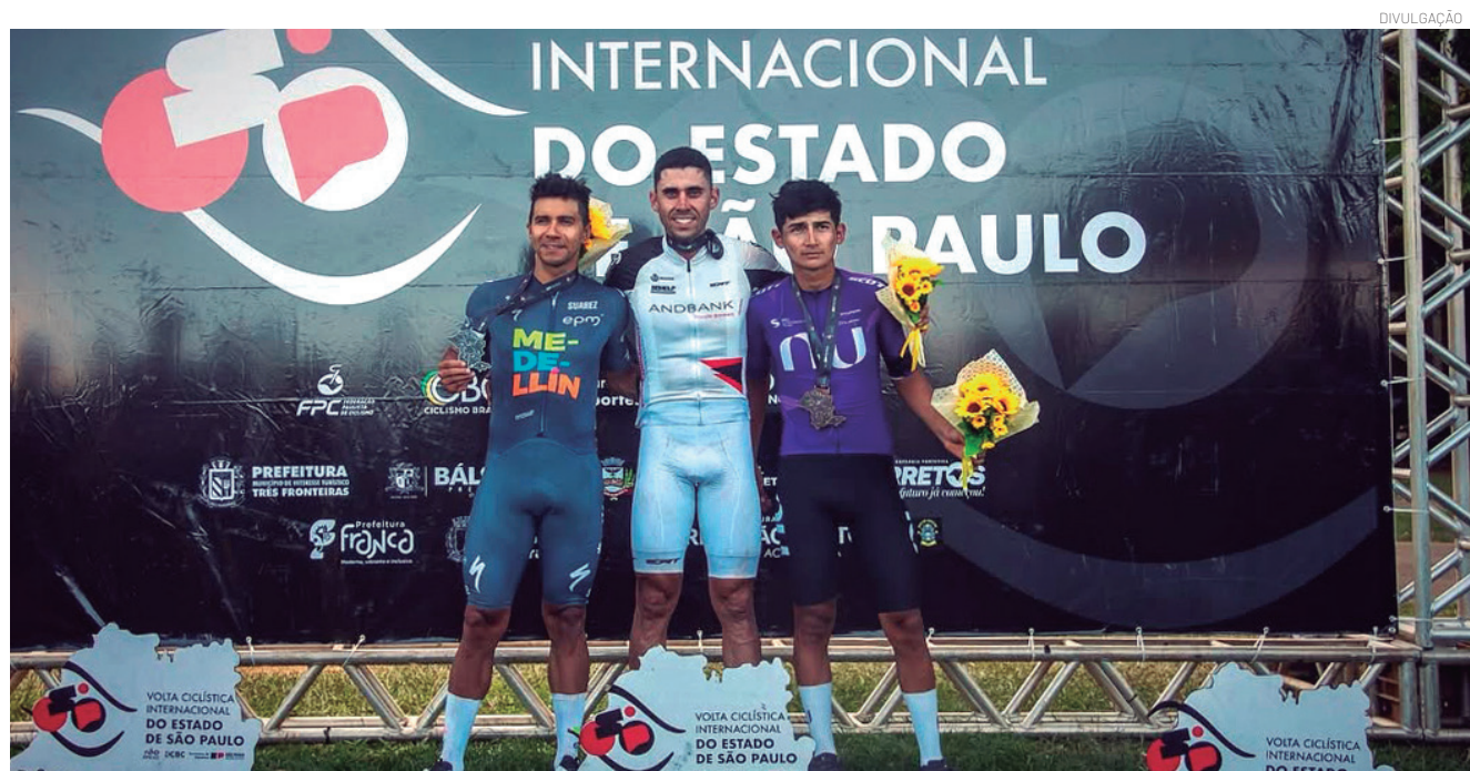
Com um importante resultado, a equipe segue se preparando para as próximas competições

A equipe agora segue sua preparação para as próximas competições da temporada, mantendo Pindamonhangaba entre os grandes destaques do ciclismo nacional e internacional.