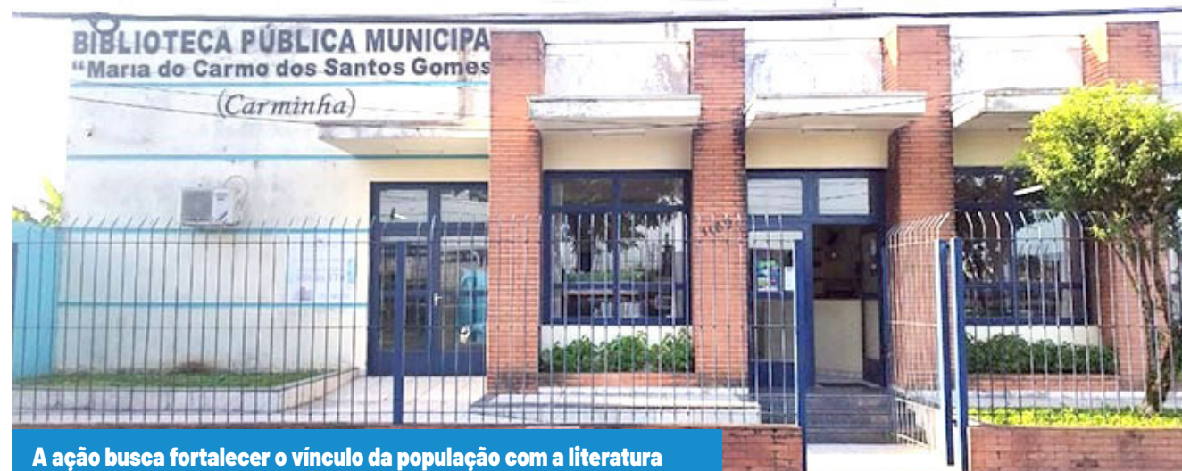
A ação busca fortalecer o vínculo da população com a literatura

O evento é gratuito e aberto ao público.