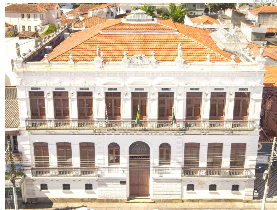
Palacete 10 de Julho, onde acontece o encontro