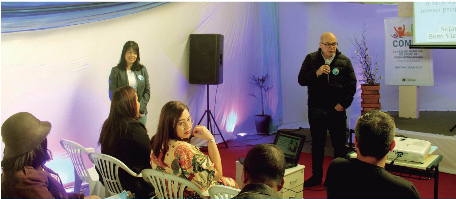
A cidade inicia o ciclo de pré-conferências territoriais para nortear a 13ª Conferência Municipal de Saúde

Inspirada pela 18ª Conferência Nacional de Saúde, que traz como tema "Saúde, Democracia, Soberania e SUS: cuidar do povo é cuidar do Brasil", a mobilização em Pindamonhangaba nasce nos