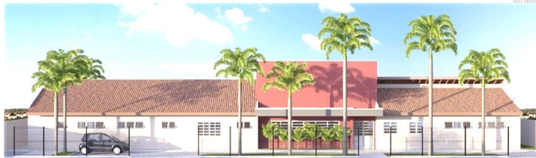
O investimento para a obra é de R$ 2,3 milhões via convênio entre a Prefeitura e o Governo Federal

serviço, que é executado pela empresa E.D. dos Santos, com previsão para ser concluído até abril de 2027. O investimento para a obra é de R$ 2,3 milhões via convênio entre a Prefeitura de Pindamonhangaba e o Governo Federal.