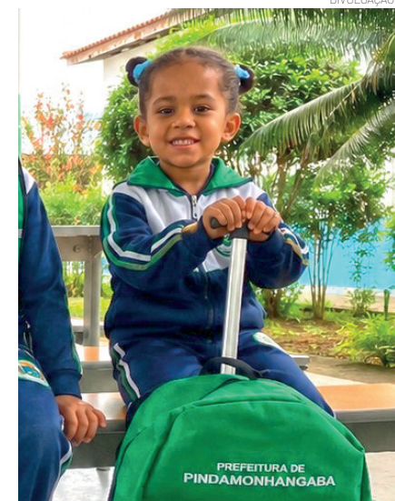
Todas as creches já receberam os bodys de inverno; cronograma contempla 15.580 kits