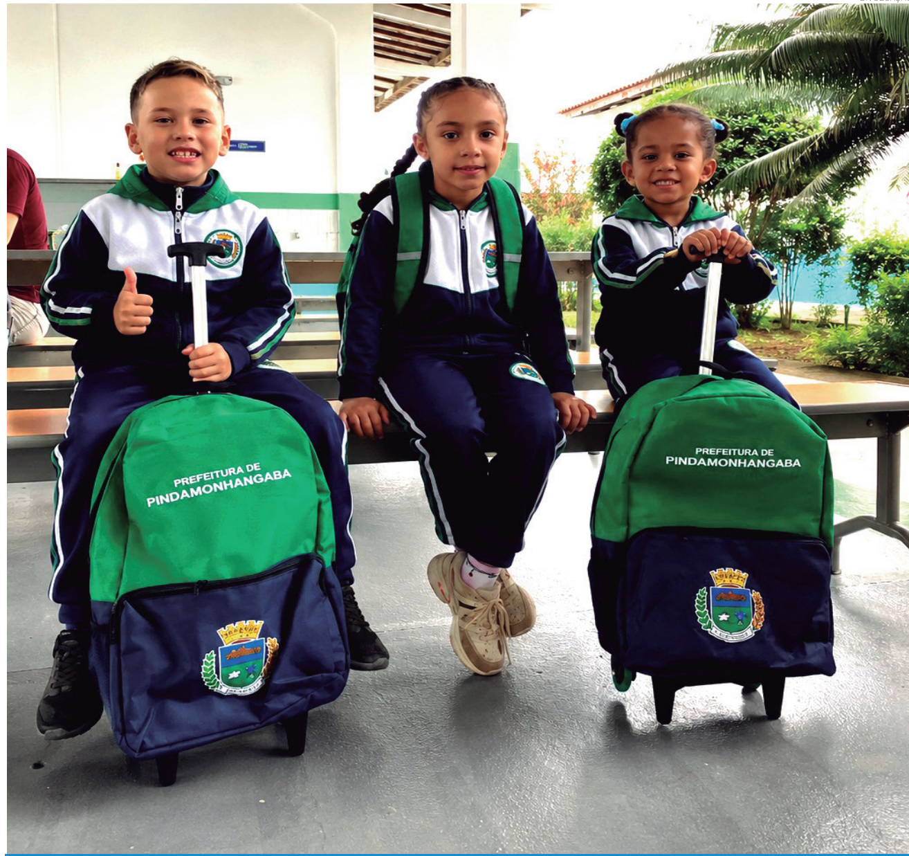
A distribuição contempla 15.580 kits de inverno e será realizada de forma gradual, de acordo com cronograma logístico da Secretaria de Educação

O prefeito Ricardo Piorino ressaltou que a iniciativa faz parte de uma política de valorização da educação municipal e de apoio direto às famílias. "A entrega dos uniformes de inverno representa muito mais do que a distribuição de uma peça de roupa. É cuidado com as nossas crianças, é respeito com os pais e mães que confiam seus filhos à rede municipal e é compromisso com uma educação pública cada vez mais estruturada. Estamos investindo para que os alunos tenham melhores condições de aprendizagem, com material escolar, uniforme, mochila e, agora, também as peças adequadas para o período mais frio. Isso mostra que a Prefeitura está presente, olhando para as necessidades reais das famílias e trabalhando para fortalecer a educação em todos os sentidos", destacou.