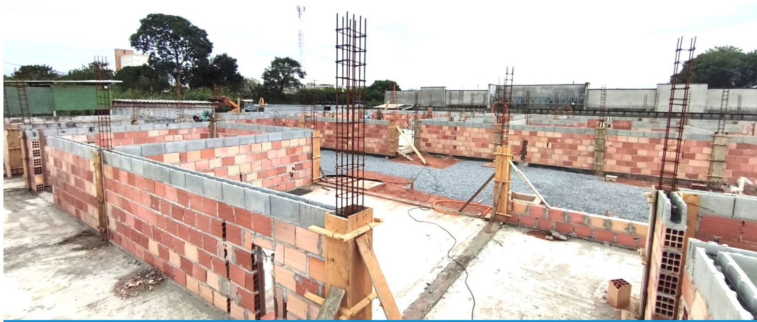
A sede própria vai oferecer mais conforto, qualidade e eficiência no atendimento à população

A Prefeitura de Pindamonhangaba entrou em uma nova fase da obra de construção do CAPS Infantil do Parque das Palmeiras. Estão sendo feitos os serviços de alvenaria e adequação do solo para receber o contrapiso