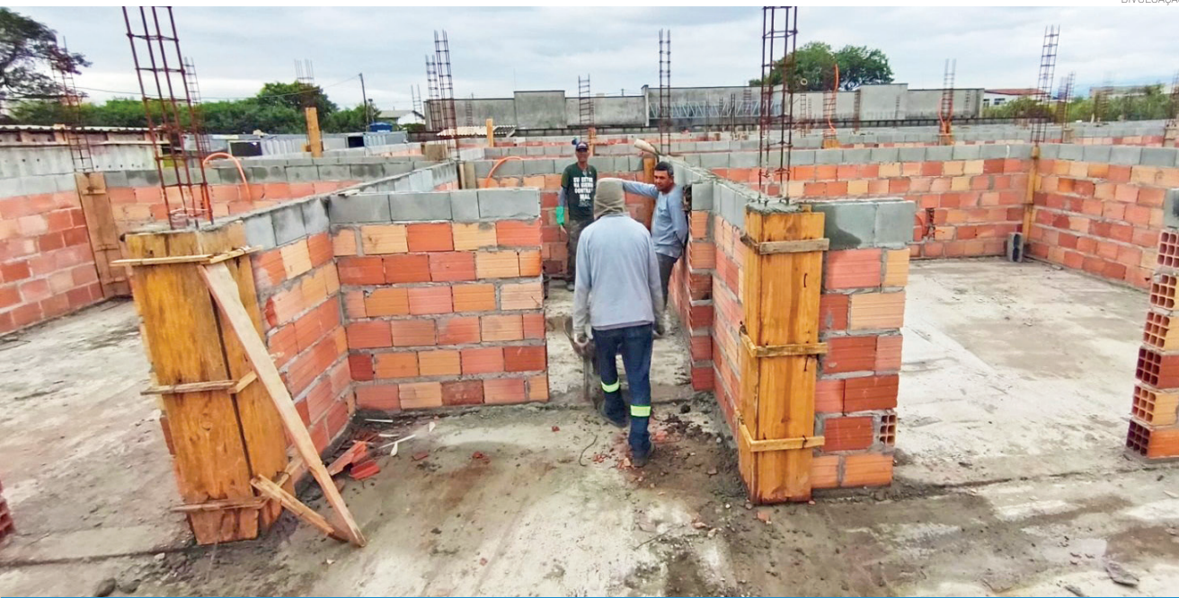
O CAPS do Parque das Palmeiras terá cinco salas de atendimento individualizado, três salas de atividades coletivas, farmácia, sala de ambiência de terapia ocupacional, dois quartos para repouso coletivo, refeitório, cozinha, administrativo e espaço de convivência