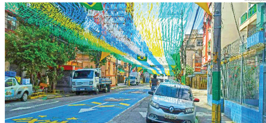
Instrução Normativa orienta na decoração das ruas para a Copa do Mundo