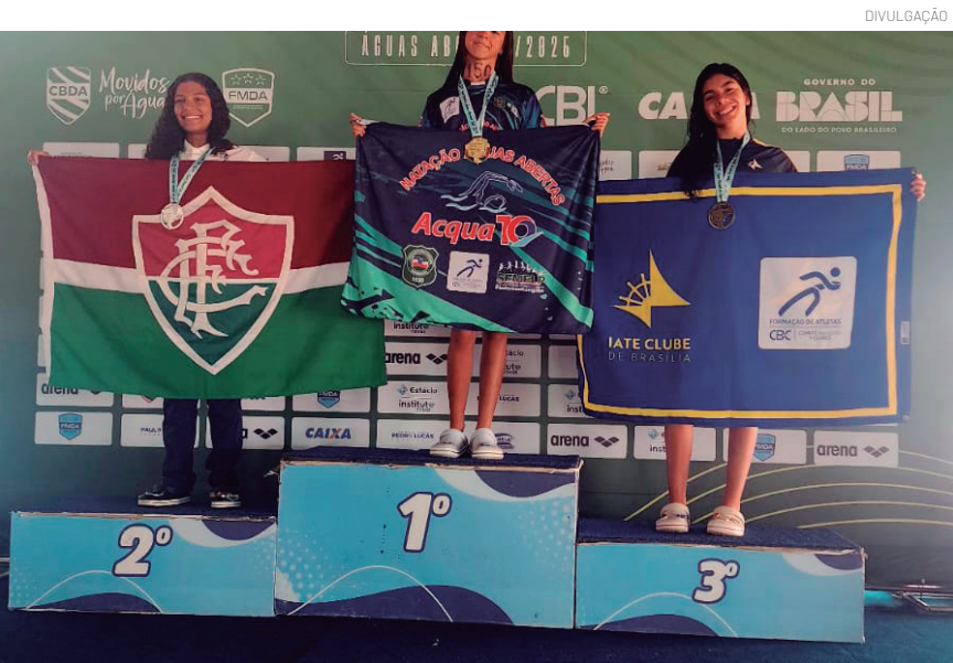
Os resultados reforçam o trabalho desenvolvido e o potencial dos atletas do município

Representando Pindamonhangaba, atleta conquistou ouro nas provas de 3km, 5km e 2,5km durante competição nacional realizada em São Luís (MA)