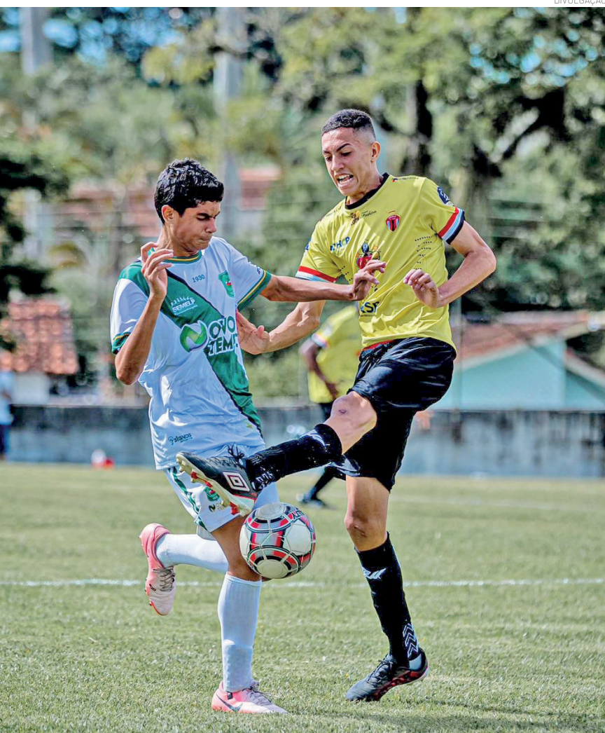
No Sub-11, a equipe do Real Esperança venceu a da Ferroviária