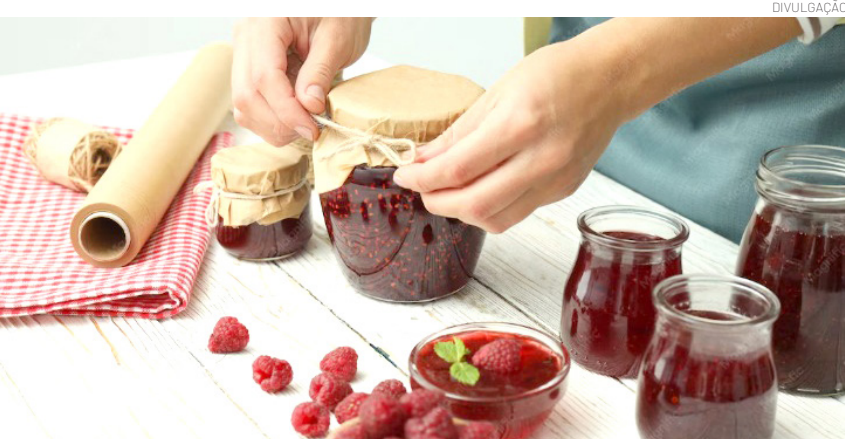
O curso capacita e desenvolve competências para a fabricação e comercialização dos produtos