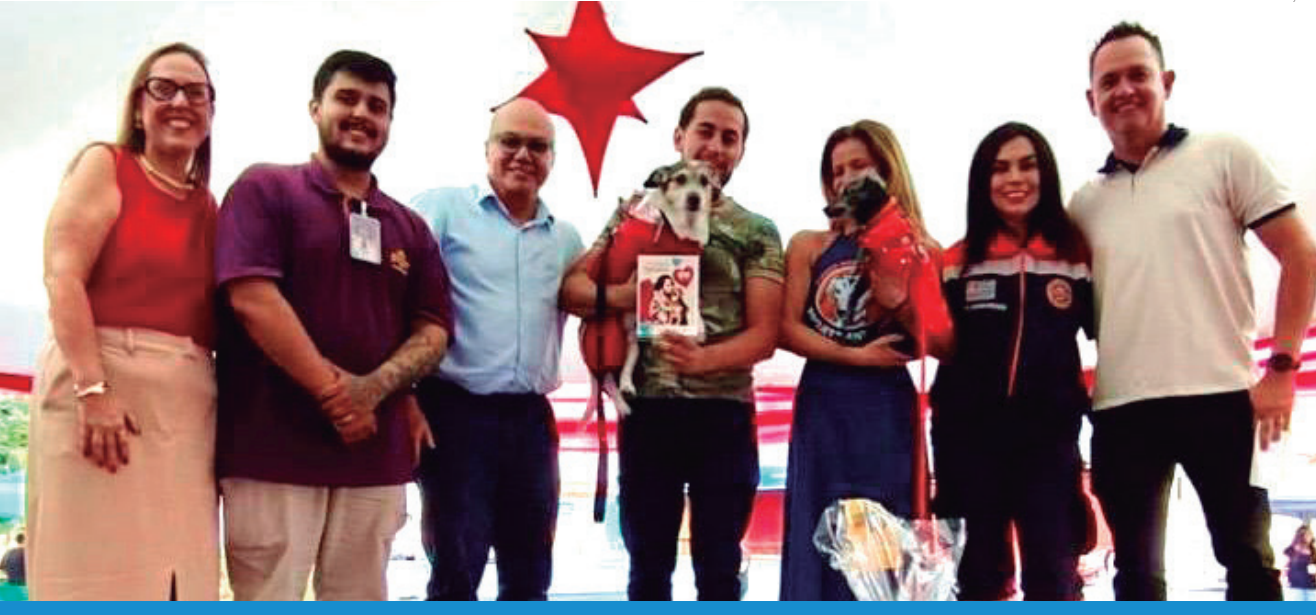
A proposta fortaleceu o vínculo entre as famílias e seus pets