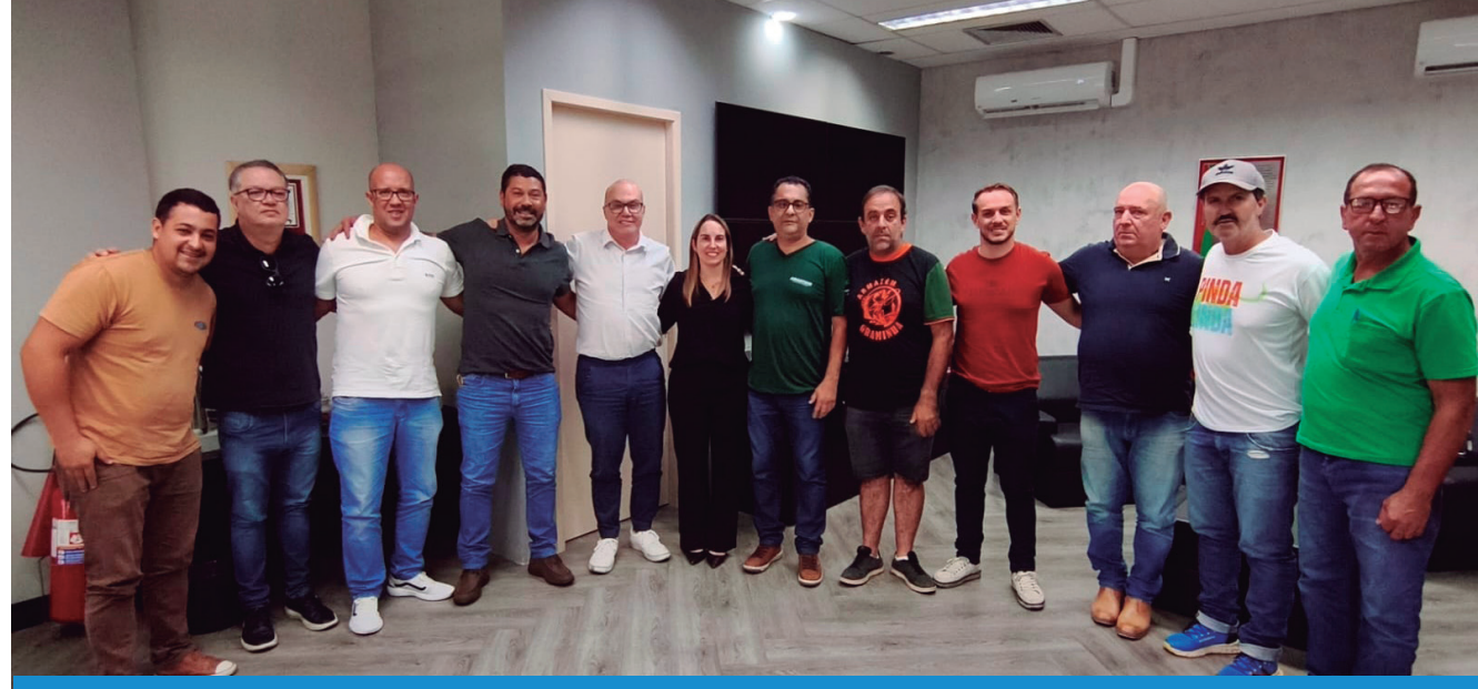
O encontro debateu propostas para fomentar o turismo rural, melhorias nas vias rurais entre outras questões

De acordo com eles, o apoio da Prefeitura tem contribuído para aumentar o número de clientes, tanto de Pindamonhangaba, quanto de outras cidades. Eles também destacaram a importância um empresário indicar outros estabelecimentos quando o cliente deseja um produto diferente, pois isso ajuda a todos.