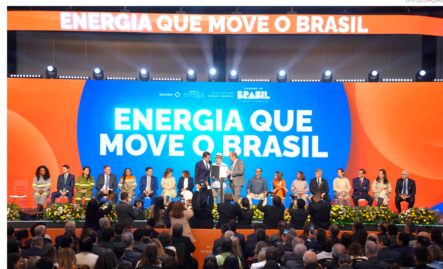
A EDP atende 2,2 milhões de clientes no estado de São Paulo