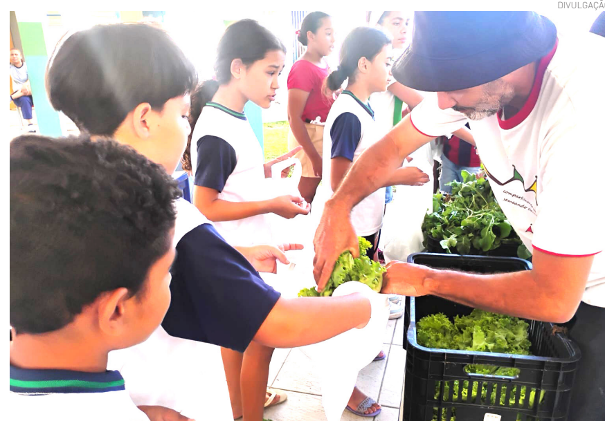
A iniciativa integra conteúdos pedagógicos e também a responsabilidade socioambiental

O projeto segue com atividades semanais ao longo do ano letivo, fortalecendo a integração entre educação, sustentabilidade e participação comunitária dentro do ambiente escolar.