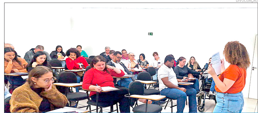
O projeto já contou com mais de 30 mil alunos e beneficiou quase 8.527 alunos empreendedores

A EDP atende 2,2 milhões de clientes residenciais, rurais e industriais no estado de São Paulo. Com o compromisso da qualidade de serviço e expansão da infraestrutura, a companhia está investindo R$ 5 bilhões de 2025 a 2030 em sua área de concessão, um crescimento de cerca de 30% na comparação com os investimentos realizados entre 2019 e 2024. O aumento do investimento será direcionado para aperfeiçoar os processos de atendimento ao cliente, infraestrutura energética, digitalização e automação do sistema, bem como para reforçar a resiliência das redes de distribuição de energia, fundamental no contexto das alterações climáticas.