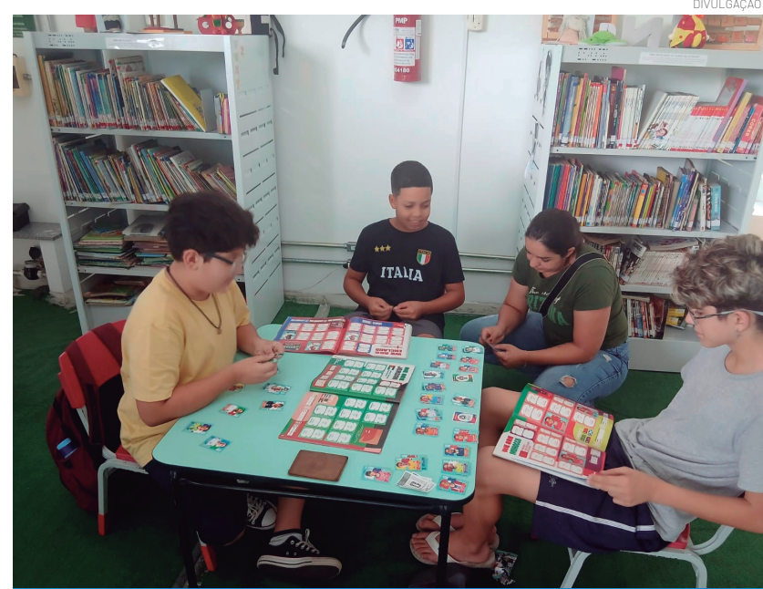
A ação reuniu o público que ama futebol

ticipantes também podem aproveitar uma seleção especial de livros sobre futebol, com histórias de Copas do Mundo, curiosidades e biografias de grandes jogadores, reforçando o papel da biblioteca como espaço de cultura, lazer e integração da comunidade.