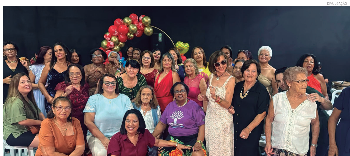
O evento homenageou mães com mais de 60 anos, reconhecendo suas importantes histórias de vida