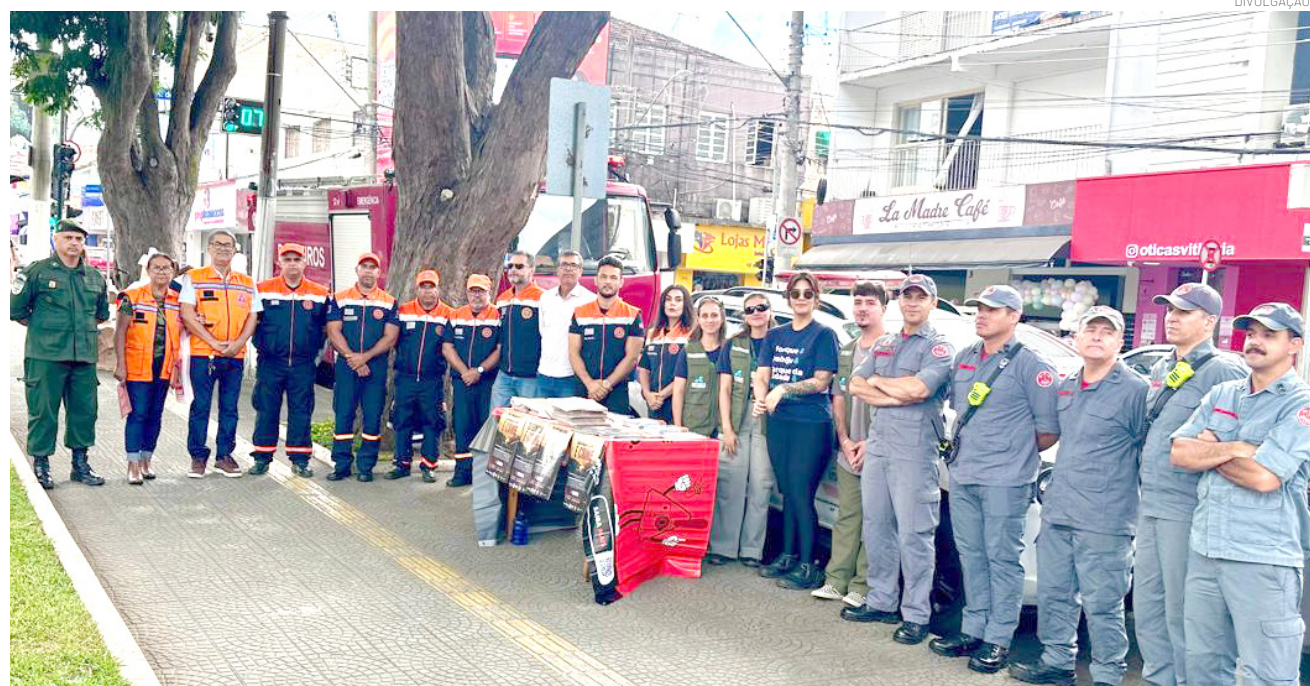
As equipes atuaram na distribuição de material informativo buscando a conscientização da população

Em casos de emergência, a população pode acionar a Defesa Civil pelo telefone 199 e o Corpo de Bombeiros pelo 193. Denúncias de queimadas irregulares também podem ser feitas à Ouvidoria da Prefeitura pelos telefones 3644-5651 e 3644-5652.