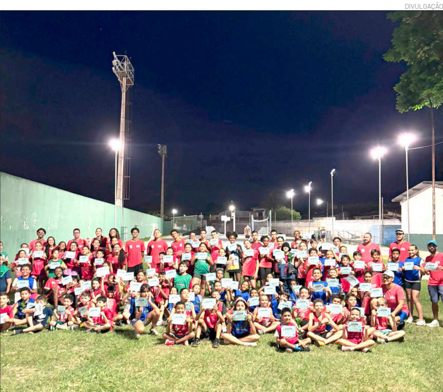
A iniciativa proporcionou momentos de aprendizagem, movimento e integração aos alunos