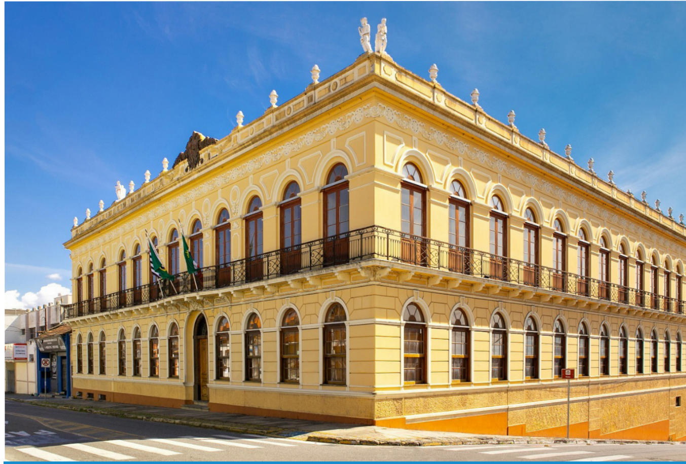
O evento amplia o acesso da população à cultura, valoriza os artistas e projeta o município no cenário cultural