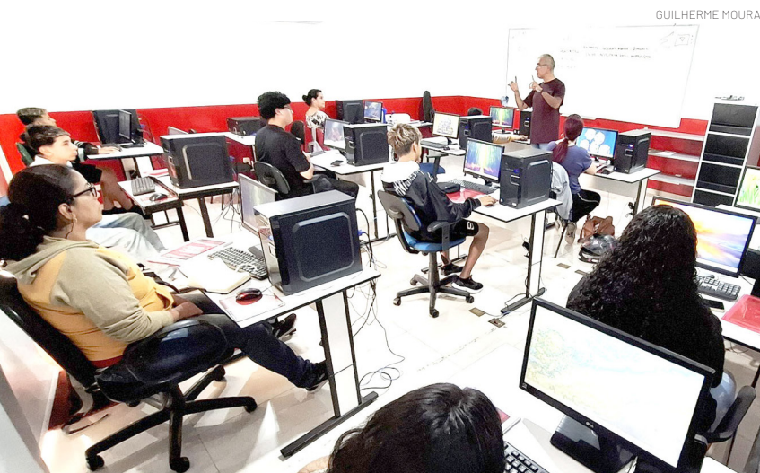
Aula na sede da entidade, no centro; inscrições terminam nesta sexta-feira

O encontro reforça o compromisso de Pindamonhangaba com políticas públicas voltadas à proteção das mulheres, ao enfrentamento da violência doméstica e à promoção de um atendimento sensível, responsável e articulado entre todos os setores envolvidos.