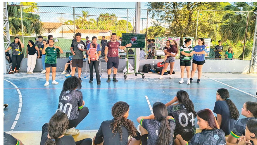
Escola Iolanda Vellutini recebeu a visita de Seleção de Rugby

Um dos destaques da atividade foi a participação de ex-alunas da unidade,