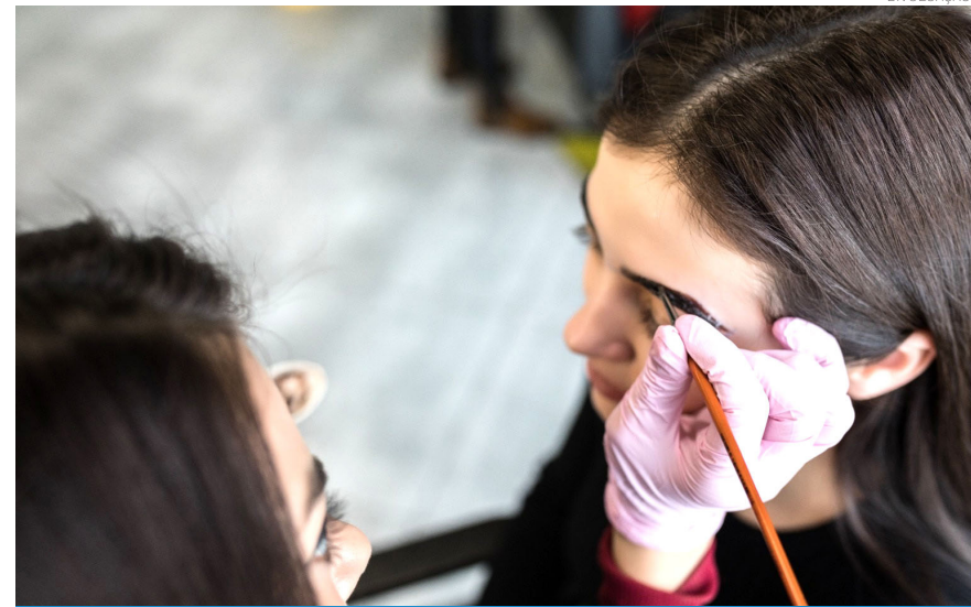
Os cursos são gratuitos e tem vagas limitadas

O curso de design de sobrancelhas é voltado para jovens de 16 a 24 anos que buscam o primeiro emprego ou inserção no mercado de trabalho. Já o curso de maquiagem é destinado a pessoas de 25 a 59 anos interessadas em ingressar na área da beleza ou se aperfeiçoar profissionalmente.