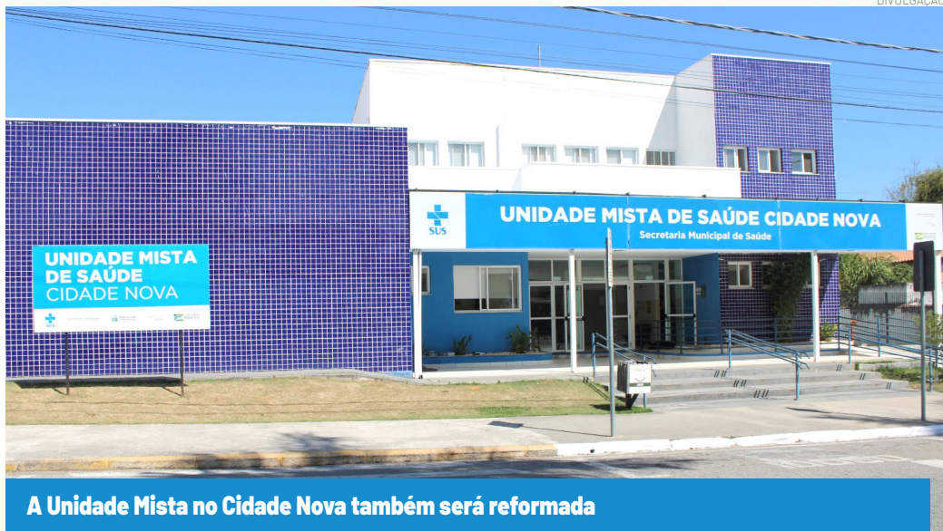
A Unidade Mista no Cidade Nova também será reformada

De acordo com a Secretaria de Serviços Públicos, a UPA do Araretama vai receber as intervenções a partir da próxima semana, com a substituição de telhas, calhas, rufos e pingadeiras, troca dos domos e