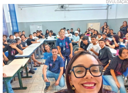
Projeto tem promovido debate de temas essenciais nas escolas

Outro aspecto relevante do projeto é o incentivo ao protagonismo juvenil. Os alunos são estimulados a participar ativamente das discussões e ações, fortalecendo a autoconfiança, reduzindo in-