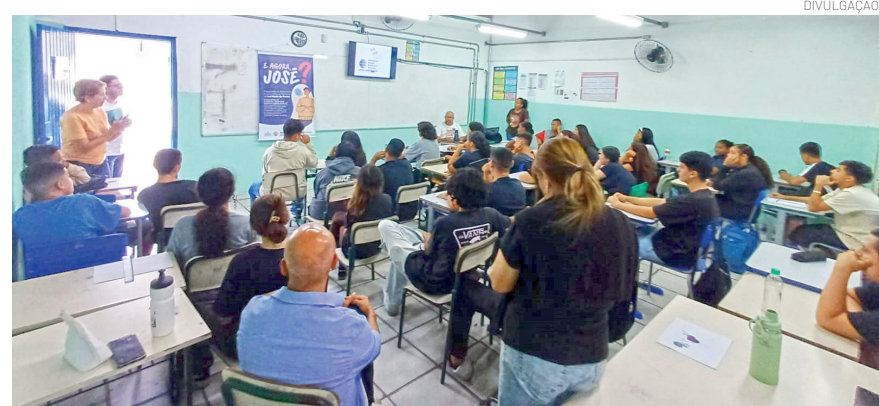
Alunos da Isis Castro desenvolveram atividades com a 'E Agora José?'

Ficou evidente que a pressão para que meninos sejam sempre fortes e não demonstrem sentimentos, assim como a expectativa de que meninas se comportem de maneira submissa, contribui para