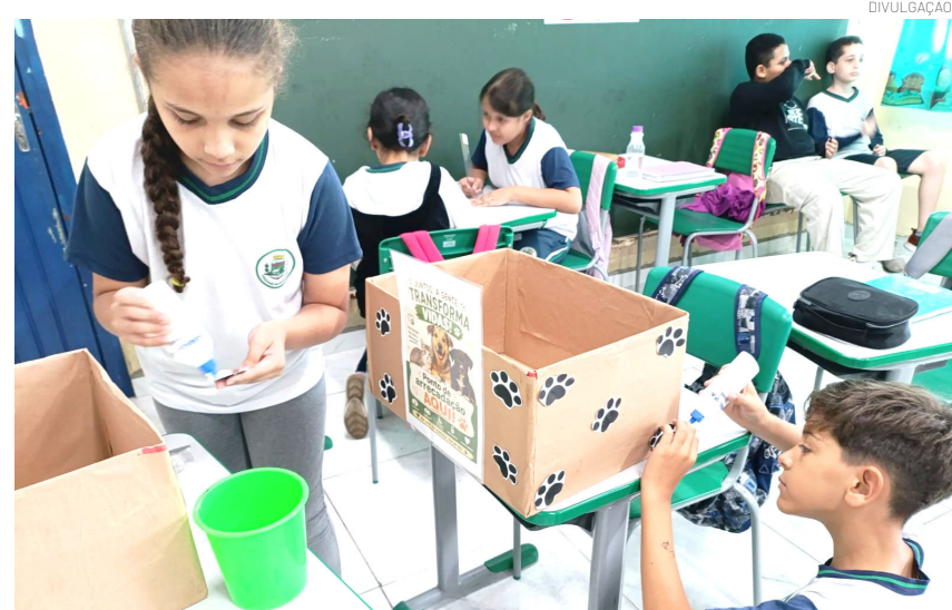
Com iniciativa começada no Abril Laranja, ação une alunos, escola e comunidade em campanha permanente de respeito e cuidado com os animais