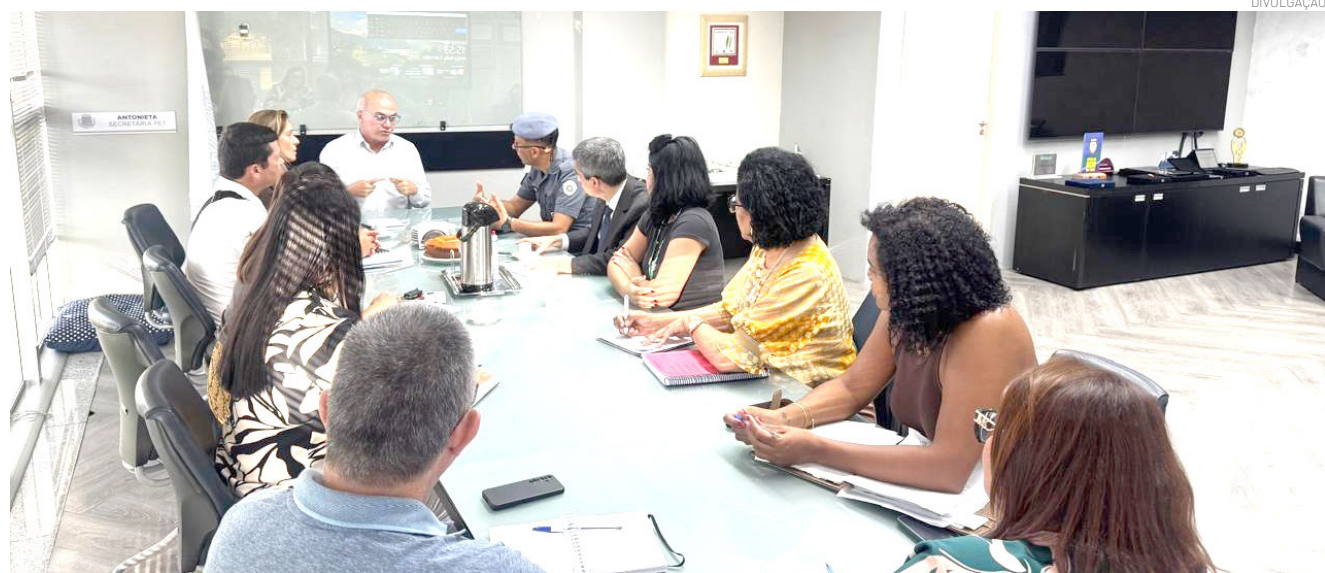
Reunião tratou do programa Flor de Lótus e reforçou a integração da rede de proteção em Pindamonhangaba