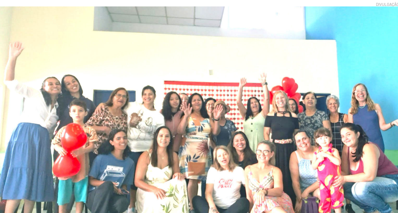
A manhã foi dedicada ao bem-estar das participantes

A professora responsável pelo projeto destacou a importância de envolver os alunos na causa. "A causa animal sempre fez parte da minha vida, e trazer esse tema para a sala de aula é uma forma de ampliar essa conscientização. Mais do que ensinar conteúdos, queremos formar cidadãos sensíveis, responsáveis e comprometidos com o respeito aos animais e à vida", destacou.