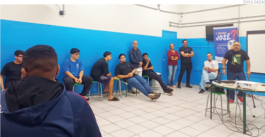
Foram abordados temas como identificação de situações de violência

Nova, promoveu o projeto "E agora, José?", uma iniciativa voltada à conscientização