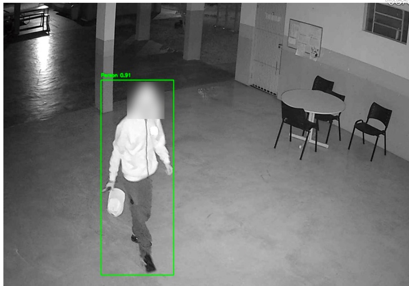
Os dois indivíduos foram conduzidos à autoridade de plantão

Ação foi realizada após acionamento pelo Centro de Controle Operacional e apoio de imagens de monitoramento