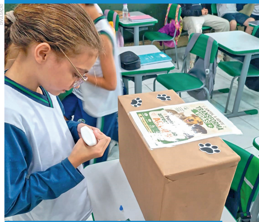
Alunos, escola e comunidade juntos no respeito aos animais