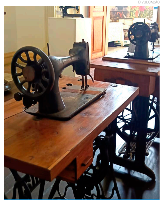
Uma das peças expostas no Museu

A mostra também dialoga com a memória afetiva de muitas famílias e surge, neste período, como uma homenagem ao Dia das Mães, ao reconhecer o papel de mulheres que, por meio da costura, construíram