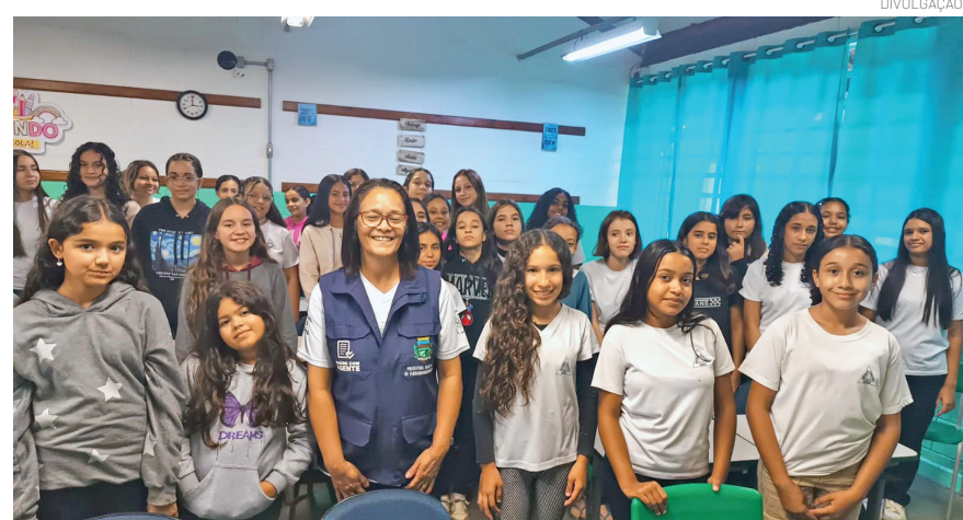
Palestra foi realizada pelo Programa de Saúde na Família (PSF)

A palestra integra as ações educativas do PSF Cidade Nova, fortalecendo a parceria entre a saúde e a educação na promoção do bem-estar da comunidade.