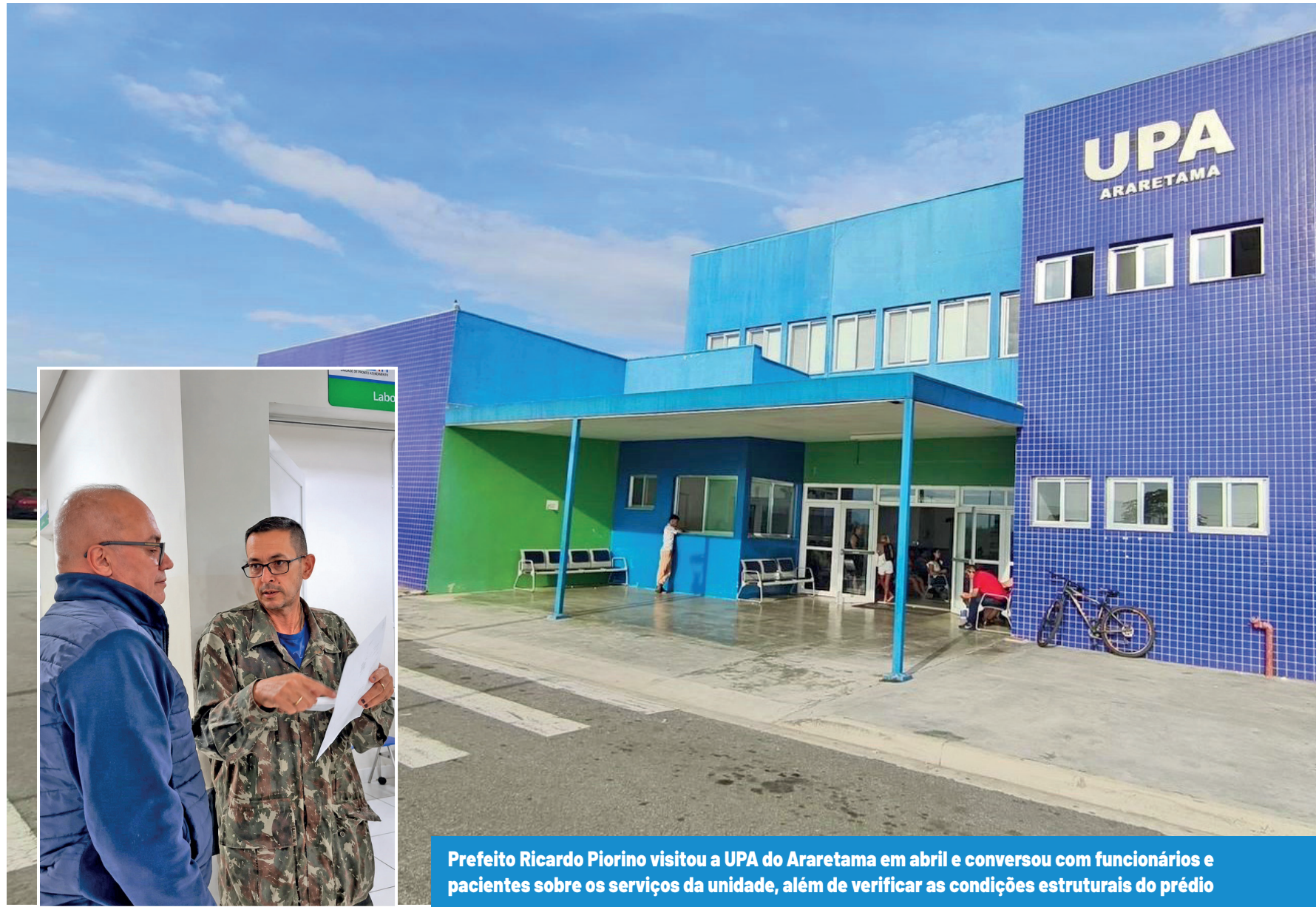
Prefeito Ricardo Piorino visitou a UPA do Araretama em abril e conversou com funcionários e pacientes sobre os serviços da unidade, além de verificar as condições estruturais do prédio