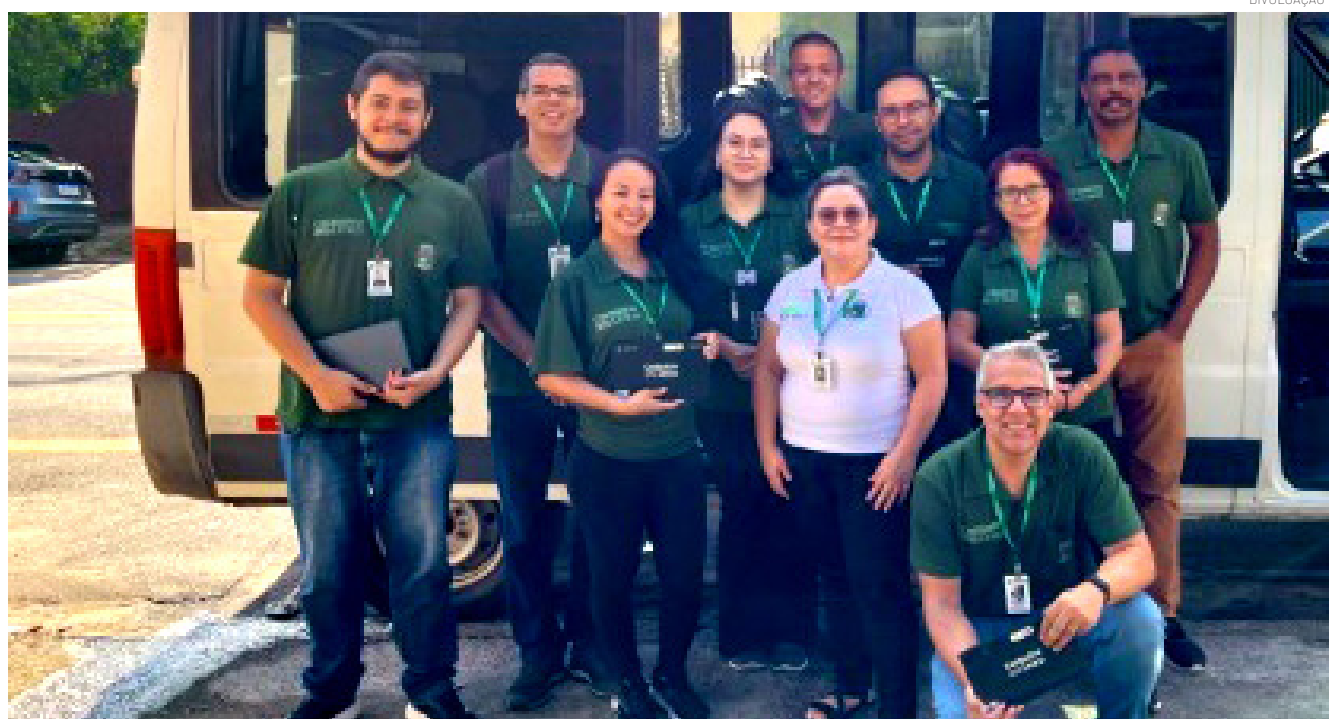
Equipes estarão no bairro Cícero Prado nesta sexta-feira (08)

A Prefeitura de Pindamonhangaba, por meio da Secretaria de Assistência Social, realiza nesta sexta-feira (08), uma ação de busca ativa no bairro Cícero Prado com o objetivo de identificar e cadastrar famílias em situação de vulnerabilidade que ainda não estão inseridas no Cadastro Único (CadÚnico) ou que necessitam de atualização cadastral.