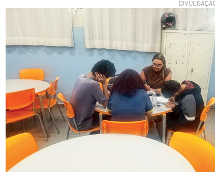
Alunos desejam compreender o campo de atuação do psicólogo

Porque, quando um jovem passa a enxergar além, ele também passa a acreditar que pode ir além. Essas ações fazem parte da Pasta Conviva que cuida da manutenção do bom clima escolar nas unidades.