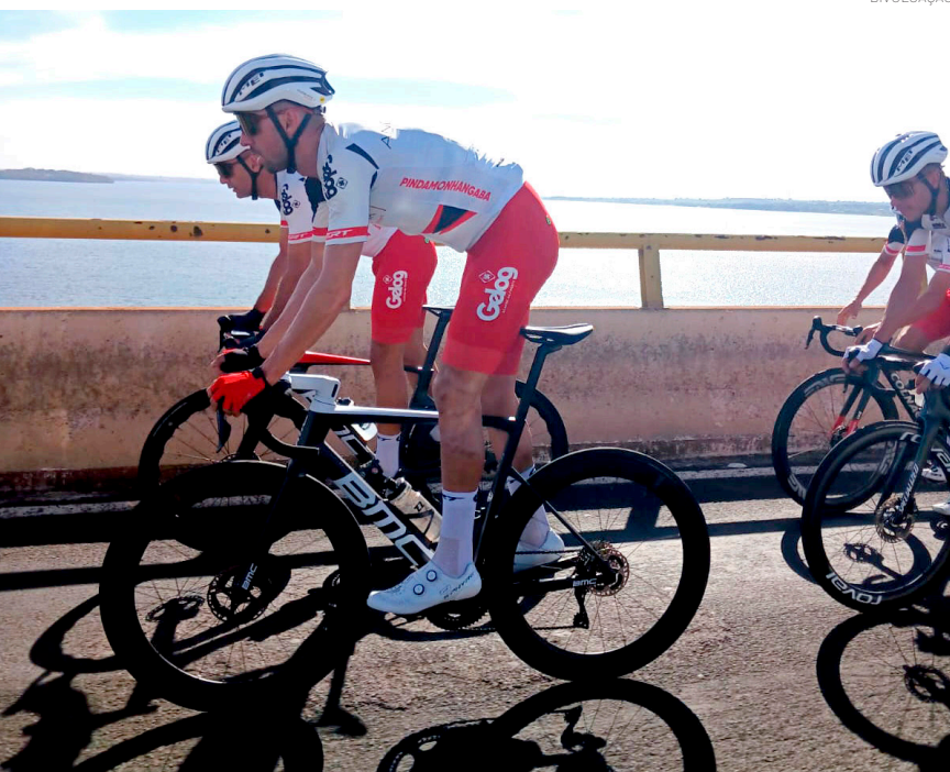
O diretor da equipe comemorou o ótimo desempenho de toda a equipe

A competição segue até o próximo dia 10 de maio, com mais três etapas previstas antes do encerramento em São Paulo.