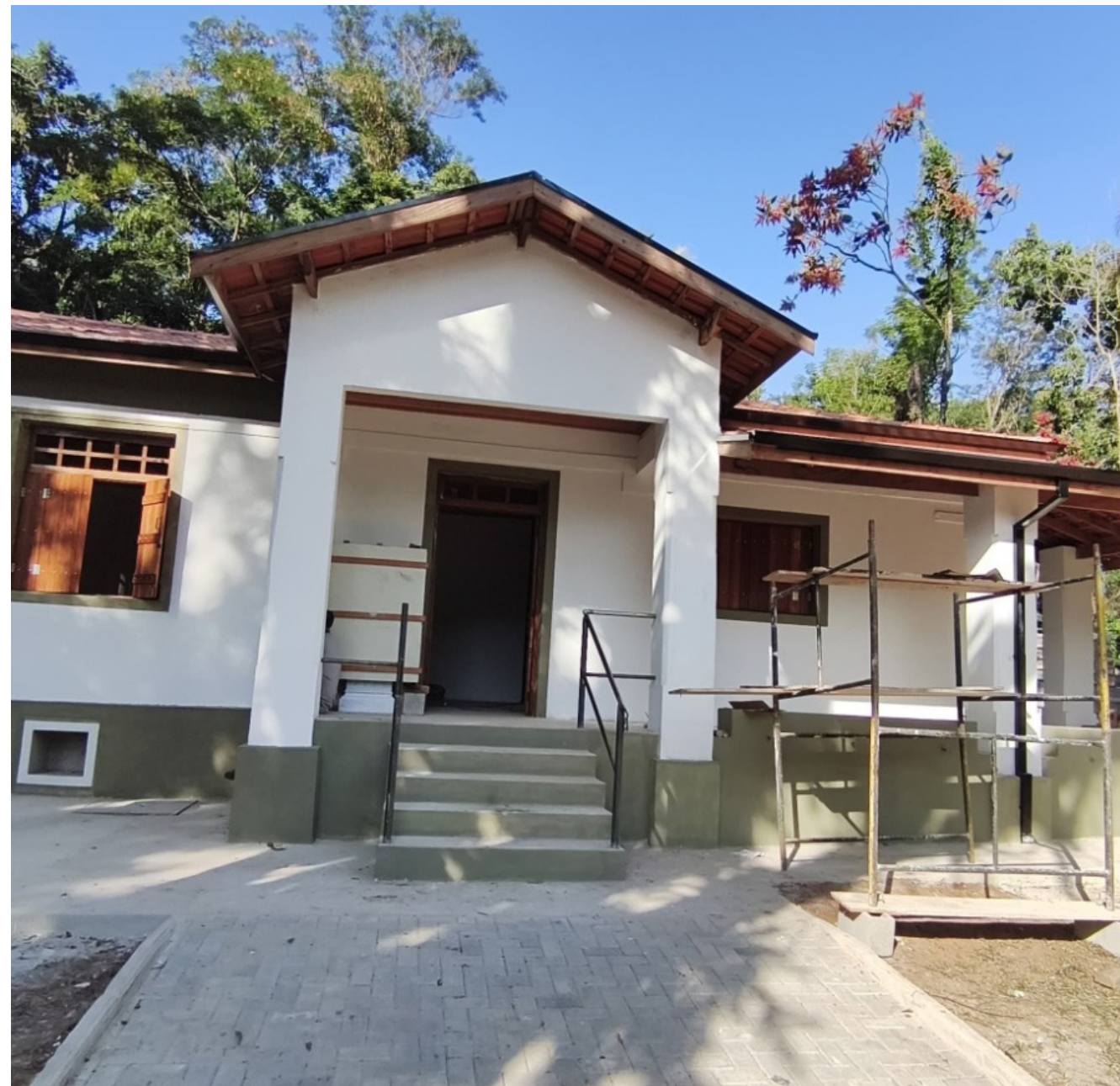
A nova sede do Fundo Social Animal/Projeto Antoniea

Novo espaço vai reunir ações administrativas, cursos, atividades de conscientização e iniciativas de incentivo à adoção responsável