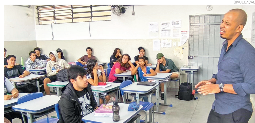
Palestra na Escola Estadual Mário Bulcão Giudice

vivências e discutiram estratégias para a construção de relações mais respeitadas no ambiente escolar e na sociedade como um todo.