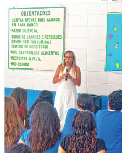
Ação na Eunice Bueno Romero

Na UBS do Bem Viver, a equipe destacou o acolhimento e a qualidade do