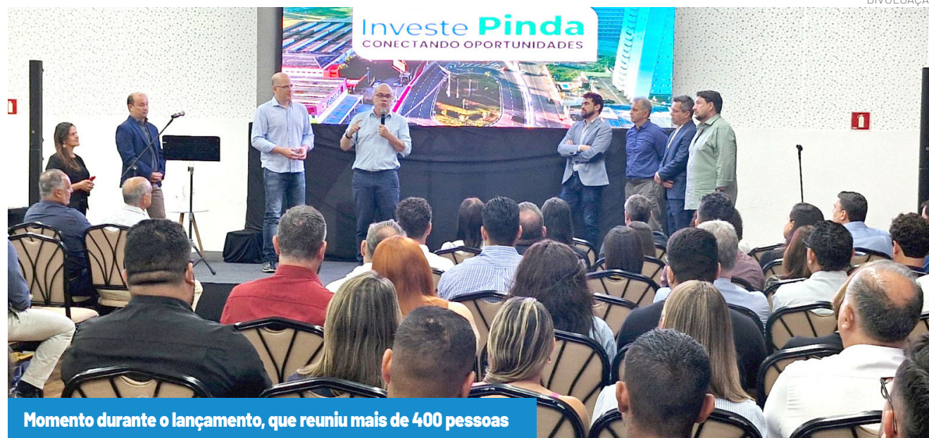
Momento durante o lançamento, que reuniu mais de 400 pessoas