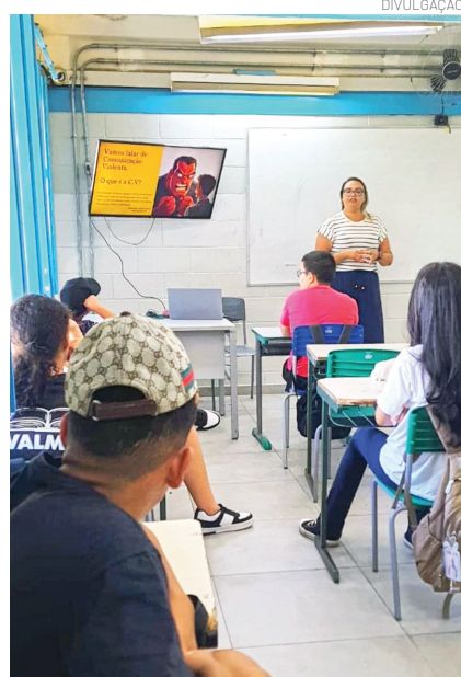
Palestra na José Aylton Falcão

A expectativa é que a parceria alcance um número expressivo de escolas e estudantes, fortalecendo o papel da escola como espaço de produção de conhecimento, experimentação e protagonismo juvenil. Para maiores informações sobre a Oba e como se inscrever: www.oba.org.br .