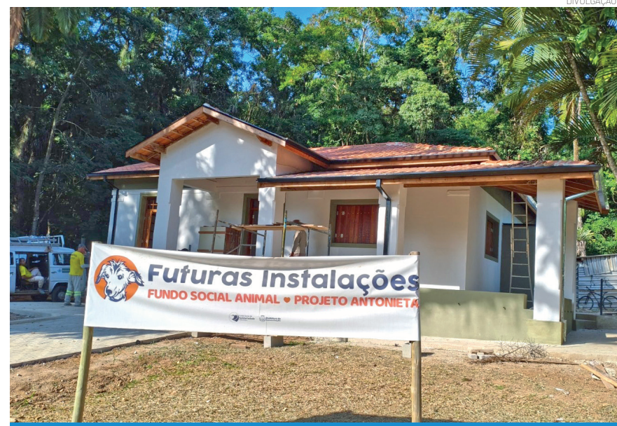
Novo espaço vai reunir ações administrativas, cursos, atividades de conscientização e iniciativas de incentivo à adoção responsável