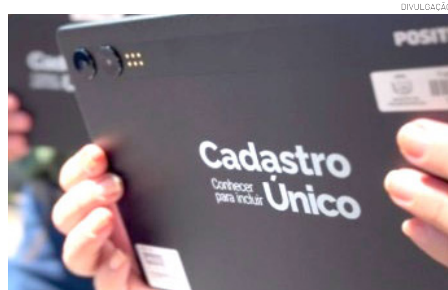
A substituição do método tradicional, baseado em formulários impressos, pelo sistema digital representa mais do que uma mudança operacional.

Antes da implantação dos dispositivos, os entrevistadores sociais realizavam o preenchimento manual durante as visitas domiciliares e, posteriormente, precisavam retornar à unidade para digitar todas as informações no sistema federal, gerando um intervalo entre o atendimento e a conclusão do processo. Com os tablets, o preenchimento passou a ser feito diretamente durante a visita, com armazenamento das informações mesmo em locais sem acesso à internet. Assim que há conexão disponível, os dados são sincronizados automaticamente, eliminando retrabalho e reduzindo falhas.