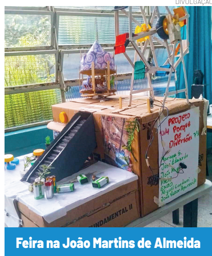
Feira na João Martins de Almeida

Na oportunidade também foi feito um adendo ao bullying pontuando sobre essa causa que tanto tem afetado a parte emocional dos estudantes através de brincadeiras de mal gosto onde pode ficar marcas emocionais e até mesmo traumas. A ação faz parte da pasta Conviva, e visa