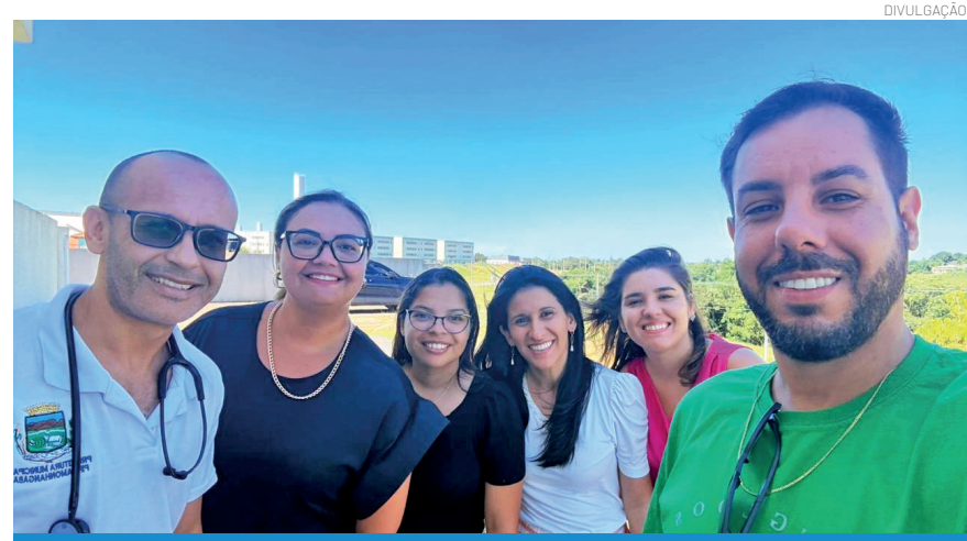
Profissionais visitaram diversas unidades de saúde

A ação reforça a importância da articulação entre Educação e Saúde, evidenciando que o trabalho em rede é fundamental para assegurar um atendimento mais humanizado e eficiente à população, contribuindo para o desenvolvimento integral dos estudantes e da comunidade como um todo.