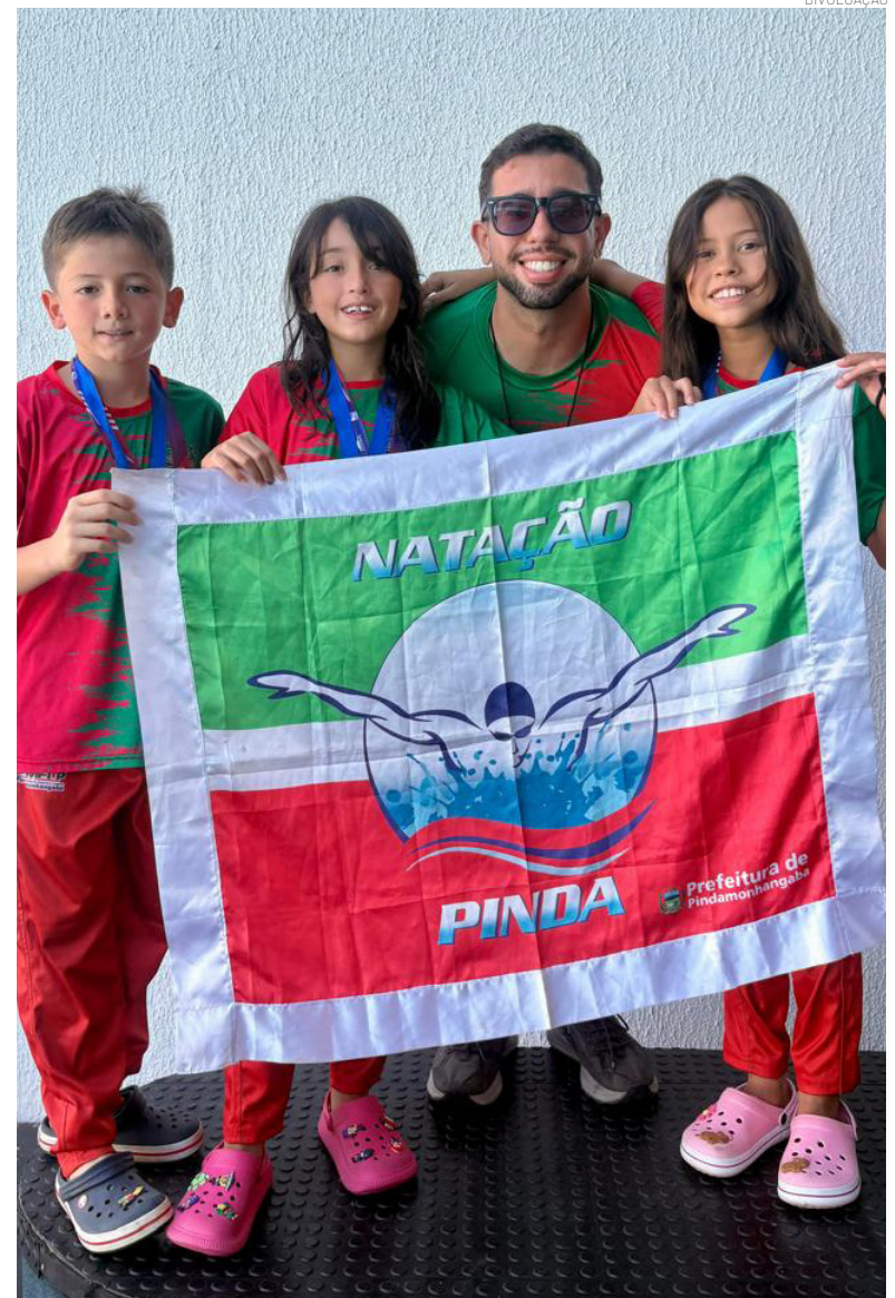
O desempenho coletivo também se refletiu na classificação geral

Equipe soma pódios em diversas categorias e alcança colocações expressivas no ranking geral