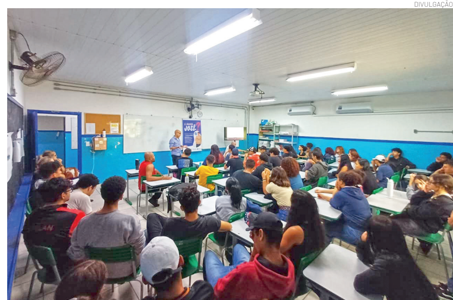
Iniciativa promoveu reflexão sobre violência doméstica

A ação "E agora, José?" reafirma o compromisso da escola com a formação integral dos estudantes, indo além dos conteúdos acadêmicos e promovendo valores essenciais para a convivência em sociedade. A iniciativa evidencia o papel da educação na construção de uma cultura baseada no respeito, na escuta e na responsabilidade coletiva.