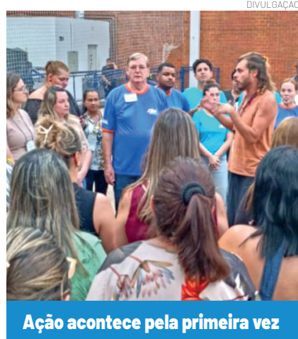
Ação acontece pela primeira vez

"A realização de eventos como este reflete diretamente os eixos estruturantes do currículo para a área de tecnologia. Quando os alunos colocam a mão na massa para construir protótipos físicos, eles deixam de ser apenas consumidores de tecnologia para se tornarem criadores. Projetos envolvendo sustentabilidade, como a maquete de energia eólica, e a aplicação de máquinas simples desenvolvem não apenas o letramento digital, mas também a resolução complexa de problemas e o trabalho colaborativo. São habilidades absolutamente essenciais para os desafios do século XXI."