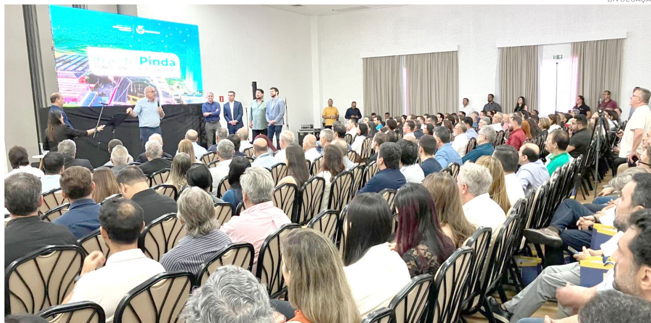
A construção da unidade, que vai gerar mais de 1.000 empregos, começa em outubro deste ano, e mais de 150 vagas para funcionários com o início das atividades, previsto para junho de 2028