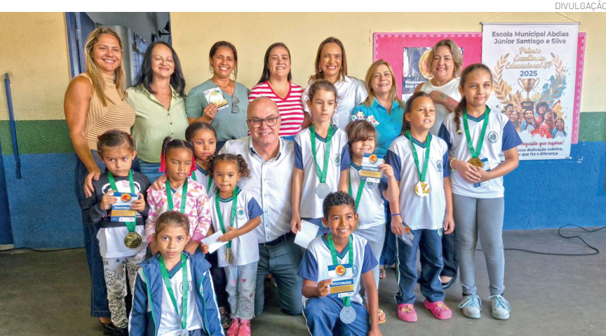
Alunos representaram cada turma da unidade de ensino