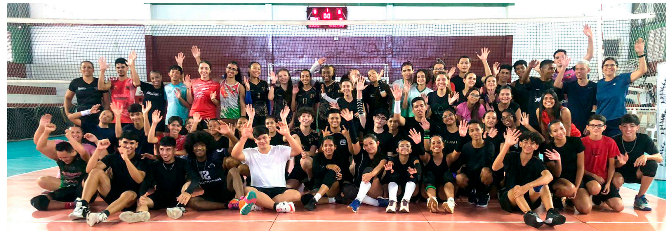
A ação buscou ampliar as oportunidades de vivência esportiva, favorecendo a integração entre os polos

A Secretaria de Esportes e Lazer (Semelp), por meio do Setor de Iniciação Esportiva, realizou, no sábado (11), o primeiro intercâmbio de voleibol do ano. A iniciativa integrou alunos com idades entre 15 e 17 anos, participantes dos polos municipais de formação esportiva.