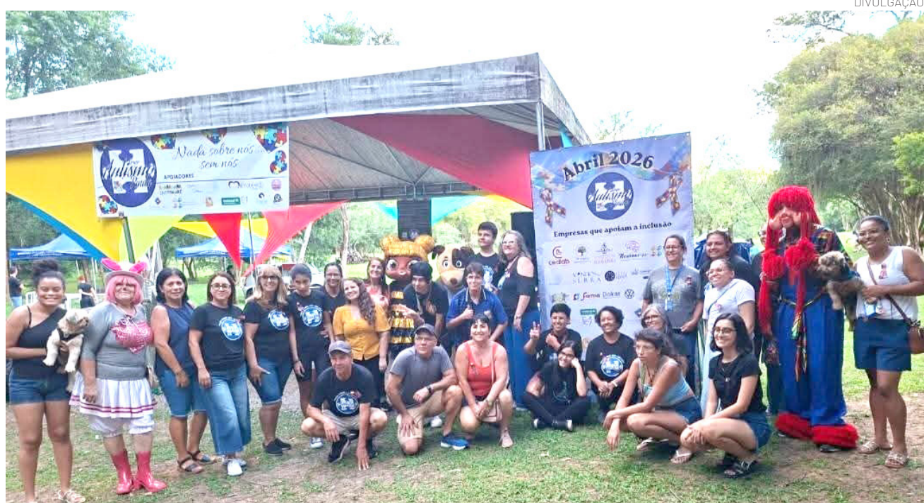
O evento proporcionou atividades para diferentes idades, reunindo crianças, pais e apoiadores

Mais do que um momento de lazer, o Piquenique Inclusivo se consolidou como uma importante ação de cuidado, acolhimento e valorização das famílias atípicas em Pindamonhangaba.