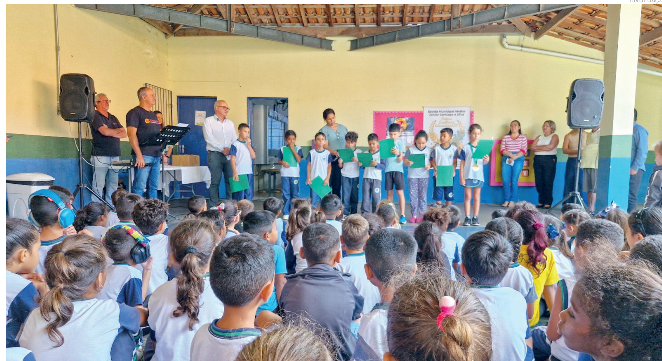
Cerimônia marcou uma das maiores conquistas recentes da Educação em Pinda: o Selo de Ouro na Alfabetização

A cerimônia foi marcada por emoção, orgulho e pertencimento. Representando todos os estudantes da unidade, um aluno