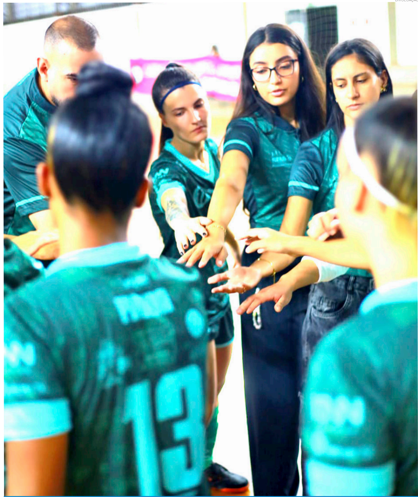
A equipe técnica destacou o desempenho coletivo, valorizando o comprometimento das atletas

O próximo compromisso das Guerreiras será em casa, no dia 22 de abril, no Ginásio do Tabapuá, contra a equipe de Itatiba.