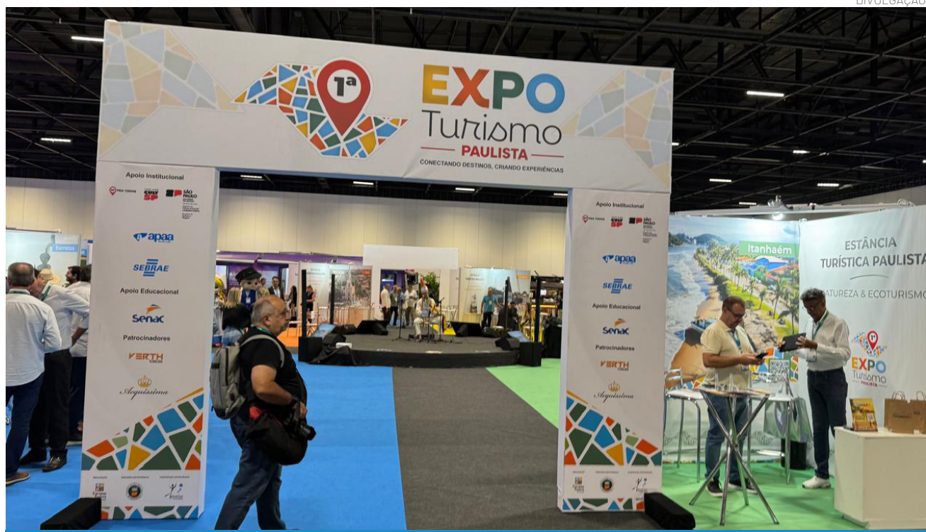
O evento é considerado uma importante vitrine para o desenvolvimento do turismo paulista

Com o propósito "Doar mechas de amor é aquecer sonhos e corações.", a iniciativa busca levar autoestima em um momento difícil, fortalecendo e trazendo confiança e amor as pacientes.