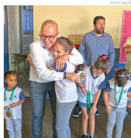
Prefeito entrega medalha a aluna da Rede Municipal de Ensino

critérios rigorosos que avaliam desde a evolução dos alunos até a qualidade das políticas educacionais implementadas. Em Pindamonhangaba, o reconhecimento reflete o avanço significativo na alfabetização, especial-