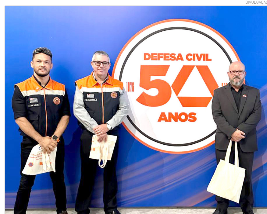
Representantes do município durante a celebração dos 50 anos da Defesa Civil.

A celebração dos 50 anos da Defesa Civil reafirma a relevância do trabalho contínuo desenvolvido em todo o estado, destacando a importância da cooperação entre os entes públicos na construção de cidades mais resilientes.