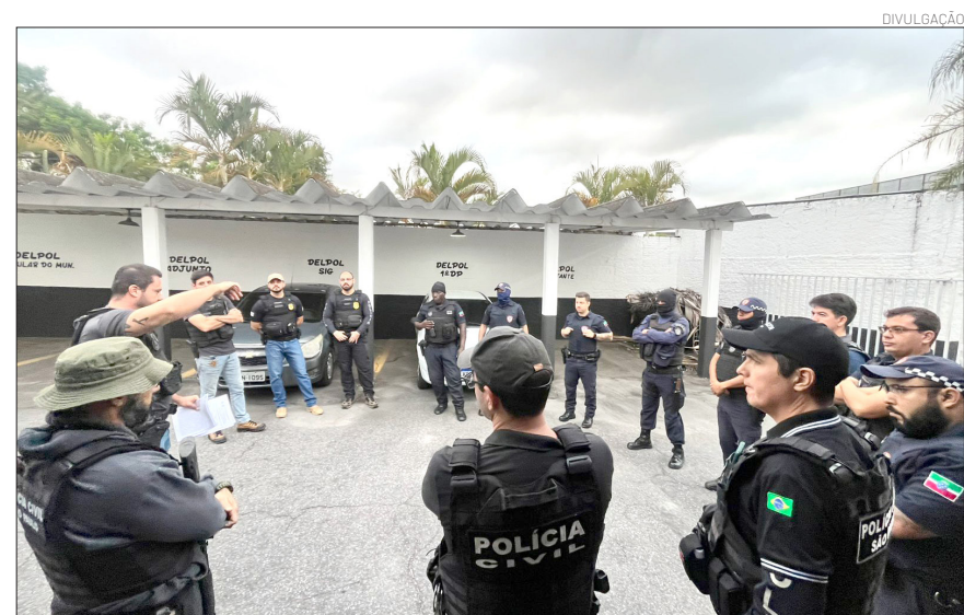
A ação representa um avanço nas apurações sobre ocorrências que chamavam atenção.