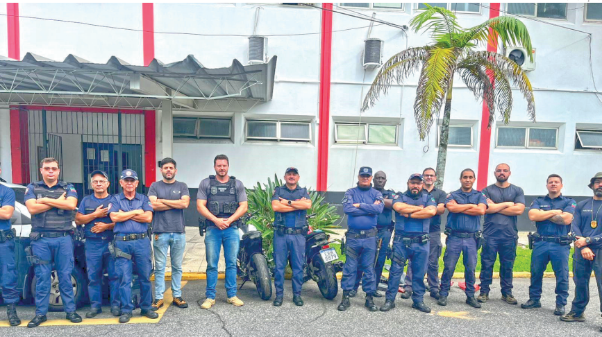
Ação conjunta cumpriu mandado de busca e recuperou motocicletas, peças e outros materiais ligados à investigação