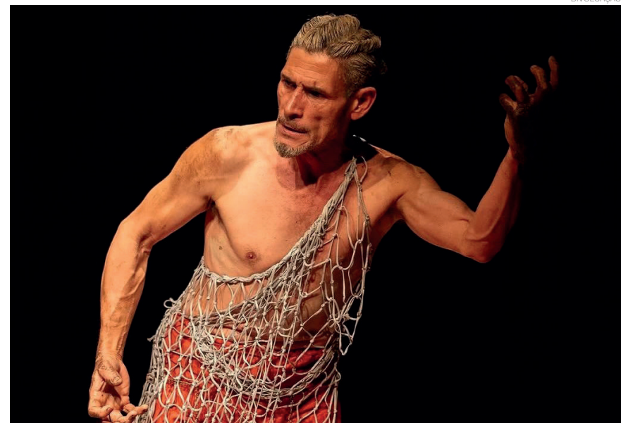
O espetáculo “deus Sujo” narra a trajetória de Riobaldo, um homem-rio que jamais se deixa aprisionar pela terra que atravessa e que se torna a única testemunha das ações humanas

Monitoramento participativo transforma Bosque da Princesa em sala de aula ambiental