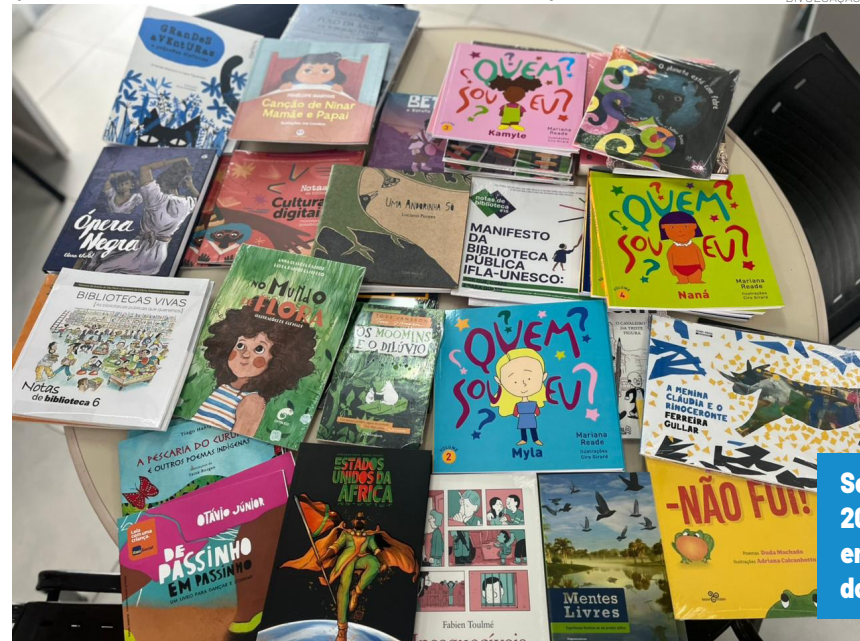
Somente no primeiro trimestre de 2026, já foram contabilizados 3.404 empréstimos, indicando a manutenção do ritmo positivo

Os interessados em utilizar os serviços podem procurar a biblioteca mais próxima para realizar o cadastro, apresentando documento com foto (RG) e comprovante de residência. O acervo também pode ser consultado de forma online, por meio do site oficial da Prefeitura: https://acervopinda.apus.info/ .