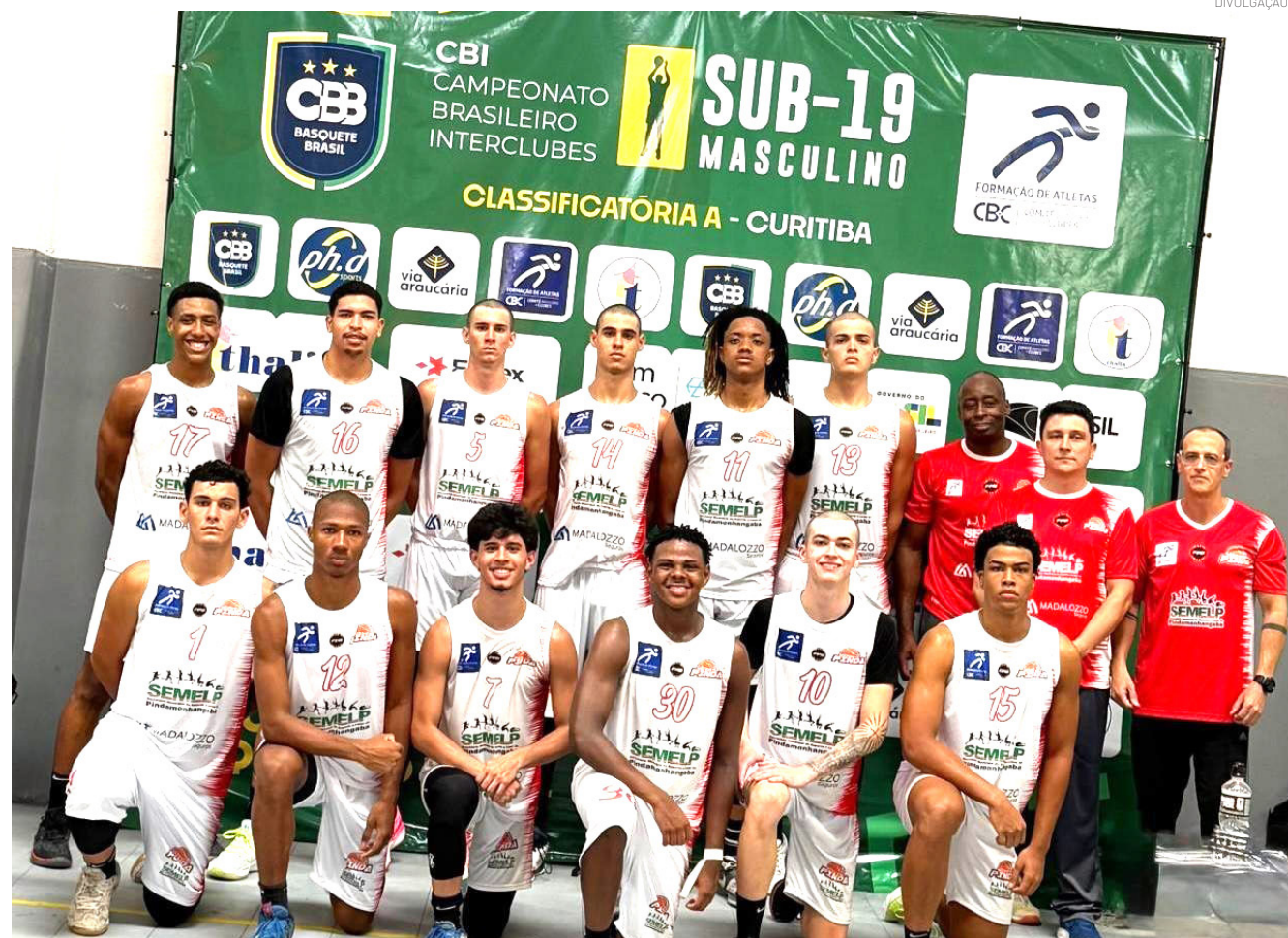
O grande destaque da temporada é a equipe sub-19 masculina, que alcançou um feito inédito para o município