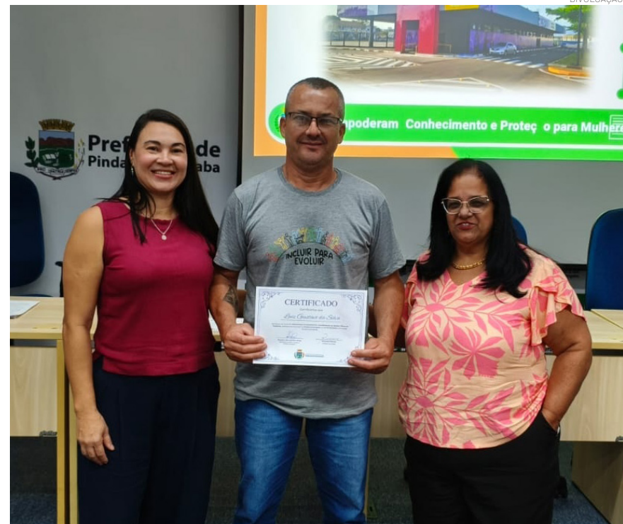
A iniciativa tem como objetivo qualificar o atendimento e fortalecer a rede de proteção às mulheres no município.