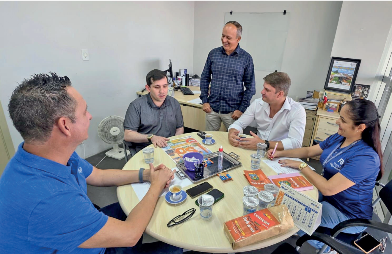
Reunião alinhou os detalhes da programação da festa que celebra os 50 anos do Araretama