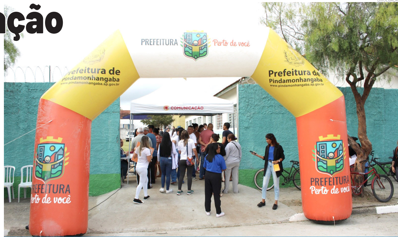
A população poderá contar com atendimentos de diversas secretarias, como orientações da Ouvidoria, serviços de Saúde, inscrições em cursos gratuitos do FSS, atendimentos de assistência social, inscrições para castração de pets, entre outros serviços

Sucesso de atendimentos - Em sua sétima edição, o programa já soma mais de 4.700 atendimentos realizados, considerando as ações de 2025 e a primeira edição de 2026, consolidando-se como uma importante iniciativa de aproximação entre a administração municipal e a população. A proposta é levar diversos serviços públicos diretamente aos bairros, facilitando o acesso dos moradores e promovendo cidadania de