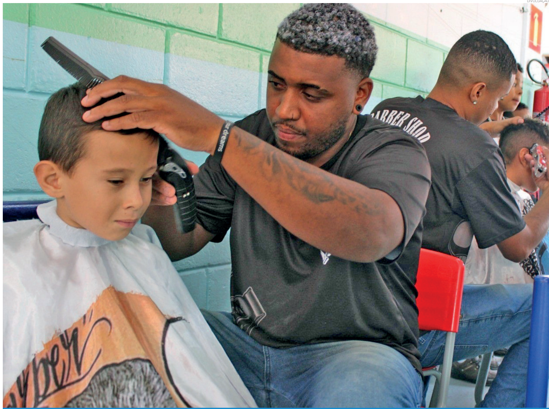
Em sua sétima edição, o programa já soma mais de 4.700 atendimentos realizados, considerando as ações de 2025 e a primeira edição de 2026

“Peixe no Prato” é encerrado com sucesso no fim de semana de Páscoa O 1º Circuito dos Pesqueiros ‘Peixe no Prato’ foi encerrado no último fim de semana, durante a Páscoa, consolidando-se como um evento que valoriza o turismo rural e gastronômico em Pindamonhangaba.