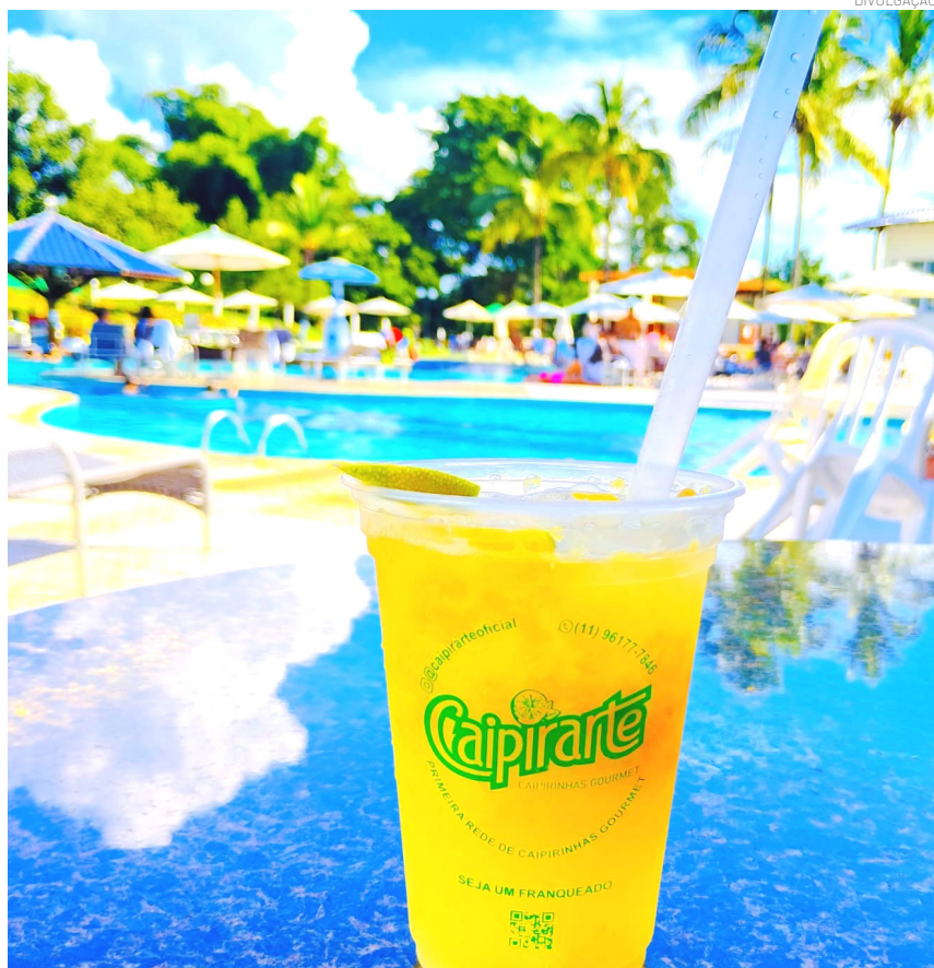
A Caipirarte foi convidada para representar a cultura brasileira em uma feira gastronômica em Macau, na China