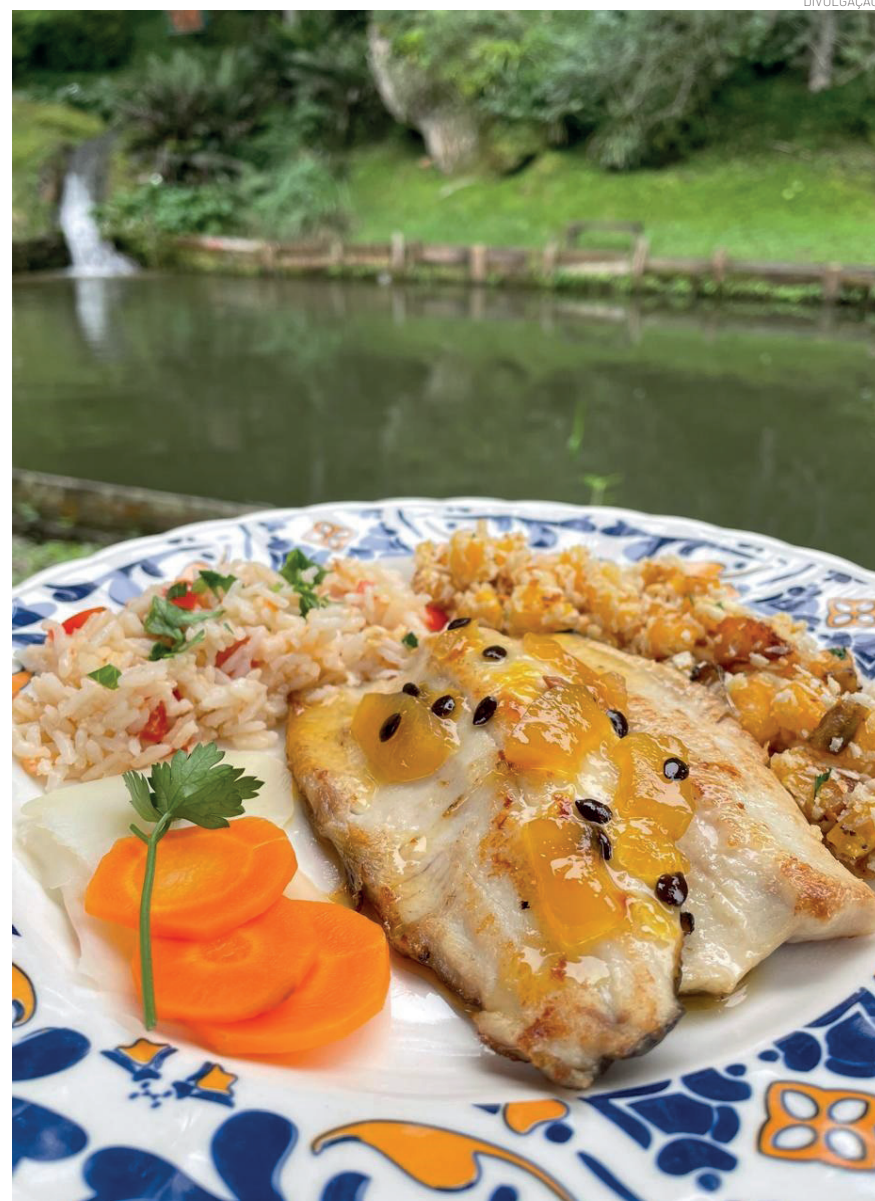
A programação de encerramento contou com grande participação do público nos estabelecimentos participantes