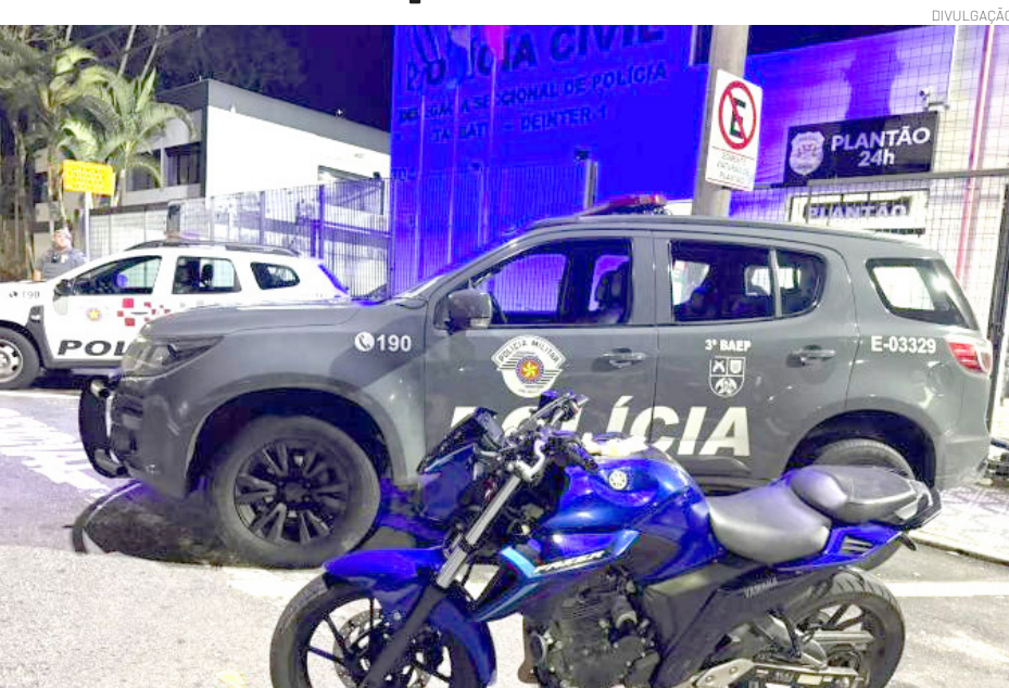
Os suspeitos foram conduzidos à Central de Polícia Judiciária (CPJ) de Taubaté

Um homem foi preso e um adolescente foi apreendido pelo 3º Batalhão de Ações Especiais de Polícia (BAEP) no bairro Feital, em Pindamonhangaba, pelo crime de receptação. Com eles, os policiais recuperaram uma motocicleta que havia sido furtada na cidade de Caçapava em 13 de março de 2026.