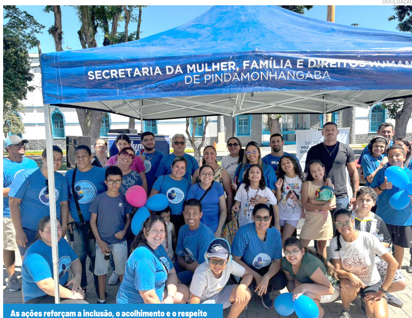
As ações reforçam a inclusão, o acolhimento e o respeito

Ainda no dia 2, também foi realizada a ação simbólica "Visita Azul", marcando a data com o