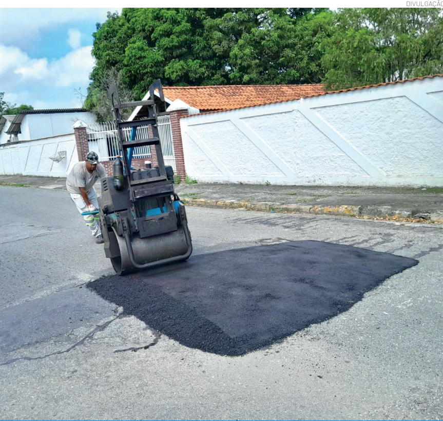
Região do Jardim Eloyna recebeu serviço de tapa-buraco

Outras regiões, como Campininha e Vitória Park, também receberam manutenção, ampliando o alcance das ações.