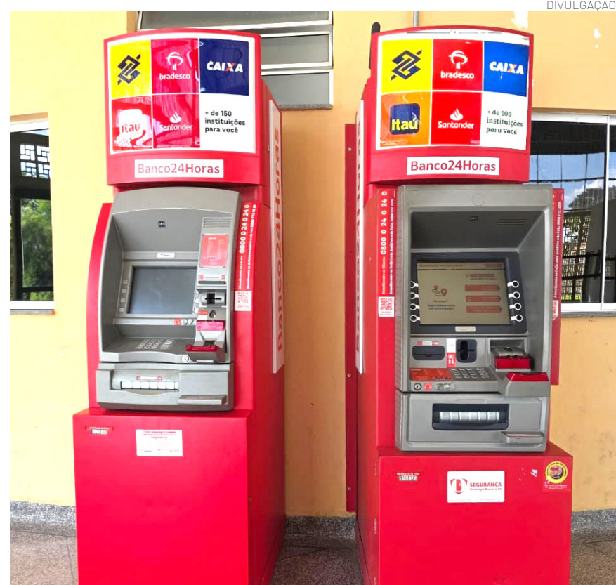
Com o novo caixa, a expectativa é proporcionar agilidade, comodidade e segurança à população