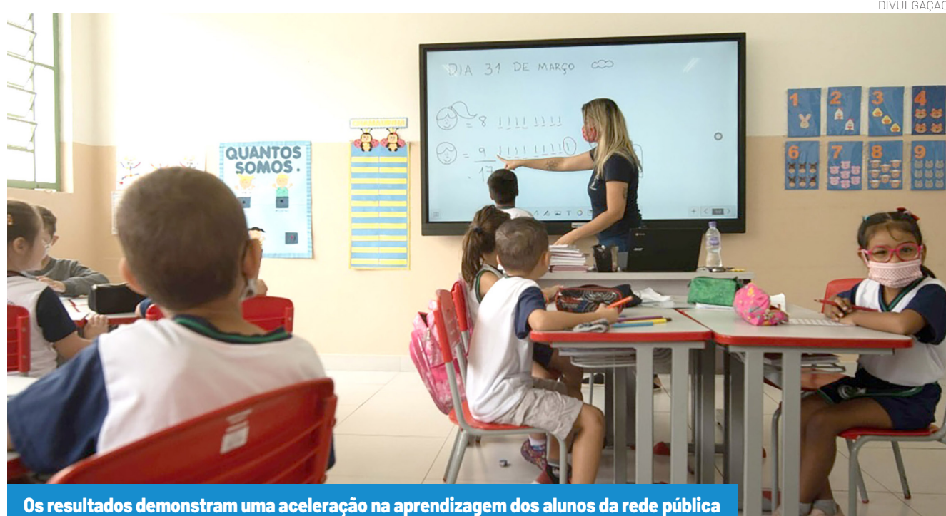
Os resultados demonstram uma aceleração na aprendizagem dos alunos da rede pública

Esse desempenho matemático se reflete em prêmios concretos, com reconhecimento estadual e nacional. Em fevereiro deste ano, o MEC divulgou o resultado que confirmou Pindamonhangaba com o prestigiado Selo Ouro de Alfabetização, concedido às redes que atendem a rigorosos critérios de qualidade. Já no mês de março, o prefeito