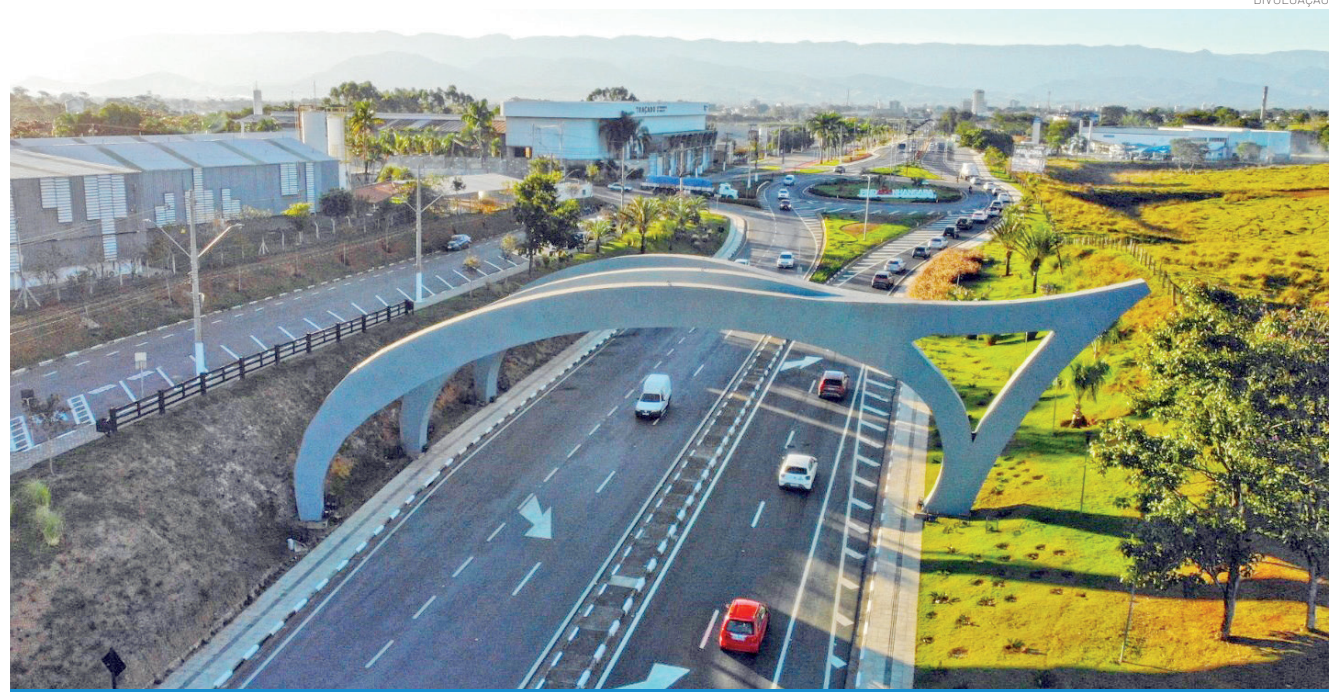
Com a jardinagem sempre em dia, a Nossa Senhora do Bom Sucesso é um dos cartões-postais da cidade