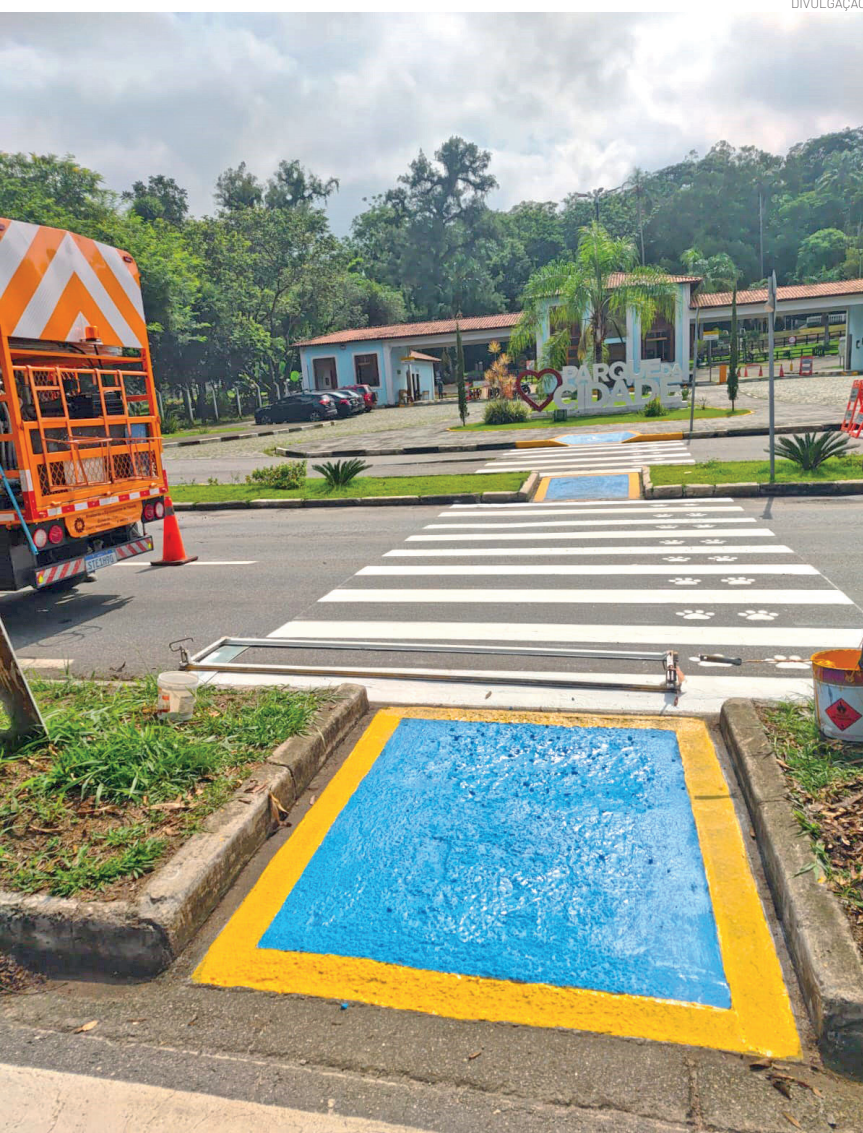
Serviço de sinalização viária em ponto próximo ao Parque da Cidade

Também foram executadas melhorias com guard rail no Anel Viário, próximo à Vila Suíça, além de intervenções na Rua Japão (rotatória das 4 Milhas) e em trechos do Jardim Imperial e região central, organizando melhor o fluxo de veículos.