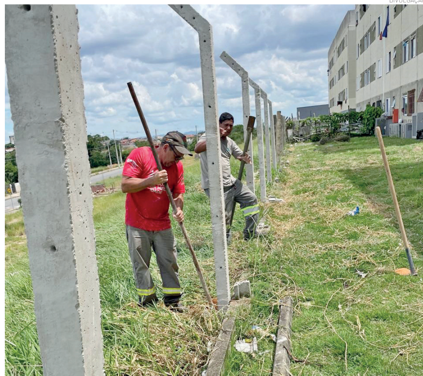
Equipe da Prefeitura procede a instalação de mourões do alambrado

A região do Araretama segue recebendo ações de zeladoria e conservação. A Praça de Eventos Pastor Ezequiel passou por serviços de pintura, valorizando o espaço e deixando o ambiente mais organizado, acolhedor e adequado para o uso da população.