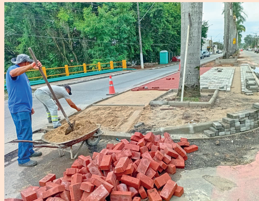
Instalação de bloquetes é uma das últimas etapas do projeto

Além de melhorar a mobilidade, a obra valoriza o entorno e reforça o compromisso da