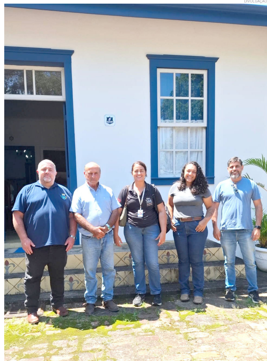
O encontro discutiu a implantação de um novo modelo de formação do agronegócio no município

ço significativo para o município. "Estamos construindo uma oportunidade concreta para os nossos jovens, integrando os ensinos Técnico e Superior em uma área estratégica para a nossa região. O agronegócio exige cada vez mais conhecimento e inovação, e esse projeto prepara profissionais completos, capazes de atuar desde o campo até a gestão, fortalecendo o setor e garantindo novas perspectivas de futuro para Pindamonhangaba", destacou.