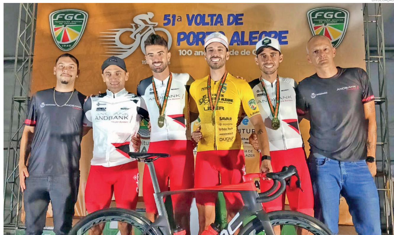
AndBank Cycling Team de Pindamonhangaba conquistou o título individual e o geral por equipes

Depois de duas décadas, a tradicional competição reassumiu seu posto de destaque no calendário nacional e reuniu atletas de alto nível, mostrando que além da tradição, o evento é muito importante para o cenário do ciclismo brasileiro.