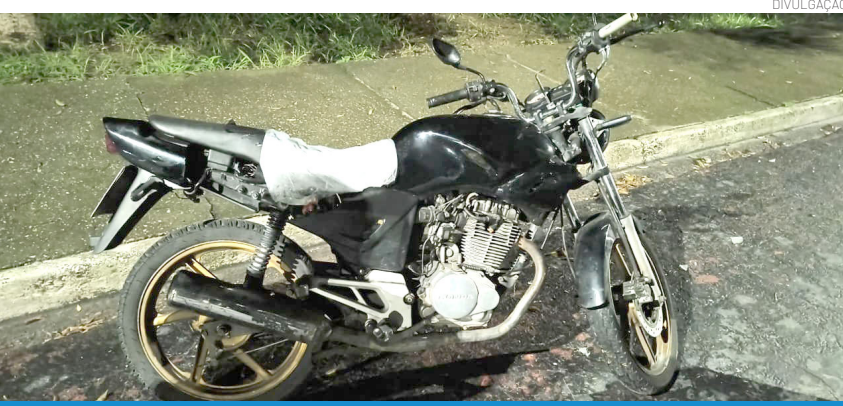
Os elementos acusados de furto fugiram mas a motocicleta foi apreendida e devolvida ao proprietário

Para denunciar a população pode utilizar o protocolo digital 1 DOC, o aplicativo da Ouvidoria E Ouve ou apresentar a denúncia através do canal de whatsapp 3644-5600. Para que as multas sejam feitas é preciso foto ou vídeo que identifique a placa do veículo particular (carro, moto, caminhonete, caminhão).