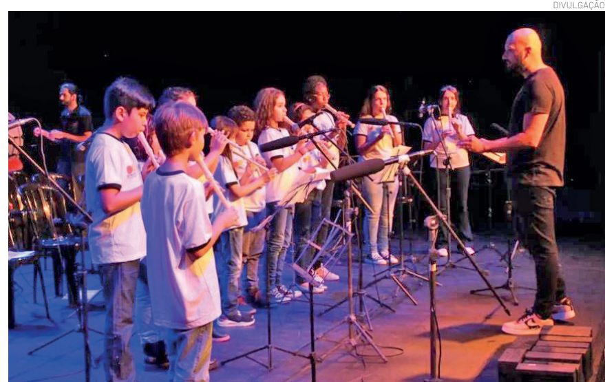
As aulas são voltadas para crianças e adolescentes de 9 a 17 anos

Mais informações podem ser obtidas pelo Instagram @corporacaoeuterpe ou pelo WhatsApp (12) 99226-3933.