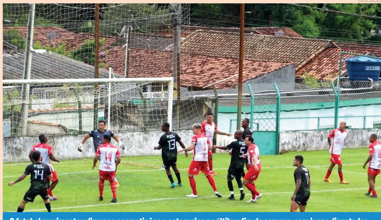
O futebol movimentou diversas competições e categorias no último fim de semana, com jogos disputados

Ainda no domingo, a segunda rodada da Segundona teve Corinthians vencendo o Real Esperança por 2x0; A Mil Por Hora venceu o Cruz Pequena 2 x 1; Sabatinão goleou o Tipês, 8x1; Araretama derrotou o Beta por 2 x 1; Maricá tropeçou e foi derrotado pelo Taipas por 3x2, Andrada e Unidos do Araretama só empataram em 1x1 e a equipe do Bela Vista venceu o Atlético Mombaça por 3x0.