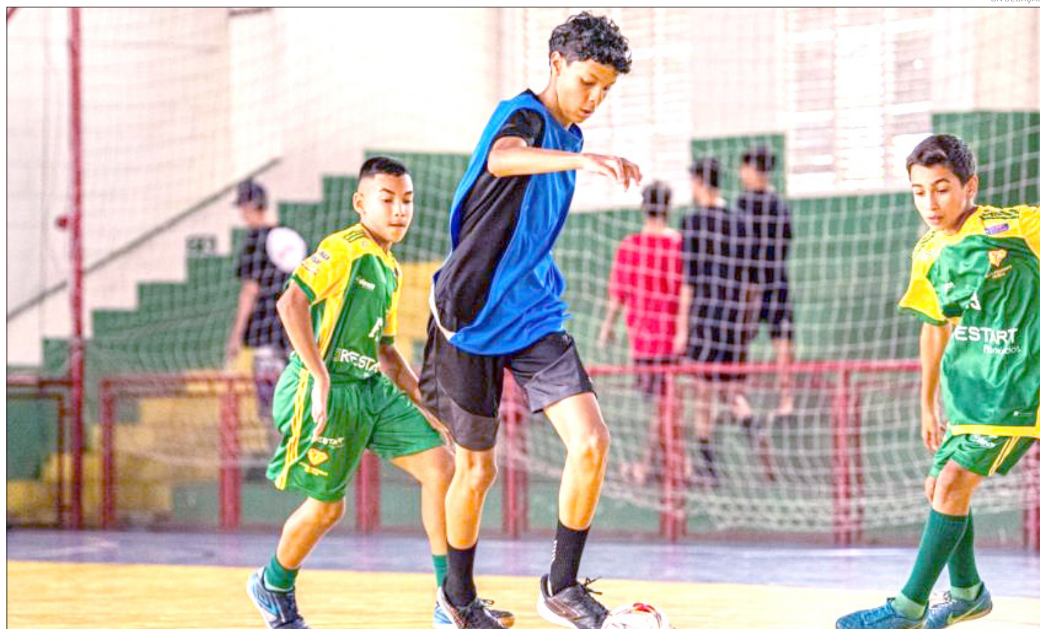
A Escola de Esportes fomenta o bem-estar e a prática esportiva descentralizada

Para mais informações sobre horários específicos de cada modalidade e locais exatos das aulas nos bairros Cidade Nova e Campinas, a recomendação é que o munícipe procure os polos esportivos da região.