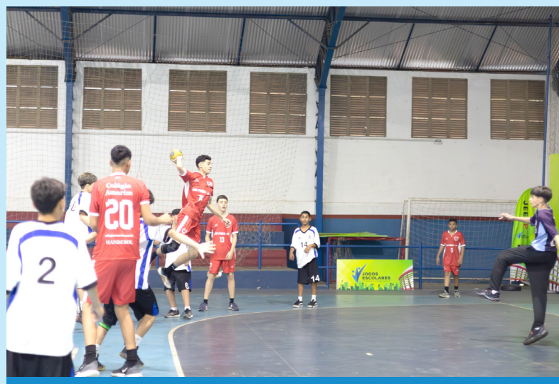
São 15 as modalidades para os Jogos Escolares

O link para o formulário de inscrição encontra-se no regulamento específico de cada modalidade, que pode ser acessado no site www.esportes.sp.gov.br