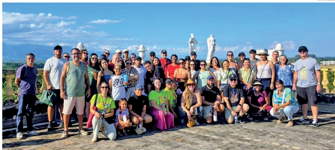
Durante cerca de duas horas, o passeio conduziu os participantes por pontos históricos de Pindamonhangaba

Com duração de cerca de duas horas, o passeio conduziu os participantes por ruas históricas do centro, apresentando curiosidades, fatos marcantes e detalhes arquitetônicos que ajudam a contar a trajetória da cidade. O roteiro incluiu a entrada no Palacete 10 de Julho e no Museu Histórico e Pedagógico Dom Pedro I e Dona Leopoldina, onde o grupo teve acesso a espaços internos