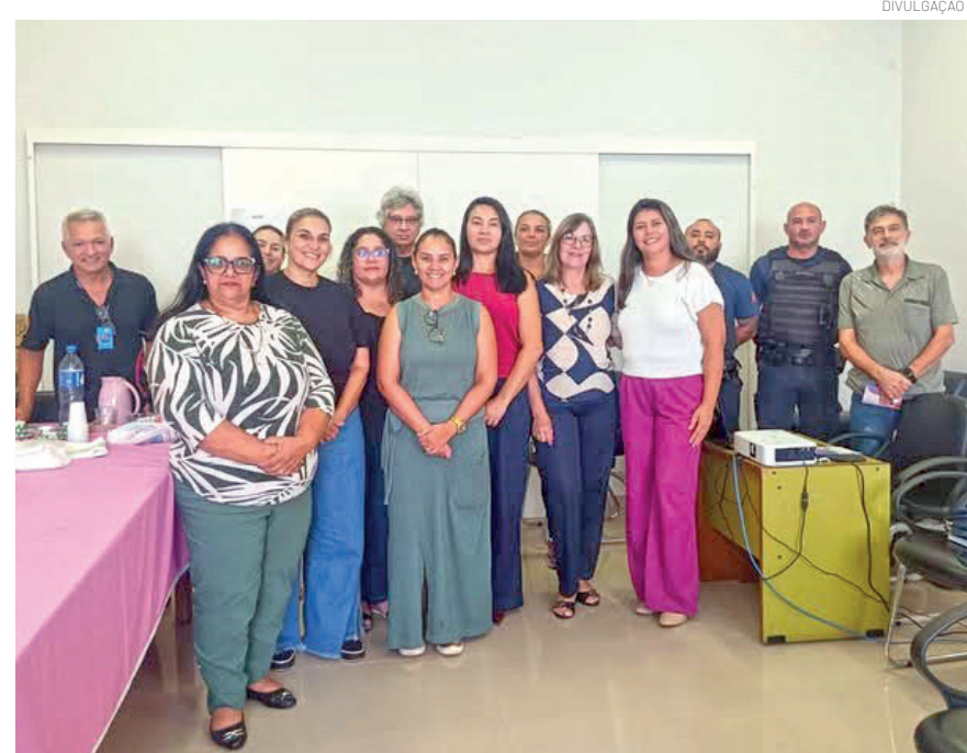
Evento, que aconteceu na manhã da última quinta-feira (26), destacou o trabalho realizado em 2025: nenhum caso de feminicídio em Pinda

sem nenhum caso de feminicídio no município. Além disso salientou a importância da continuidade do trabalho da rede em 2026 e o constante aprimoramento sempre buscando o melhor atendimento às vítimas de violência. A pauta incluiu discussões sobre melhorias no fluxo de encaminhamento, acolhimento e proteção das mulheres vítimas de violência, reafirmando o compromisso da Rede Flor de Lótus com a garantia de direitos e a construção de uma rede de apoio cada vez mais efetiva.