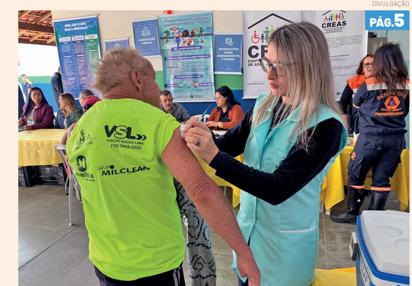
Neste sábado (28), das 9 às 12 horas, a região do Triângulo recebe o programa Prefeitura Perto de Você, em sua primeira edição de 2026. A ação acontecerá na Escola Municipal Profª. Ruth Azevedo Romeiro