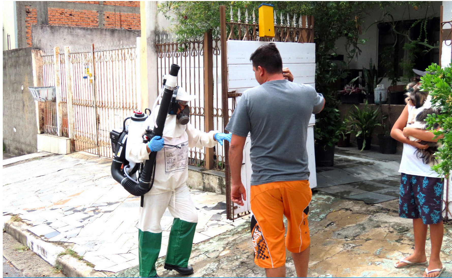
A colaboração da população é fundamental para o combate ao transmissor

Os bairros com atenção intensificada são Araretama, Jardim Regina, Moreira César, Triângulo e Goiabal, conforme levantamento técnico das áreas com maior necessidade de intervenção. As ações têm como objetivo eliminar focos do mosquito Aedes Aegypti , reduzir o risco de transmissão das doenças e fortalecer as medidas de prevenção no município.