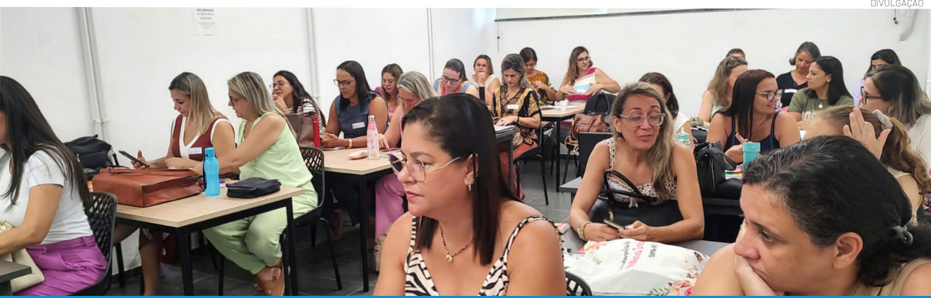
O programa fortalece as práticas de linguagem oral, leitura e escrita

A Secretaria de Educação da Prefeitura de Pindamonhangaba iniciou, na quarta-feira (25), a formação do ProLEEI – Programa Leitura e Escrita na Educação Infantil, iniciativa do Ministério da Educação (MEC), lançada em 2024 no âmbito do Compromisso Nacional Criança Alfabetizada.