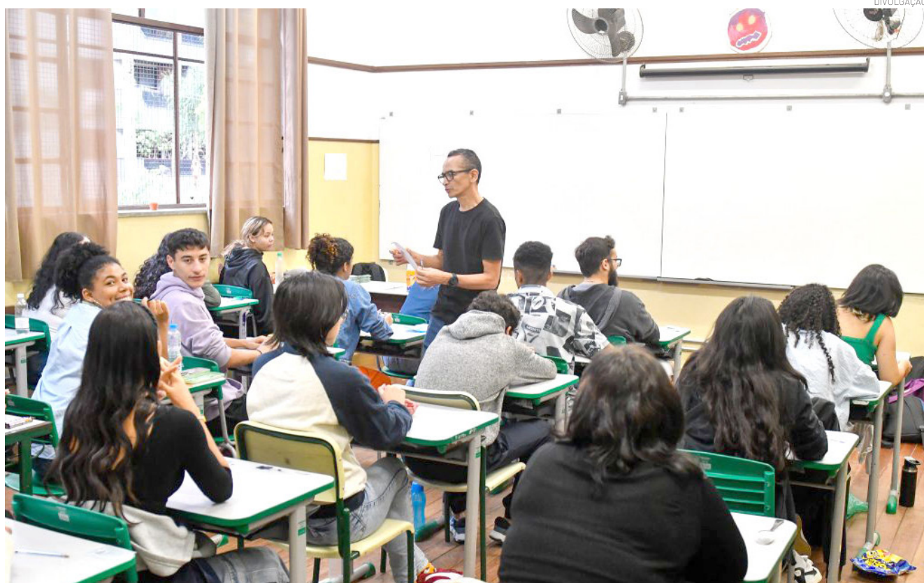
Cadastro é voltado a profissionais interessados em atuar nos Itinerários de Formação Técnica Profissional da rede estadual

As inscrições devem ser realizadas por meio da plataforma oficial: https://bancodetalentos.educacao.sp.gov.br/