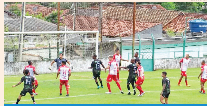
Jogos em diversas competições prometem fim de semana movimentado

Ainda no domingo pela fase de mata-mata, a Copa regional chega a sua fase pelas quartas de final nos jogos de ida: o Estufa recebe o Vila São José às 10h30 no estádio do Colorado, Ferroviária encara o Vila São Geraldo às 10h15 no estádio do Ferroviária, Corinthians enfrenta o Colorado às 10h30 no estádio do Corinthians e fechando a rodada o Capituba recebe o Rebento às 10h15 no estádio do Tipês.