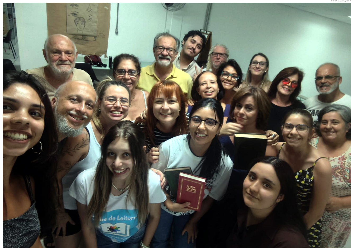
O encontro explorou as conexões de uma das canções da banda Legião Urbana

Após contribuir com o debate, compartilhou seu entusiasmo pela leitura de "O Retrato de Dorian Gray", obra de Oscar Wilde, que será tema do próximo encontro, agendado para o dia 19 de março, às 19h, na Biblioteca Ver. Rômulo Campos D'Arace.