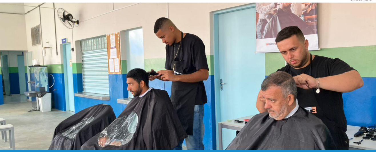
A iniciativa reúne diversas secretarias com o objetivo de levar atendimento aos bairros