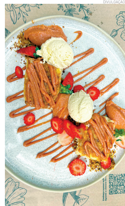
A queijadina servida com creme de goiabada, farofa de fubá e sorvete de coco, exclusiva do restaurante é um show à parte

tação. Um dos momentos mais marcantes é a costela, cortada e finalizada à mesa. Já a “Paella da Montanha”, prato vencedor do Prêmio Feito em São Paulo, é preparada com arroz preto pia-