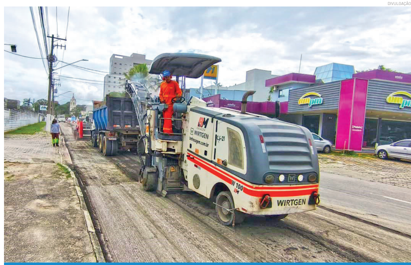
Após a fresagem, as equipes da Prefeitura vão ajustar o piso e realizar o recapeamento asfáltico