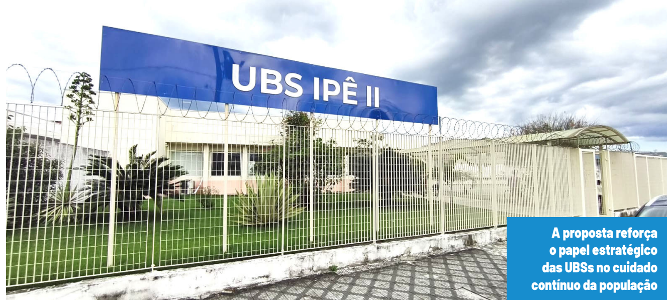
A proposta reforça o papel estratégico das UBSs no cuidado contínuo da população

Ele explicou que "a iniciativa começou como projeto piloto, permitindo à Secretaria de Saúde avaliar a demanda, a adesão da