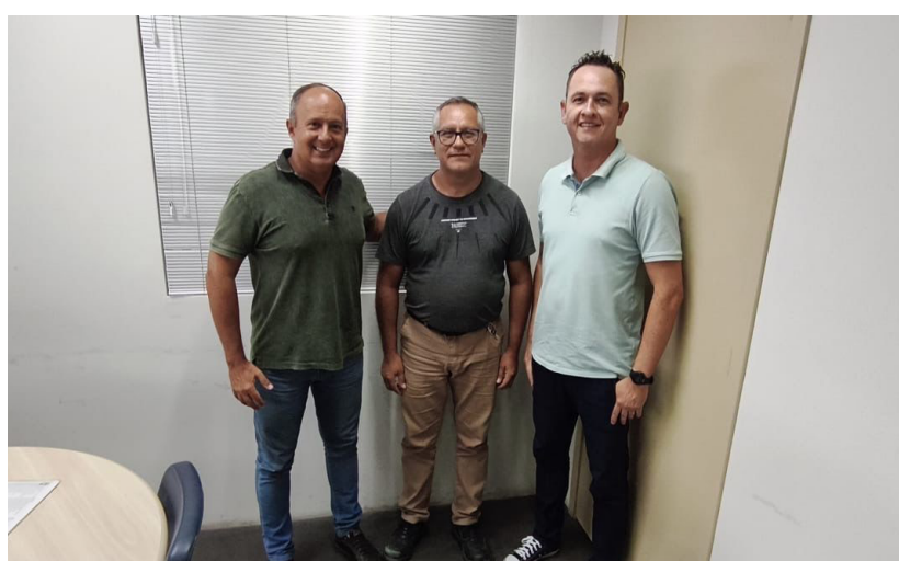
O evento será realizado no dia 3 de abril