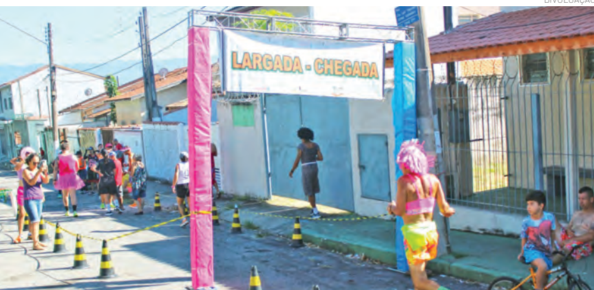
Presença das famílias