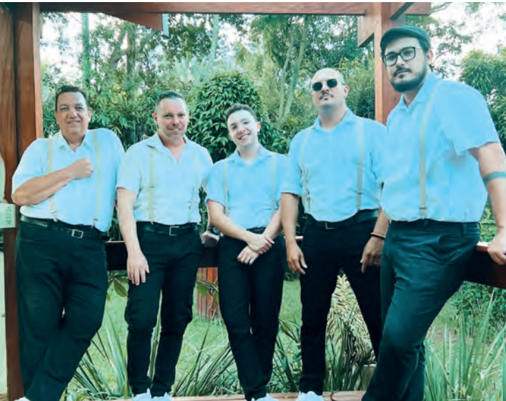
A Banda Samoa é a atração do domingo, a partir das 20h.

A Cheirin Bão fica dentro do Shopping Pátio Pinda e funciona todos os dias, de segunda a sábado, das 10h às 22h; e aos domingos, das 11h às 21h.