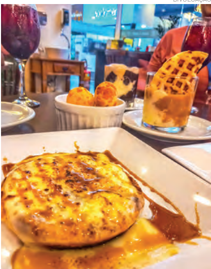
Paixão pela culinária mineira