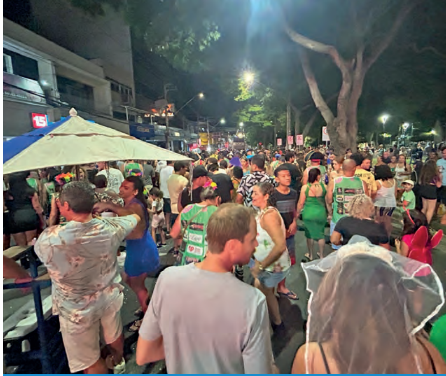
O H'lera desfila às 20 horas, saindo da rua Marechal Deodoro

O H'lera desfila às 20h, na segunda-feira (16), com saída da Rua Marechal Deodoro da Fonseca (Rua do Museu) e chegada próximo ao viaduto central, em uma noite cheia de ritmo e diversão.