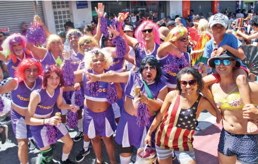
O Bloco das Dondocas sai av. Fernando Prestes neste sábado, às 10 horas