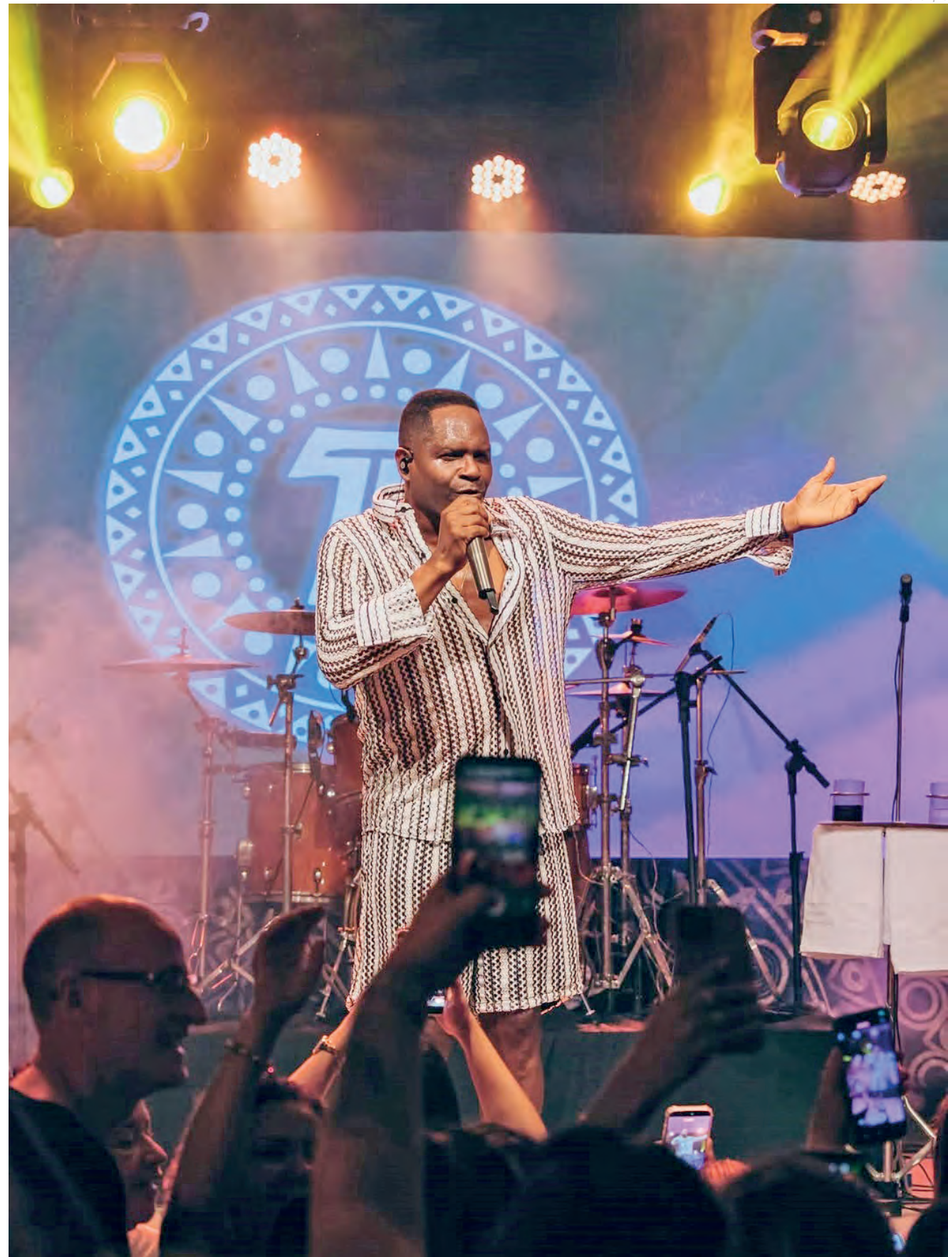
No sábado (14), o vocalista do Araketu se apresenta no Parque da Cidade, com seu repertório de hits carnavalescos