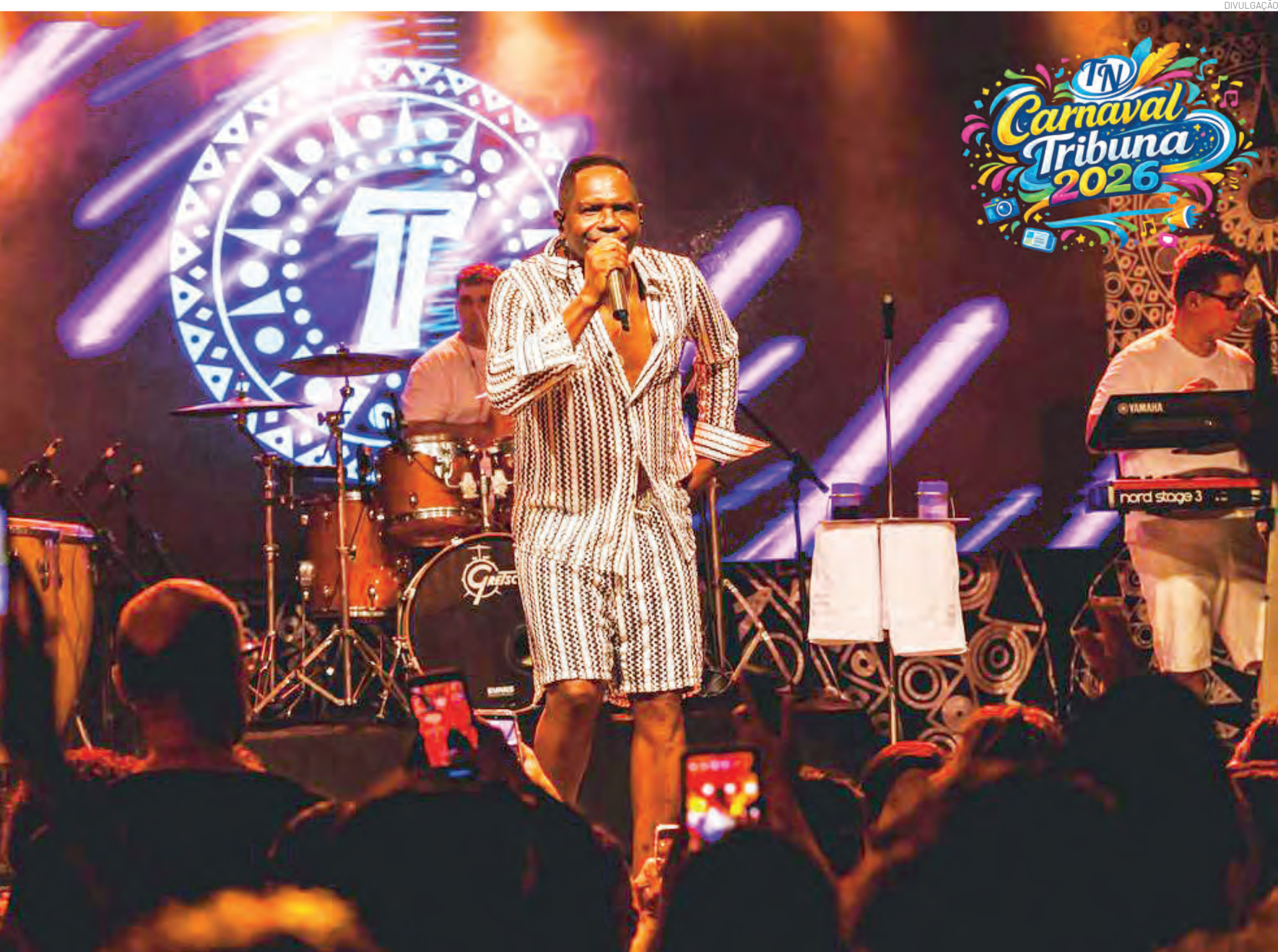
Com seu repertório de hits carnavalescos da década de 90, a vocalista do Araketu se apresenta no Parque da Cidade neste sábado (14)

O Carnaval de Pindamonhangaba promete agitar a cidade com muita música, cores e animação. A programação contará com blocos de rua, apresentações musicais e atrações para toda a família. A expectativa é de grande público, reunindo moradores e turistas em dias de muita festa. Além da diversão, o evento também impulsiona o comércio local e valoriza a cultura popular. Pinda se prepara para viver mais uma edição marcada por alegria e tradição.