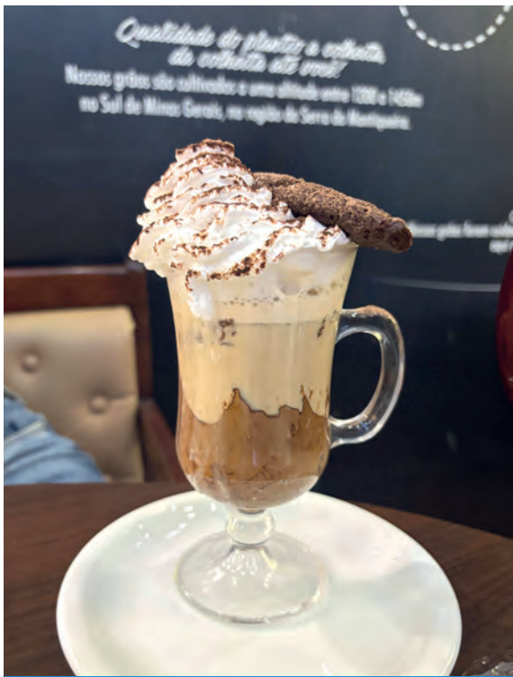
Para um happy hour entre amigos, bebidas refrescantes, com ou sem café, vão surpreender o paladar

rial e sofisticada. O formato da taça concentra aromas, melhora a percepção de sabores e realça a cor do grão.