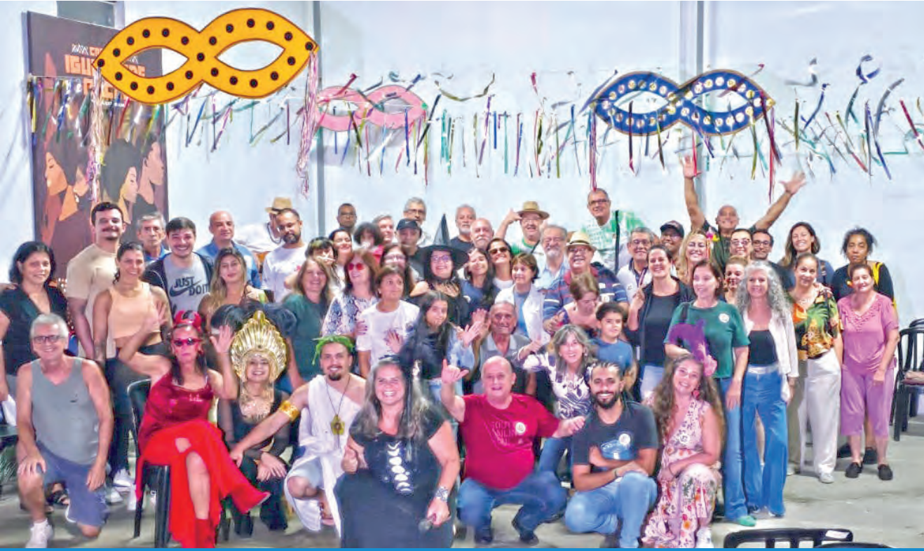
A Casa da Igualdade Racial recebeu encontro inaugural do projeto Memória da Alegria