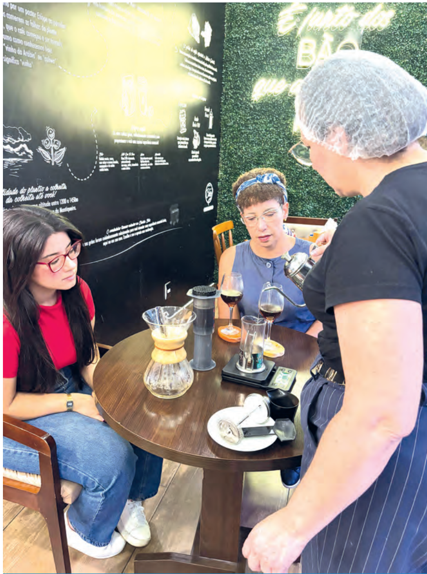
Os cafés especiais, preparados na hora, são uma atração à parte.

Além dos pratos quentes e cafés especiais, o cardápio inclui sobremesas que são verdadeiras delícias. A variedade de opções, com bolos, tortas, doces e sorvetes, atende aos gostos mais exigentes, e a cada