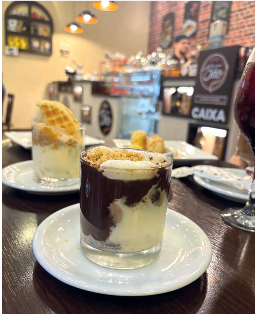
Nas sobremesas, a variedade de opções, com bolos, tortas, doces e sorvetes, atende aos gostos mais exigentes

estação, lançamentos sazonais são adicionados.