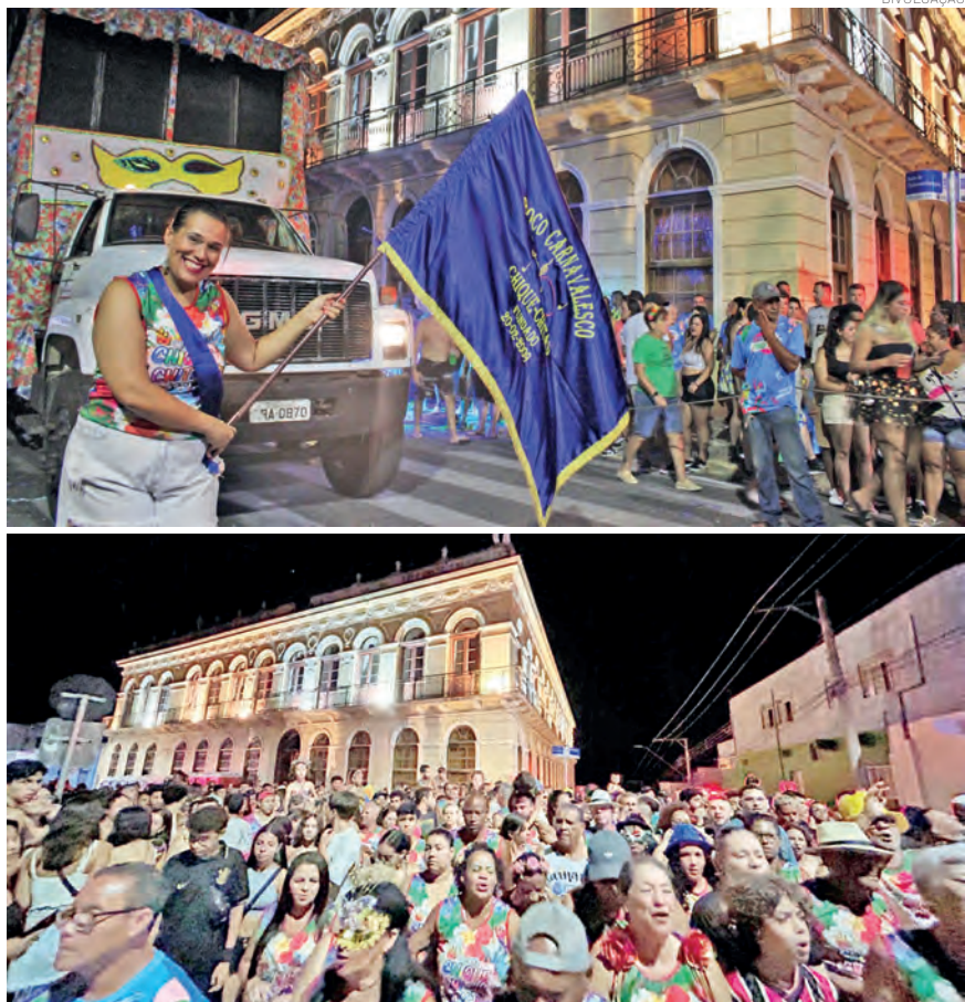
O Chique-Chitas desfila na segunda-feira (16), às 19 horas

do carnaval de Pindamonhangaba. Com 17 anos de trajetória e 15 desfiles realizados, o bloco cresceu sem perder a essência alegre e vibrante. Neste ano, o Chique-Chitas sai na segunda-feira (16), às 19h, com saída da Rua Marechal Deodoro da Fonseca (Rua do Museu) e chegada próximo ao viaduto central.