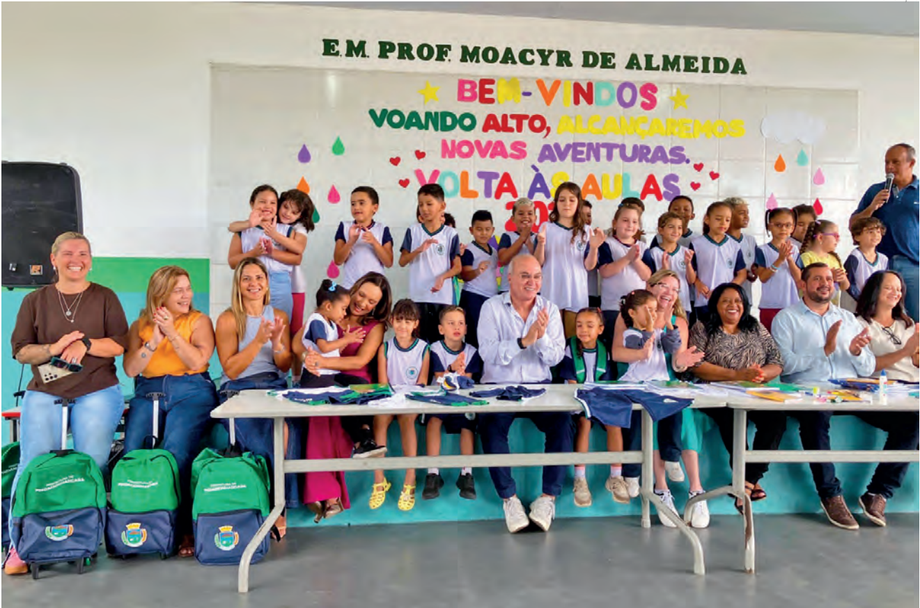
Entre uniformes, mochila e kits de material escolar, o investimento soma R$ 9,9 milhões