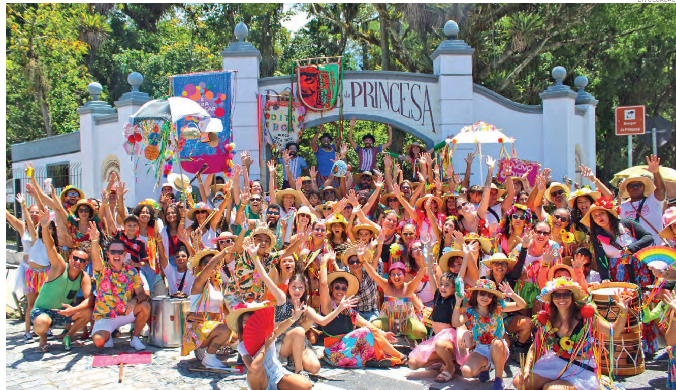
A terceira edição do Folia na Vila promete muita animação no Bosque da Princesa, com música e área gastronômica