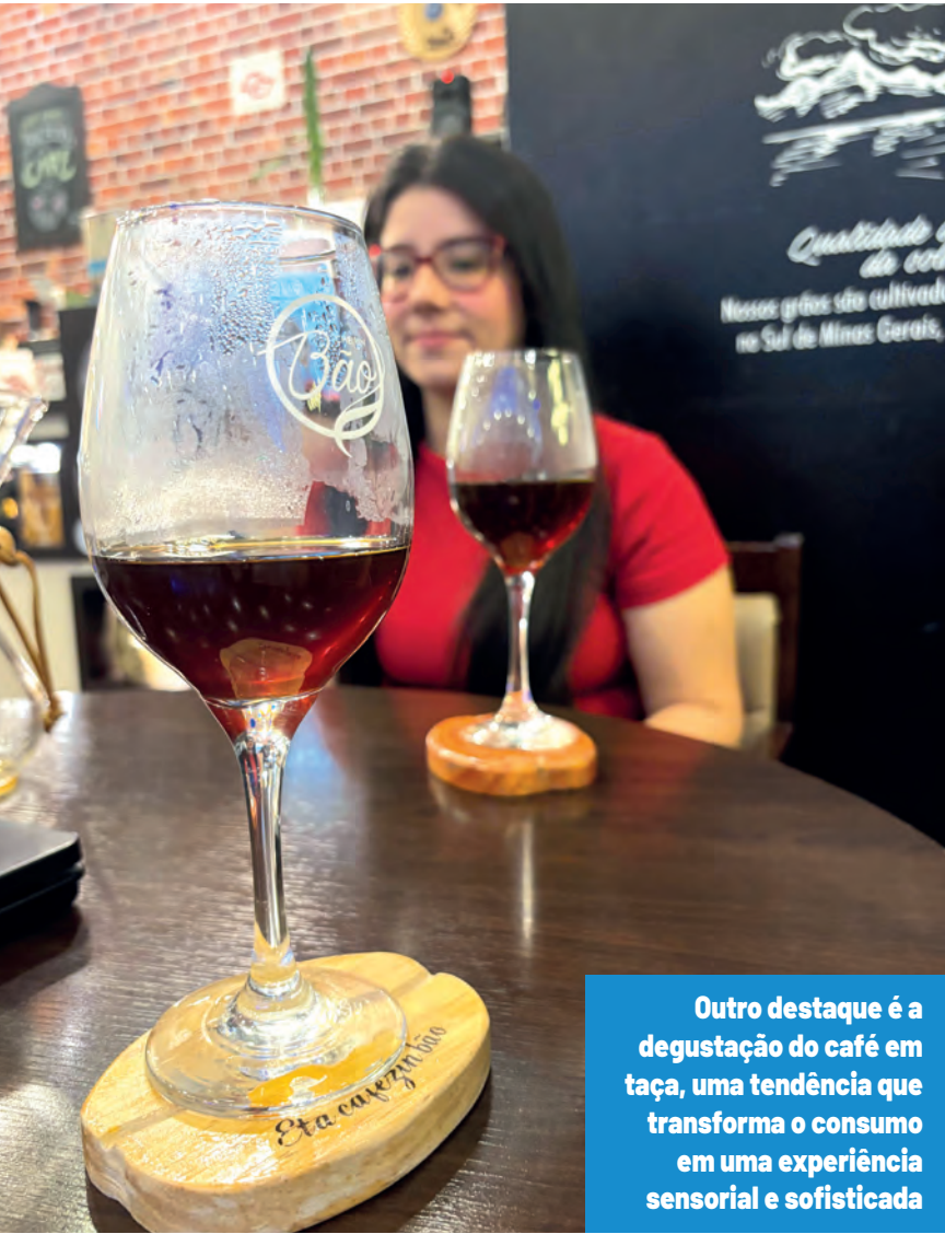
Outro destaque é a degustação do café em taça, uma tendência que transforma o consumo em uma experiência sensorial e sofisticada

oportunidade de experimentar cafés que vão além do convencional. No cardápio são oferecidos preparos com filtro de papel tradicional, coador de pano, prensa francesa, aeropress, e sifão, entre outros. Outro destaque é a degustação do café em taça, uma tendência que transforma o consumo em uma experiência senso-