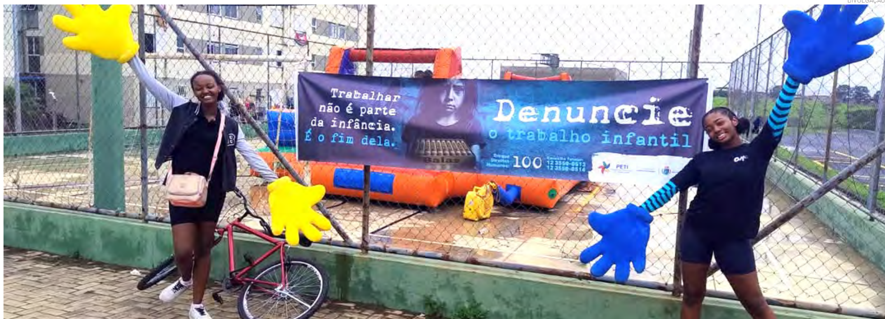
O PETI vai reforçar a proteção de crianças e adolescentes durante o Carnaval

A equipe estará presente na Folia da Vila, no Bosque da Princesa, com orientações ao público. Em caso de suspeita, denuncie pelo Disque 100 ou procure o Conselho Tutelar.