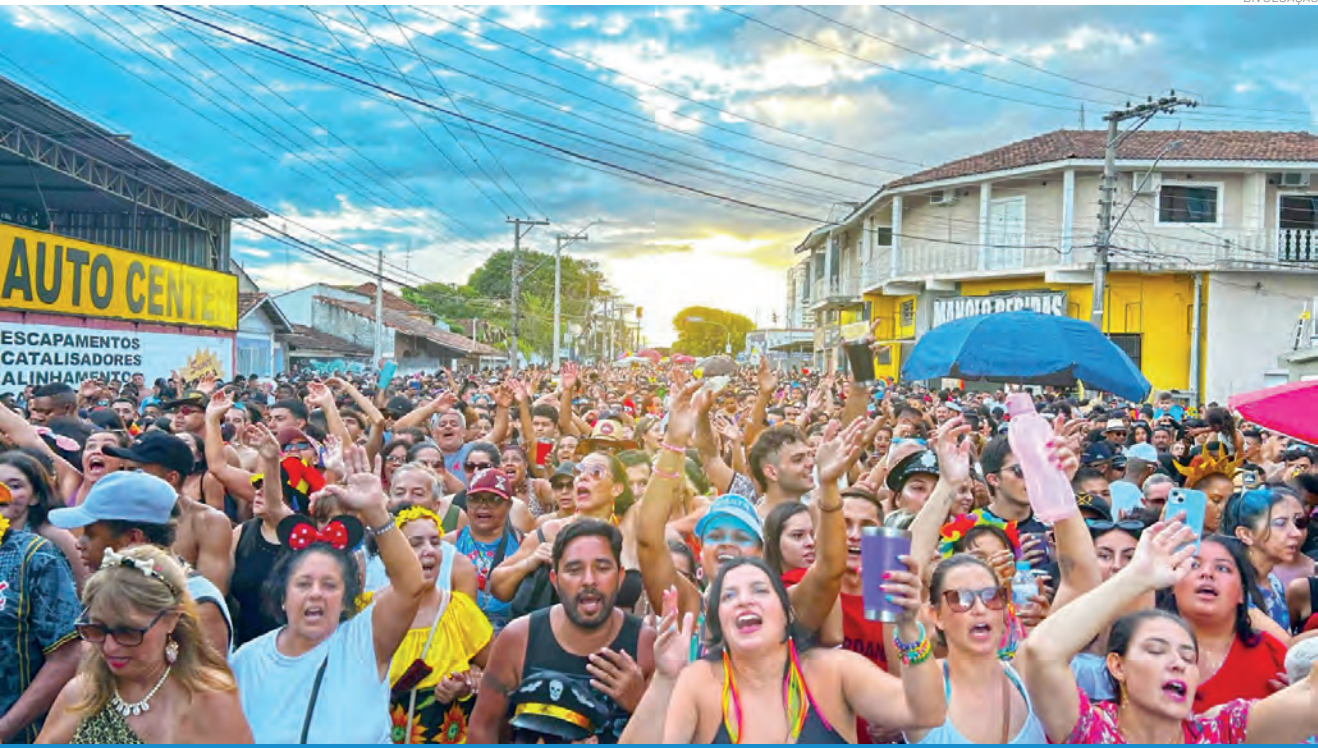
Encerrando o Carnaval de Pindamonhangaba, o Bloco do Barbosa desfila na terça-feira (17), a partir das 15 horas