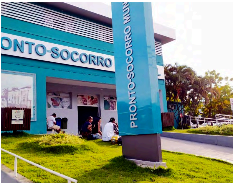
O Pronto Socorro Municipal

CE João do Pulo e CE Zito: aberto apenas para Rebanhão.