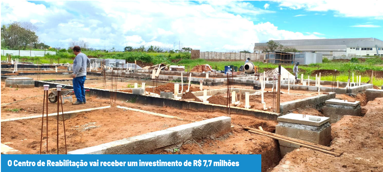
O Centro de Reabilitação vai receber um investimento de R$ 7,7 milhões