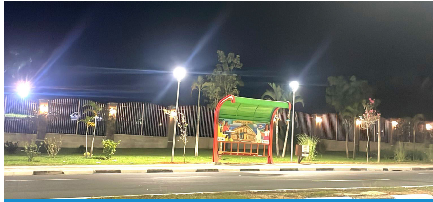
O registro de ocorrências contribui para agilizar os atendimentos e garantir maior segurança

Lâmpadas queimadas, apagadas à noite, piscando, com baixa intensidade ou até acesas durante o dia podem passar despercebidas por um tempo se ninguém registrar a ocorrência. Na prática, isso afeta a rotina de quem mora e circula pela cidade: ruas mais escuras aumentam a sensação de insegurança, dificultam