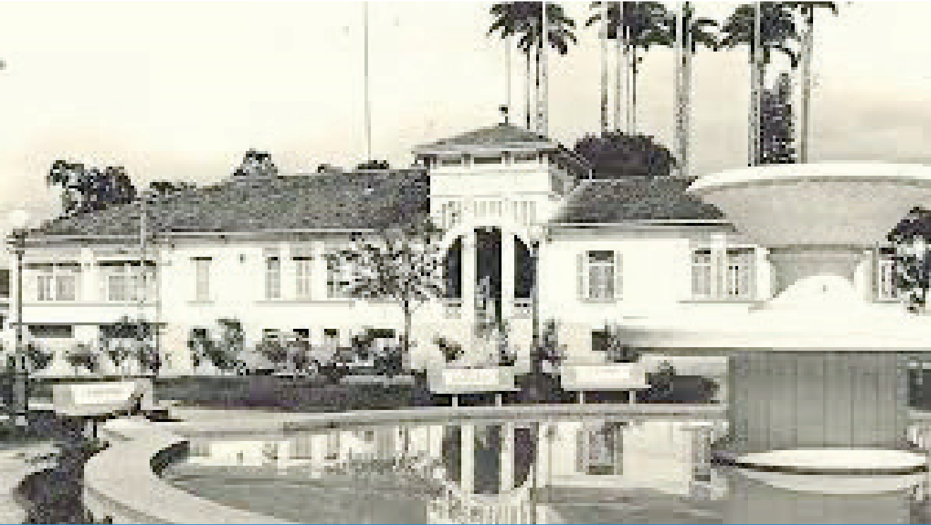
Clube Literário quando se encontrava instalado ao lado da praça Monsenhor Marcondes

será uma realidade a consecução desses ideais, quando sabemos que se encontram à frente dessa empresa, homens de iniciativa e de mentalidade progressista.”