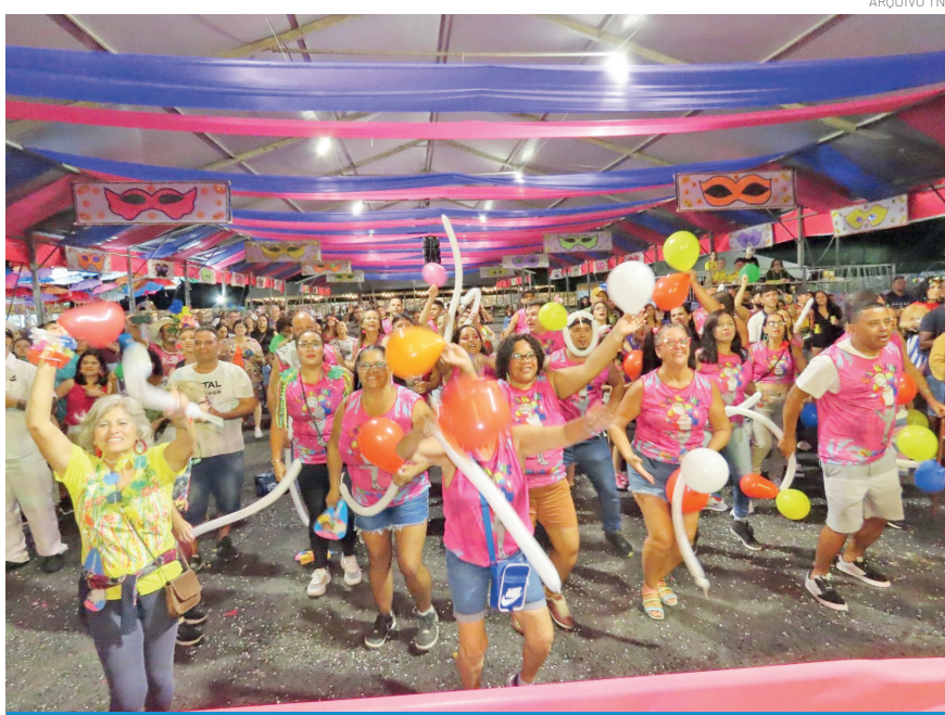
Foram selecionadas 20 marchinhas para a fase classificatória

Tradicional no calendário cultural da cidade, o Festival de Marchinhas de Pindamonhangaba atrai muitas famílias, moradores e visitantes, que prestigiam apresentações cheias de humor, crítica social e referências ao cotidiano. A expectativa é de mais uma edição marcada por grande participação do público e celebração da cultura popular.