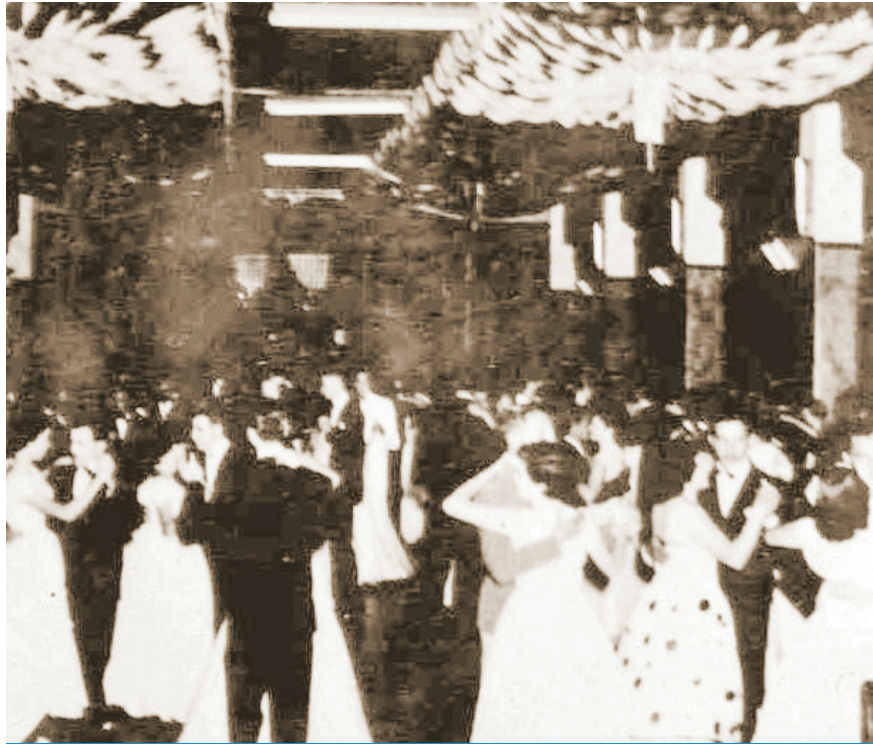
Basquete Clube possuía um dos salões de baile mais arejados da cidade