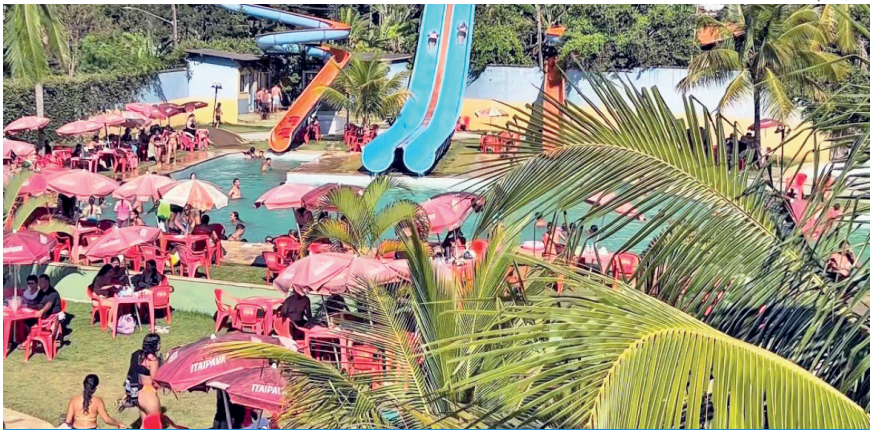
O Parque Aquático Happy Kids também fez parte do roteiro

Visitantes também elogiaram a experiência gastronômica oferecida.