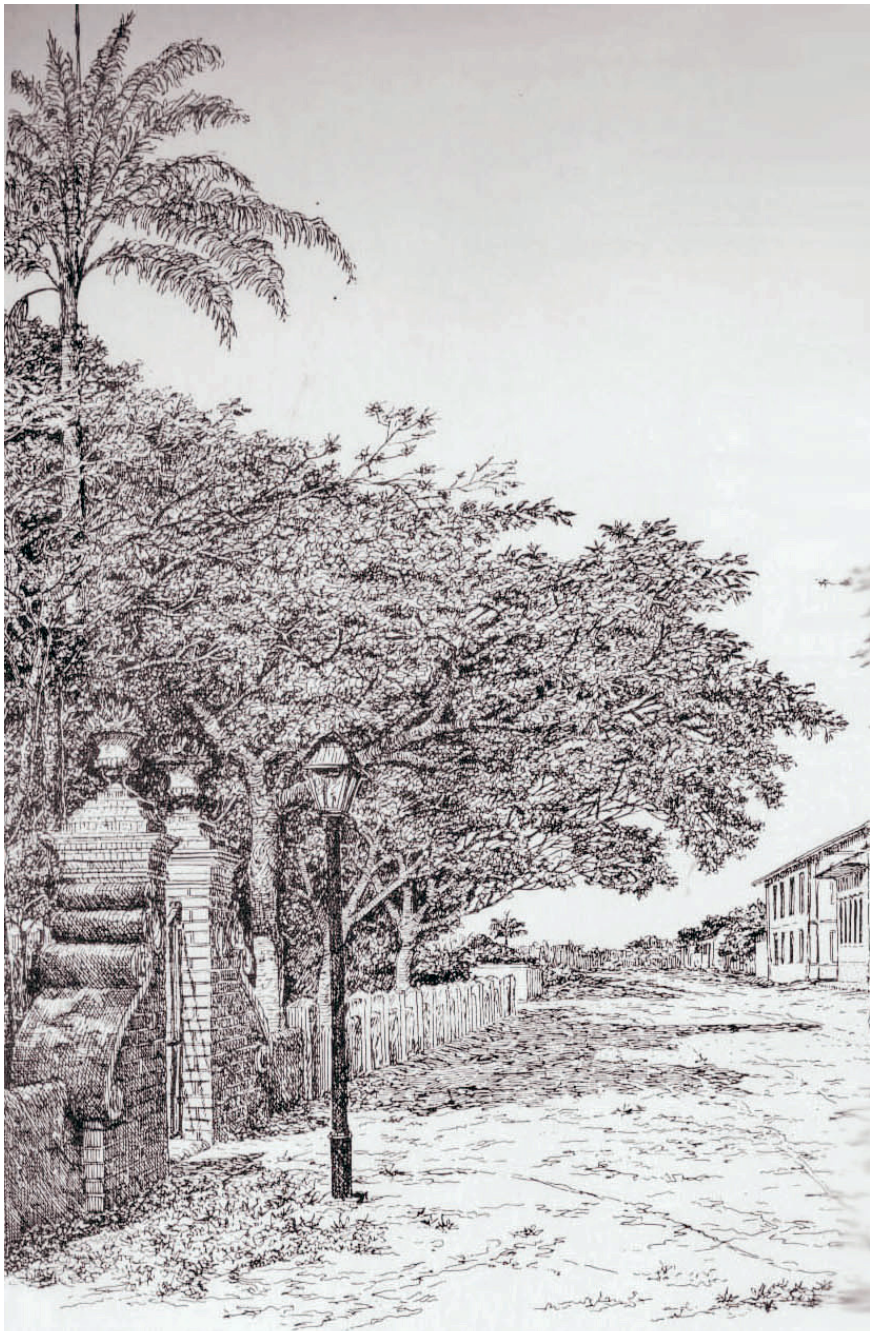
Portão de entrada do Bosque da Princesa na rua Dr. Monteiro de Godoy (Pinda antiga segundo bico de pena de Renato San Martín)

Infelizmente, nosso Clube Literário e Recreativo teve interrompida sua gloriosa trajetória em 2003. Época em que se encontrava muito bem instalado na rua Marechal Deodoro. No ano 2000, quando completara 120 anos, dispunha de piscinas, sau-