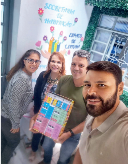
Iniciativa conta com apoio do Jornal Tribuna do Norte e da Secretaria de Cultura e Turismo, por meio da Biblioteca Municipal

Em diálogo com esse espaço já existente, o projeto Cura Literária levou suas