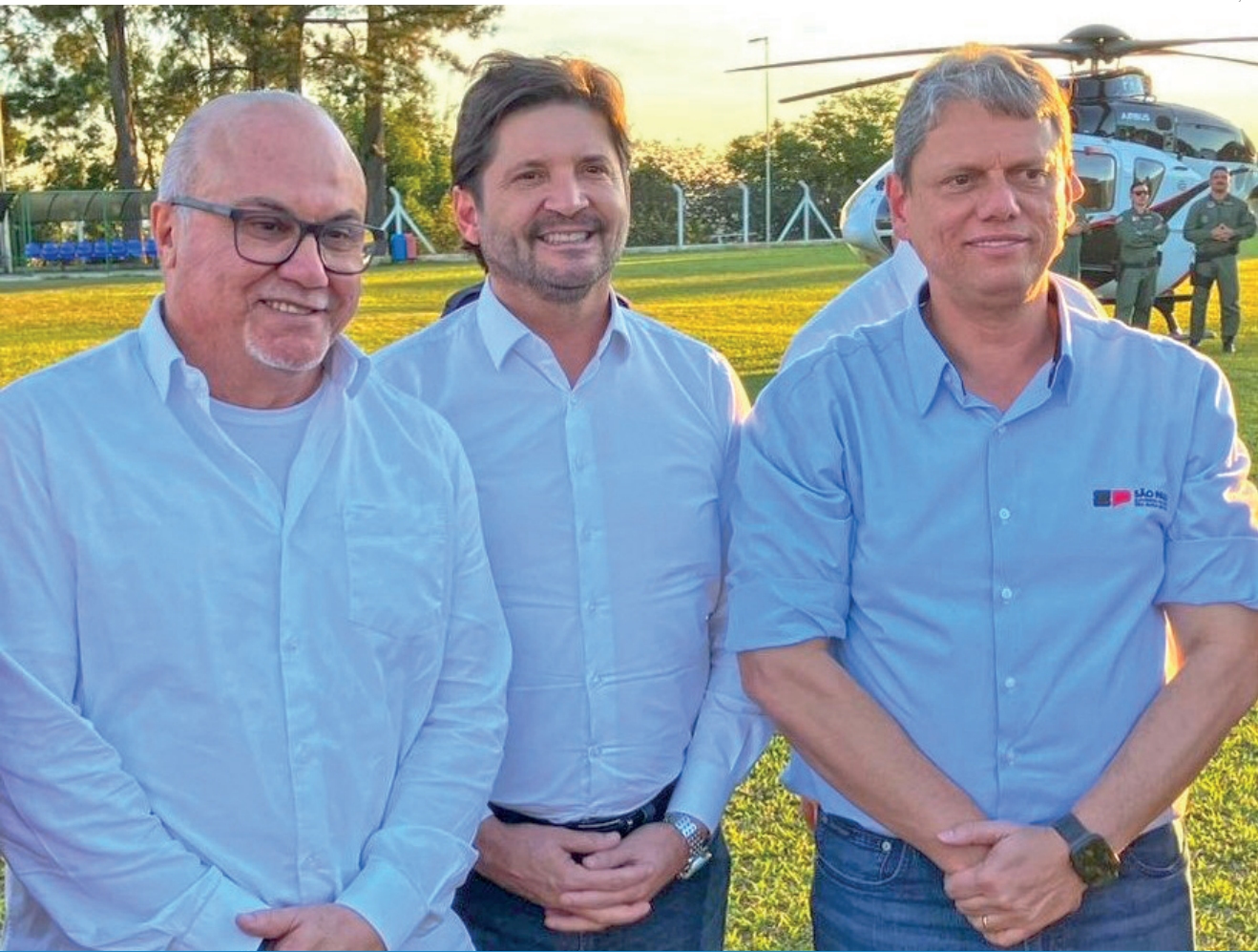
O prefeito Ricardo Piorino, deputado André do Prado e o governador Tarcísio de Freitas