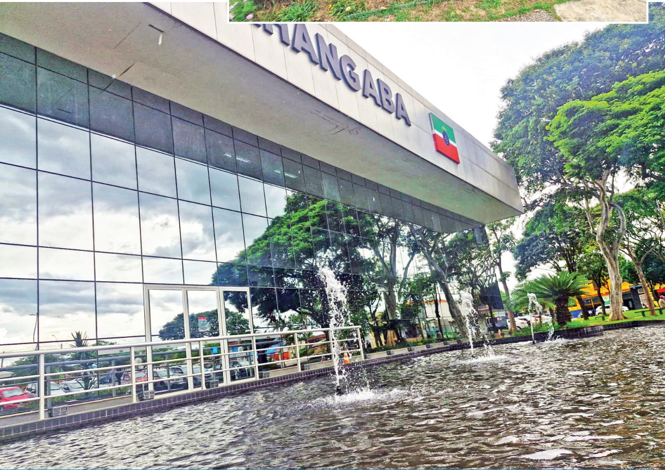
Chafariz foi instalado no espelho d’água localizado na frente da fachada da Prefeitura de Pinda