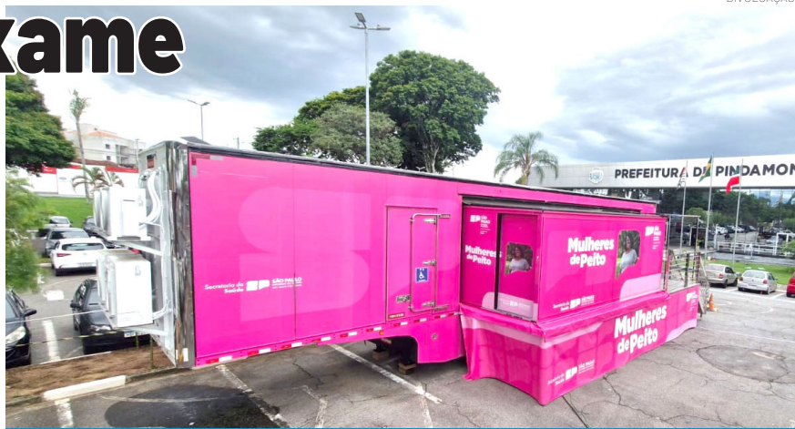
A carreta amplia o acesso ao exame e reforça o compromisso com a prevenção

O prefeito Ricardo Piorino destacou a importância da parceria com o Governo do Estado e agradeceu ao governador Tarcísio de Freitas pelo envio da carreta ao município. Segundo ele, a