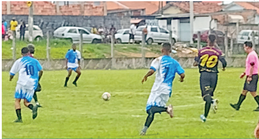
Tradicional competição abre o calendário do futebol na cidade

a vencer, bateu o Colorado por 3x2. Em outro jogo com seis gols convertidos, Capituba só empatou com Estufa pelo placar de 3x3. Vila São José e Ferroviária empataram em 1x1. Já o Vila São Geraldo e Corinthians ficaram no 0x0, mesmo placar de 100Chance e Independente.