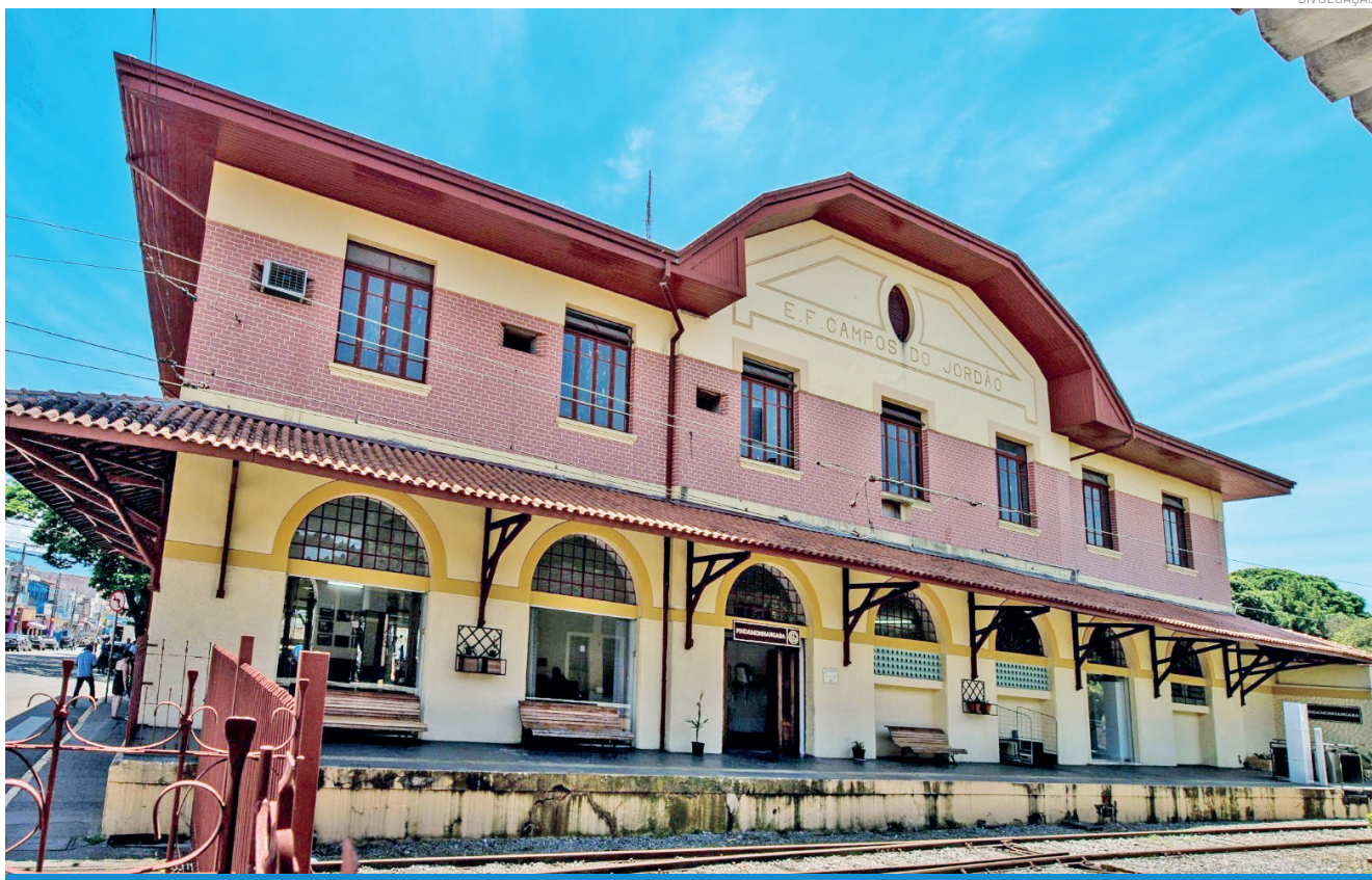
Documento prevê investimento de R$ 315 milhões na Estrada de Ferro Campos do Jordão ao longo do contrato

A Prefeitura informa que a Secretaria Municipal de Cultura e Turismo acompanha todas as etapas do processo de concessão, reforçando a importância da