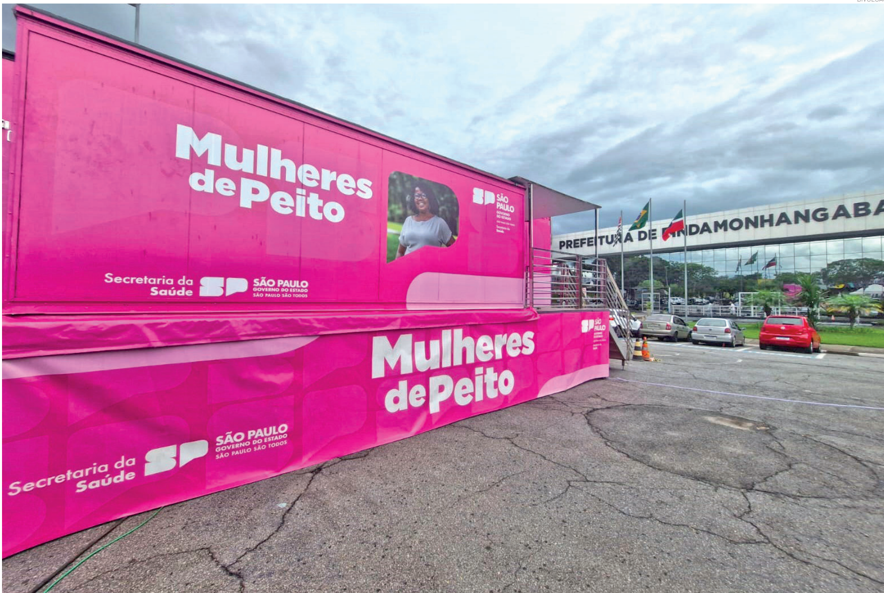
Os atendimentos da carreta acontecem entre os dias 20 e 31 de janeiro, de segunda a sexta-feira das 8 às 17 horas, e aos sábados das 7 às 11 horas