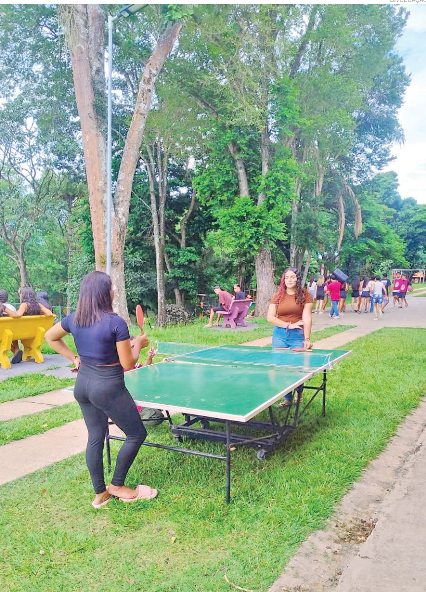
Entre as diversas opções de lazer estão as atividades esportivas

tituições cadastradas no CMDCA (Conselho Municipal dos Direitos da Criança e do Adolescente) e no CMAS (Conselho Municipal de Assistência Social) que promovem