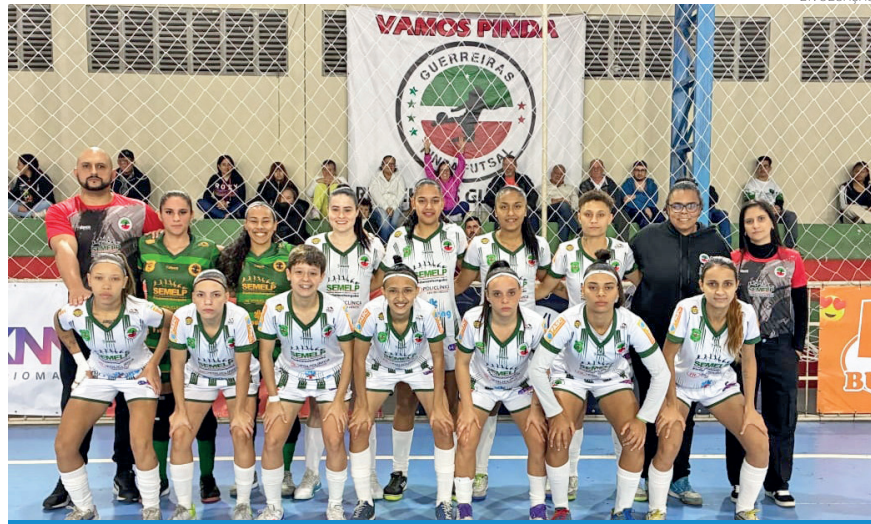
Equipe retorna aos treinos hoje (20), a partir das 19h30