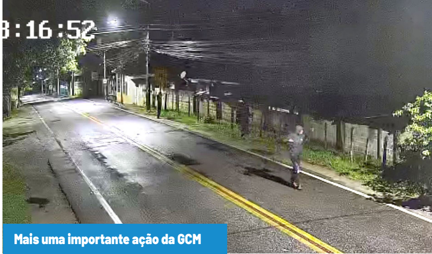
Mais uma importante ação da GCM

Com a chegada da viatura, os suspeitos fugiram em direção a uma área de mata. Durante a ação, os agentes conseguiram