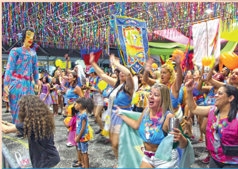
Resultado da pré-seleção sai até 28 de janeiro