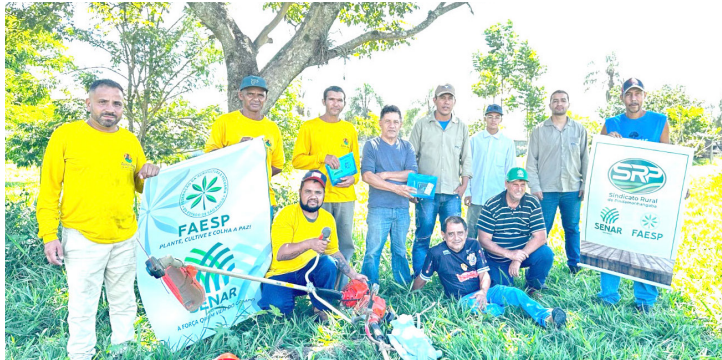
Os cursos geram emprego e renda para a zona rural do município

A escolha dos cursos e programas é feita a partir das necessidades e demandas locais. Dessa forma, a equipe do Sindicato Rural, junto à coordenação do Senar, tem todo o cuidado com a programação, para oferecer cursos e programas que se adaptem às necessidades do produtor rural, funcionários de propriedades rurais e pessoas da comunidade.