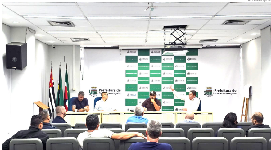
A operação tem como objetivo organizar e retirar de postes os cabos e fiações soltas e penduradas