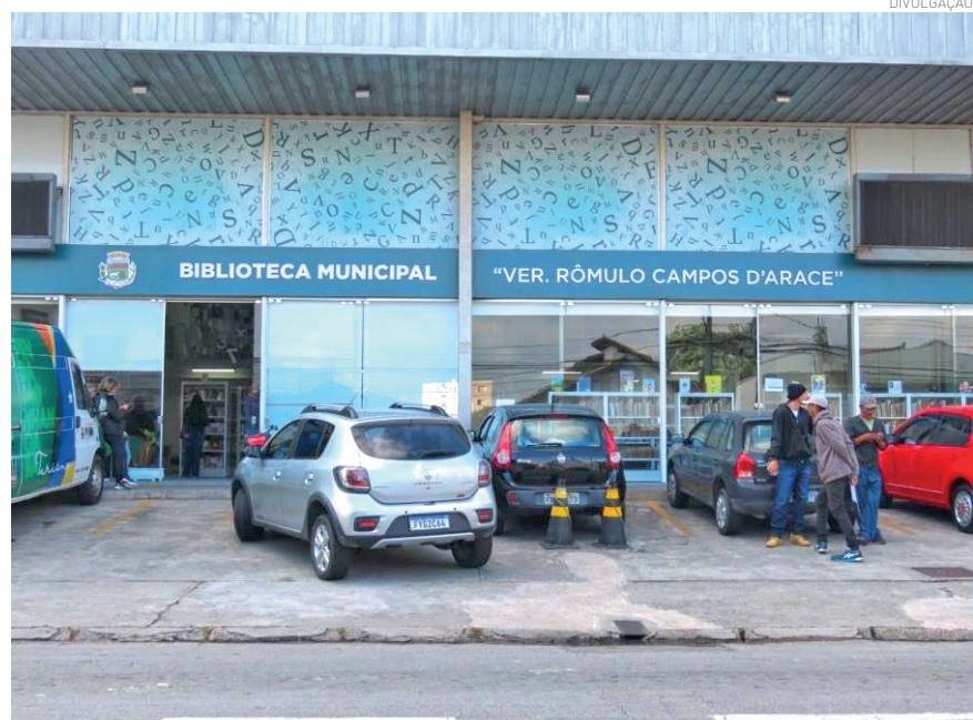
As bibliotecas são uma alternativa gratuita para aproveitar o tempo livre