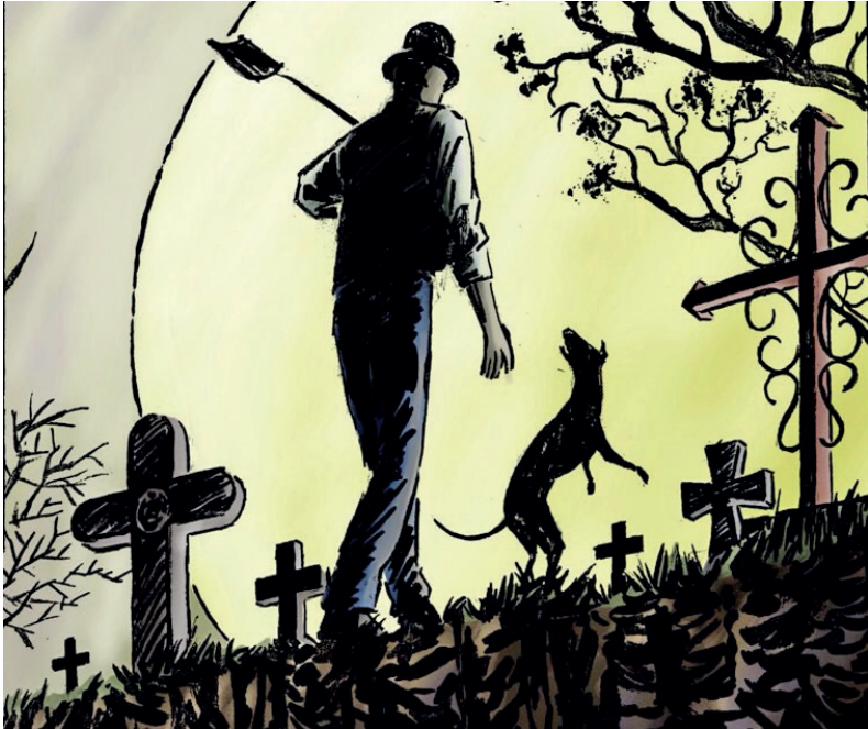
ARTES E MANHAS DA LÍNGUA PORTUGUESA