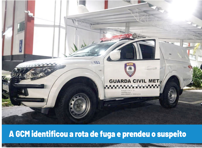
A GCM identificou a rota de fuga e prendeu o suspeito

O indivíduo foi conduzido à delegacia, onde permaneceu à disposição da autoridade policial para prestar depoimento e responder pelos fatos apurados. A rápida atuação da GCM contribuiu para a elucidação do caso e reforça o trabalho de segurança desenvolvido no município.