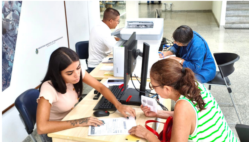
Funcionários capacitados esclarecem dúvidas sobre os tributos

O vencimento dos boletos está previsto para o dia 16 de março. No entanto, com a disponibilização dos carnês, o contribuinte já