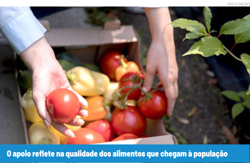
O apoio reflete na qualidade dos alimentos que chegam à população

Especialistas e moradores da região contribuíram com propostas para integrar melhor o patrimônio histórico ao desenvolvimento turístico da Serra da Mantiqueira. A Prefeitura de Pindamonhangaba informa que a Secretaria Municipal de Cultura e Turismo vem acompanhando o processo desde as fases iniciais, incluindo estudos técnicos e consultas públicas realizadas pelo Governo do Estado. Com a concessão, a expectativa é que o trecho que parte de Pindamonhangaba ganhe nova dinâmica, integrando a cidade a um turismo regional fortalecido, valorizando a história ferroviária e consolidando o município como porta de entrada da Estrada de Ferro Campos do Jordão.