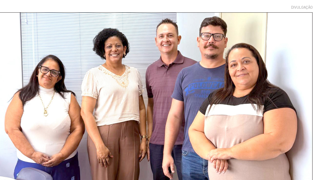
Integrantes das secretarias da Mulher, Família e Direitos Humanos e Comunicação e Eventos se reúnem para definirem a iniciativa