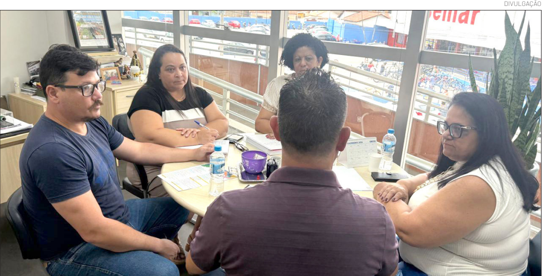
A proposta é assegurar um espaço especialmente para crianças e famílias atípicas

A ação consolida o Bloco da Inclusão como parte efetiva do Carnaval de Pindamonhangaba, ampliando o acesso à cultura e ao lazer e fortalecendo políticas públicas de inclusão. A iniciativa também reforça o trabalho intersetorial entre as secretarias, unindo planejamento, sensibilidade social e organização de eventos. Com a definição, o Bloco da Inclusão passa a integrar oficialmente o Carnaval 2026, contribuindo para uma festa mais democrática, diversa e representativa, onde todas as famílias possam participar e celebrar juntas.