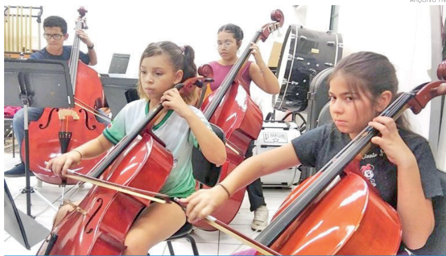
Programa oferece oficinas em diversas áreas da música

Os interessados devem comparecer ao local de inscrição dentro do período estabelecido para garantir a participação no programa.