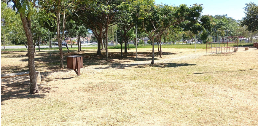
O espaço está mais bonito, organizado e acolhedor para a população

praças e áreas verdes. Além de melhorar o aspecto visual, essas ações contribuem para o bem-estar da população, fortalecem o uso dos espaços públicos e promovem mais qualidade de vida nos bairros.