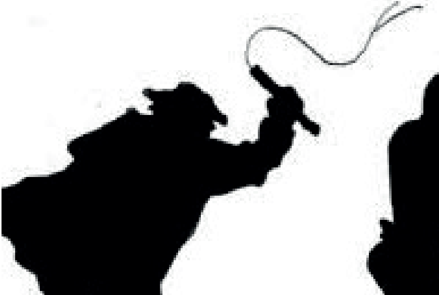
Cavaleiro e cavalo levaram uma surra sem ver quem os chicoteava