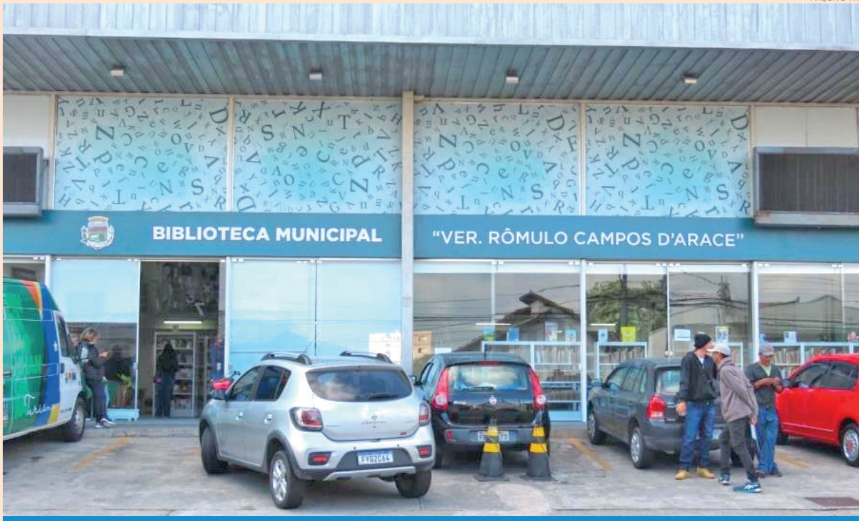
A biblioteca Rômulo Campos D'Arace fica na rua Campos Sales, 535, no centro da cidade