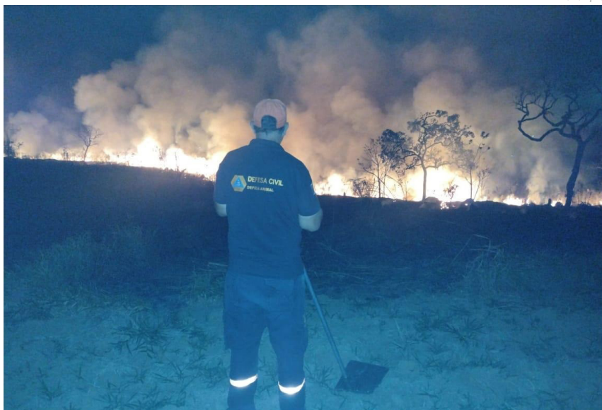
O cenário de chuva abaixo do esperado ao longo do ano exige maior atenção

Quem presenciar esse tipo de ação pode denunciar pelo WhatsApp da Prefeitura, pelo número (12) 3644-5600, encaminhando fotos ou vídeos que auxiliem na identificação do autor da infração.