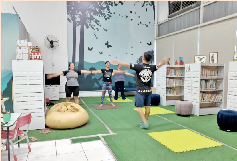
As inscrições para as aulas devem ser feitas na própria biblioteca

Os interessados em participar das aulas devem realizar a inscrição diretamente com a Biblioteca Vereador Rômulo Campos D'Arace, por meio do telefone (12) 3645-1701, onde também é possível obter mais informações sobre horários, vagas disponíveis e critérios de participação.