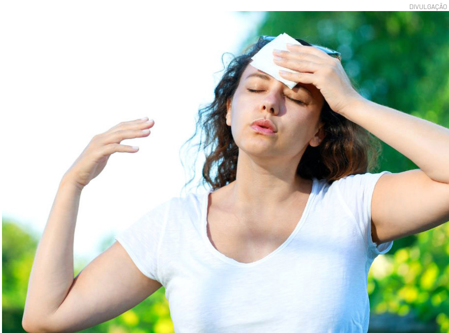
Em dias quentes, respeite seu limite e fique sempre em um ambiente fresco