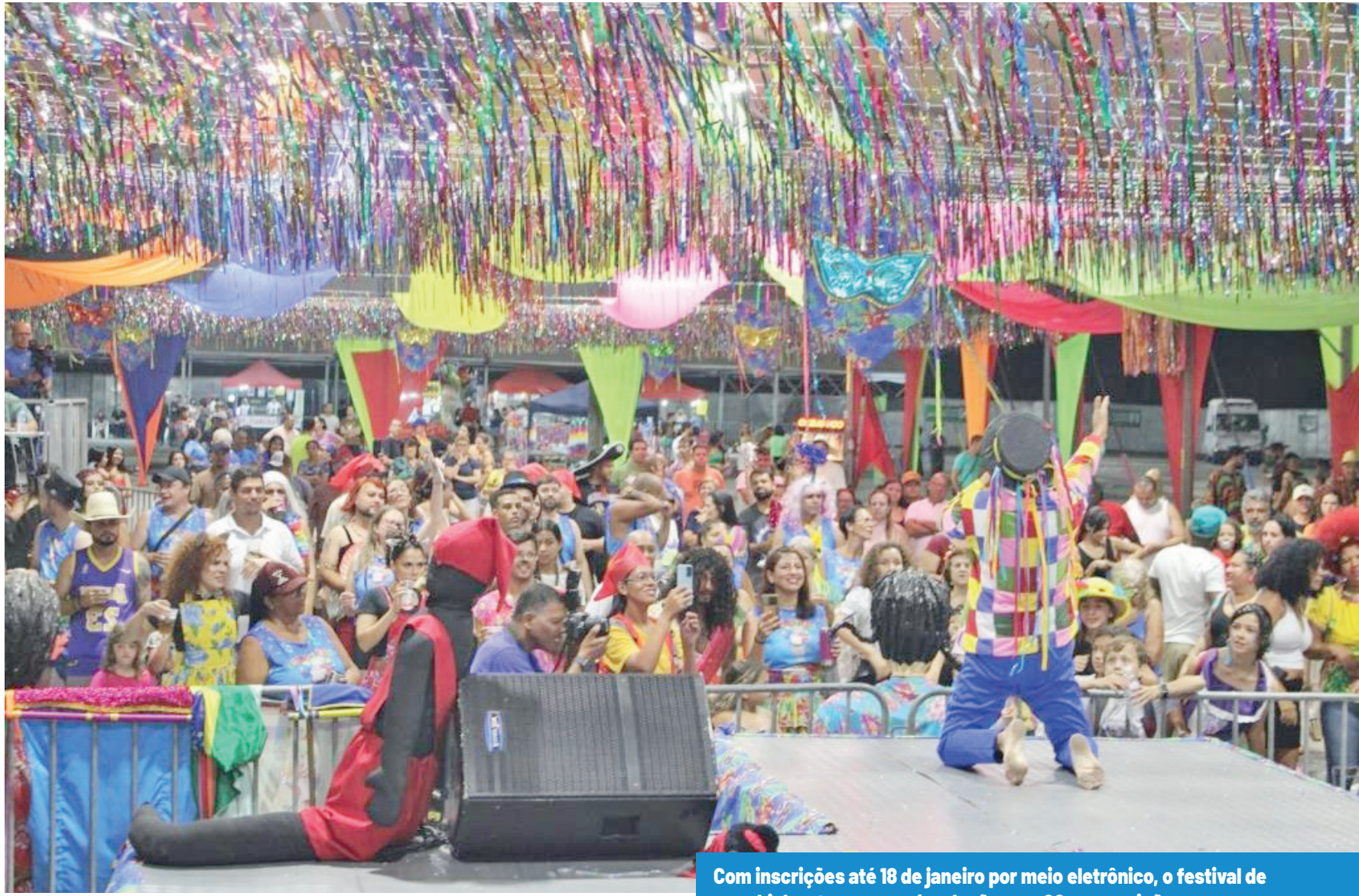
Com inscrições até 18 de janeiro por meio eletrônico, o festival de marchinhas tem uma pré-seleção com 20 composições

As eliminatórias acontecem em 6 e 7 de fevereiro, com 10 apresentações por noite, e a final está marcada para 8 de feverei-