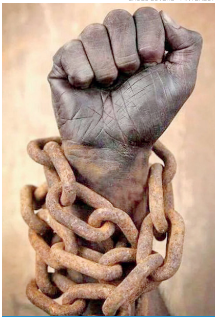
Escravo exigiu que o capitão do mato lhe devolvesse o braço decepado