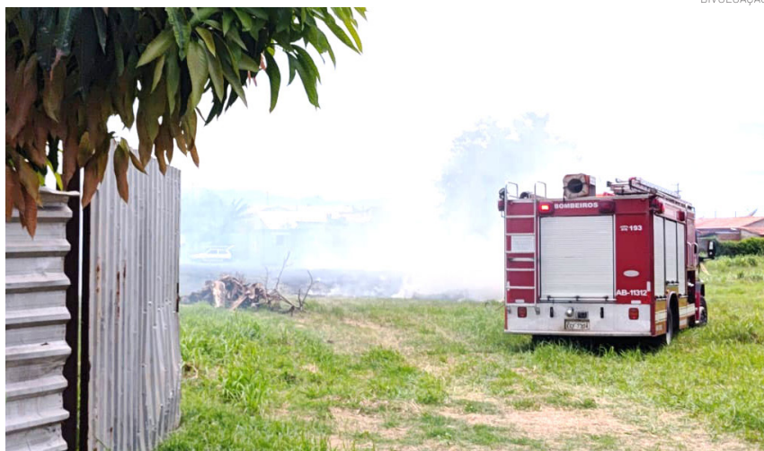
A prática de queimadas representa riscos à saúde pública

Foram lavrados dois autos de infração, um para quem ateou fogo (responsabilidade direta) e outro para o proprietário do ter-