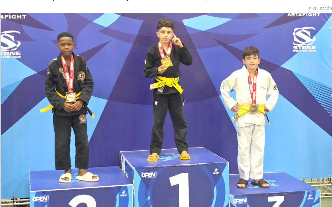
O jovem atleta representa a inspiração para outras crianças