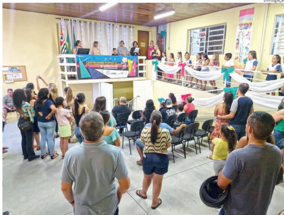
Formatura marcou o encerramento das atividades do semestre

Atualmente, as atividades atendem cerca de 400 alunos da rede municipal, em diferentes regiões da cidade: no núcleo central, em Moreira César, na EM Ayrton Senna; na região Leste, na EM João Cesário; no Araretama, na EM Madalena Caltabiano; no Bem Viver, na EM João Kolenda; no Castolira, na EM Julieta Reale; e no Vila Rica, na EM Félix Adib.