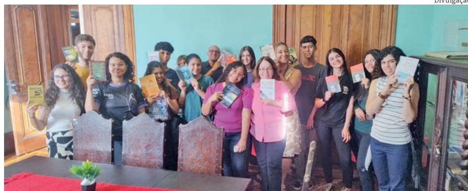
Os primeiros integrantes a 'APL Jovem' são estudantes das escolas públicas

Na primeira reunião do grupo, os integrantes conheceram um pouco da história da APL, refletiram sobre os propósitos de uma academia de letras e participaram de uma animada conversa sobre grandes histórias da literatura que foram adaptadas para outras linguagens (filmes, séries e quadrinhos). Ao final, todos ganharam livros, gentilmente cedidos pela biblioteca municipal "Vereador Rômulo Campos D'Arace".