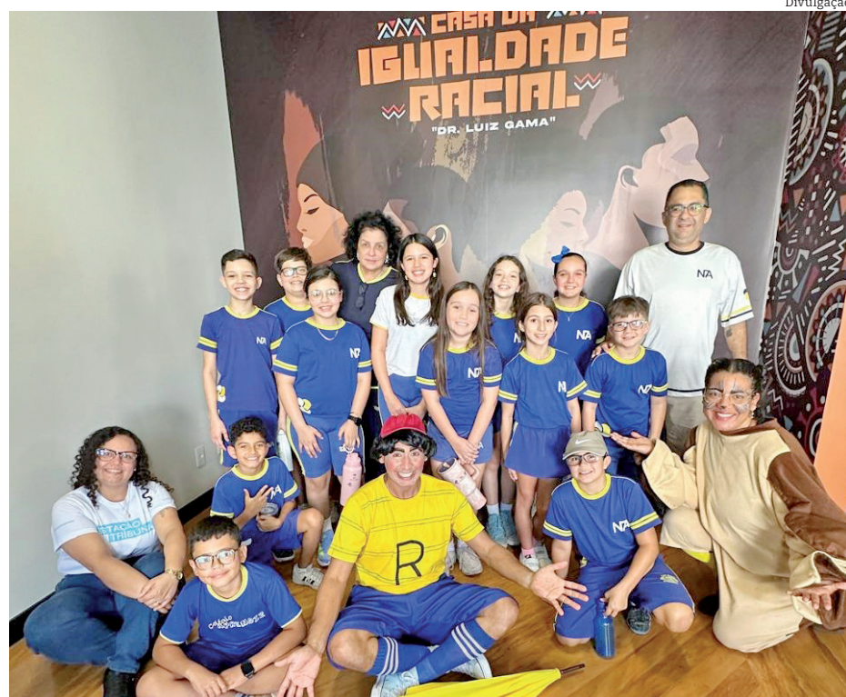
Estudantes do Colégio Novo Aprendiz na Casa da Igualdade Racial