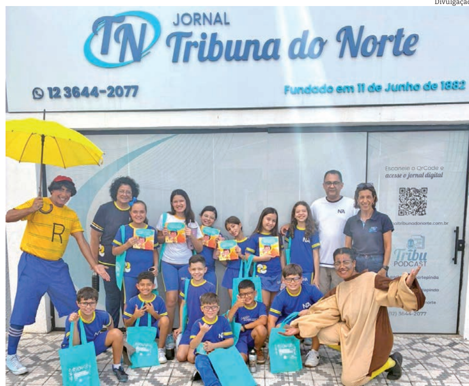
A segunda parada da Estação Tribuna é a atual sede do jornal