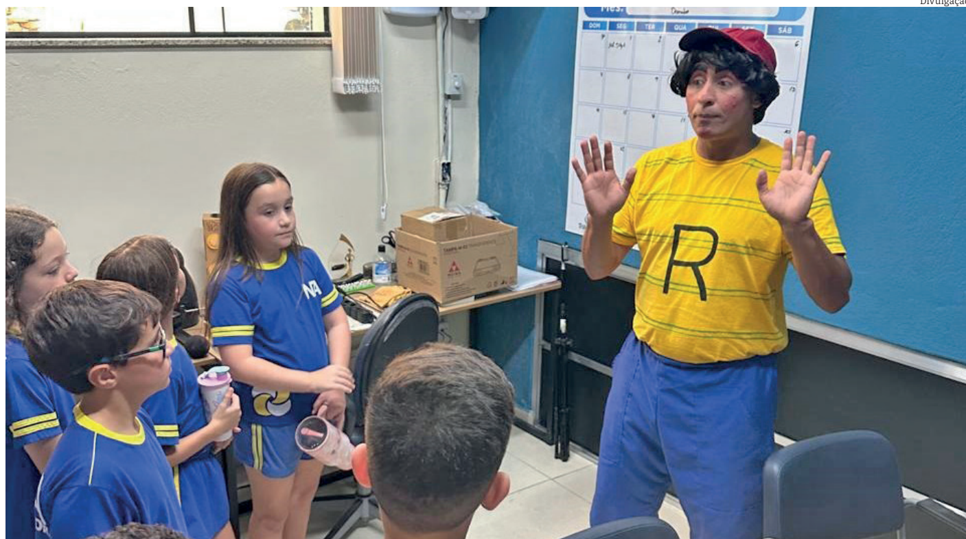
Alunos do Colégio Novo Aprendiz são recepcionados pelo personagem Romeirinho na sede da Tribuna do Norte

O hábito de montar o presépio começou com São Francisco de Assis