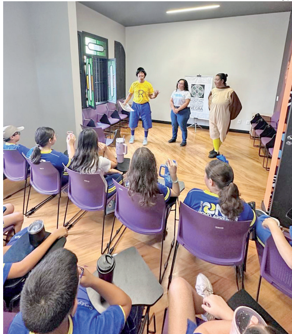
Alunos visitam a biblioteca Luiz Gama durante o trajeto da Estação Tribuna

A terceira estação são as bibliotecas municipais, onde poderão conhecer os locais e as atividades realizadas.