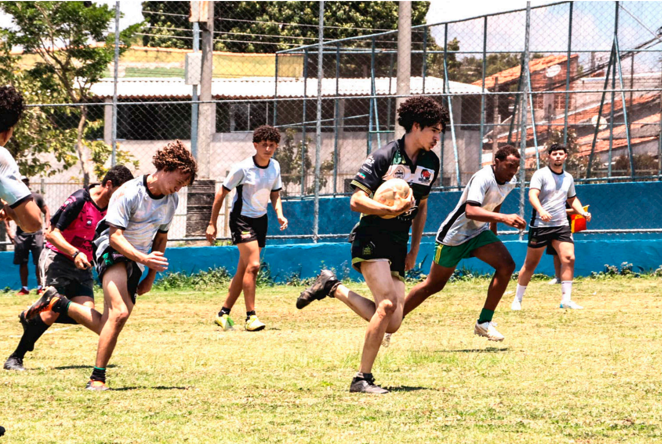
A competição proporciona aos jovens atletas uma vivência competitiva