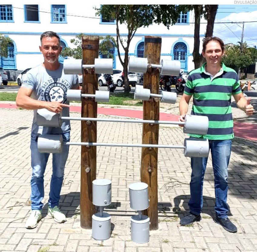
A revitalização garante segurança e qualidade nos espaços esportivos

Em breve, será marcada a data da entrega simbólica do prédio, com a presença do governador de São Paulo, Tarcísio de Freitas, do prefeito Ricardo Piorino, e outras autoridades.