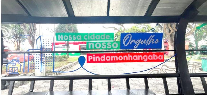
Revitalizados os abrigos garantem segurança e conforto aos usuários