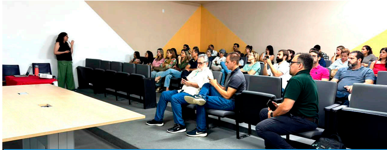
A qualificação apresentou as resinas de última geração utilizadas em restaurações dentárias