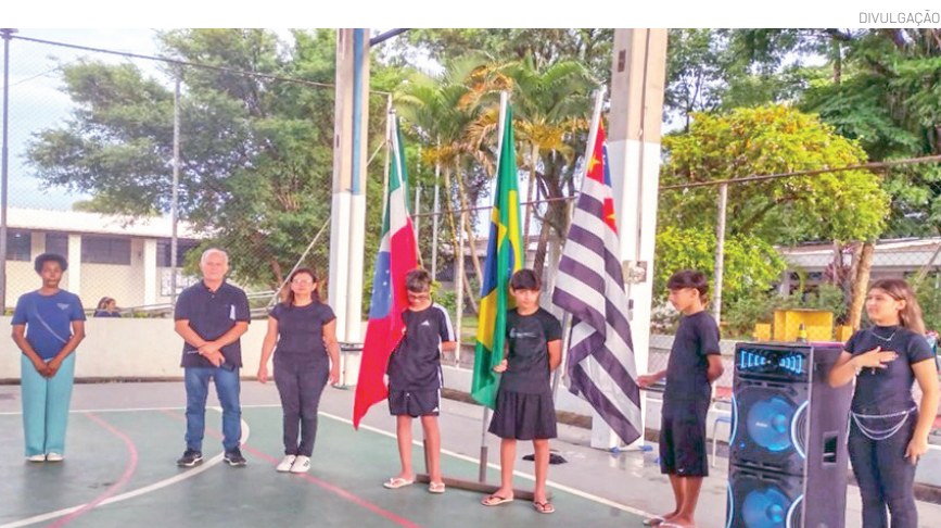
Escola promoveu atividades esportivas para alunos até 12 anos