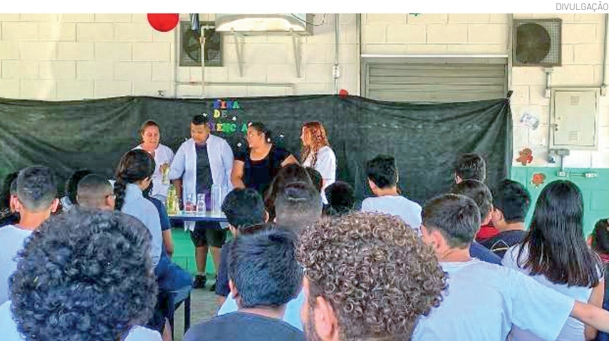
Escola 'Antônia Carlota' realizou o encerramento do 4º Bimestre de Arte

O projeto reforçou a criatividade, a expressão artística e a conscientização dos estudantes sobre temas relevantes para a comunidade.