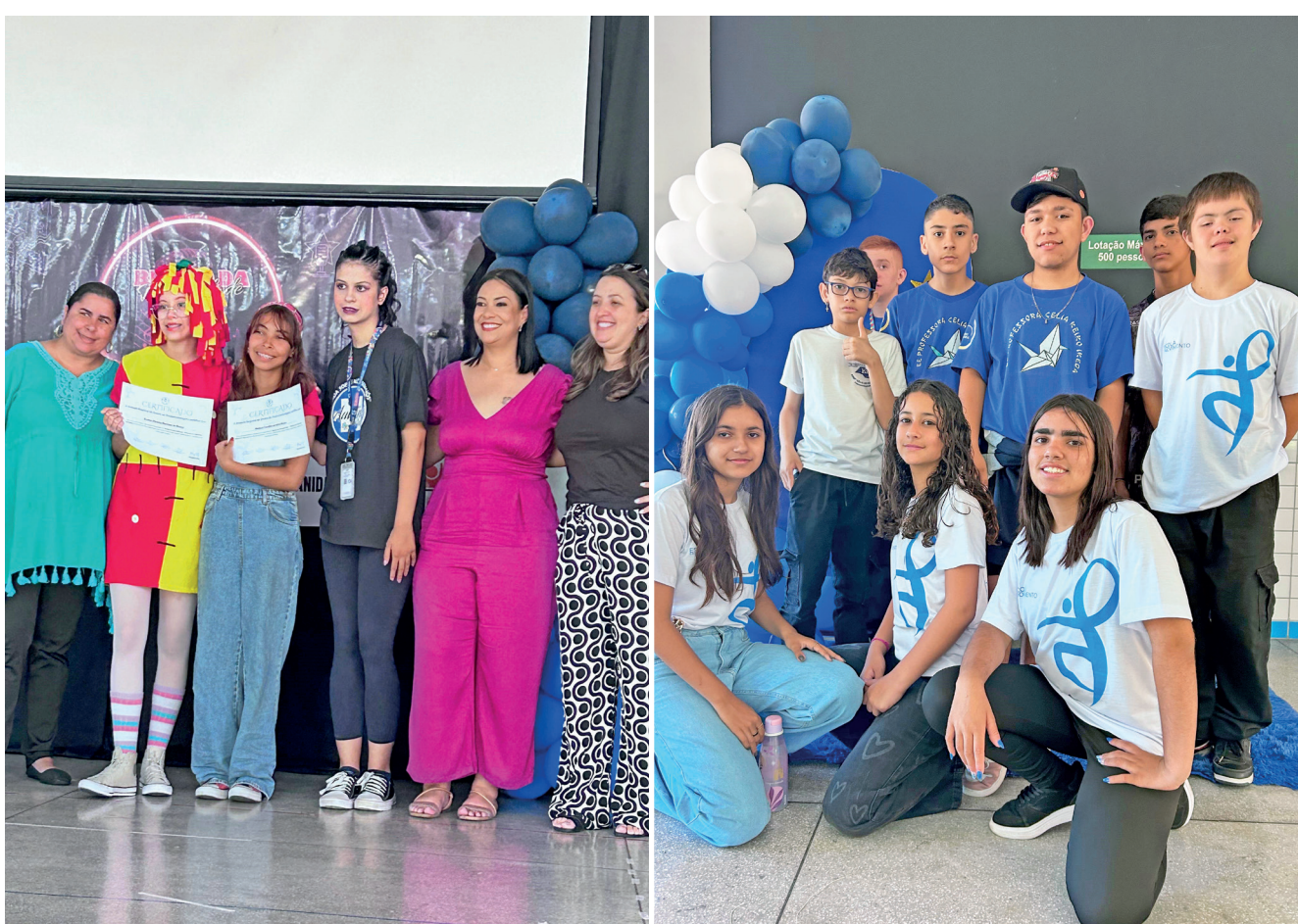
Num dia repleto de arte, cerca de 250 pessoas participaram, entre alunos, professores e familiares

O Show de Talentos Inclusivo não foi apenas um evento cultural, mas um manifesto de amor, respeito e valorização da diversidade. Um dia para lembrar que todos têm direito de brilhar!