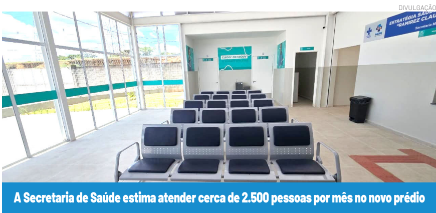
A Secretaria de Saúde estima atender cerca de 2.500 pessoas por mês no novo prédio

Ao todo, o complexo contém dois consultórios para atendimento médico, uma sala para ginecologia, dispensação de medica-