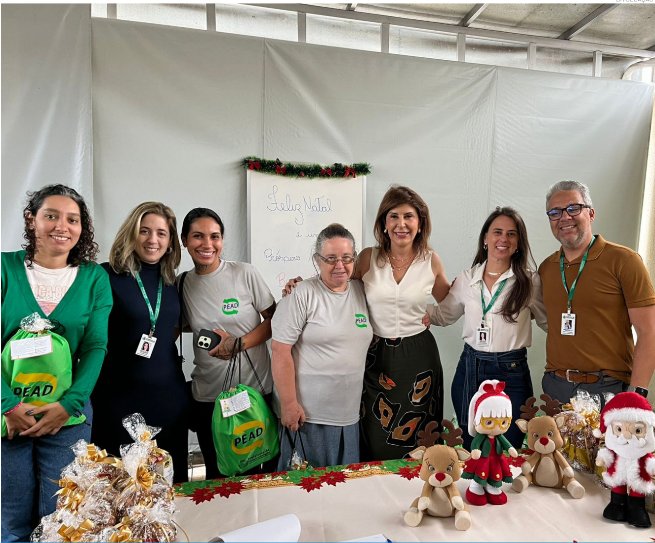
Os kits reforçam os valores de empatia e inclusão social, orientando as políticas públicas