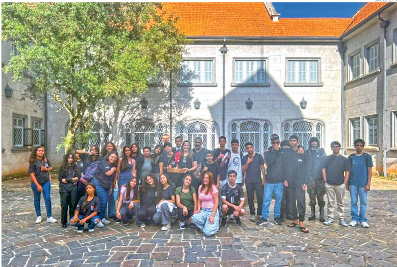
Alunos visitaram o Palácio do Governador como um prêmio pela dedicação às atividades escolares de 2025