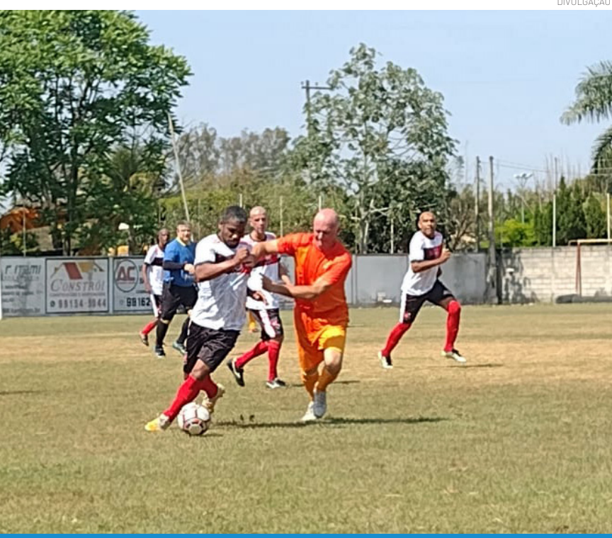
As semifinais do Sênior 35 vão movimentar os campos de Pinda

O último campeonato do ano vai chegando na sua reta final. Neste domingo (14), o futebol amador de Pinda chega às semifinais do Sênior 35: a tradicional Ferroviária recebe o Cidade Jardim às 8h15 no estádio Antônio Pinheiro Júnior, campo da Ferroviária. No mesmo horário, o Vila São José encara o Colorado no estádio do Vila. Promessas de dois grandes jogos e de muita expectativa.