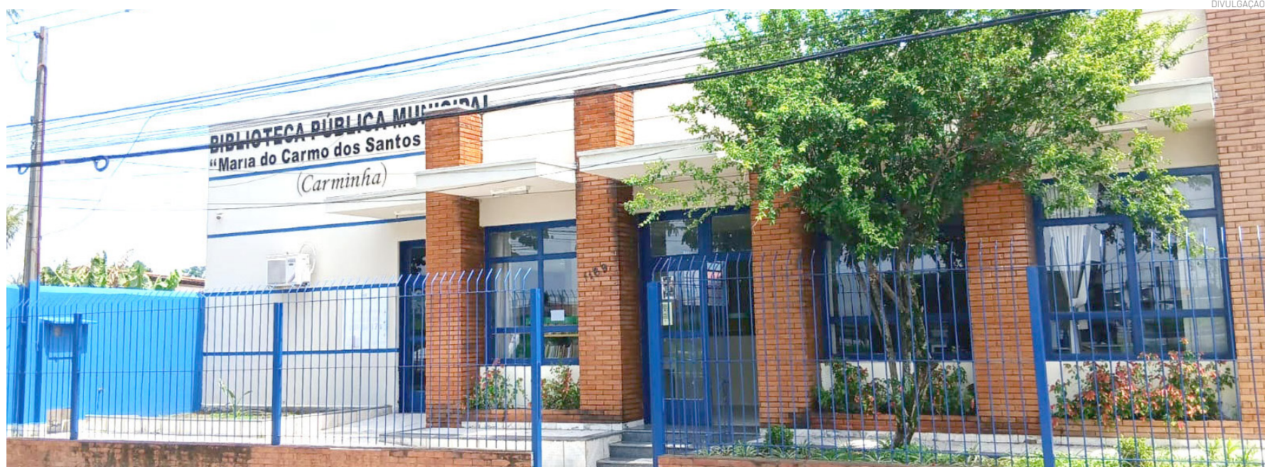
Pintura geral, espaços renovados e chegada de novos livros fortalecem o atendimento à comunidade da Vila São Benedito

Prefeitura em valorizar e qualificar os equipamentos culturais do município, garantindo que a população tenha acesso a espaços públicos de qualidade, que estimulem o hábito da leitura e contribuam para o desenvolvimento educacional e cultural de Pindamonhangaba”, afirmou.