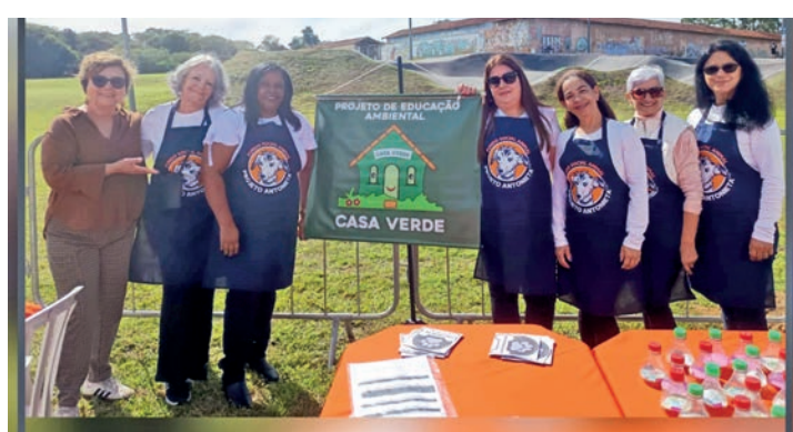
Projeto de Educação Ambiental Casa Verde