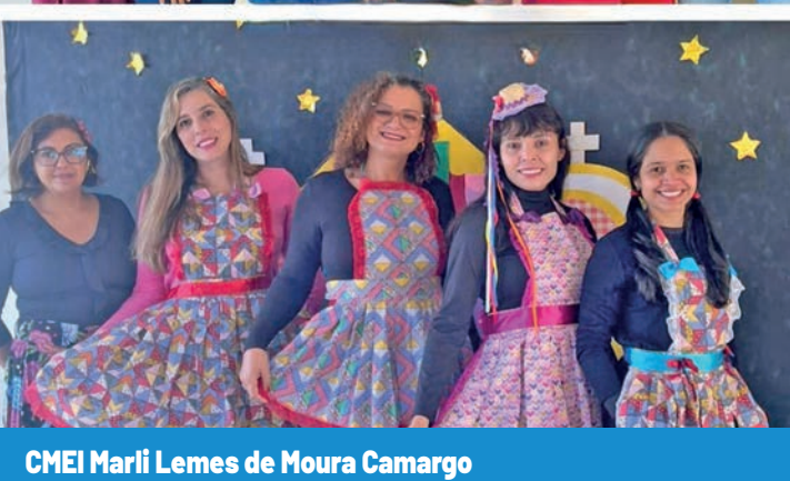
CMEI Marli Lemes de Moura Camargo