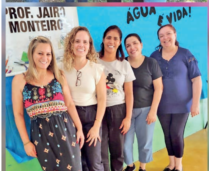
Escola Municipal Professor Jairo Monteiro