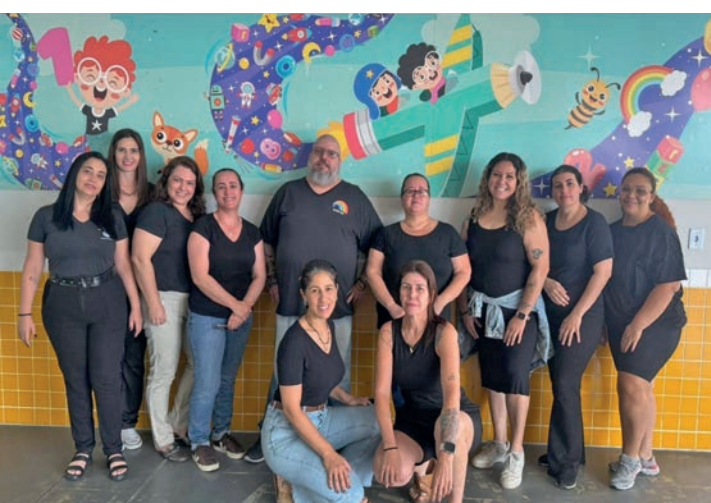
CMEI Monsenhor Jonas Abib