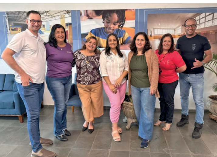
Professores parceiros da Educação