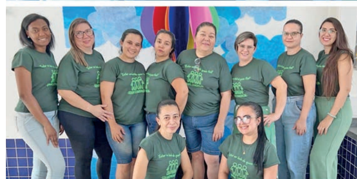
CMEI Maria Luiza Lima de Almeida