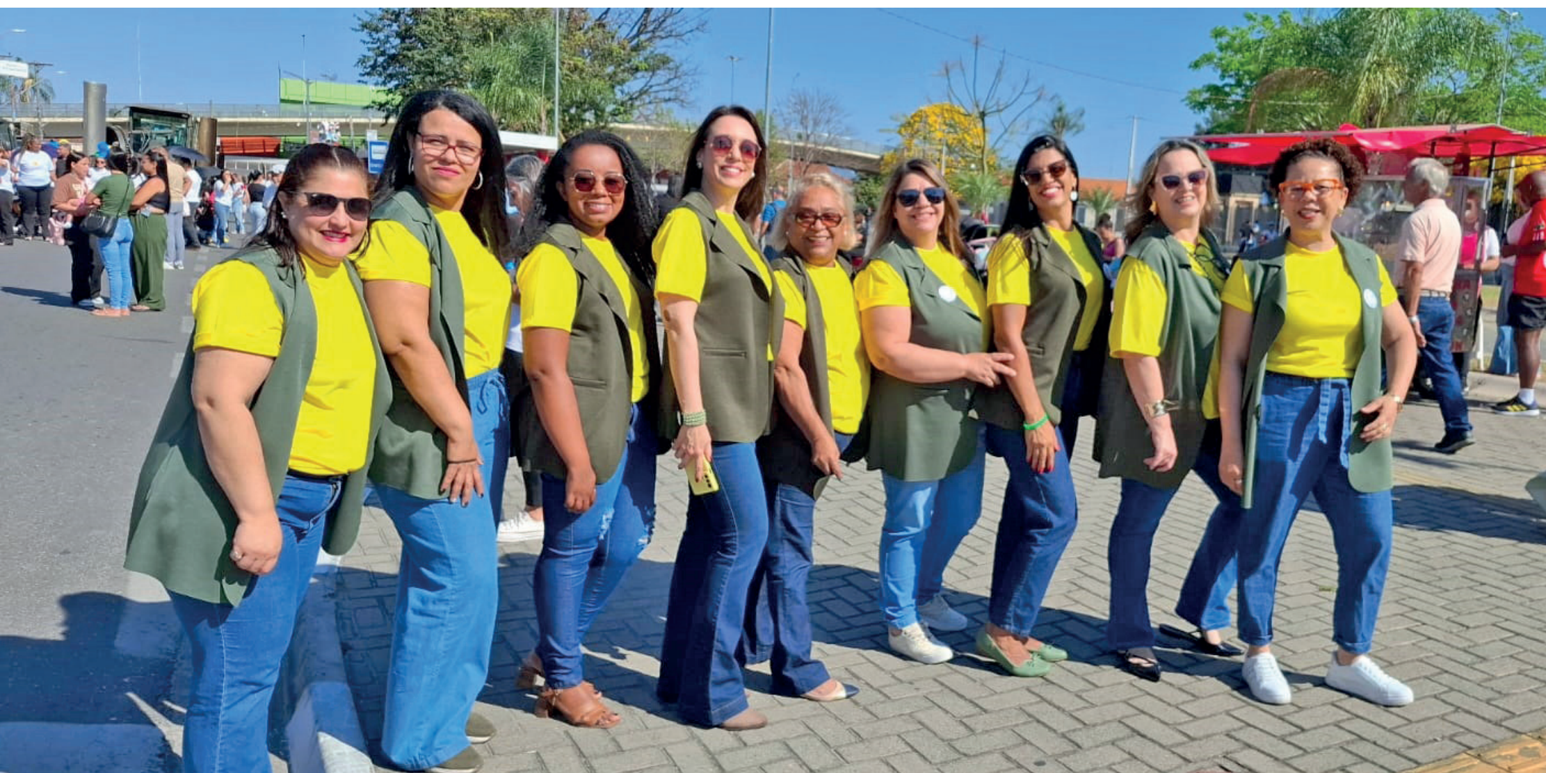
Grupo de trabalho - Mentoria