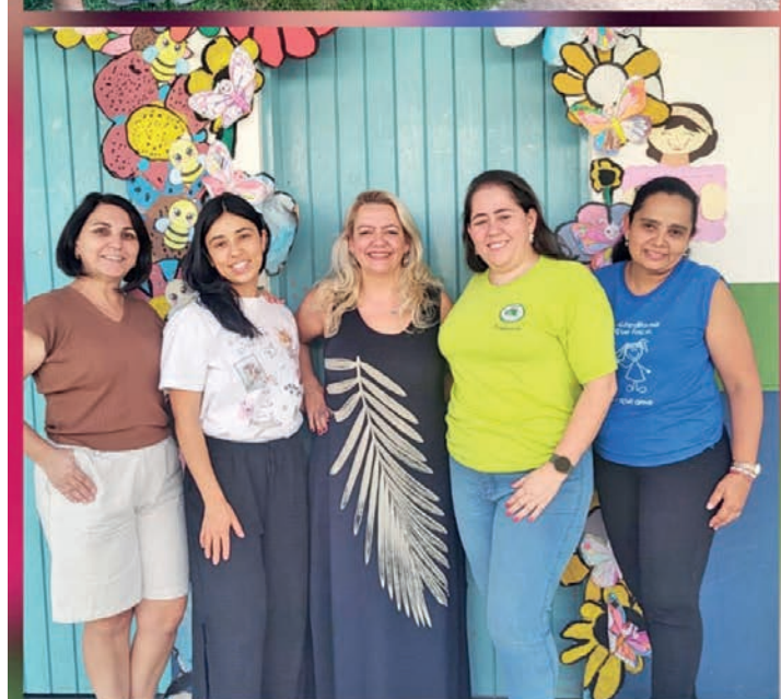
Escola Municipal Professora Maria Madureira