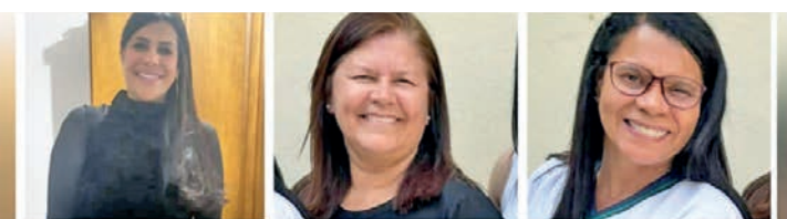
EM Professor Paulo Freire