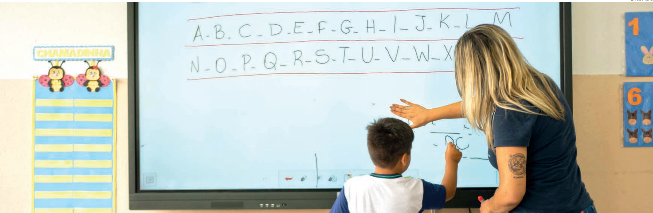
Pindamonhangaba posiciona-se entre os 20 municípios do Vale do Paraíba que alcançaram o padrão nacional de alfabetização - Indicador Criança Alfabetizada (ICA)