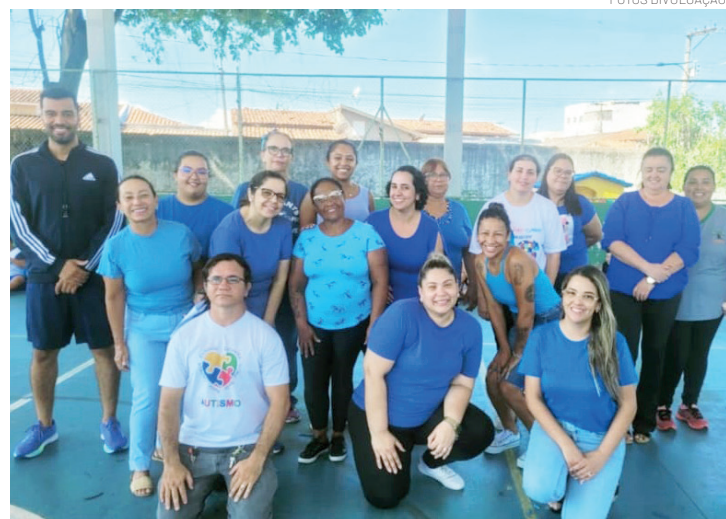
Escola Municipal Professor Elias Bargis Mathias