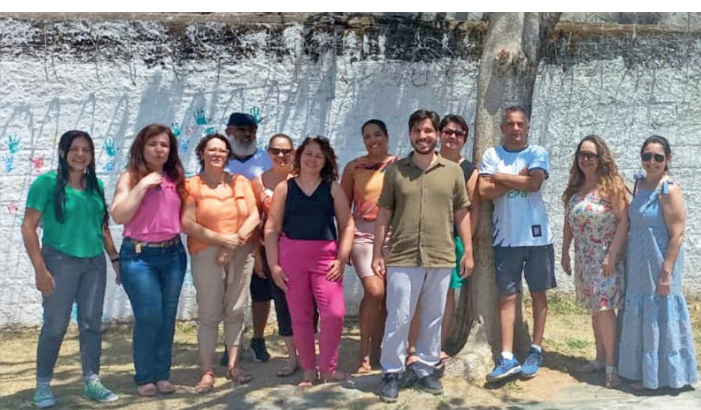
Escola Municipal Professora Regina Célia M de Souza Lima