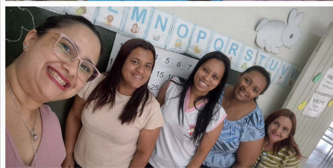
CMEI Maria Aparecida Gomes - Sá Maria