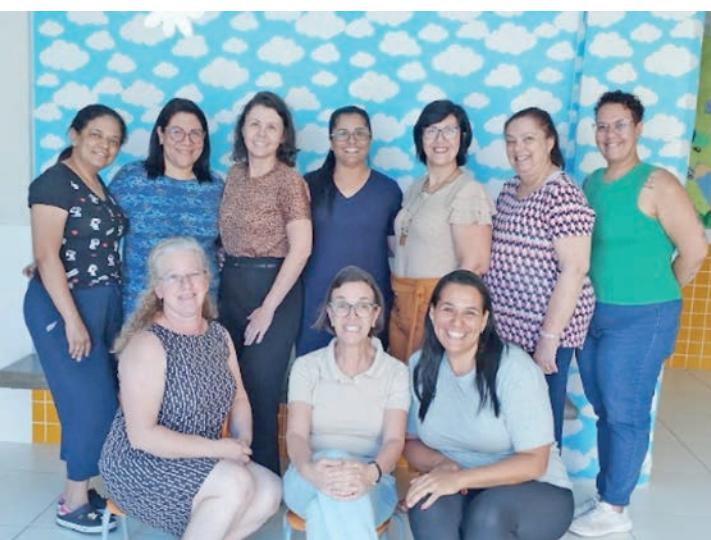
CMEI Rosália de S. Queiroz