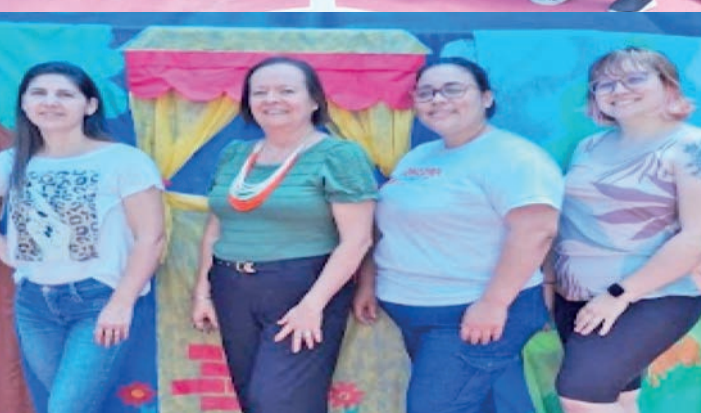
CMEI Andrea C. de Souza Bissoli