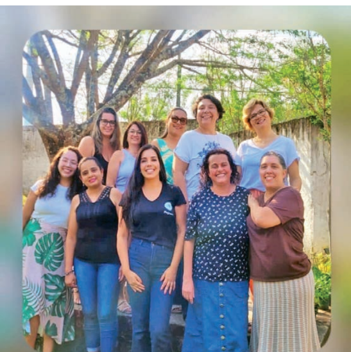
Escola Municipal Professor Orlando Pires