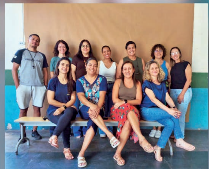
Escola Municipal Dr Ângelo Paz da Silva