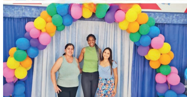
CMEI Professora Valdira Morgado