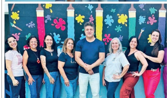
CMEI Lucinéia - CAIC