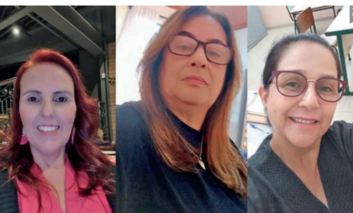
Nap Bela Vista