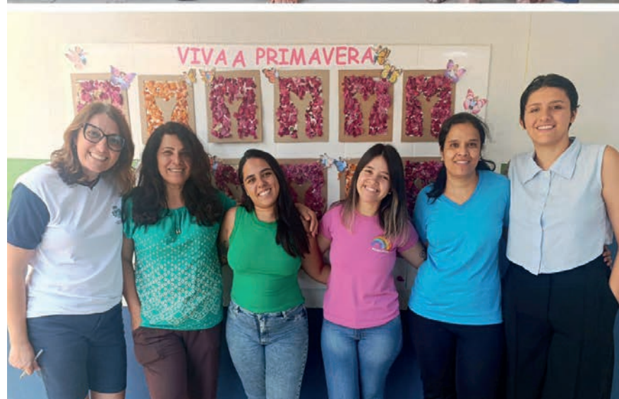
Cmei Prof Olimpia Franco César