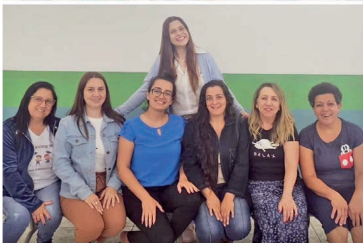
CMEI José Ildefonso