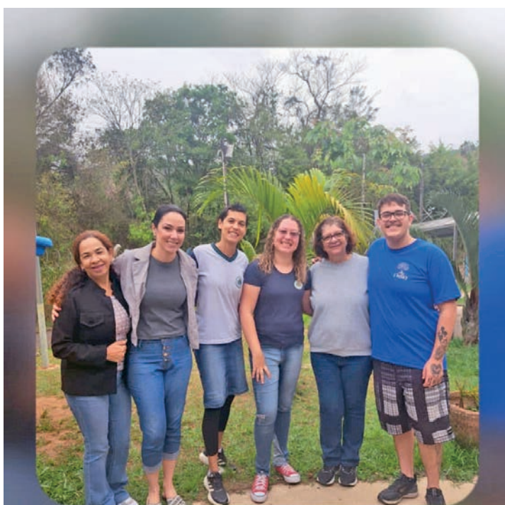
EM Professora Maria Aparecida Camargo de Souza