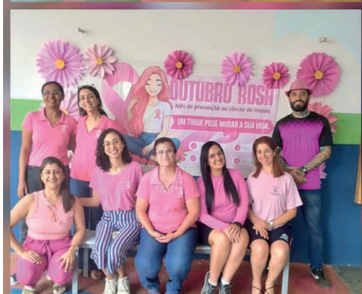
Escola Municipal Padre Mário Antonio Bonotti