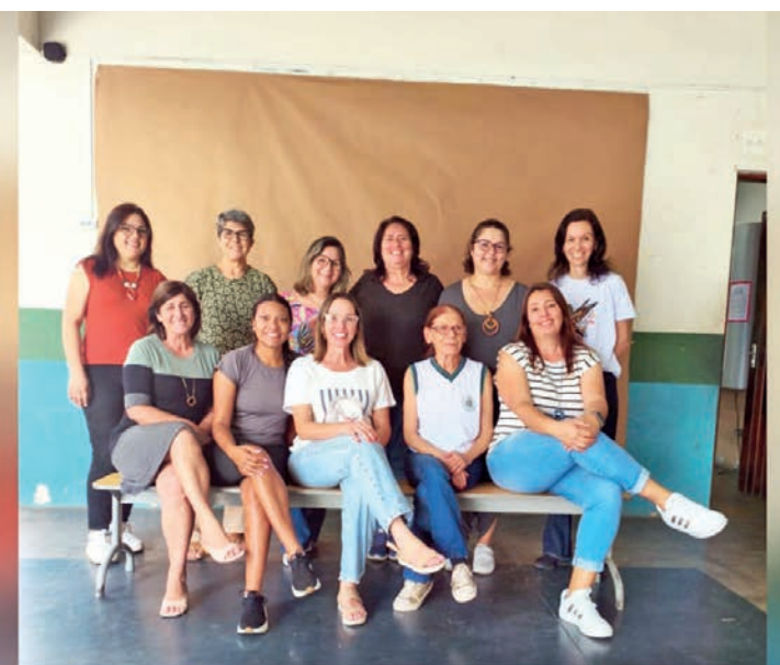
Escola Municipal Anibal Ferreira