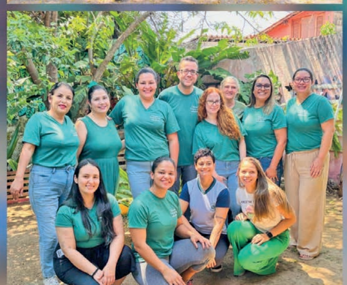
Escola Municipal Professor Félix Adib Miguel