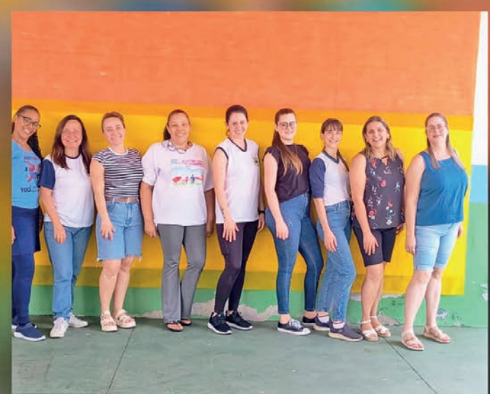
Escola Municipal Professora Madalena C. Salum Benjamim