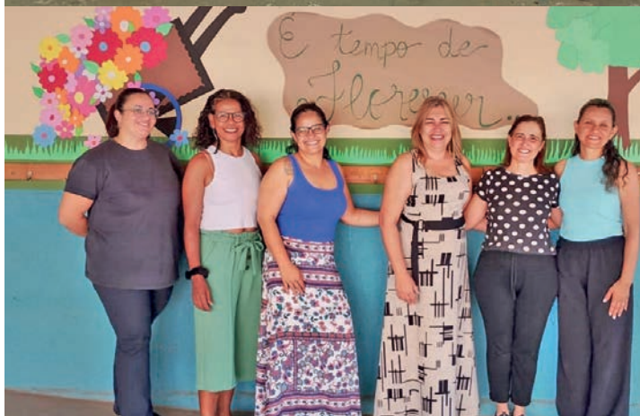
CMEI Francisco Lessa