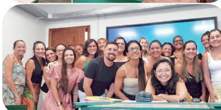
Sala de Recursos