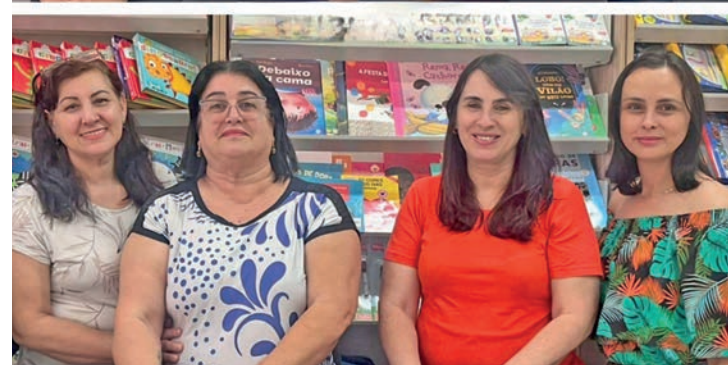
CMEI Maria Luiza Lima de Almeida