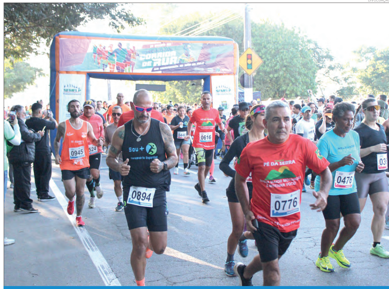
O percurso desta prova será interno, passando por áreas de lazer, trilhas e a Fazenda do Estado