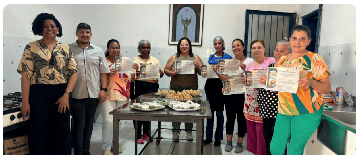
O curso apresentou receitas tradicionais e variações, além de técnicas avançadas