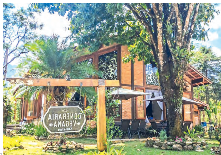
Dentro da Fazenda Nova Gokula, o Restaurante Confraria Vegana está inserido numa área de preservação ambiental, em meio à natureza exuberante