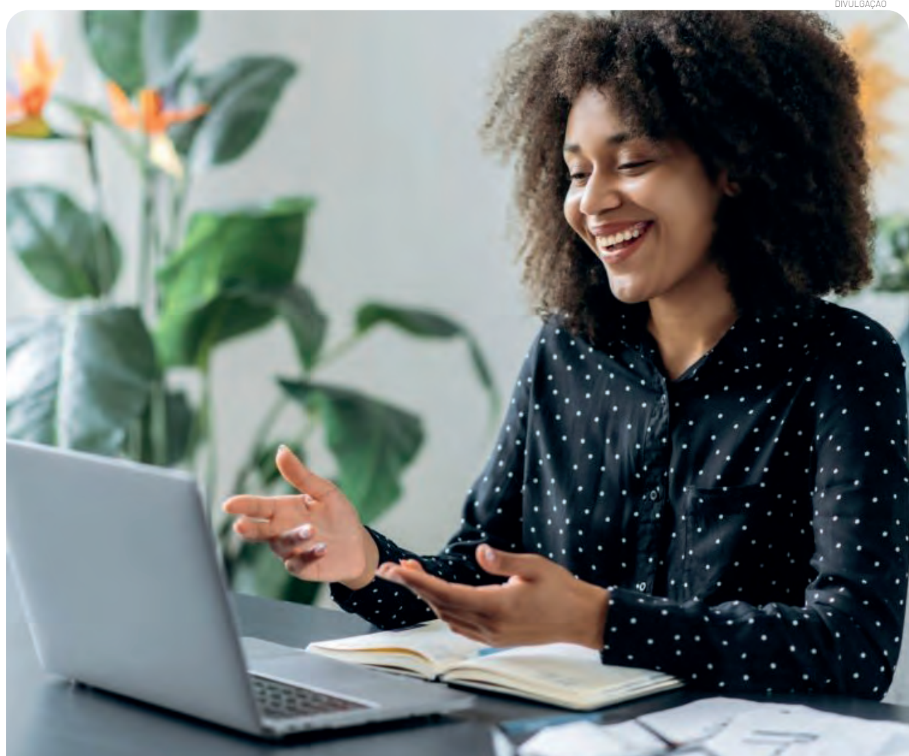
O evento é voltado a empresas interessadas em financiar investimentos com taxas competitivas e prazos estendidos

Durante a Jornada, consultores da Desenvolve SP apresentarão as principais linhas de financiamento e farão atendimento individual para entender necessidades e indicar a melhor solução