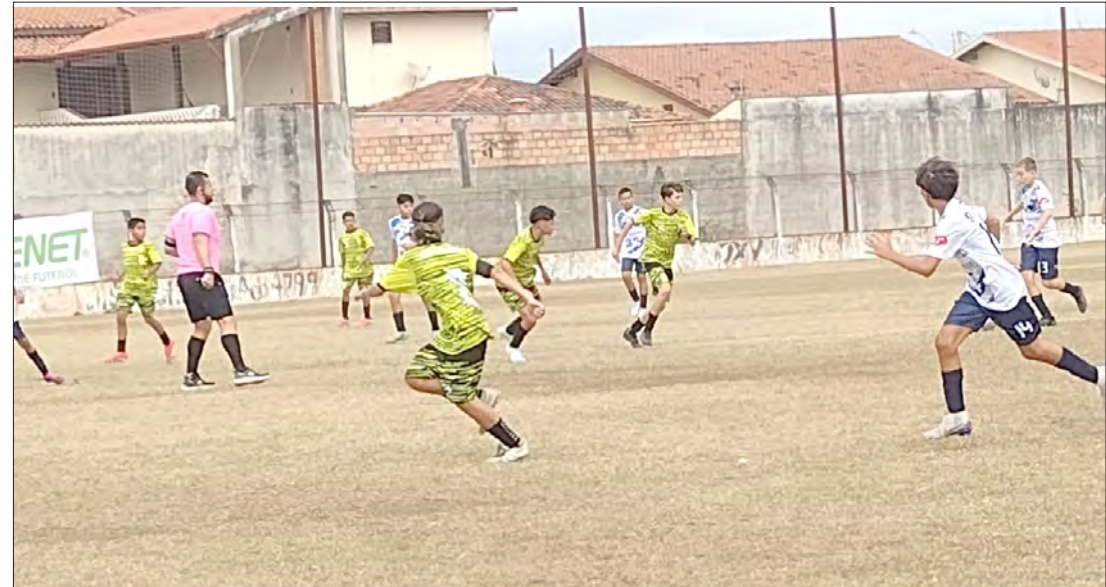
Serão muitas as decisões pelos campos de futebol neste fim de semana