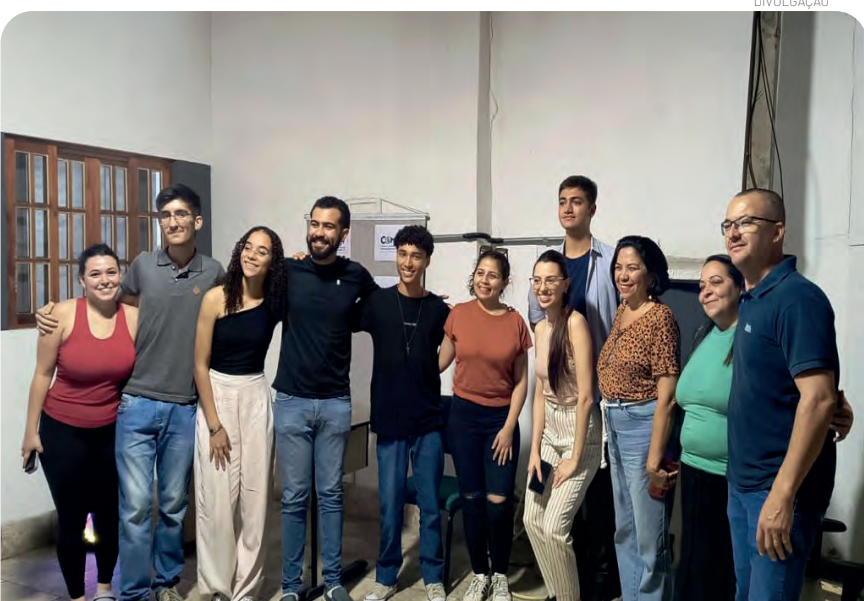
O encontro marcou um momento de fortalecimento da participação juvenil no município

Na última semana, o Conselho Municipal da Juventude (Comjuv) de Pindamonhangaba realizou a eleição de membros das vagas que estavam em aberto. O encontro, que contou com apoio da Secretaria da Mulher, Família e Direitos Humanos, reuniu representantes de diferentes setores da sociedade e marcou um momento especial de fortalecimento da participação juvenil no município.