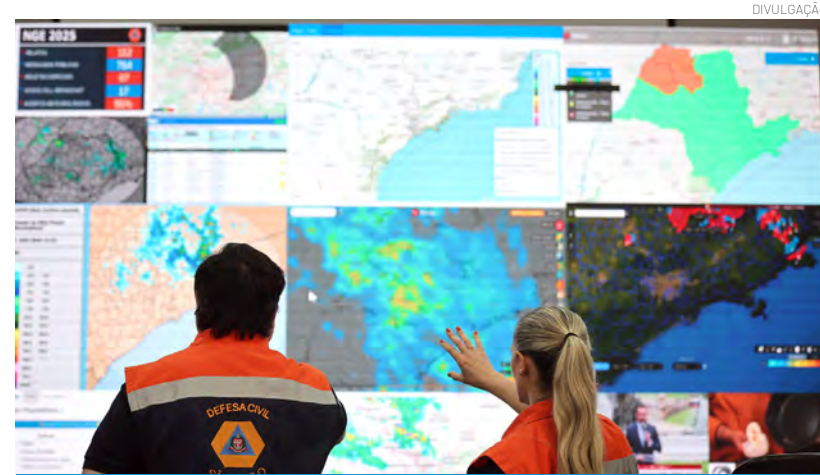
Até domingo (5), estado de SP terá temperaturas acima de 35°C em diversas regiões; faixa leste terá pancadas de chuva isoladas

No Vale do Paraíba a previsão é de sol e risco de pancadas de chuva à tarde. Mínima de 16°C, máxima de 32°C, ventos moderados.