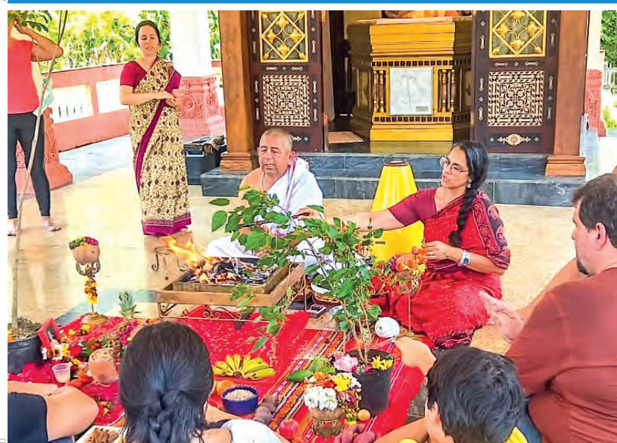
Os interessados em se aprofundar na filosofia hare podem participar de cerimônias e ritos religiosos, oficiadas pelos sacerdotes da Fazenda Nova Gokula

primárias da vida espiritual verdadeira.