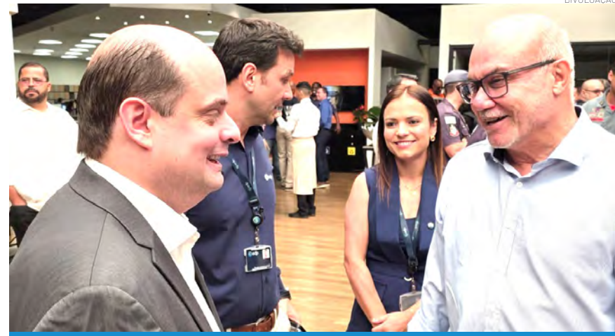
Prefeito de Pindamonhangaba participou do lançamento do Plano Verão 2025/2026 da EDP, em São José dos Campos, dia 1 de outubro

A iniciativa tem impacto prático na vida das famílias beneficiadas e reforça o compromisso da EDP em liderar uma transição energética justa, contribuindo para a inclusão social,