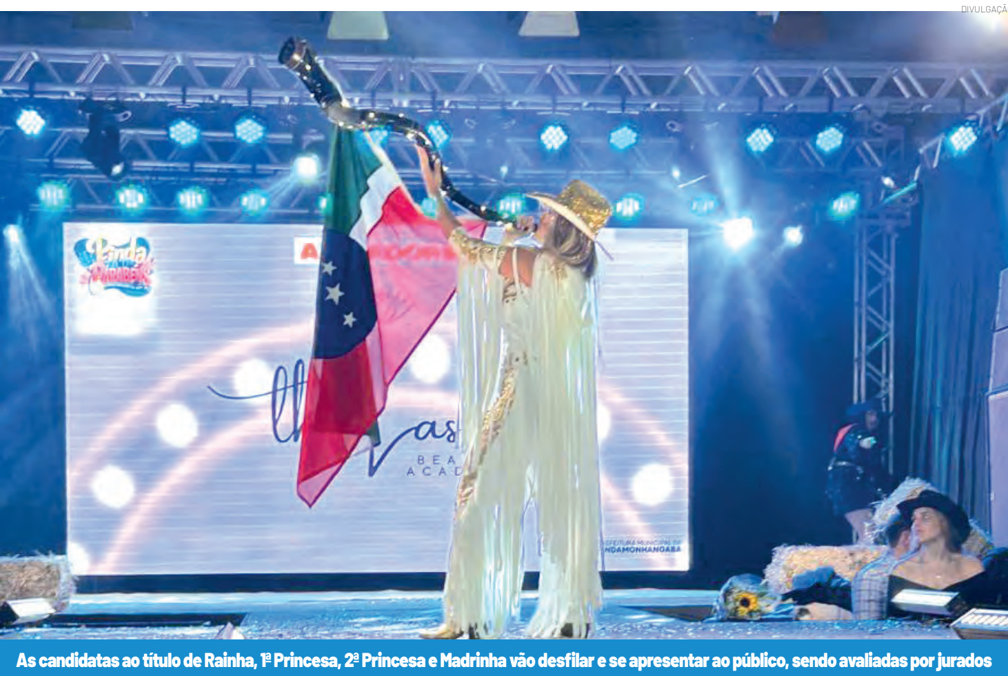
As candidatas ao título de Rainha, 1ª Princesa, 2ª Princesa e Madrinha vão desfilar e se apresentar ao público, sendo avaliadas por jurados

O Restaurante Confraria Vegana funciona aos sábados, domingos e feriados, com desjejum, das 8h às 10h; almoço, das 12h às 16h; e jantar, das 19h às 21h. Informações e reservas: 12 99733-4335 (whatsapp) O perfil do restaurante no Instagram é @confraria.vegana.