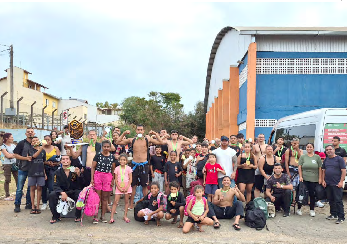
O Projeto Fênix vem se consolidando como uma poderosa ferramenta de inclusão social