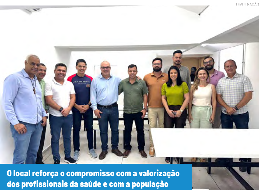
O local reforça o compromisso com a valorização dos profissionais da saúde e com a população