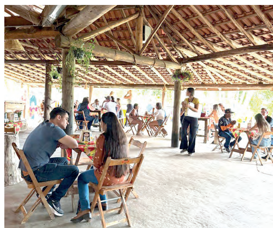
A diversidade de pratos e experiências culturais é o que dá força ao evento