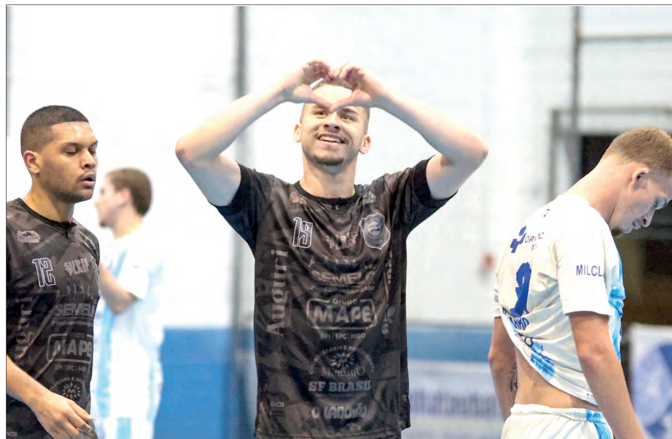
A conquista reforça a evolução do projeto e comprova que o trabalho vem dando frutos