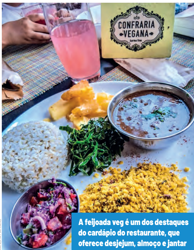
A feijoada veg é um dos destaques do cardápio do restaurante, que oferece desjejum, almoço e jantar

Os interessados em se aprofundar na filosofia hare podem participar de cerimônias e ritos religiosos, como a cerimônia de queima do karma. Este ritual serve para santificar, purificar e queimar as ações negativas passadas e prepara o corpo e a mente para as atividades