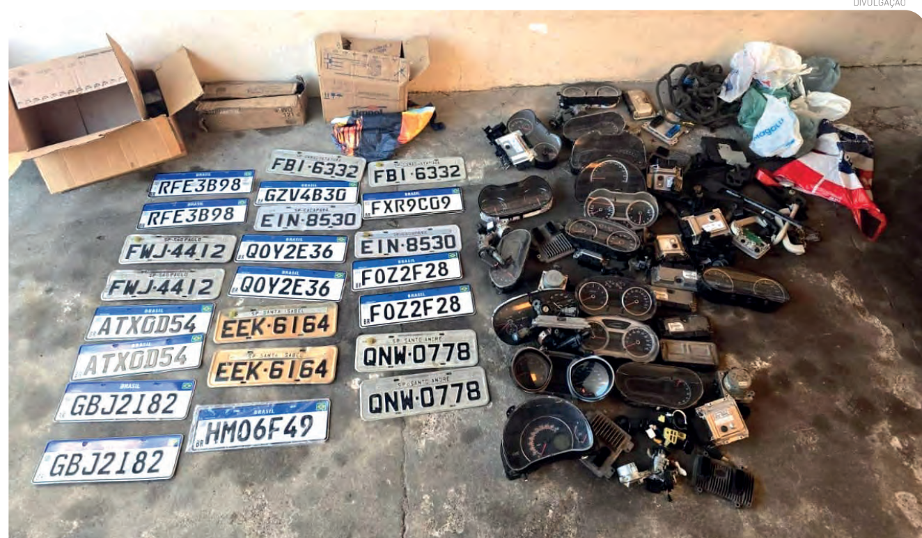
A operação demonstra o empenho e a dedicação dos policiais civis

Os veículos recuperados passarão por perícia técnica e serão restituídos aos respectivos proprietários após os trâmites legais. As investigações prosseguem para a identificação de outros envolvidos e a comprovação da origem das peças e automóveis apreendidos.