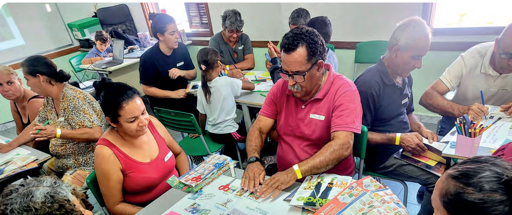
O encontro realizou um diagnóstico participativo sobre os impactos das mudanças climáticas

Aconteceu na segunda-feira (29/9), das 8h às 12h, na sede do Instituto IA3, o 1º Encontro do projeto “Valorização dos Catadores na Agenda Climática: protagonismo e participação em Pindamonhangaba”, uma iniciativa da Cooperativa Recicla Vida em parceria com o Instituto Sabiá, com apoio do Fundo Casa Socioambiental.