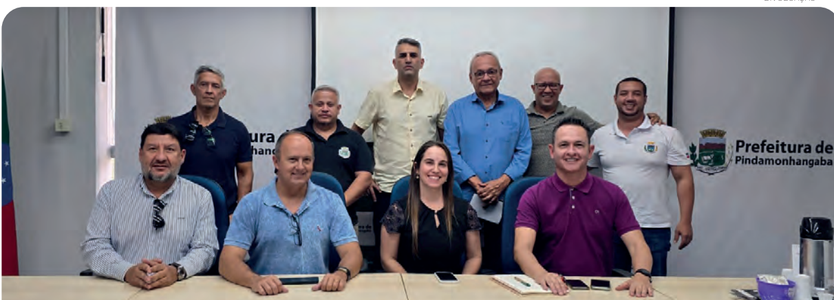
A união de várias áreas vão garantir a realização da programação de Natal

Foi confirmado mais uma vez o espetáculo “Circo Teatro sem Lona”, em local ainda a ser definido, e também já assegurado espaço para o artesanato do Fundo Social de Solidariedade.