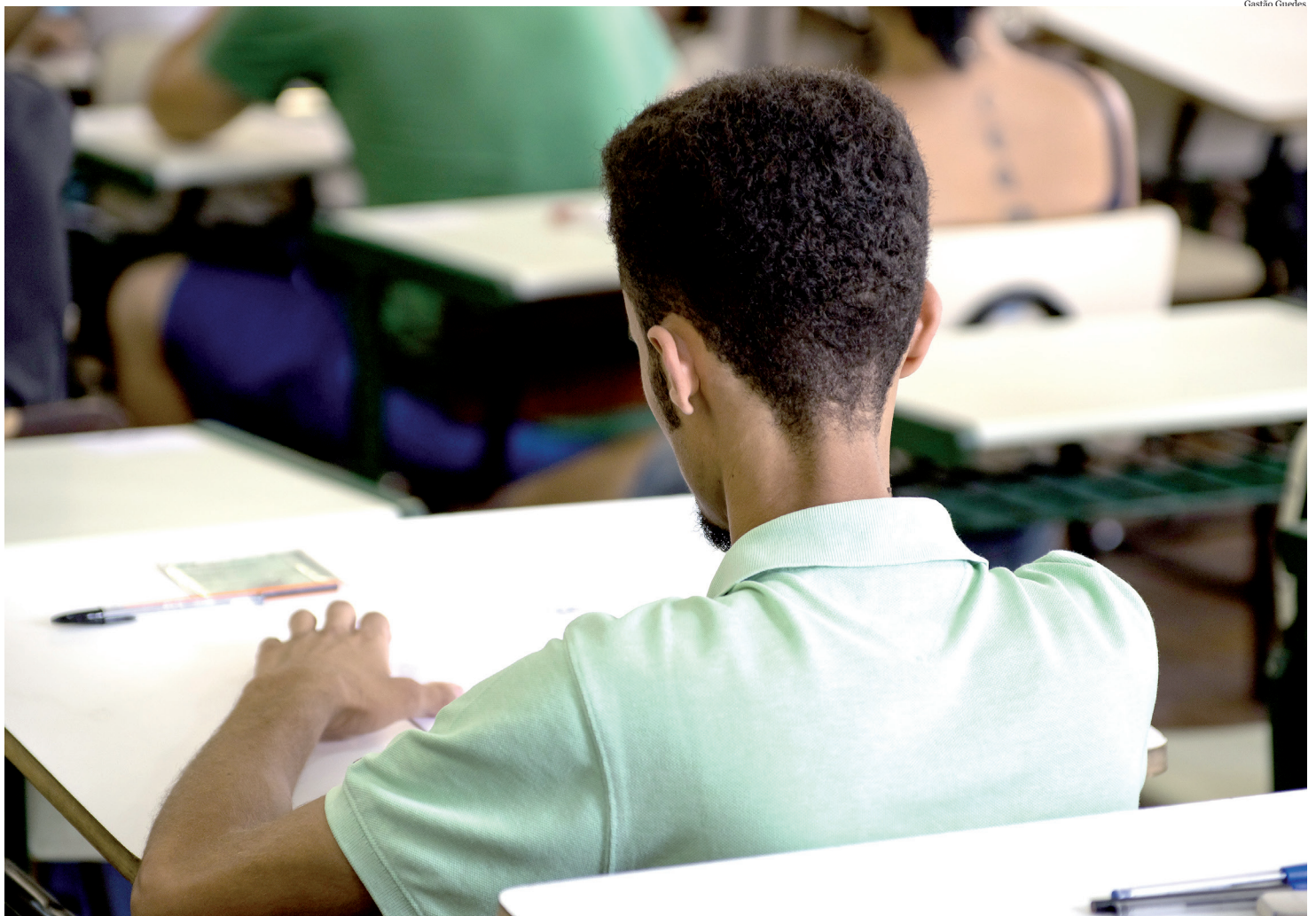
Exame para ingresso no Ensino Superior teve 54 questões de múltipla escolha

gressou no Sistema de Pontuação Acrescida pelo item escolaridade pública deve apresentar histórico escolar ou declaração es-