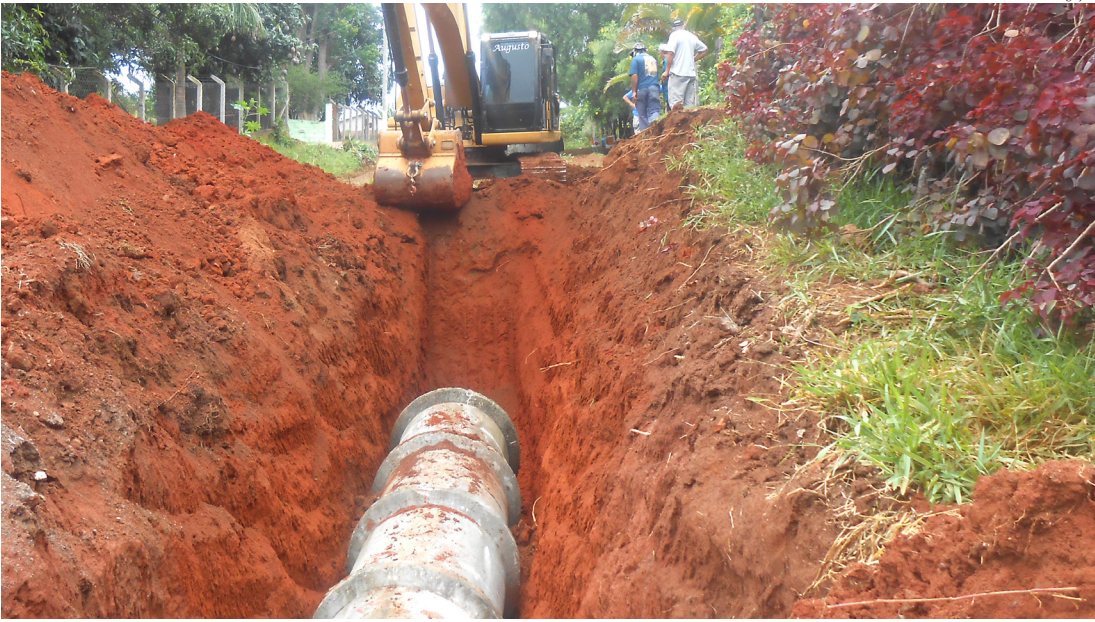
Bairro do Goiabal também recebeu melhorias nas galerias