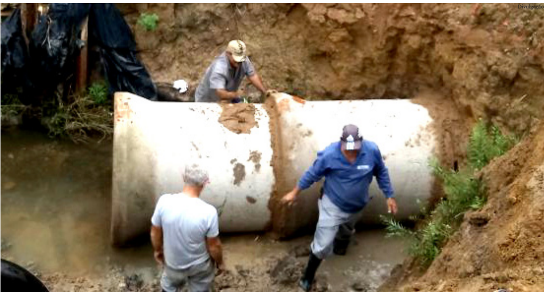
Reparo em galeria da rua Condessa de Vimieiro

Na extensão desta galeria, estão sendo construídos as caixas e os ramais de captação das águas pluviais, essa é a segunda fase da etapa da obra da galeria que trará inúmeros benefícios aos moradores do bairro do Goiabal.