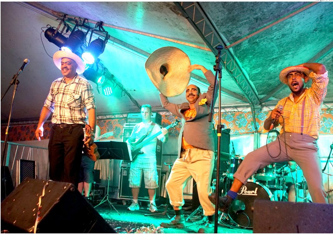
El Sombrero foi bicampeão na edição de 2017