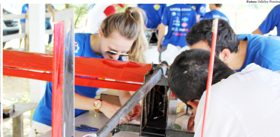
Equipe ajusta aeronaves para decolagem