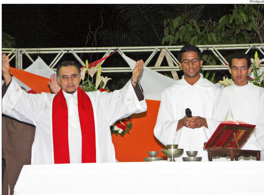
O Lar São Judas Tadeu fica em frente ao Bosque da Princesa. Informações pelo telefone 3642-1975

O evento conta com colaboração de voluntários e apoio de várias empresas, incluindo a Prefeitura de Pindamonhangaba.