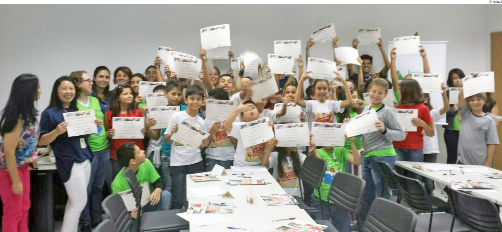
Estudantes receberam certificados

A Gerdau Pindamonhangaba recebeu, recentemente, 40 alunos da Escola Municipal Professor Joaquim Pereira da Silva para compartilhar informações sobre mercado de trabalho e funções básicas de uma empresa. A iniciativa faz parte do programa Introdução ao Mundo dos Negócios e Nosso Mundo, desenvolvido pela Junior Achievement, associação internacional educativa sem fins lucrativos.