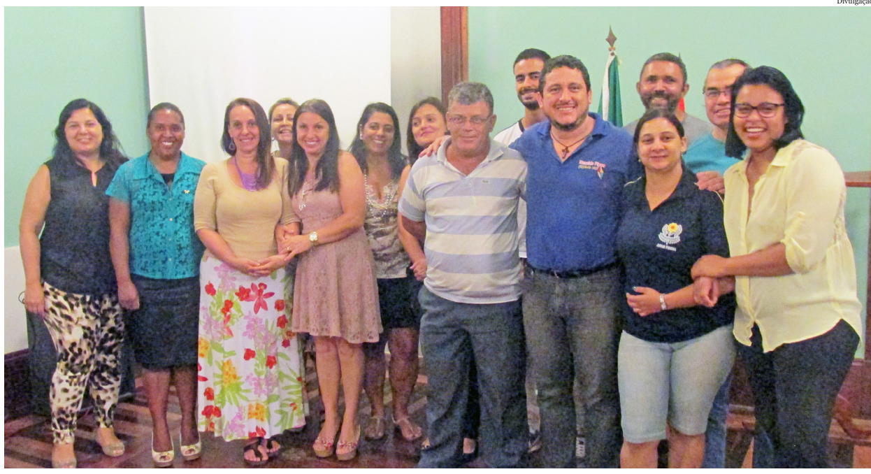
Conselheiros foram empossados para o próximo biênio