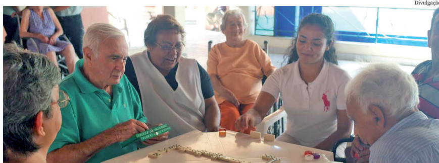
Entidade atende 64 idosos

TROFÉU FÁBIO MENDES - ESCOLA CIDADÃ- PROMOVENDO A CULTURA - EE Prof. Wilson Pires Cesar