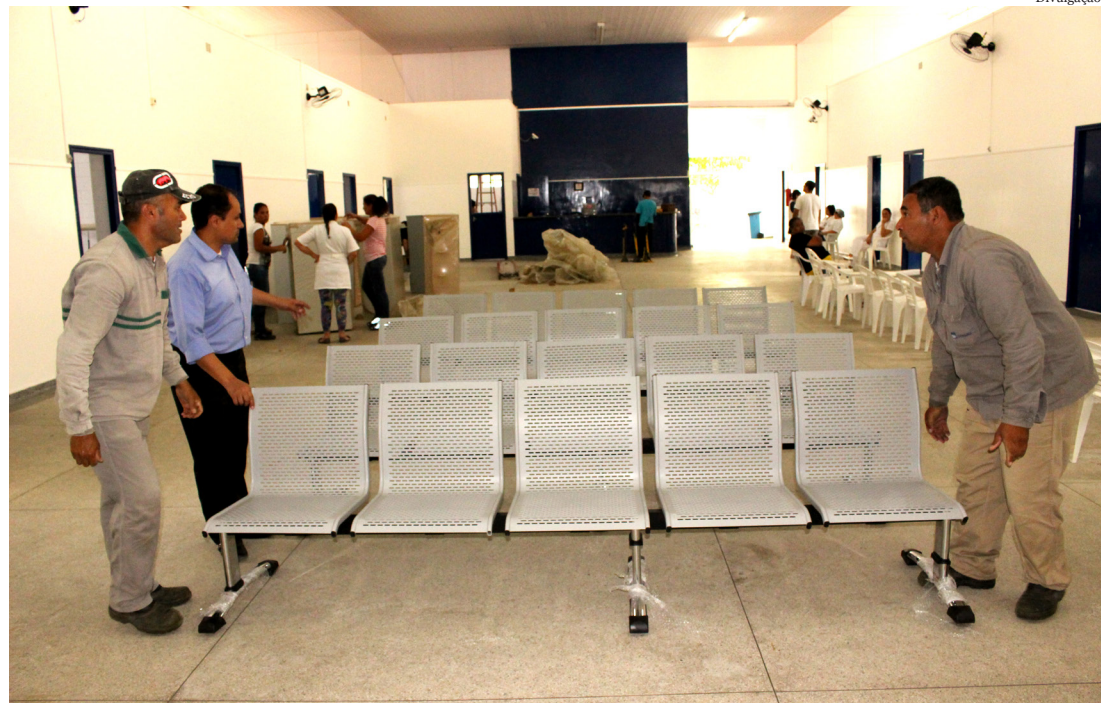
Além da reforma, o prédio recebeu novo mobiliário

A secretária de Saúde e Assistência Social da Prefeitura de Pindamonhangaba comenta que o investimento nas adequações se fez necessário para garantir mais conforto aos profissionais que atuam no local e também para os usuários da unidade. "As reformas e adequações nas unidades seguem a linha de um trabalho mais humanizado e acolhedor. Neste local são atendidas mais de 10 mil pessoas. Também estamos fazendo reforma de outras unidades de saúde e em breve será iniciada a adequação de outras".