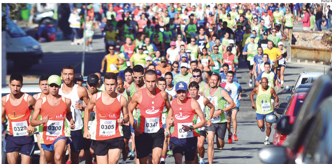
As corridas de rua de Pinda reúnem atletas de várias idades

A prova acontecerá no dia 25, a partir das 9 horas, no Parque da Cidade. As inscrições para novos atletas, caso haja vagas, será realizada entre os dias 19 e 21. Esta prova é organizada pela Prefeitura de Pindamonhangaba, por meio da Secretaria de Juventude, Esportes e Lazer.