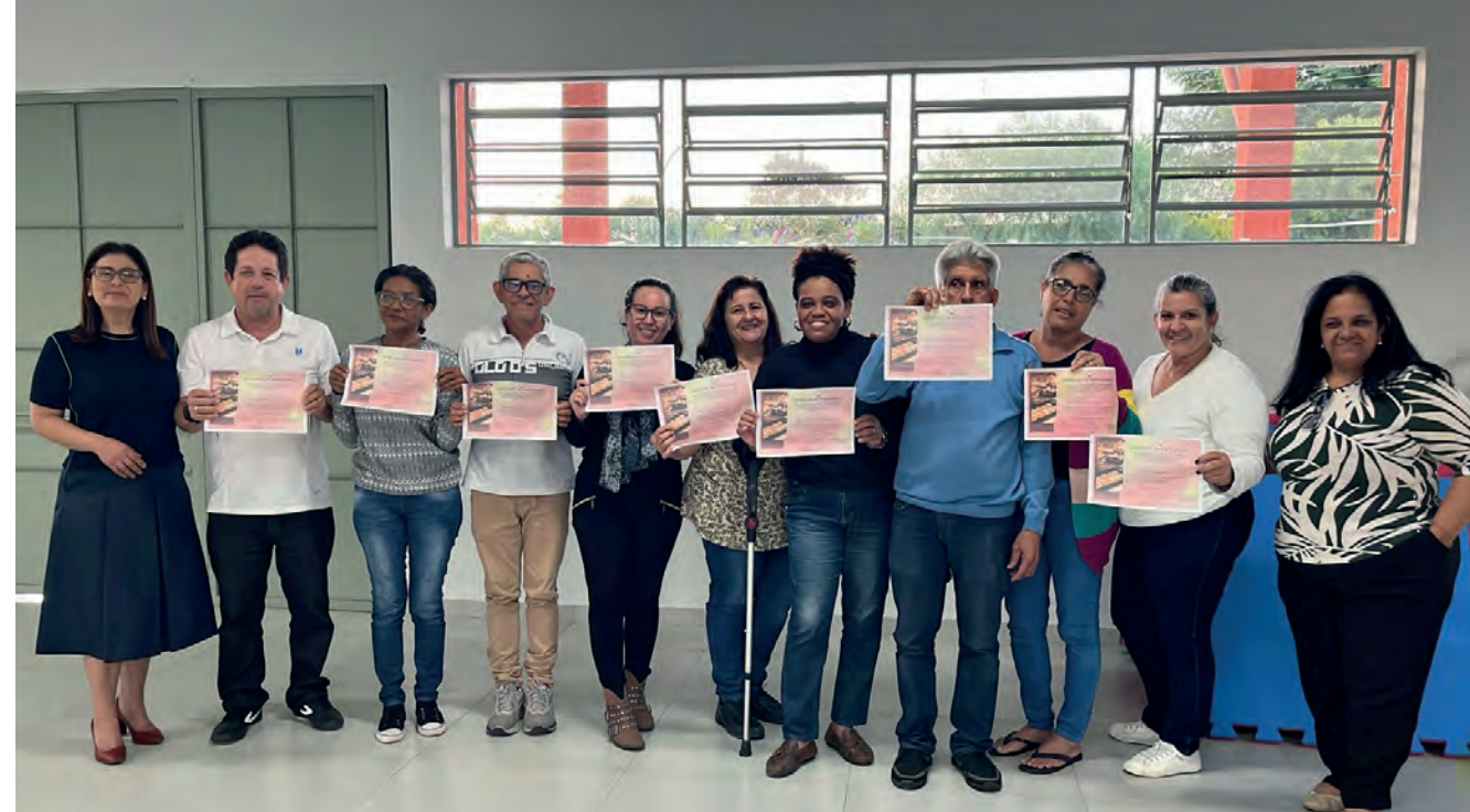
As capacitações são voltadas para o público que busca iniciar ou expandir pequenos negócios

As inscrições para novas turmas são divulgadas pelos canais oficiais da Prefeitura e visam ampliar ainda mais o alcance da política de qualificação e desenvolvimento sustentável em Pindamonhangaba.