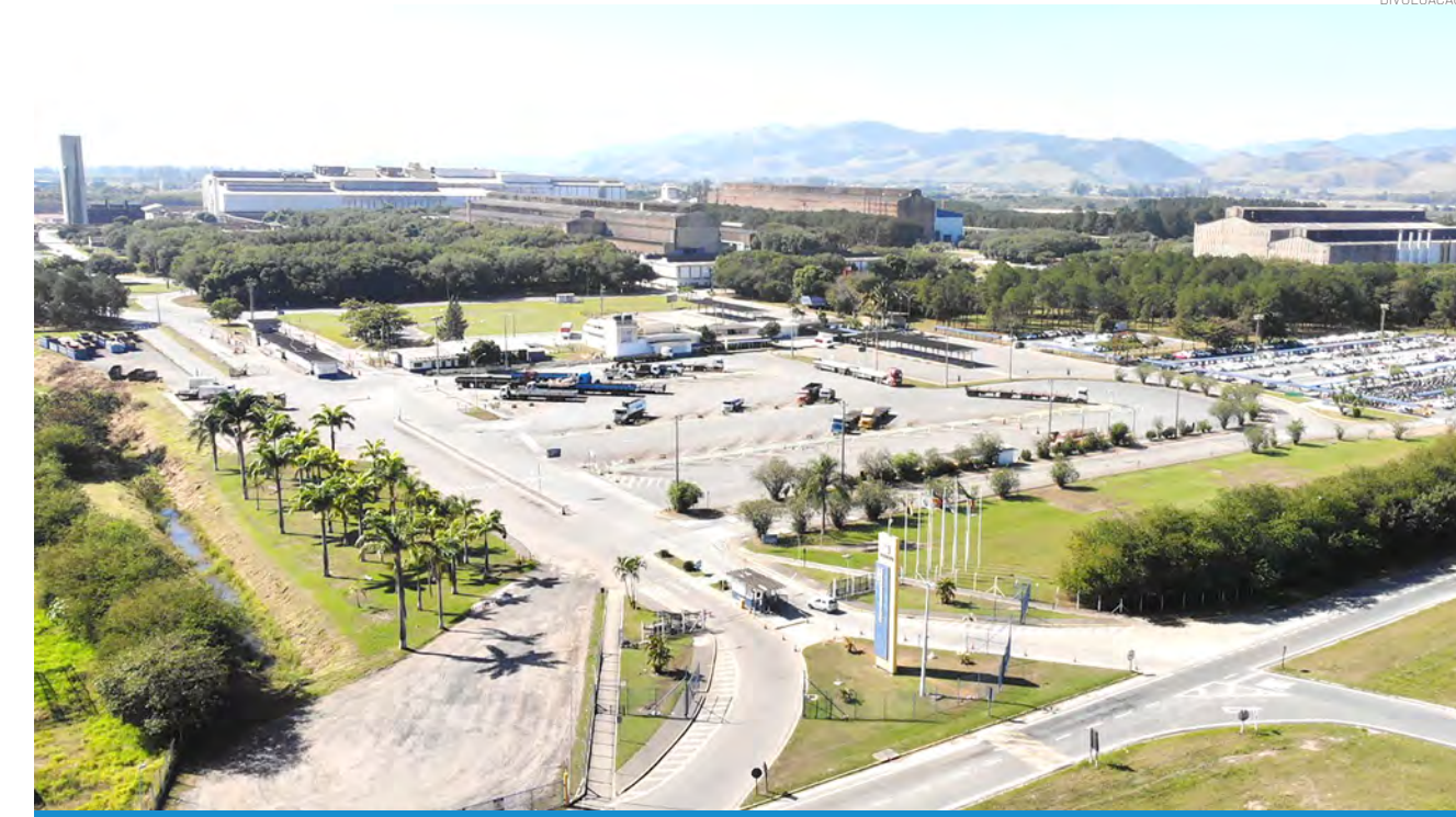
Grande parte do investimento será utilizado para a implementação de um centro de reciclagem