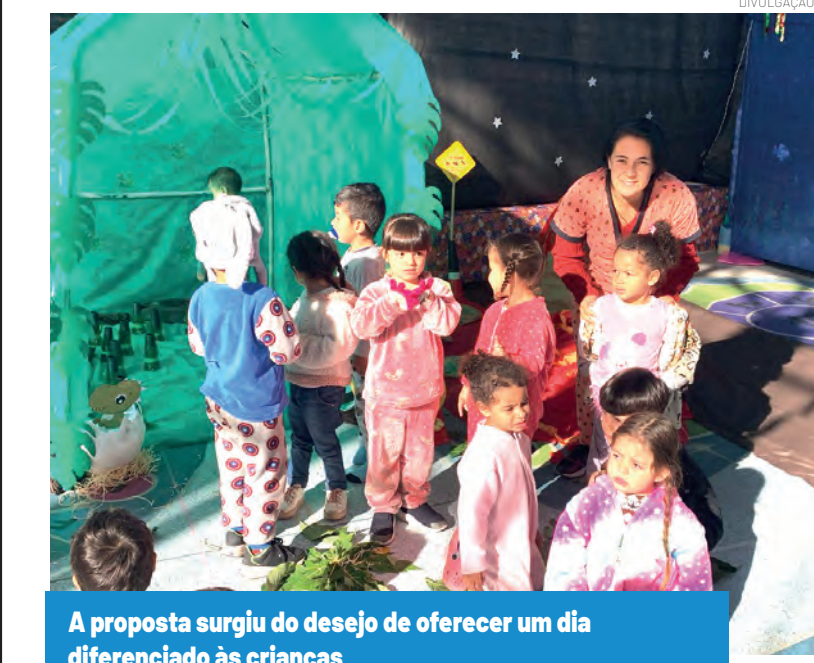
A proposta surgiu do desejo de oferecer um dia diferenciado às crianças

A CMEI Durvalino dos Santos promoveu, na última quinta-feira (26), seu primeiro Acampadentro, um momento de magia, diversão e encantamento pensado especialmente para as crianças. A atividade proporcionou um dia repleto de experiências sensoriais e criativas, estimulando a imaginação e o desenvolvimento infantil.