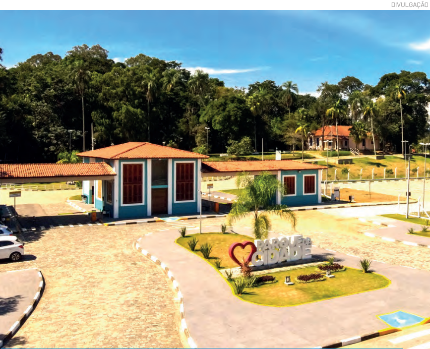
O objetivo é avaliar o nível de satisfação da população em relação aos serviços prestados

A Prefeitura de Pindamonhangaba, por meio da Secretaria de Meio Ambiente, está realizando uma pesquisa sobre a qualidade dos serviços prestados na coleta de resíduos domésticos e de coleta seletiva no município. O objetivo do censo é avaliar o nível de satisfação da população em relação aos serviços prestados e coletar dados para o melhor planejamento dos serviços.