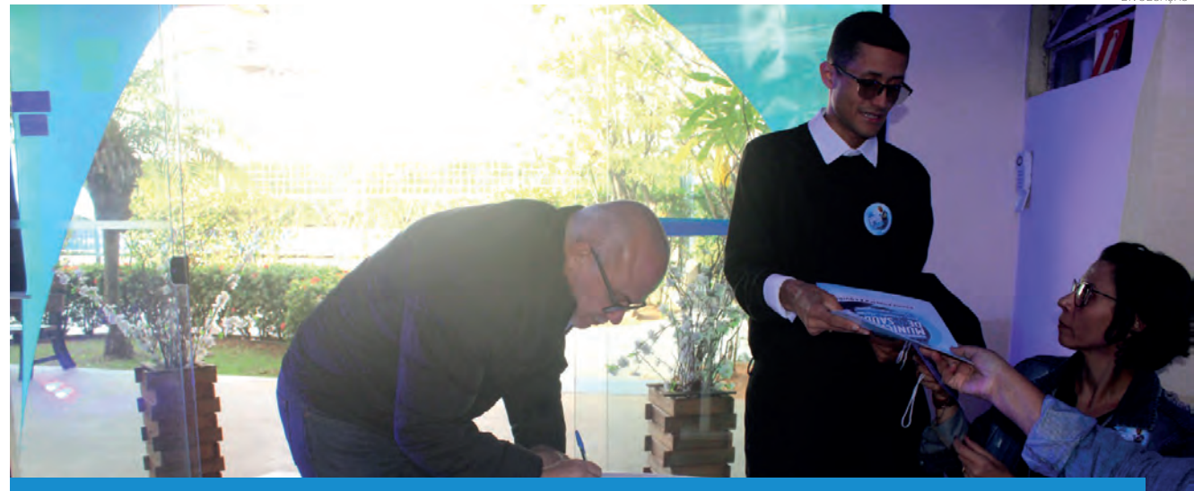
O prefeito Ricardo Piorino destacou a conferência como espaço de construção democrática

O encerramento foi marcado pela entrega de certificados de homenagem aos profissionais da saúde que se destacaram no compromisso com a saúde pública. "Receber esta homenagem na Conferência de Saúde