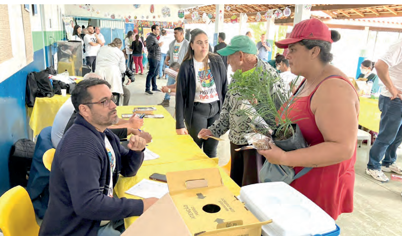
A iniciativa faz parte de uma programação que busca descentralizar os serviços, aproximando a gestão dos cidadãos