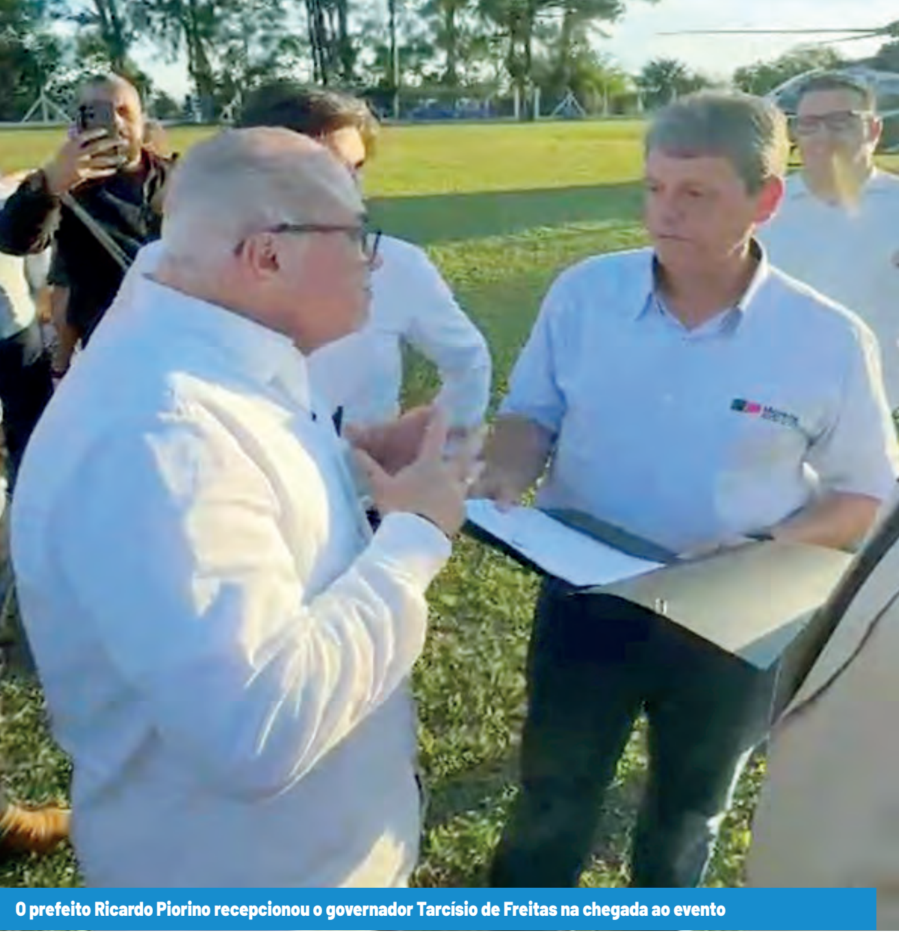
O prefeito Ricardo Piorino recebeu o governador Tarcísio de Freitas na chegada ao evento