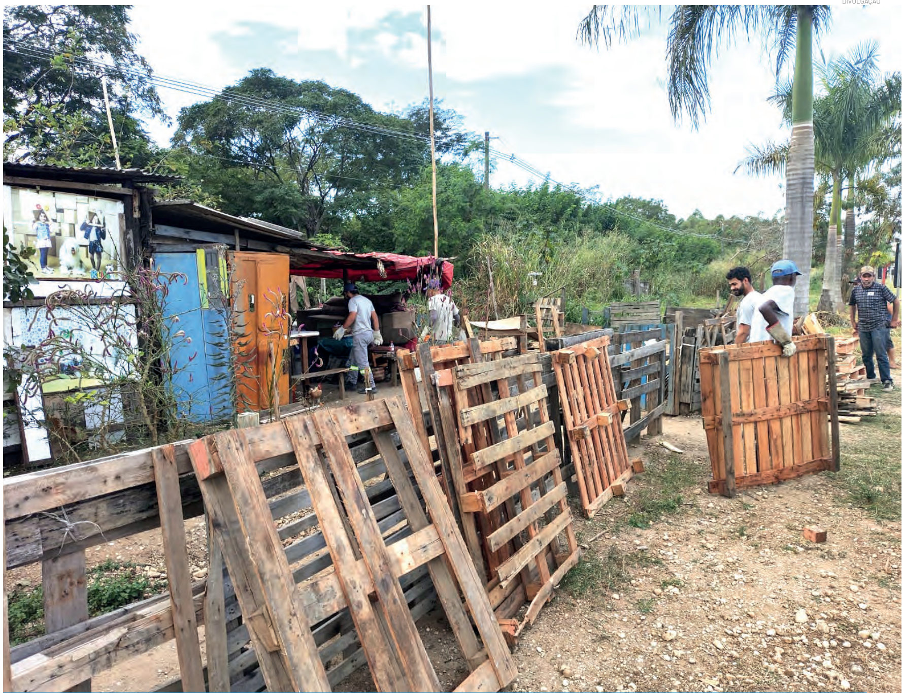
Ação permitiu a realocação de uma nova família, que vivia em situação de vulnerabilidade

A Prefeitura reforça seu compromisso com a dignidade habitacional e com a atuação conjunta entre os órgãos municipais e o Ministério Público para promover melhores condições de moradia à população.