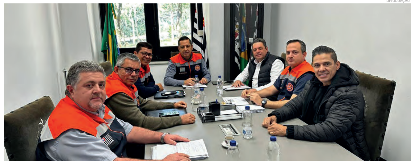
A equipe da prefeitura se reuniu em São Paulo para a reforma da ponte, uma das metas da gestão municipal

A expectativa é de que os próximos passos técnicos avancem nos próximos meses, garantindo mais segurança e desenvolvimento para a região.