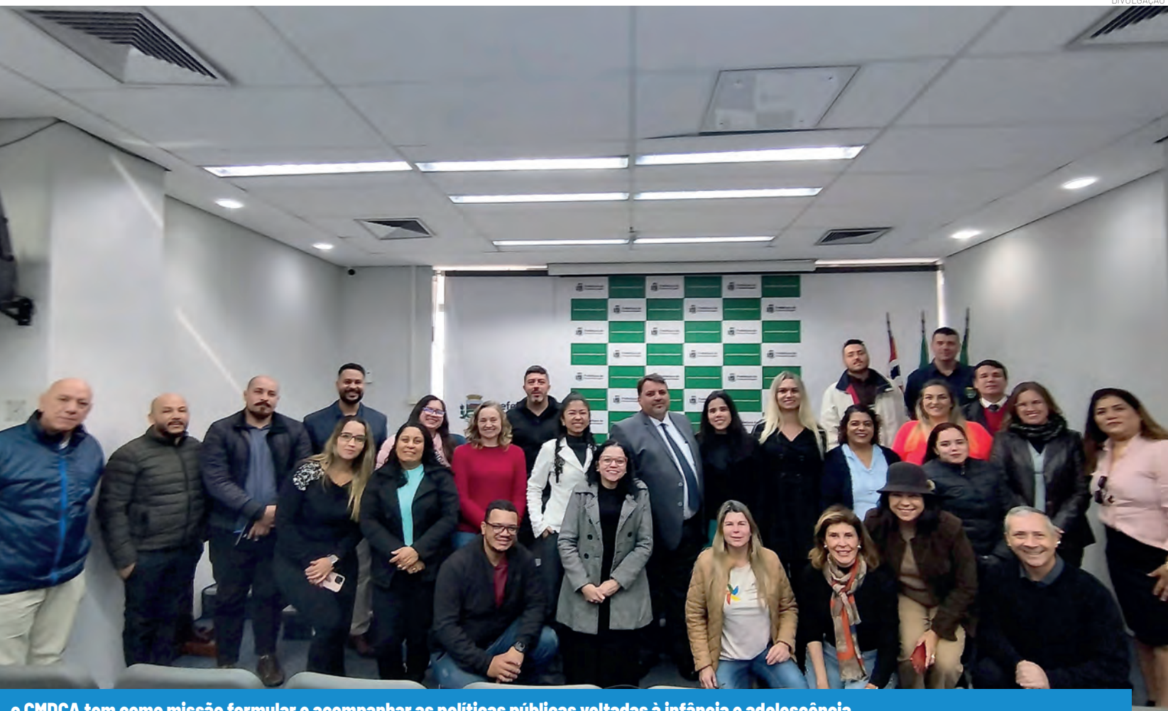
O CMDCA tem como missão formular e acompanhar as políticas públicas voltadas à infância e adolescência