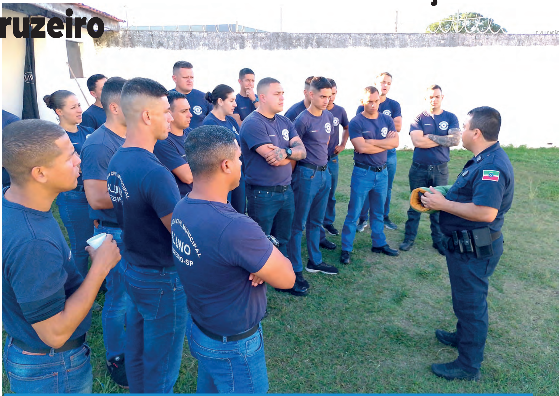
Os alunos da GCM de Cruzeiro participaram de uma programação voltada ao intercâmbio

A ação fortalece o relacionamento entre as corporações da região e contribui para o aprimoramento técnico e operacional das Guardas Cívicas Municipais.