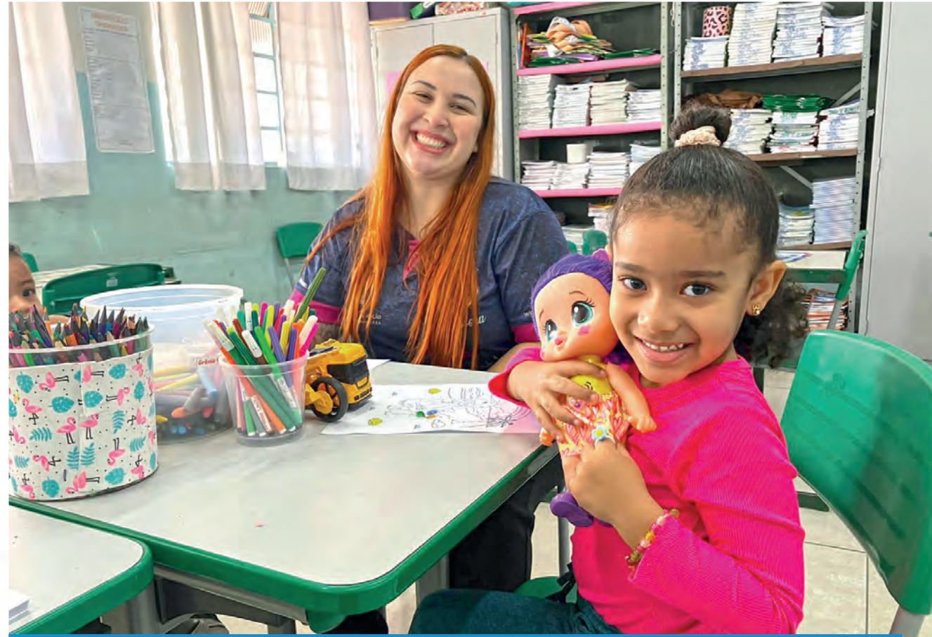
Programa reúne diversas secretarias para trazer os serviços da Prefeitura mais próximos da população