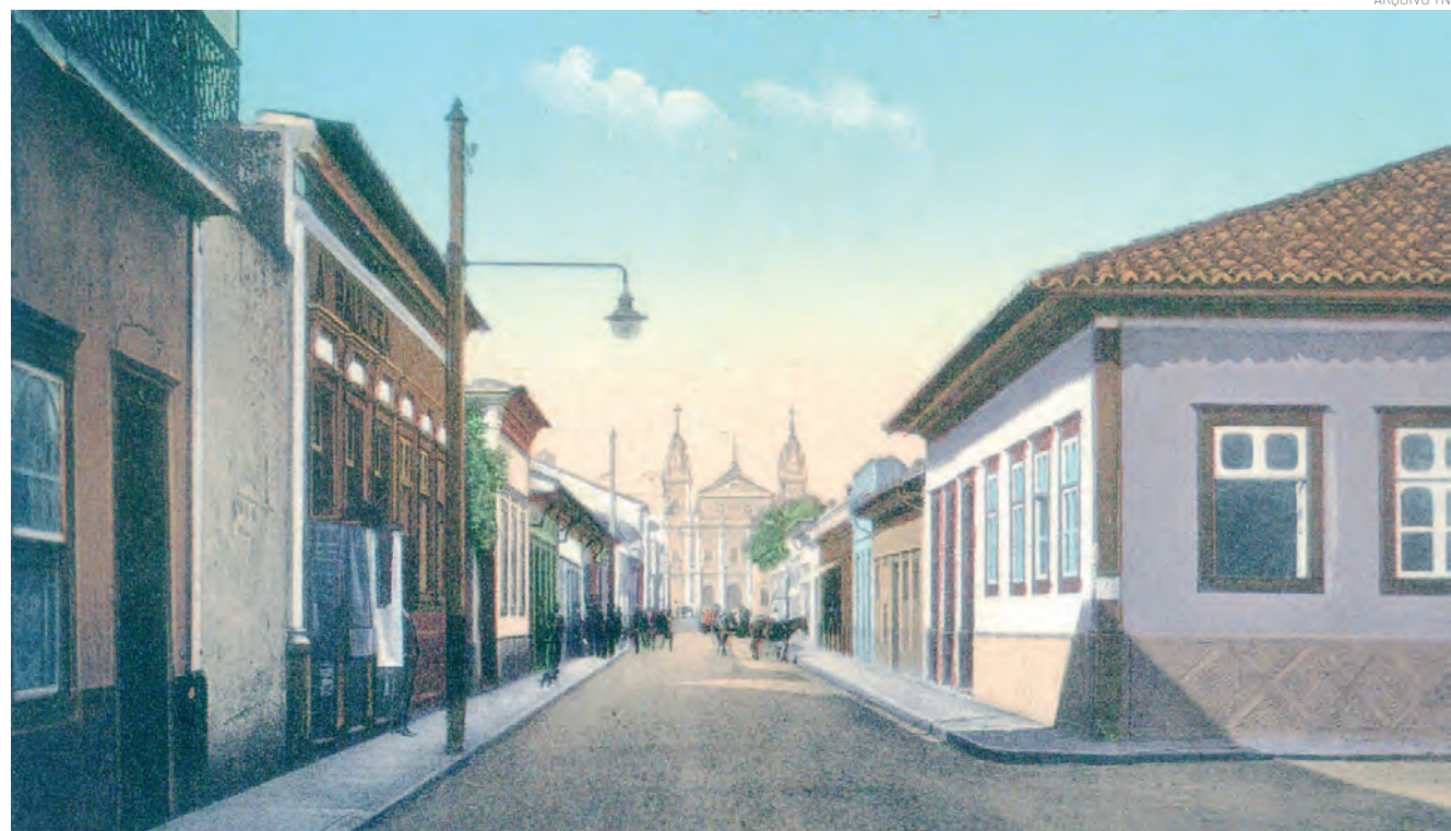
Final da Rua Bicudo Leme, que no início do século XX era conhecida por ali se concentrar os mais importantes estabelecimentos comerciais

Frustrada essa tentativa criminosa, tomaram a deliberação de conduzir o pesado cofre para fora, o que dá a entender que a quadrilha era numerosa.