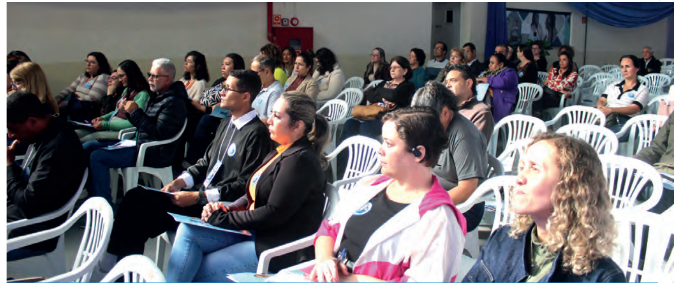
A população esteve presente para discutir pautas fundamentais

é motivo de profunda gratidão. Essa trajetória foi construída com amor pela ciência, dedicação e compromisso com a saú-