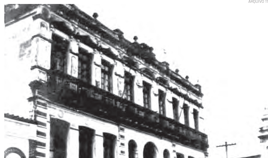
Quando esteve nos baixos do Palacete 10 de Julho (prédio da Prefeitura, foto acima), em 1972, suas oficinas, escritório e redação funcionavam nos porões (as três janelinhas de baixo, do lado esquerdo)