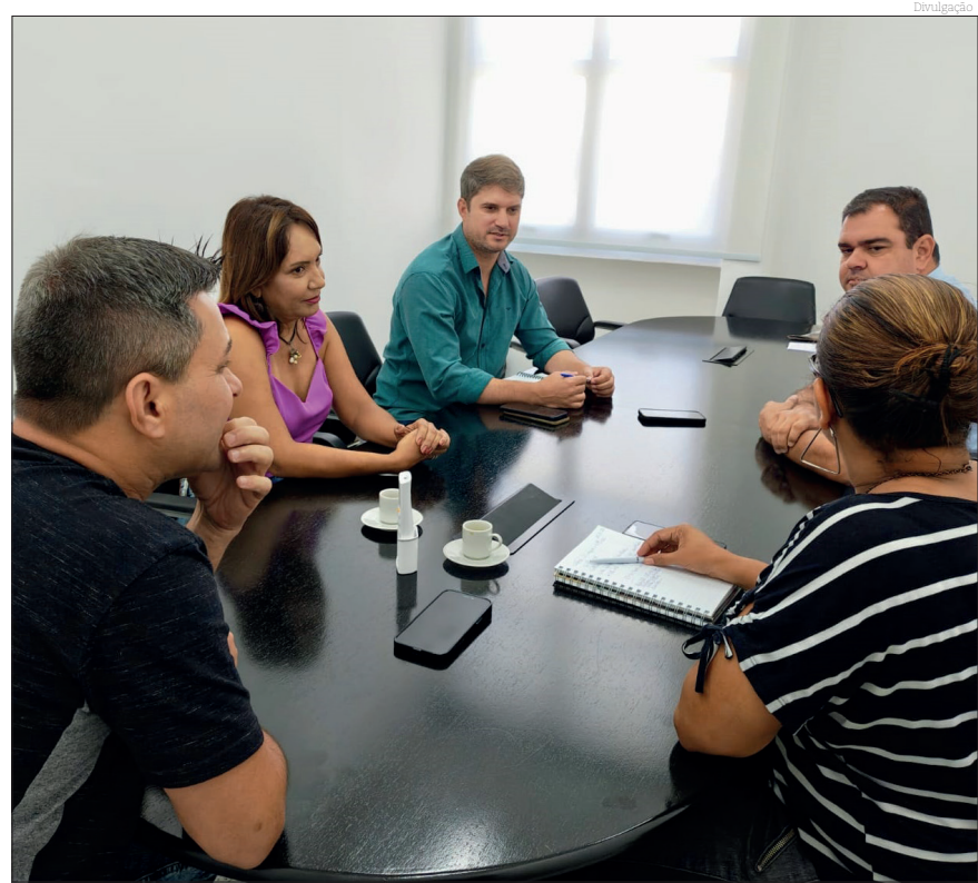
A secretária da Educação vistoriou escolas e se reuniu com vereadores