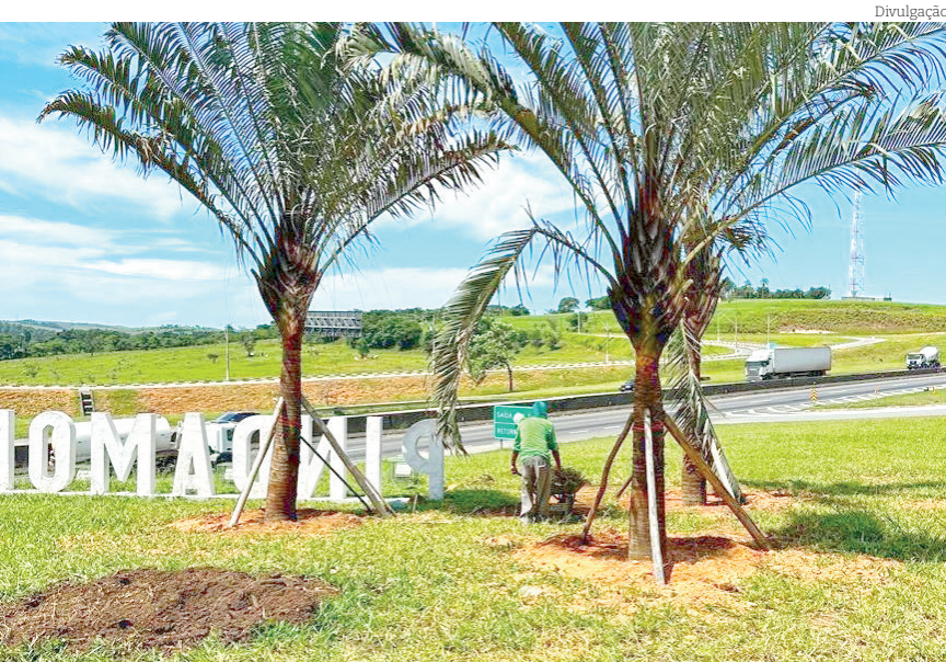
Entrada da cidade recebe serviços de capina e jardinagem

Entrada da Cidade - Av. NS Bom Sucesso recebe prioridade total - A região recebeu serviços de jardinagem e capina, proporcionando mais segurança e melhorando o aspecto visual da avenida.