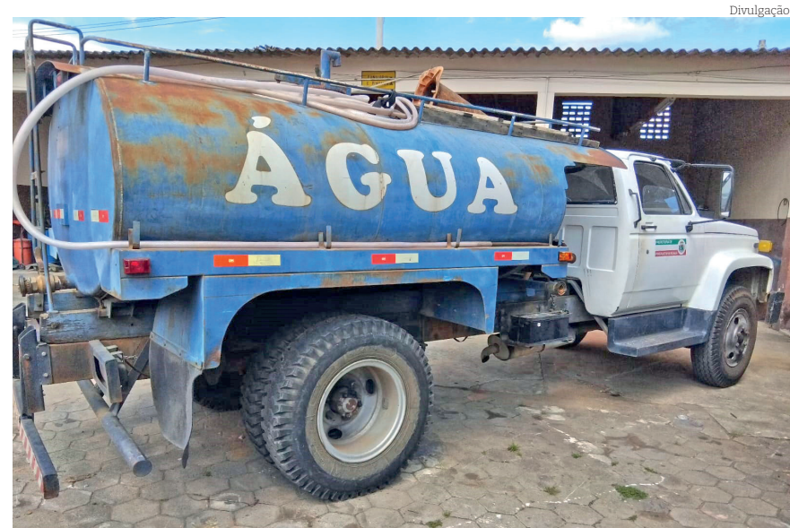
Veículos da frota de serviço estão recebendo manutenção

Acesso em frente ao Teatro Galpão - Foi construído um novo acesso em frente ao Teatro Galpão, facilitando a mobilidade dos moradores do bairro Parque das Nações e melhorando a conexão com a Avenida Nossa Senhora do Bom Sucesso.