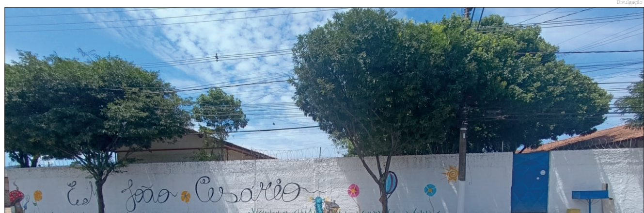
O evento será mensal para oferecer serviços em várias áreas

“A escolha do sábado se deu por ser um dia em que o município pode tirar para resolver essas