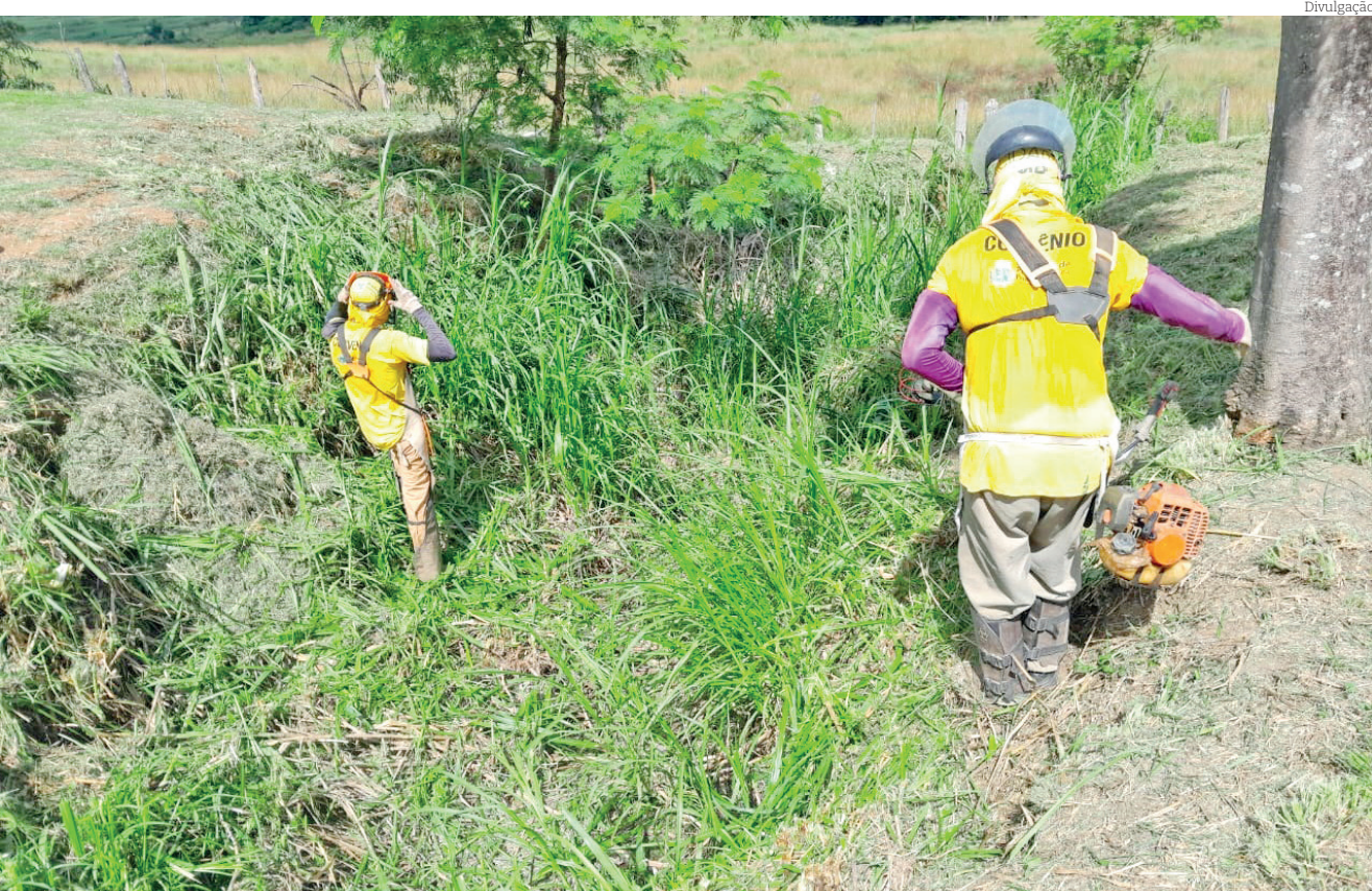
Prefeitura de Pinda mantém intenso cronograma de serviços de zeladoria por todo o município