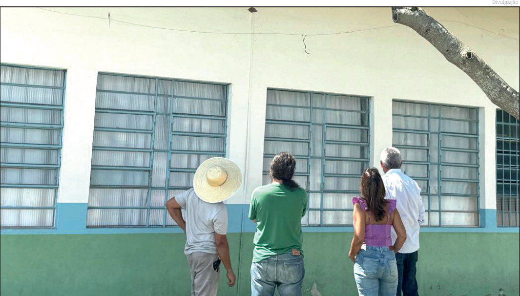
Escola Lauro Vicente de Azevedo recebe reparos no telhado