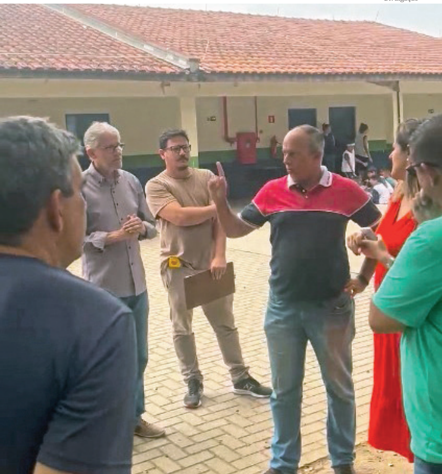
Programa visa aproximar a administração municipal do cidadão

Pinda promove reunião com secretarias para fortalecimento da Defesa Civil