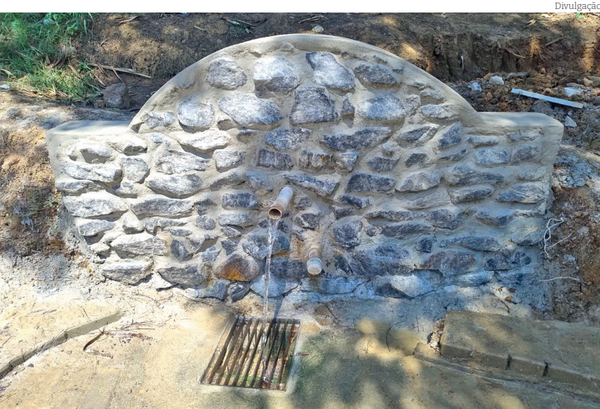
A tradicional Bica da Vila Suíça passou por revitalização