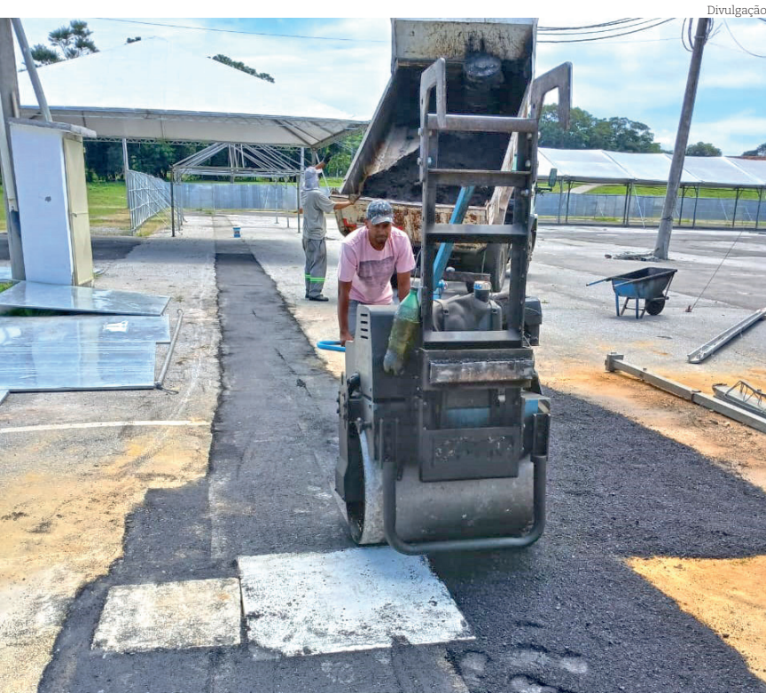
Recapeamento foi realizado na Arena do Parque da Cidade

ram desde a zona urbana até a rural. Confira algumas das ações de zeladoria que impactam silenciosamente a vida dos moradores da cidade, que foram realizadas na última semana.