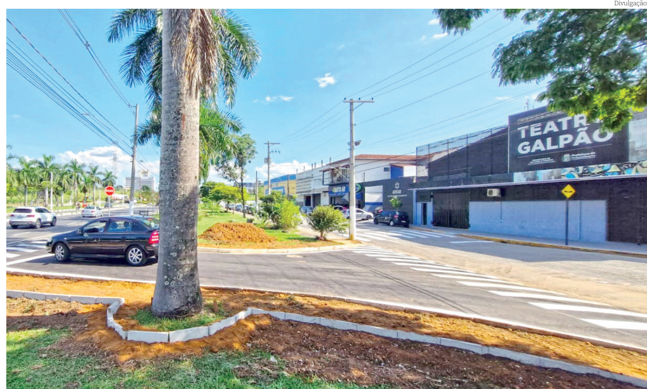
Na avenida Nossa Senhora do Bonsucesso, um novo acesso foi construído próximo ao Teatro Galpão

Com essas ações, Pindamonhangaba segue investindo na infraestrutura e manutenção da cidade, assegurando mais conforto, segurança e qualidade de vida para seus moradores.