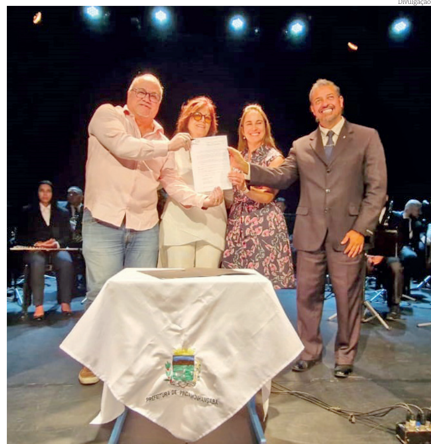
Decreto reconhece Euterpe como patrimônio imaterial da cidade