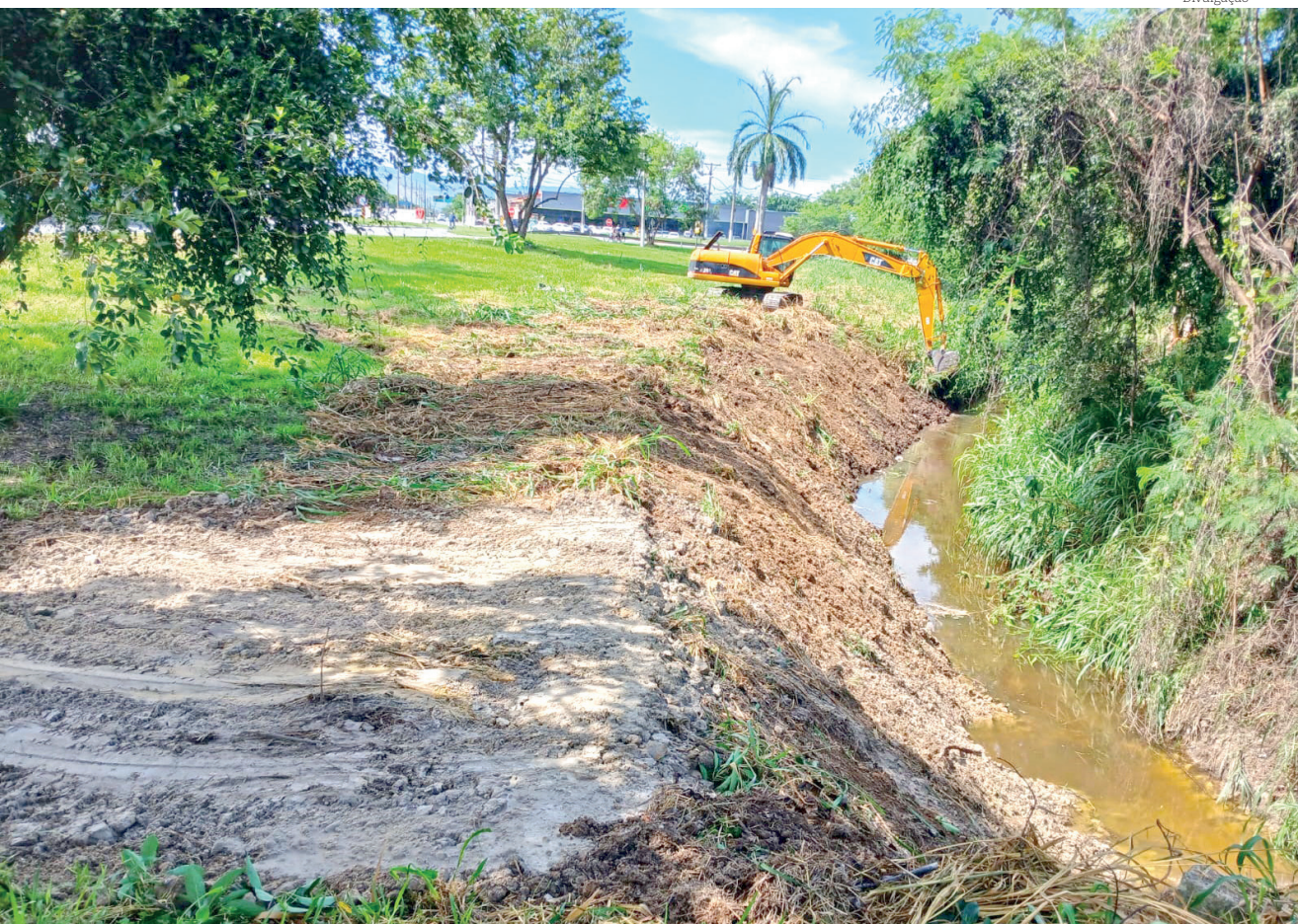
Prefeitura de Pinda prossegue seu cronograma promovendo melhorias em diversas regiões