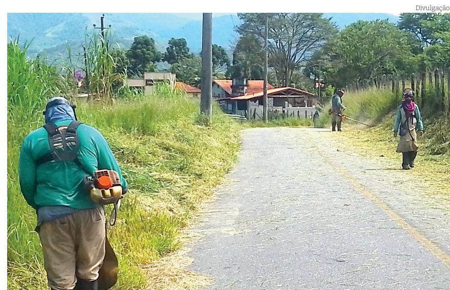
Manutenção na estrada de acesso ao bairro da Cerâmica