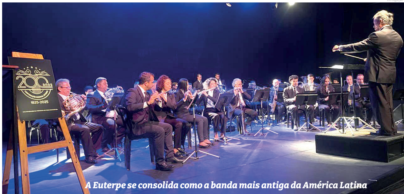
A Euterpe se consolida como a banda mais antiga da América Latina

Em seguida, foi realizada a cerimônia de assinatura do decreto nº 6813, de 17 de fevereiro de 2025, que registra a Corporação Musical Euterpe como bem cultural de natureza imaterial, considerando a aprovação do registro da Corporação como bem cultural de natureza imaterial em reunião ordinária do Conselho Municipal de Patrimônio Histórico, Cultural, Ambiental e Arquitetônico de Pindamonhangaba, realizada no dia 11 de julho de 2024, com referência a processo e laudo técnico elaborado