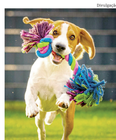
Brinquedos mordedores: seu cãozinho simplesmente adora

Enquanto você vai curtir seu carnaval e o seu “cãopanheiro” fica em casa, deixe brinquedos divertidos para ele se distrair. Os brinquedos mordedores são bem-vindos neste caso! O ato de roer ajuda seu cãozinho a se distrair e a gastar energia. Você também pode esconder petis-