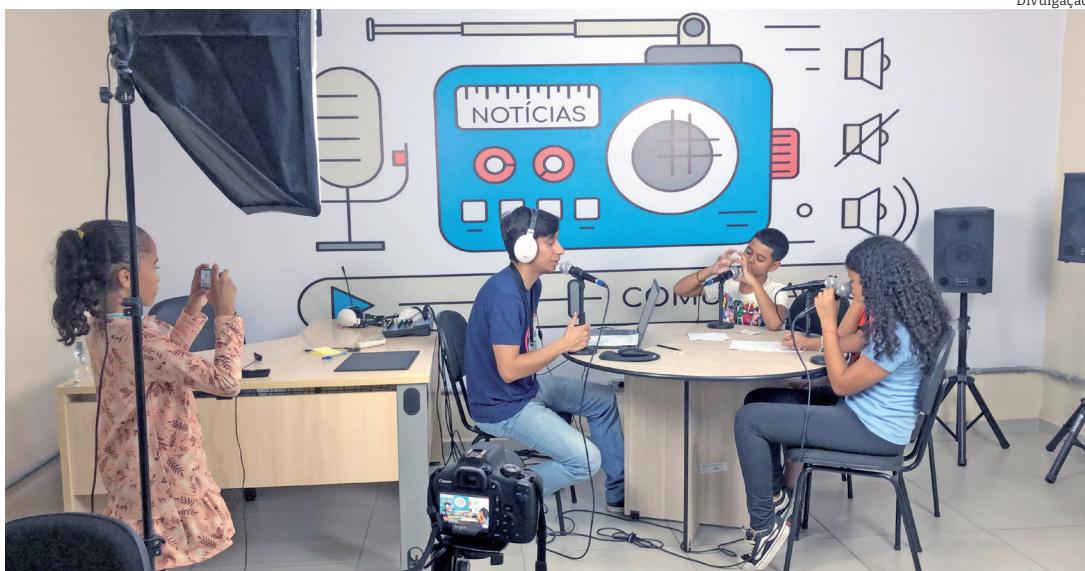
O 'Pinda Educa' mais oferece diversas oficinas aos alunos da rede municipal de ensino

Esta é mais uma iniciativa da Secretaria Municipal de Educação de Pindamonhangaba . Entre em contato para tirar suas dúvidas e fazer a pré-inscrição. Whatsapp: 012 98301-0096.