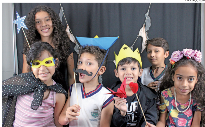
As crianças se divertem e aprendem novas habilidades

Em 2025, com algumas mudanças e melhorias, o Núcleo continua com as suas atividades e convida todos os alunos do ensino fundamental da Rede Municipal a se inscreverem nas oficinas de Fanzine/ E-zine, Rádio/ Podcast, Animação, Fotografia, Jornal Digital, Libras e também Braille, sendo esta oficina exclusiva para alunos e familiares que