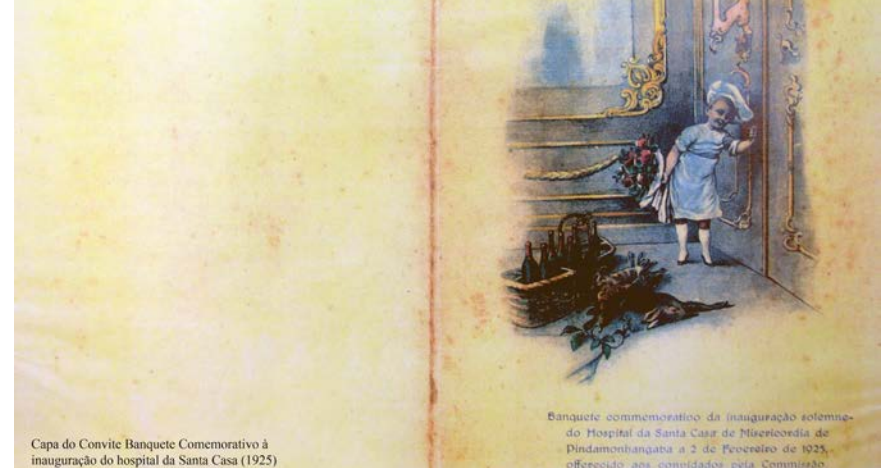
Capa do Convite Banquete Comemorativo à inauguração do hospital da Santa Casa (1925)