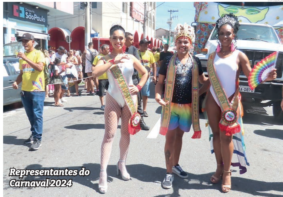
Representantes do Carnaval 2024

“É uma alegria muito grande recuperarmos essa tradição de Pindamonhangaba com o concurso da Corte do Carnaval. Agradecemos o apoio dos nossos parceiros e tenho certeza de que será uma festa muito bonita, que vai engrandecer ainda mais nosso Carnaval 2025”, afirmou o secretário adjunto de