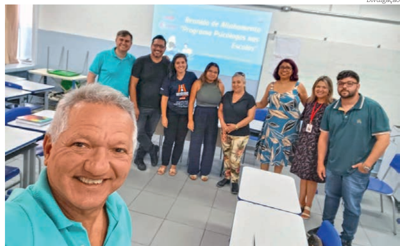
Reunião de alinhamento aconteceu na última terça-feira (28)

A abordagem dos temas voltados as questões de saúde mental são de extrema importância serem tratados no ambiente escolar, assim como temáticas como