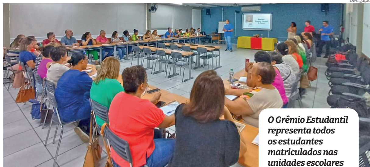
O Grêmio Estudantil representa todos os estudantes matriculados nas unidades escolares