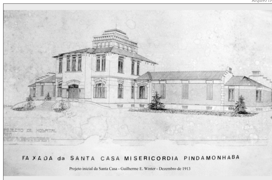
O projeto inicial para a construção, autoria do arquiteto Dr. Guilherme Winter

"Segunda-feira, 2 de fevereiro, sob um brilhante sol de bençãos à população nossa, toda em júbilo, inaugurou-se o prédio da Nova Santa Casa de Misericórdia. Erguida ao norte da cidade e em meio à verdejante campina, alvejando com sua cúpula o azul sem fim na ânsia de querer ajoelhar-se aos pés de Deus para falar-lhe dos agradecimentos dos desvalidos, ou, soberanamente ativa na forma material e modestamente lha-na no seu objetivo espiritual de agasalho aos sofredores - porque a caridade não ostenta púrpuras nem ouro - o pavilhão recém inaugurado constitui uma glória para Pindamonhangaba, e justa ufania para o nosso povo, que tanto contribuiu, na medida de suas bolsas, para a