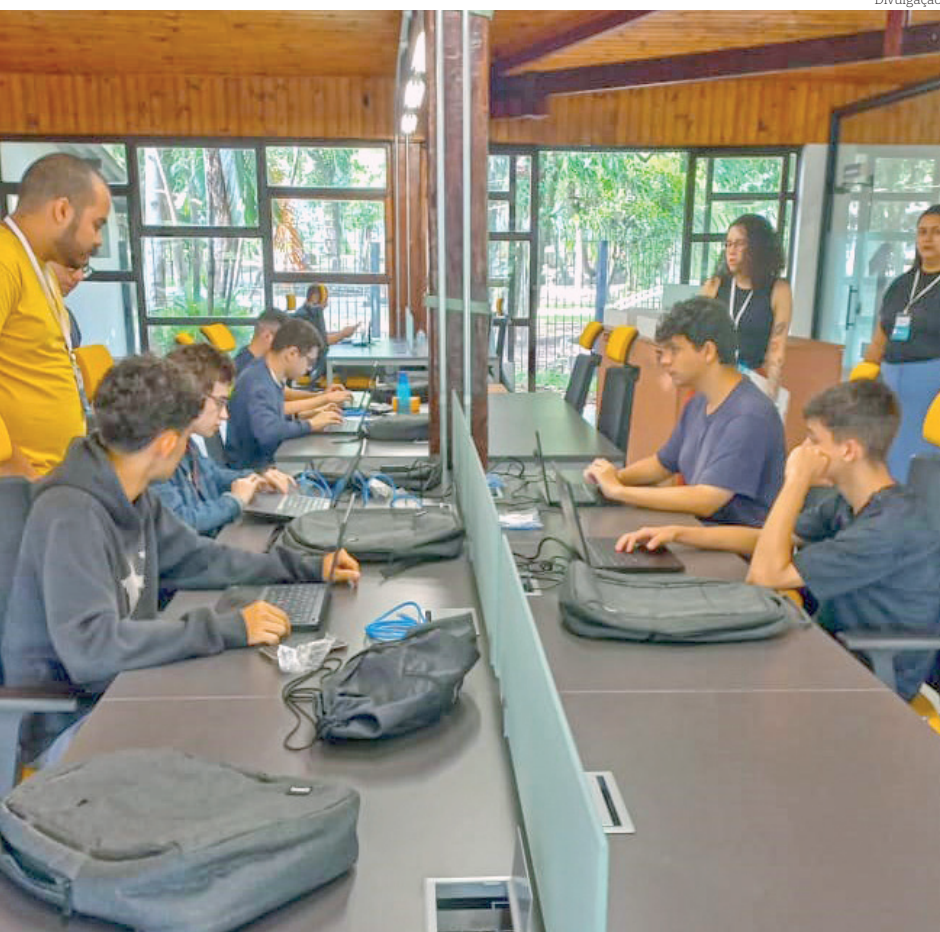
O evento incentivou habilidades tecnológicas nos jovens participantes

Com iniciativas como essa, fica evidente a importância da educação e da tecnologia como instrumento essencial para formar as lideranças do futuro e promover a inclusão de jovens talentos no mercado de trabalho.