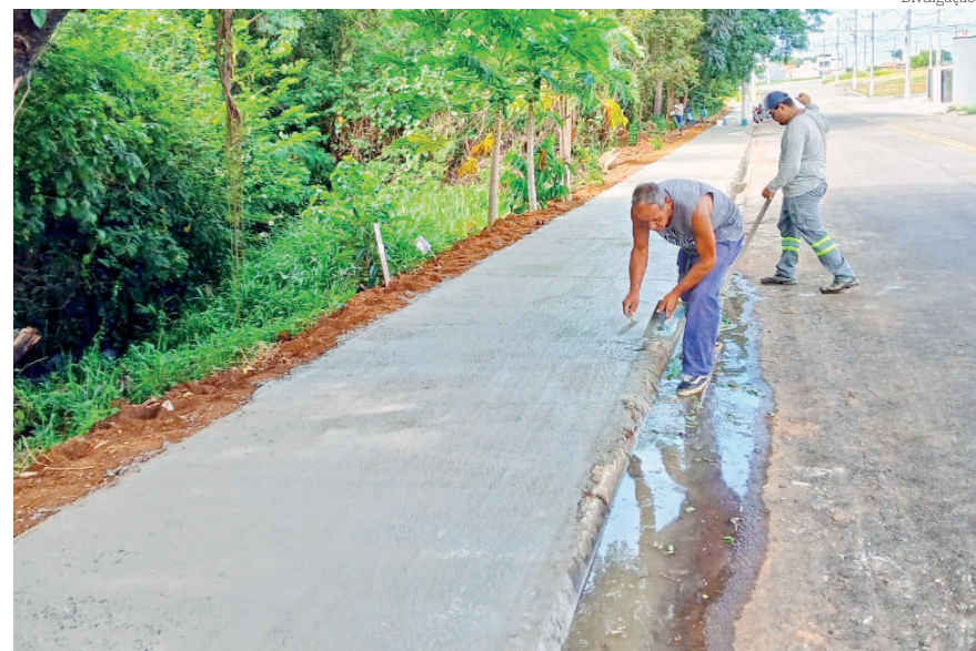
Calçadas trazem mais segurança aos moradores

O bairro Flamboyant, na região do Mombaça, recebeu na última semana mais um trecho com construção de calçada, objetivando trazer mais segurança aos moradores dessa região.