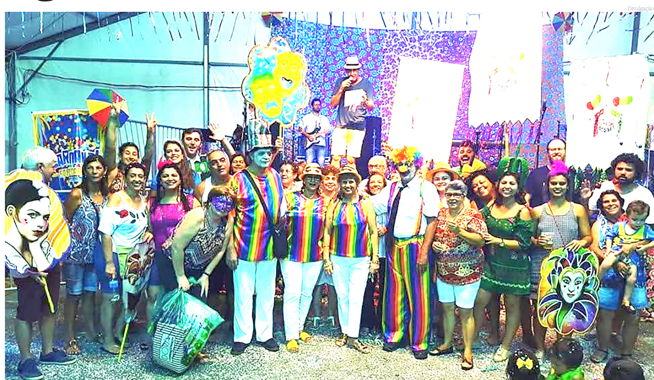
Homenageado, fantasiado, junto com sua torcida em uma das edições do festival de marchinhas