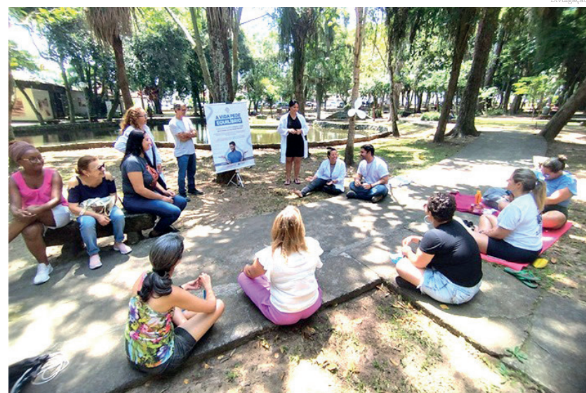
Ações do Janeiro Branco nos últimos anos em Pinda

Desde que foi criado, Pindamonhangaba participa de forma ativa em ações de orientação e de conscientização sobre saúde mental.