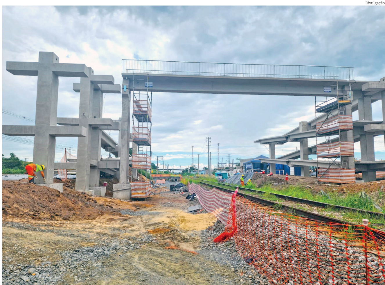
Passarela terá rampas e escadas, proteção lateral e completa iluminação para os pedestres