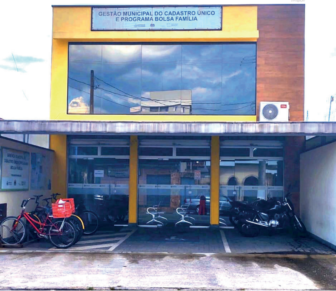
Os atendimentos serão realizados por agendamento

A única exceção em relação ao agendamento são as famílias que estão com o BPC suspenso ou possuem agendamento prévio no INSS. Nesses casos não é necessário realizar o agendamento, e essas famílias serão atendidas imediatamente ao comparecerem ao setor.