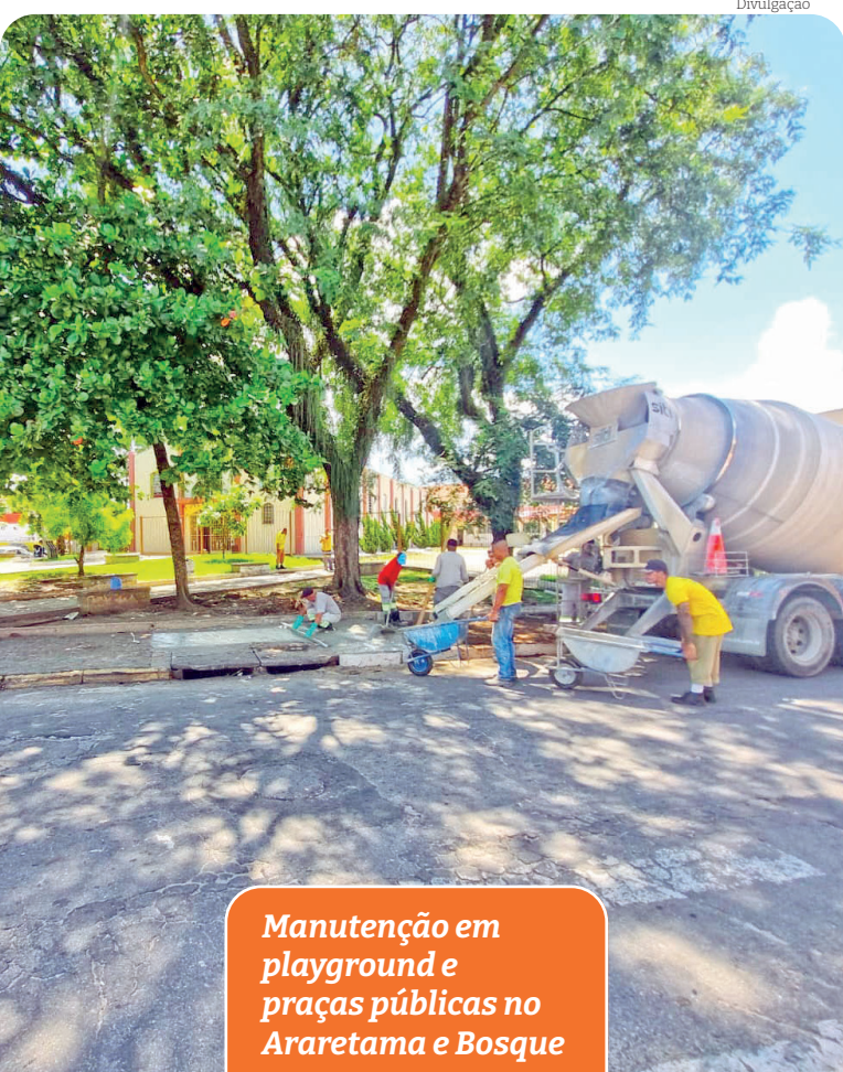
Manutenção em playground e praças públicas no Araretama e Bosque

instalação elétrica. Recentemente regiões como Estrada da Sapucaia, Pau D'Alho, Pinhão do Borba e Pinhão do Una receberam os serviços.