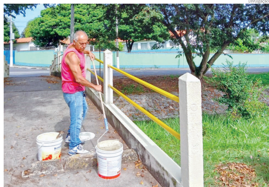
Equipes realizam manutenção e pintura nas passarelas

aconteceu na Av. Amador Bueno (próximo ao Shopping Pátio), no córrego entre os bairros Campos Maia e Jardim Rezende, na avenida principal de acesso ao Mombaça, Av. NS Bom Sucesso (entrada da cidade) e Av. Abel Fabrício Dias (acesso à Moreira César).