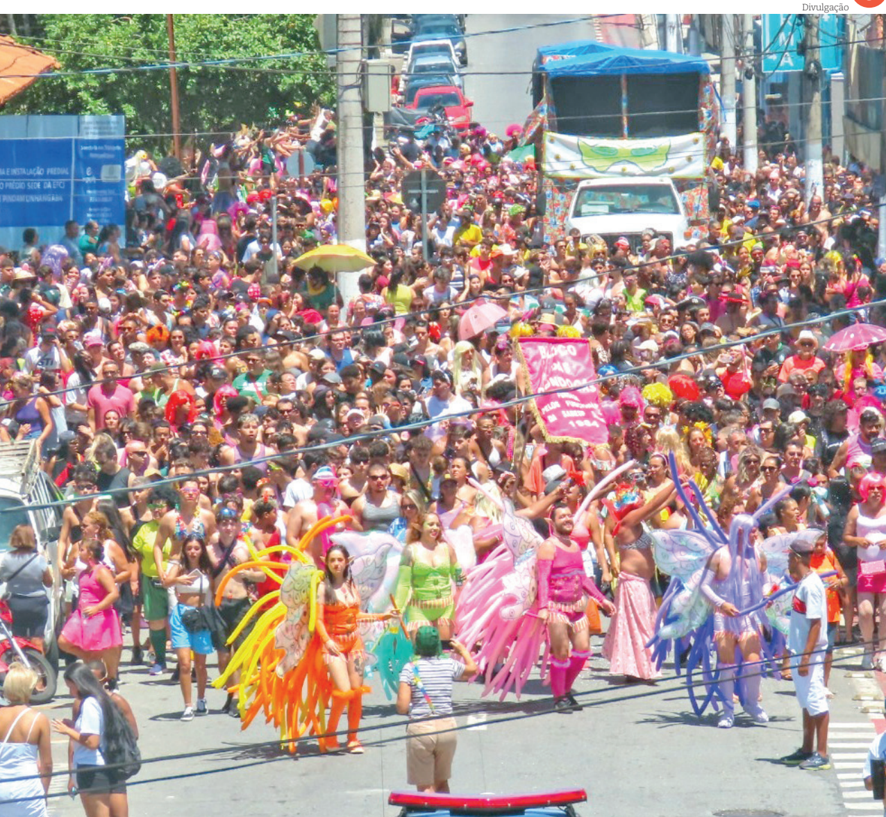
Os desfiles dos blocos de rua serão uma das atrações da programação do Carnaval 2025