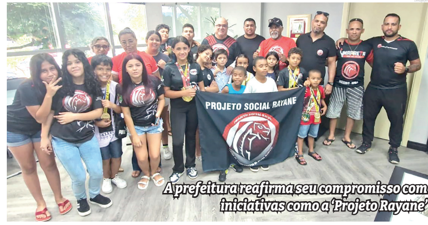
A Prefeitura reafirma seu compromisso com iniciativas como o 'Projeto Rayane'.