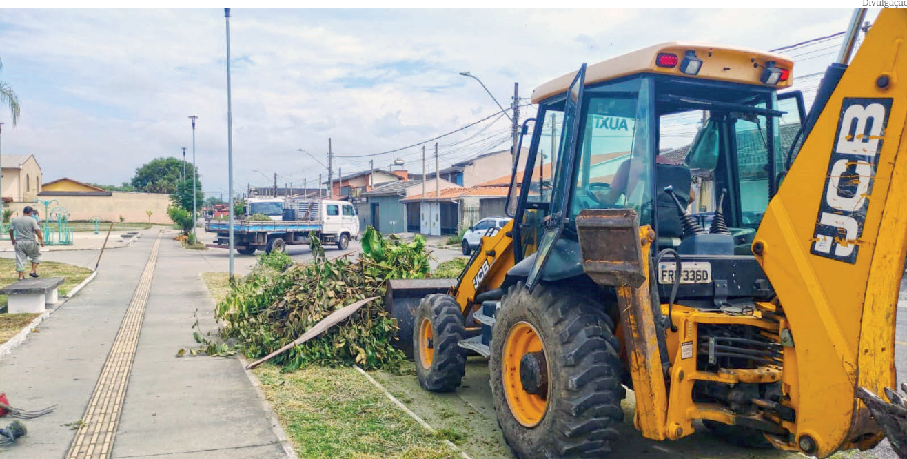
Bairros como Azeredo, Karina, Mantiqueira, entre outros, receberam serviços de limpeza

Subprefeitura de Moreira César, Mobilidade e Trânsito, Meio Ambiente e Assuntos Rurais. Confira neste Especial Zeladoria os principais trabalhos realizados nos últimos dias.