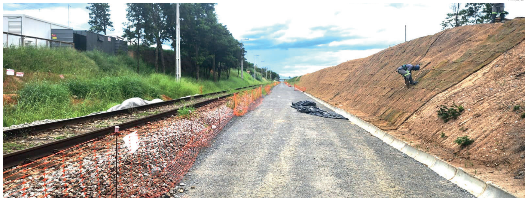
O novo pátio vai eliminar a parada do trem no centro da cidade

Além dessas obras, outra grande melhoria em execução pela empresa no município é a construção do viaduto da Avenida Estrutural, nova via pública que fará a ligação Moreira César-Feital. O viaduto, investimento avaliado em R$ 20 milhões, está em fase final de construção, ao lado da indústria Novelis e irá melhorar a mobilidade urbana dessa região.