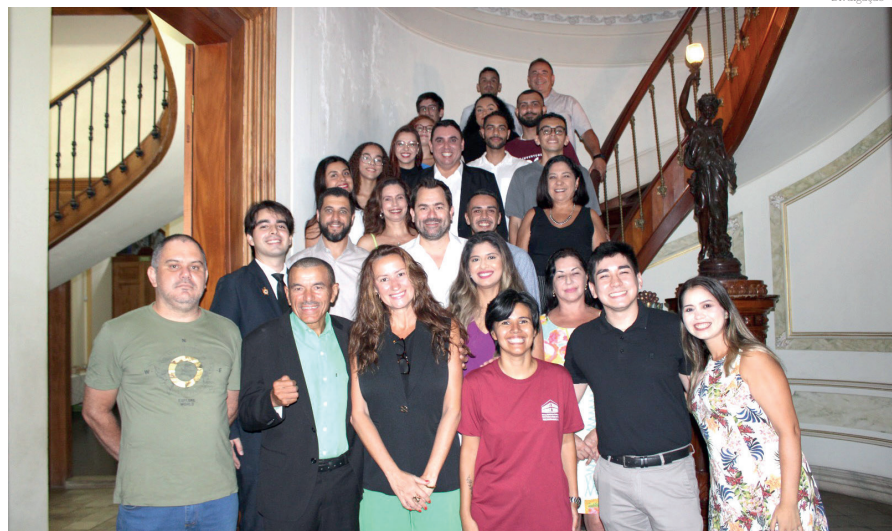
Os conselhos fortalecem a democracia e a participação social

Na última quinta-feira (23), a Prefeitura de Pindamonhangaba promoveu a cerimônia de posse do Conselho Municipal da Juventude (COMJUV). O evento foi realizado no Museu Histórico e Pedagógico Dom Pedro I e Dona Leopoldina e contou com a presença de diversas autoridades, representantes de conselhos municipais e membros da sociedade civil.