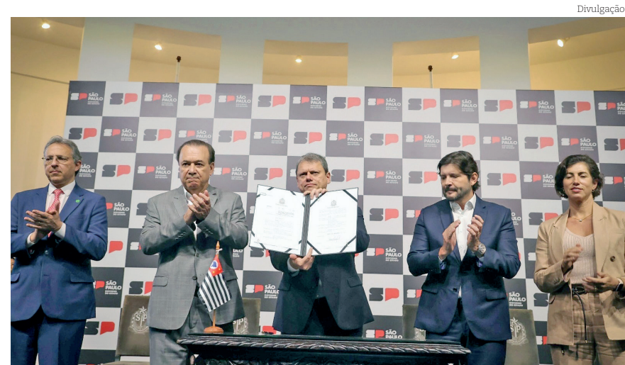
Encontro confirmou repasse de recursos para combate à dengue