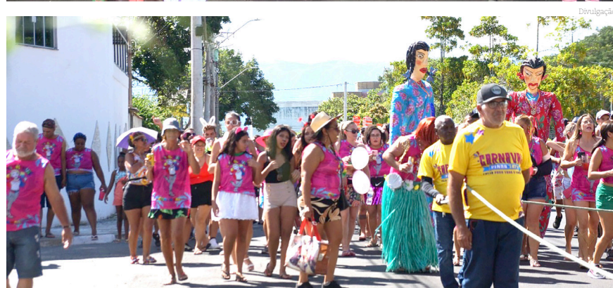
A Arena do Carnaval já se consolidou como o centro das festividades