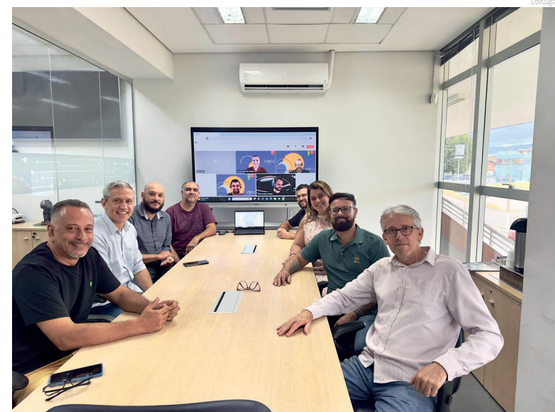
Equipe da Secretaria de Tecnologia

O impulsionamento inicial será por seis meses e será promovido em decorrência do Termo de Ajustamento de Conduta (TAC), realizado entre Prefeitura e Vero S.A, para sanar questões contratuais. Cada Startup terá a sua disposição infraestrutura disponibilizada pela Prefeitura, e consultores contratados pela empresa Vero S.A, da empresa Liga Ventures, especializada em startups, que tem o propósito de transformar empresas e pessoas através da inovação.