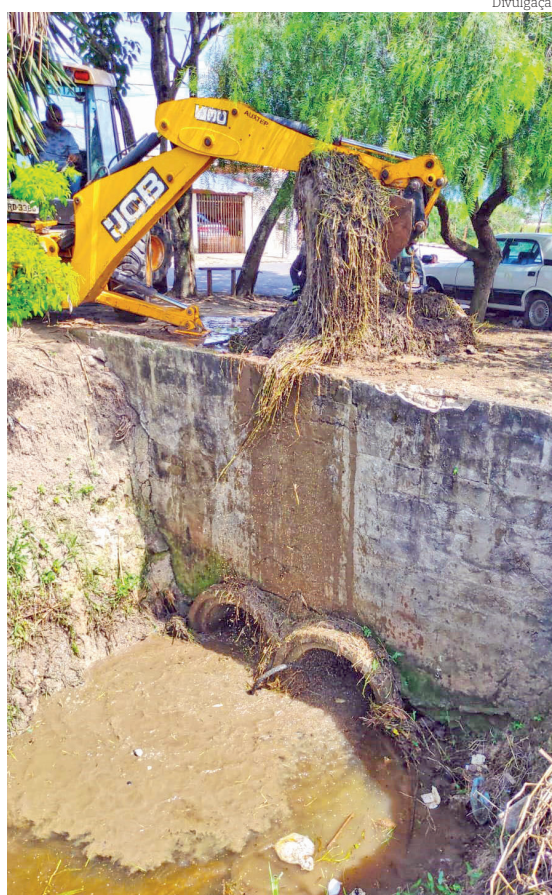
Limpeza no Vale das Acácias desobstruindo boca do córrego