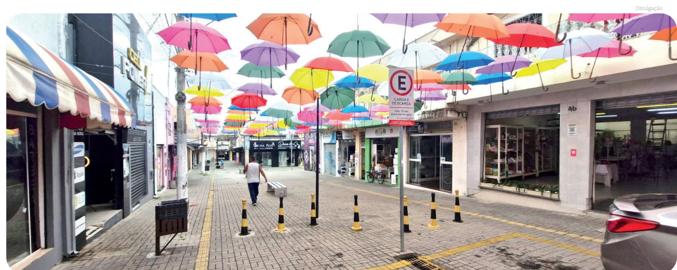
A iniciativa transformou o Centro Comercial 10 de Julho revitalizou o espaço

de vídeo que são integradas ao CSI – Centro de Segurança Integrada. Os serviços foram executados sem nenhum custo ao cofre público municipal. O valor total do investimento foi aproximadamente R$ 400 mil e foi realizado em parceria entre Prefeitura, Sabesp e a Empresa Ecolzyer (por meio de doação).