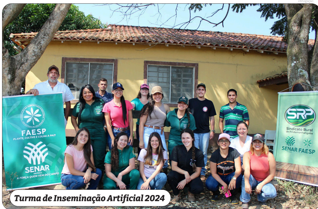
Turma de Inseminação Artificial 2024