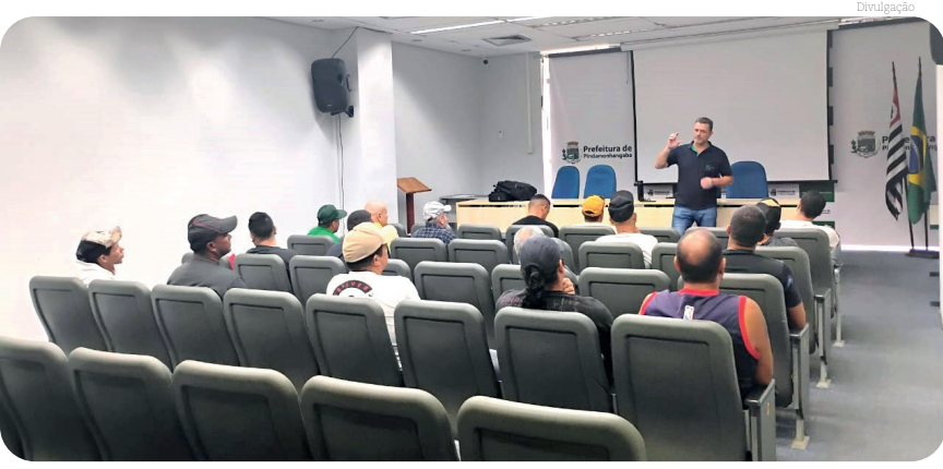
Pinda se destaca como uma das cidades que mais geram empregos na região

O Posto de Atendimento ao Trabalhador (PAT) de Pindamonhangaba viabilizou a contratação de mais 21 novos profissionais para uma terceirizada de uma grande indústria de transformação da cidade. Esses trabalhadores, definidos por meio de um processo seletivo realizado no final de 2024, estão agora em fase de treinamento para iniciarem suas atividades na empresa.