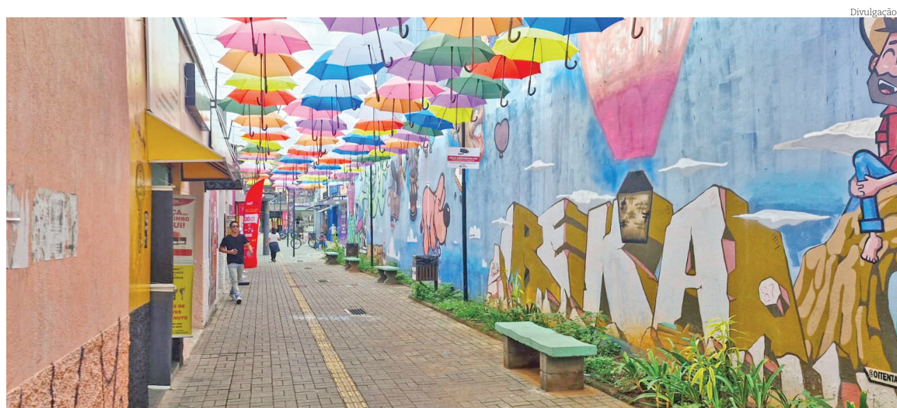
Iniciativa transformou o Centro Comercial em um verdadeiro espetáculo visual