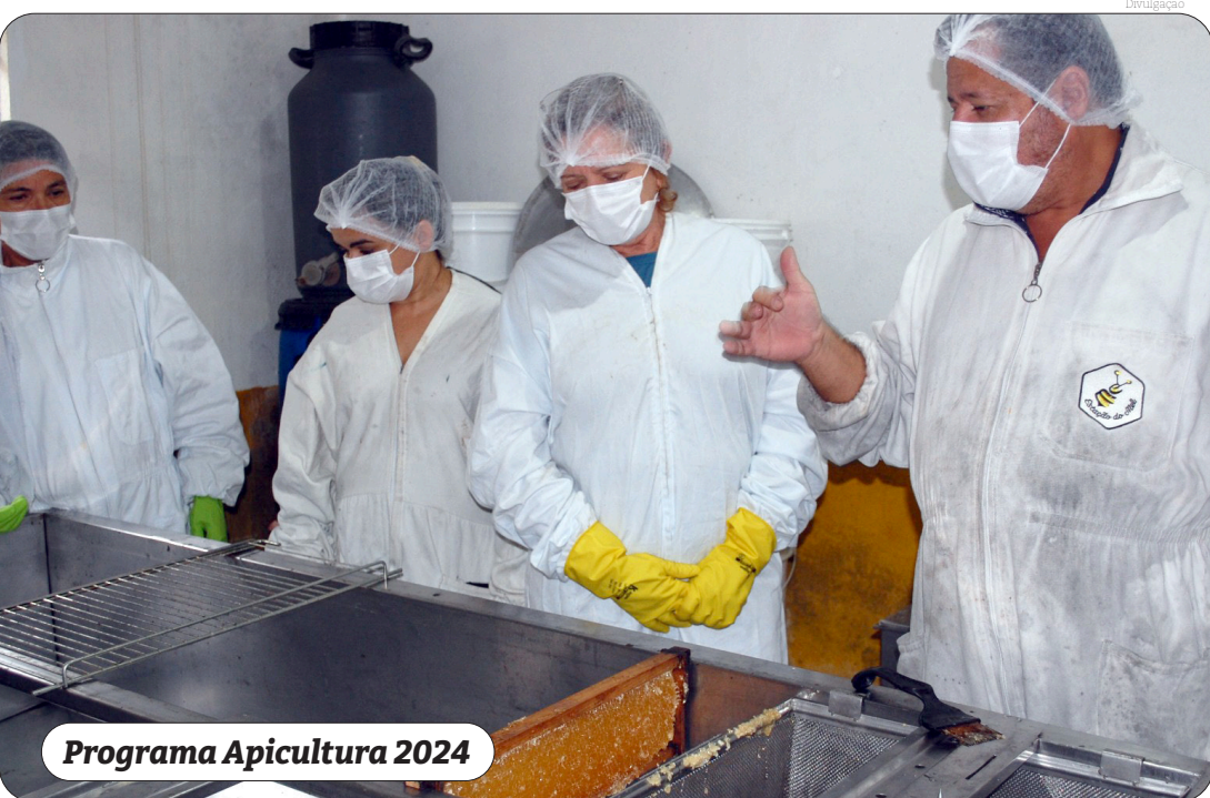
Programa Apicultura 2024