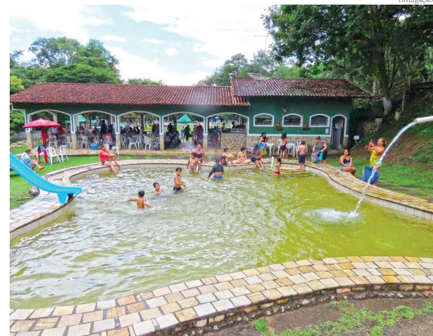
Projeto 'Férias Inclusivas' proporciona momentos de integração e lazer a criança portadoras de deficiência