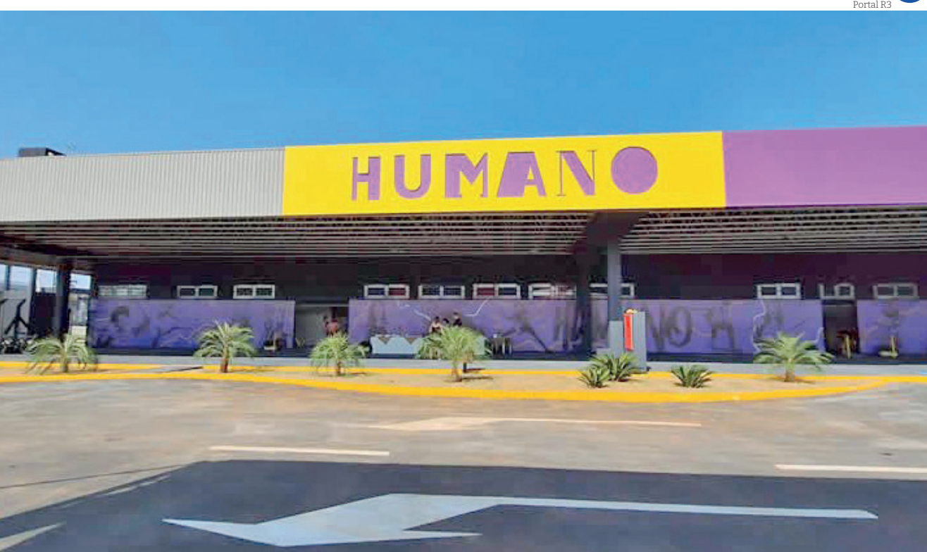
Curso promovido pela Prefeitura de Pindamonhangaba e o Senai acontece no Espaço Humano