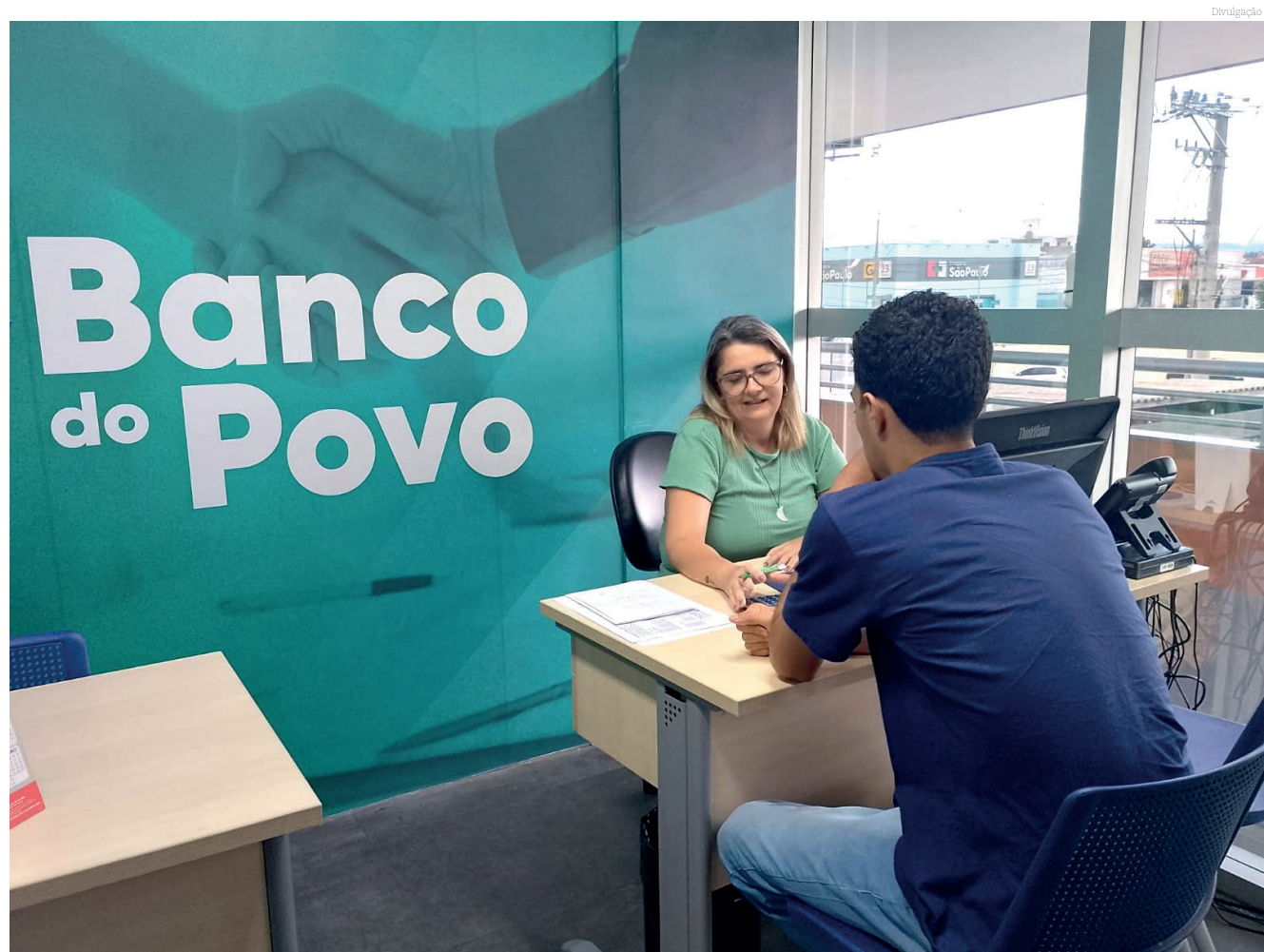
O crédito possibilita que os empreendedores tenham um fôlego para expandir suas atividades

Empreendedores interessados devem comparecer ao local com documentação pessoal e informações sobre o negócio para análise de crédito.