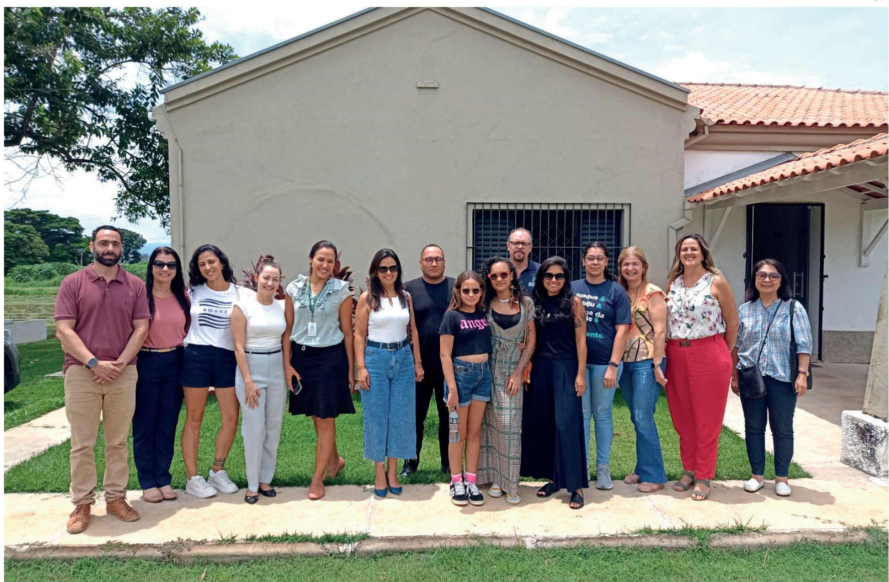
Reunião da comissão organizadora da Conferência, realizada nesta terça-feira, dia 7

cia Municipal de Meio Ambiente em Pindamonhangaba, com o tema ‘Emergência Climática’, é de extrema importância para o município, pois oferece uma oportunidade de reflexão sobre os desafios ambientais enfrentados localmente e global-