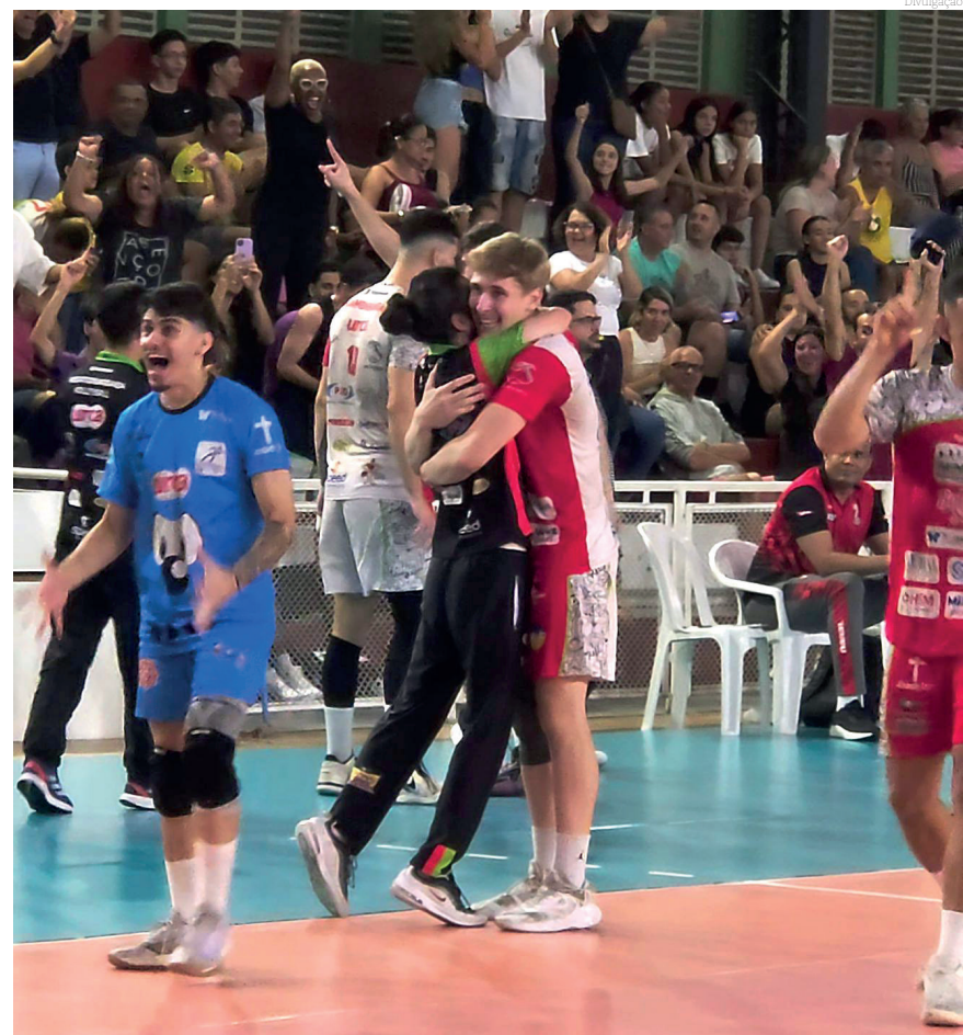
As comemorações também fizeram parte da noite vitoriosa

Na quarta parcial, o time da casa se recuperou, venceu e levou a decisão ao tie-break, fechando a partida com 15/13. Destaque para o poder de reação de todo o grupo, que não se abalou e soube ter paciência para conseguir dar o primeiro passo rumo ao título. Essa determinação e garra são esperados nesta terça-feira.