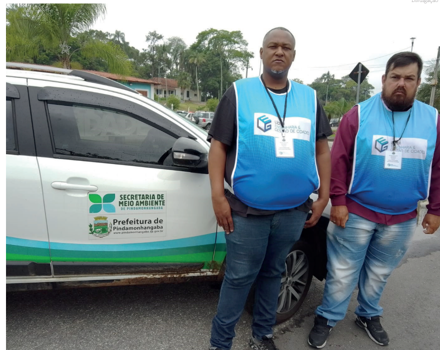
Os dados vão compor o diagnóstico e a elaboração do Plano Municipal de Saneamento Rural

Além de proporcionar um ganho ambiental à municipalidade, o Plano vai dispor de ferramentas para buscar investimentos junto à comunidade da zona rural, trazendo maior qualidade de vida e atendendo o marco do saneamento básico.