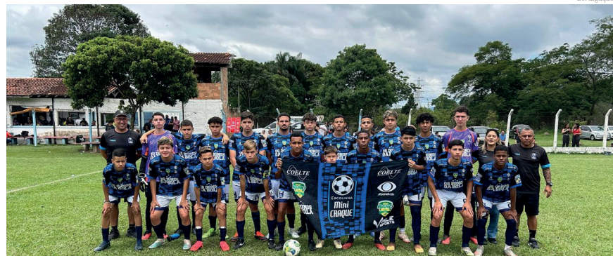
Minicraque Vice Campeã serie prata sub 15

Já no Sub 15, na final da série Ouro, o Fluminense Pinda realizou um belíssimo jogo contra o Arena Santa Inês, as duas equipes vieram com a proposta de atacas e buscar o gol, muito equilíbrio nas duas defesas, muito bem colocadas. No fim empatou em 0x0 no tempo normal, na disputa de pênaltis o Santa levou a melhor por 5x4. Na final da série Prata, outro time de Pinda na final, Mi-