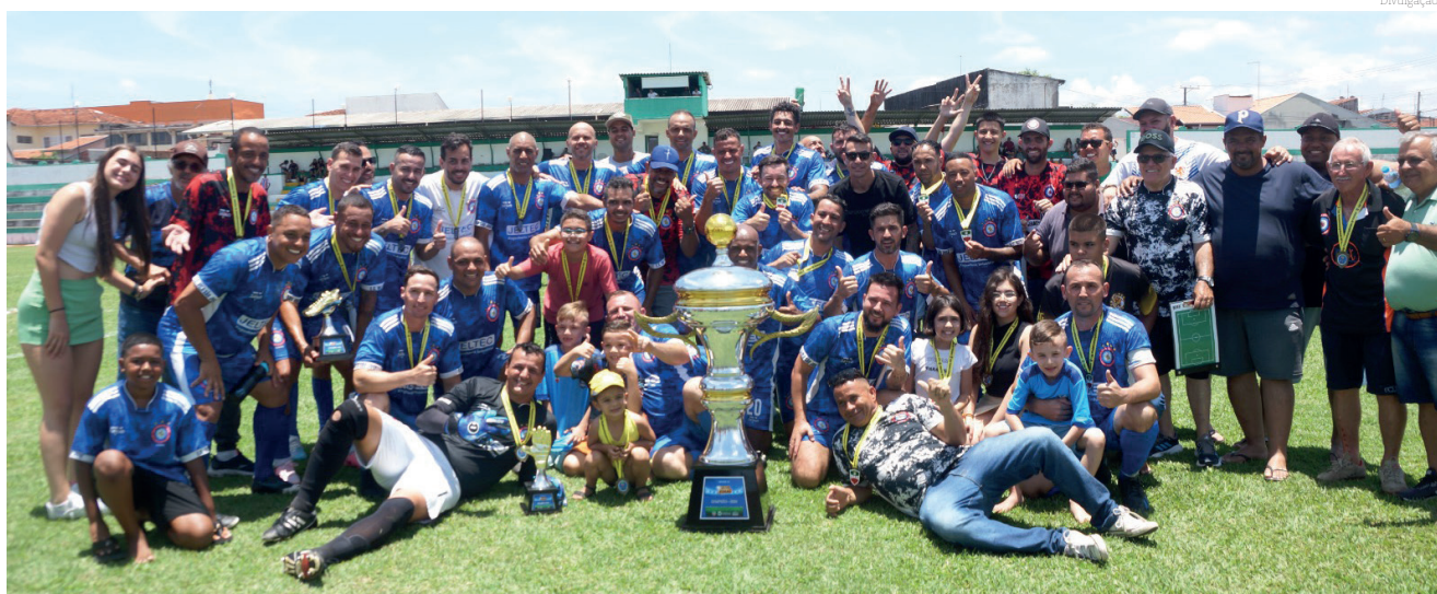
Equipe Vila São José conquistou o campeonato e comemorou