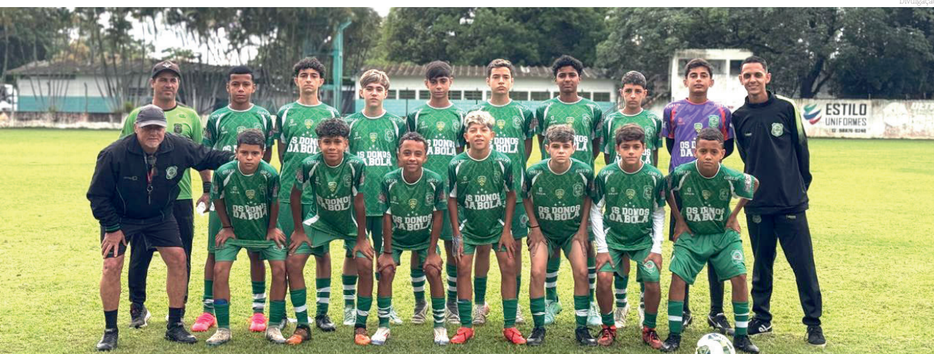
Time da Ferroviária Campeã Sub 13 Serie prata Taça Ban

Minicraque e Fluminense ficam com o vice no Sub 15