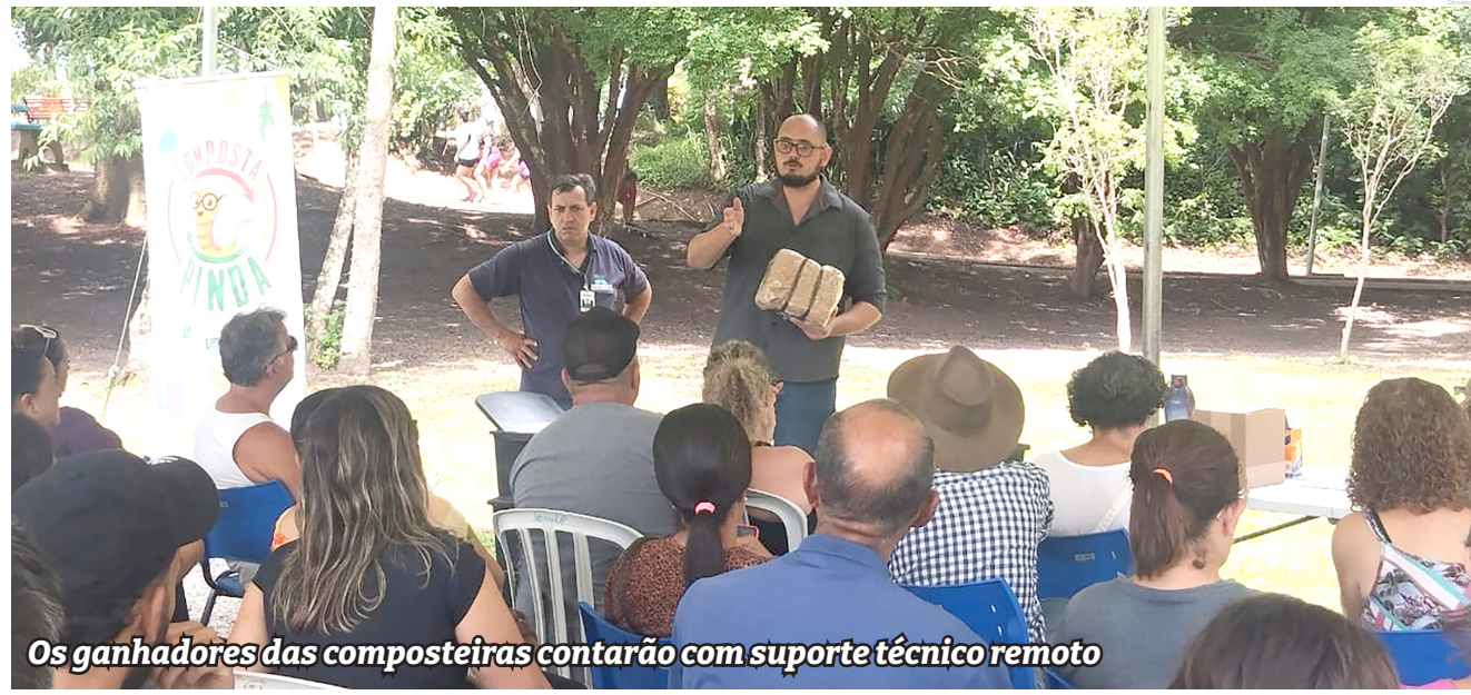
Os ganhadores das composteiras contarão com suporte técnico remoto

Em seguida, foi realizada a entrega das composteiras e dos kits de compostagem aos 50 contemplados pelo Programa, que serão responsáveis pelo correto uso e zelo com as composteiras em suas residências