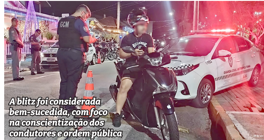
A blitz foi considerada bem-sucedida, com foco na conscientização dos condutores e ordem pública