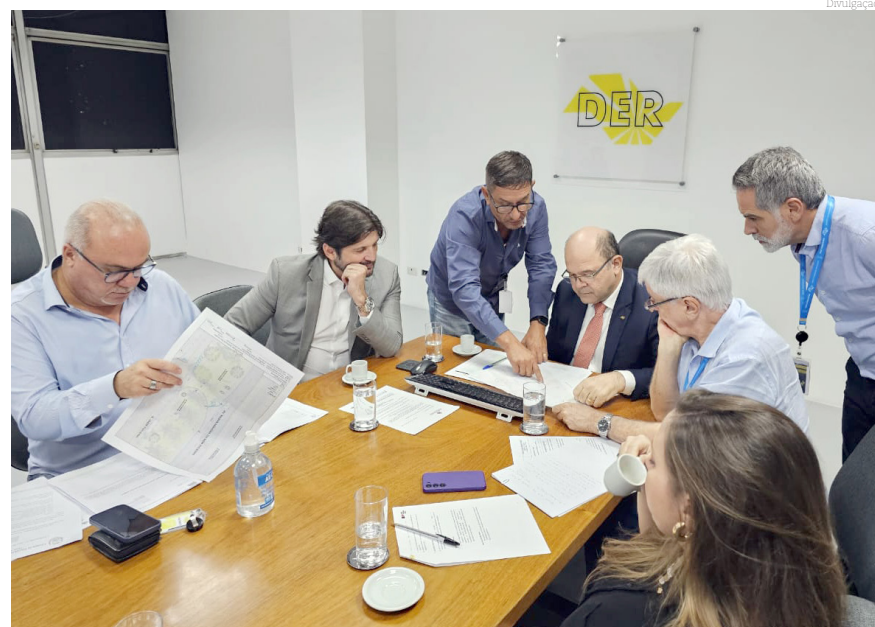
Foram discutidas ações para aprimorar a mobilidade na cidade

“Essas medidas são essenciais para garantir mais segurança, mobilidade e qualidade de vida para nossa população. Seguimos firmes no compromisso de fazer Pindamonhangaba crescer e vamos buscar através dessa importante parceria com o DER o caminho para grandes projetos”,