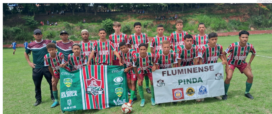
Fluminense Vice Campeã serie Ouro sub 15

nicraque e Lorena/FADENP fizeram uma brilhante partida estudada e com muita marcação, no final do tempo normal um empate em 1x1, na disputa por pênaltis 4x2 para Lorena.