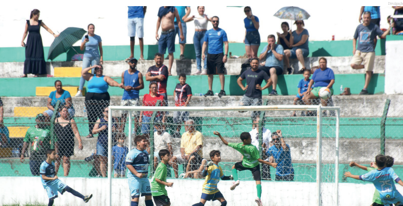
A torcida participou das partidas