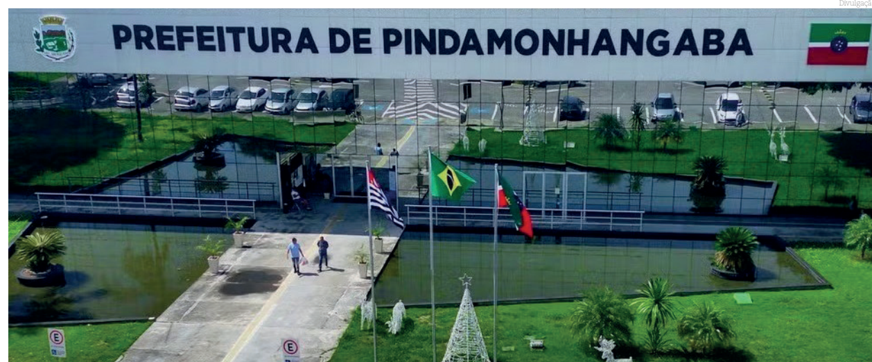
A isenção de juros e multas podem ser solicitadas até o dia 20 de dezembro

Para requerer o benefício, o contribuinte deverá estar com