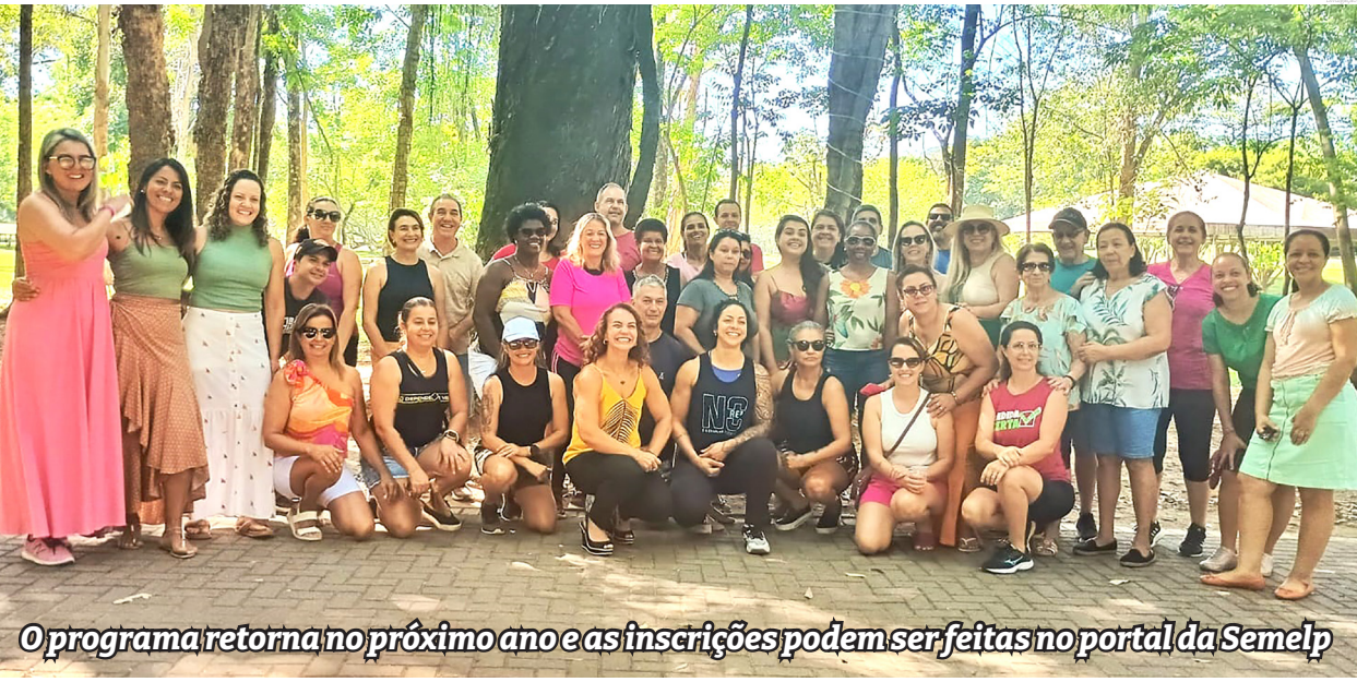
O programa retorna no próximo ano e as inscrições podem ser feitas no portal da Semelp