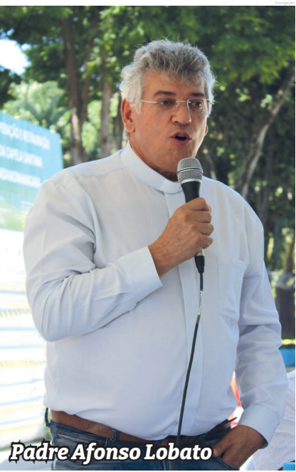
Padre Afonso Lobato