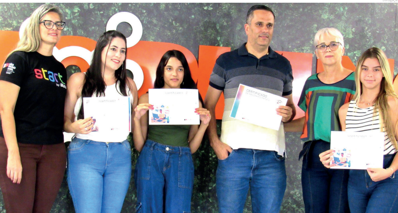
O evento destacou o talento e o empenho dos envolvidos em aulas de Tecnologia e Inovação