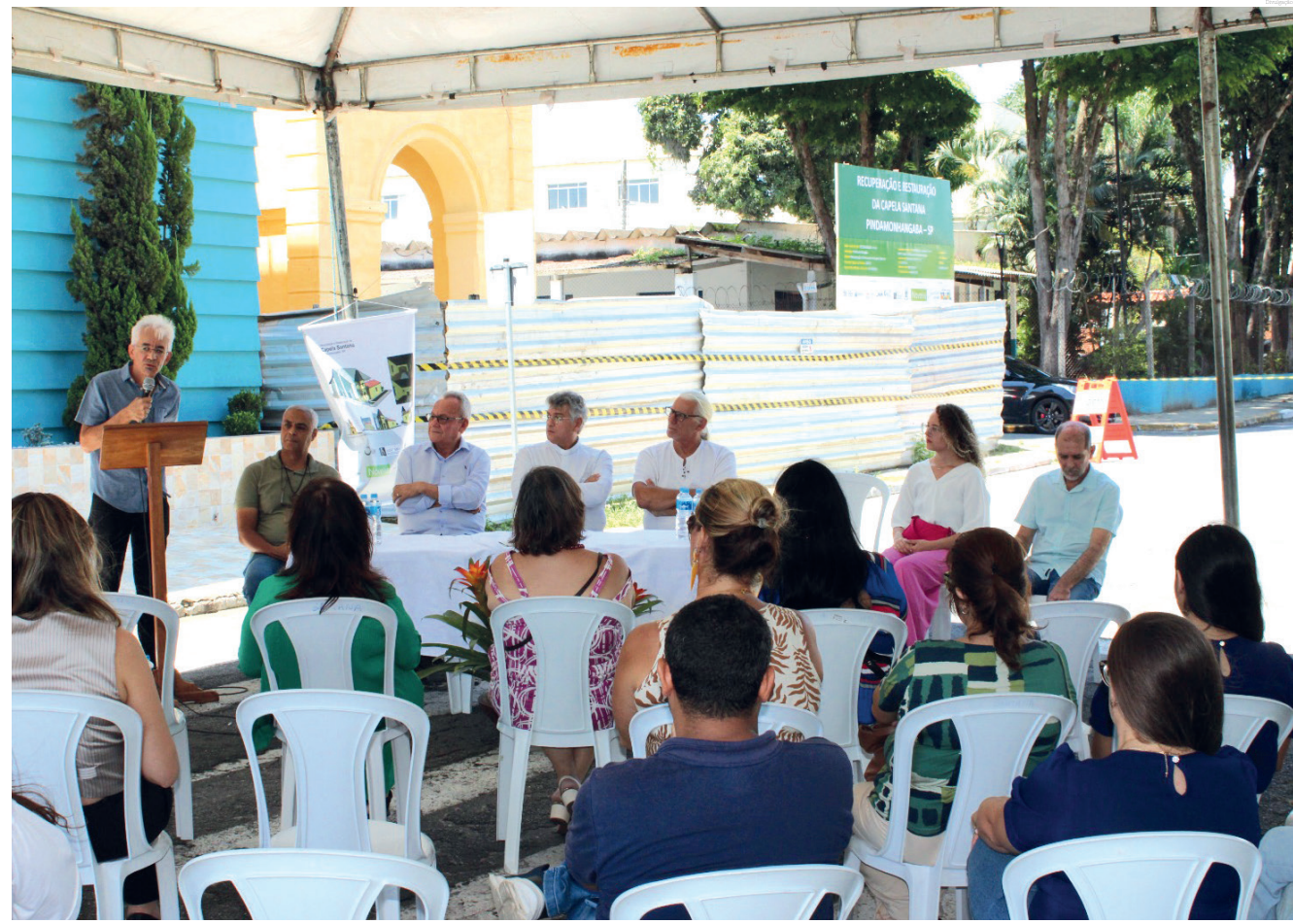
O restauro é um marco resgatando um importante patrimônio cultural, religioso e histórico de Pindamonhangaba

Novelis, a primeira etapa de reconstrução e restauro começa com obra serviços estruturais, principalmente para proteger as paredes laterais, que são de taipal, e a torre da capela. Ela disse que os serviços já começam nesta semana, e incluem ainda a cobertura completa da igreja.