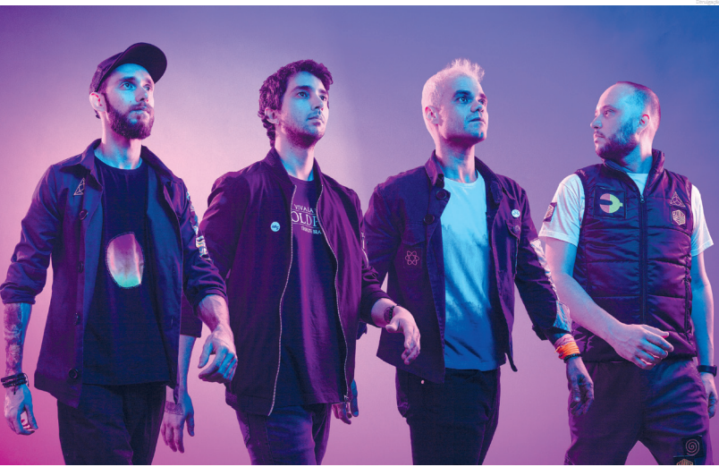
O evento é gratuito e 300 pulseiras de led serão disponibilizadas ao público