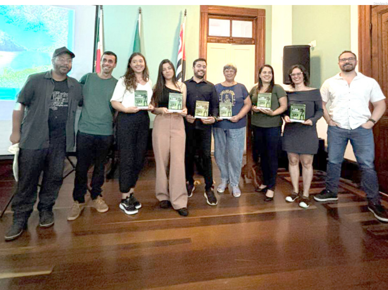
Todas as fotografias vencedoras foram expostas no Palacete e estarão em uma exposição itinerante

Na quinta-feira (05), foi realizada a cerimônia de premiação do I Concurso de Fotografia Ambiental de Pindamonhangaba, no Palacete 10 de Julho. A iniciativa do concurso foi da Secretaria de Meio Ambiente em parceria com a Secretaria de Cultura e Turismo e o Departamento de Comunicação da Prefeitura.