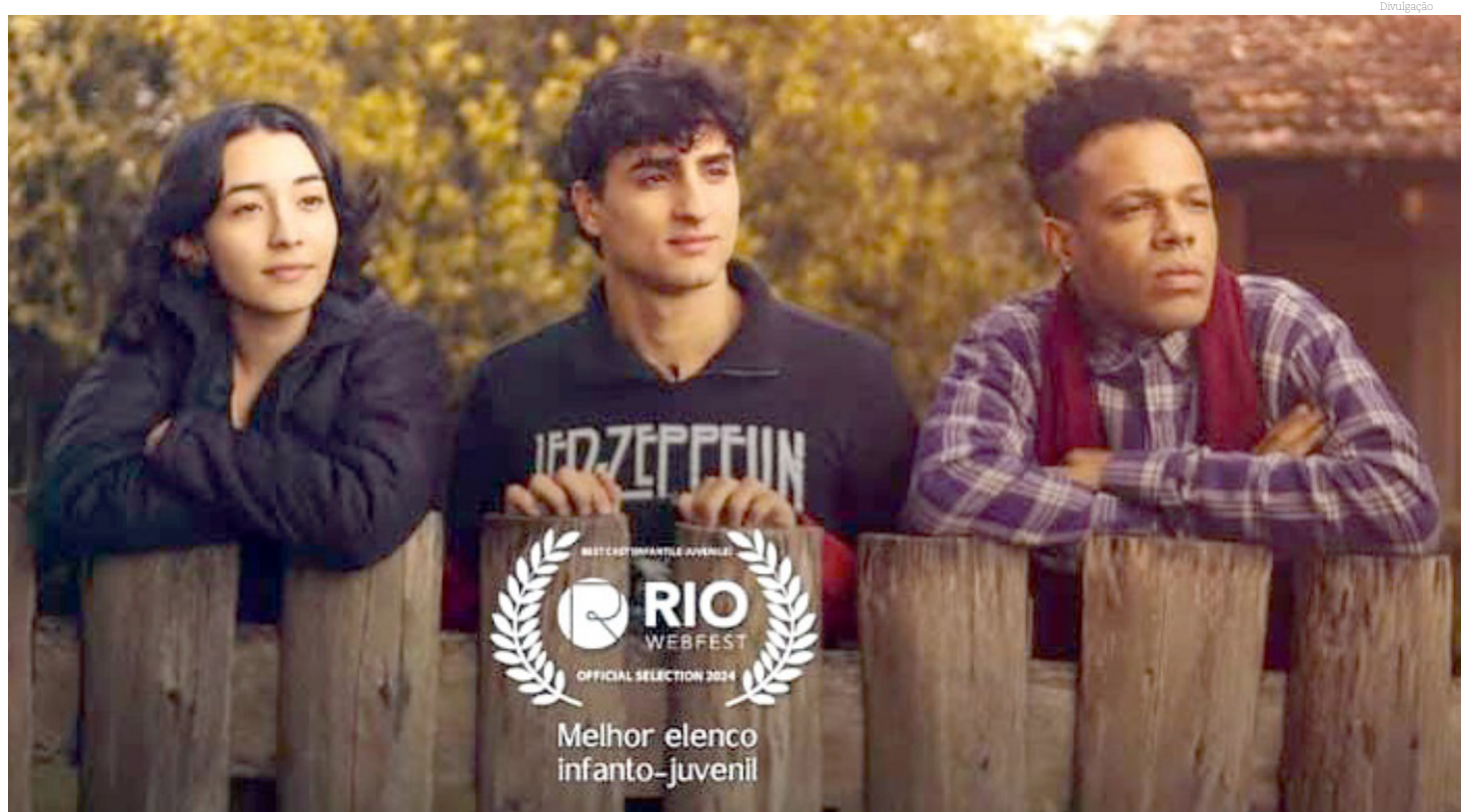
As conquistas simbolizam que o curta-metragem é um projeto profissional, sólido e emocionante

O curta ainda não está disponível para o público assistir porque deve percorrer intervalo de dois anos do festival. No entanto, a produção está finalizando contrato com a TV Aparecida e, partir de janeiro de 2025, ele será exibido na grade da emissora.