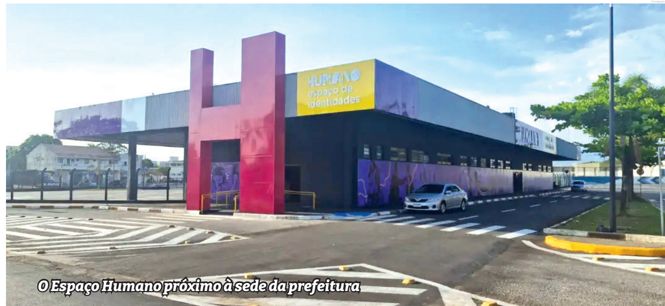
O Espaço Humano próximo à sede da prefeitura

experiência rica e acolhedora. O evento é gratuito e aberto a todos, reunindo diferentes expressões culturais em um ambiente festivo e familiar.