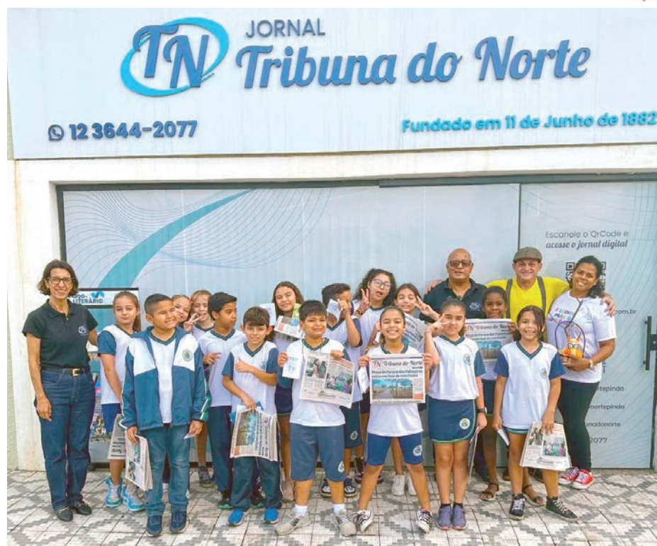
Alunos da Escola Municipal Padre Zezinho em frente à sede da 'Tribuna'