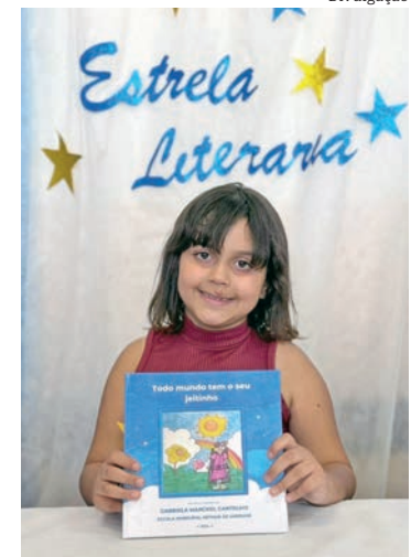
Aluna da 'Arthur de Andrade'