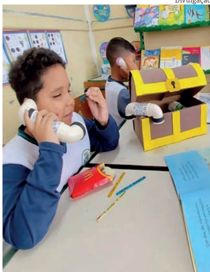
Estudantes da 'Joaquim Pereira'

Você sabe identificar as emoções do seu pet? PÁGINA 2