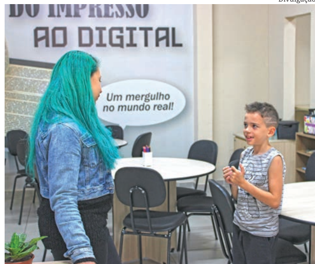
As oficinas incentivam a criatividade dos alunos