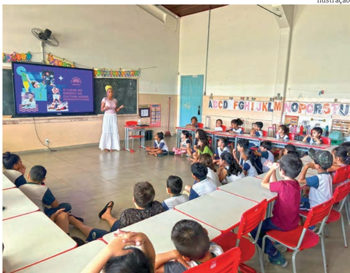
Estudantes assistiram palestra sobre João do Pulo