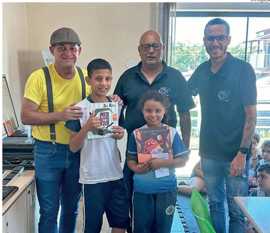
Estudantes conheceram a sede do jornal Tribuna do Norte e receberam livros