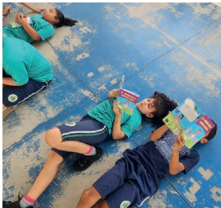
Alunos com exemplares do livro