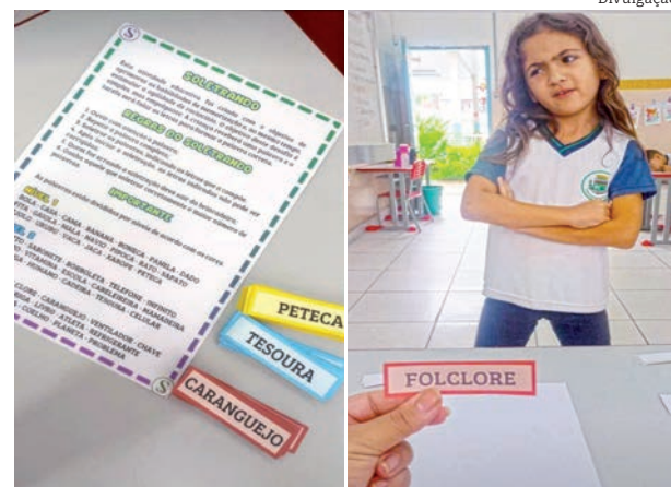
Atividade estimula ampliação do vocabulário

Essa proposta didática alia aprendizado e diversão, reforçando o papel do brincar como uma ferramenta essencial na alfabetização.