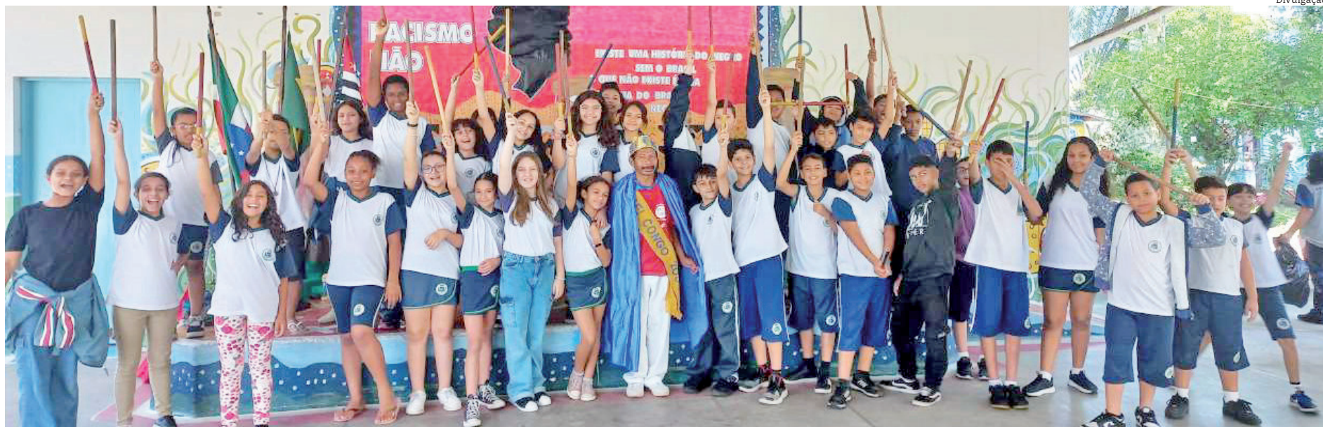
Estudantes da "Dr. André Franco Montoro" participaram de evento que celebrou a cultura afro e os 22 anos do projeto cultural 'Mestre Paizinho'