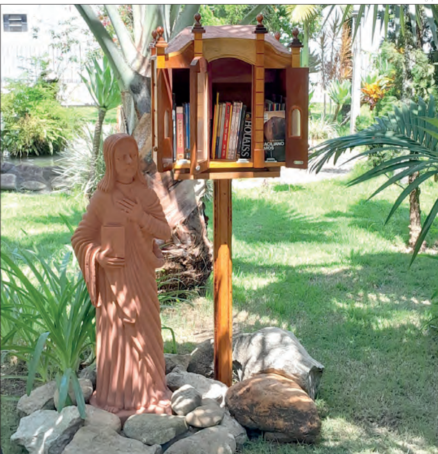
A biblioteca vai enriquecer e transformar o cotidiano das pessoas

A Biblioteca Solidária é um exemplo de como parcerias entre instituições podem transformar e enriquecer o cotidiano das pessoas, promovendo a cultura e o conhecimento de forma acessível e colaborativa.