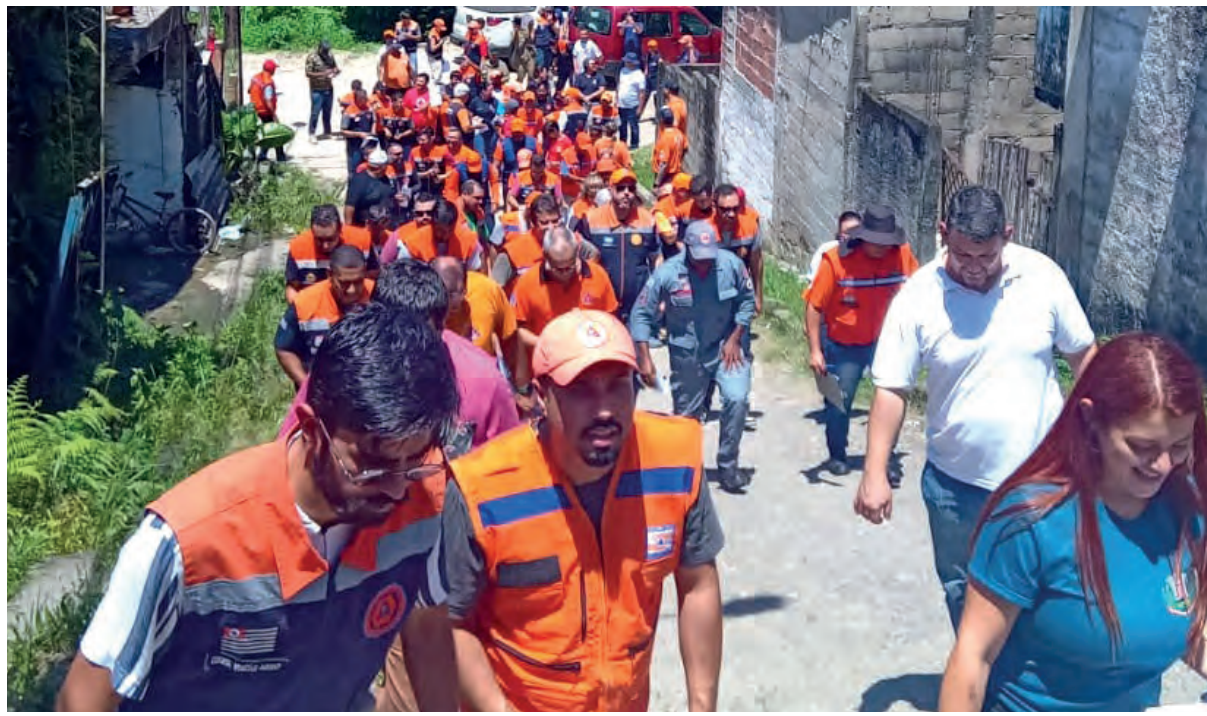
Curso reuniu profissionais de várias cidades