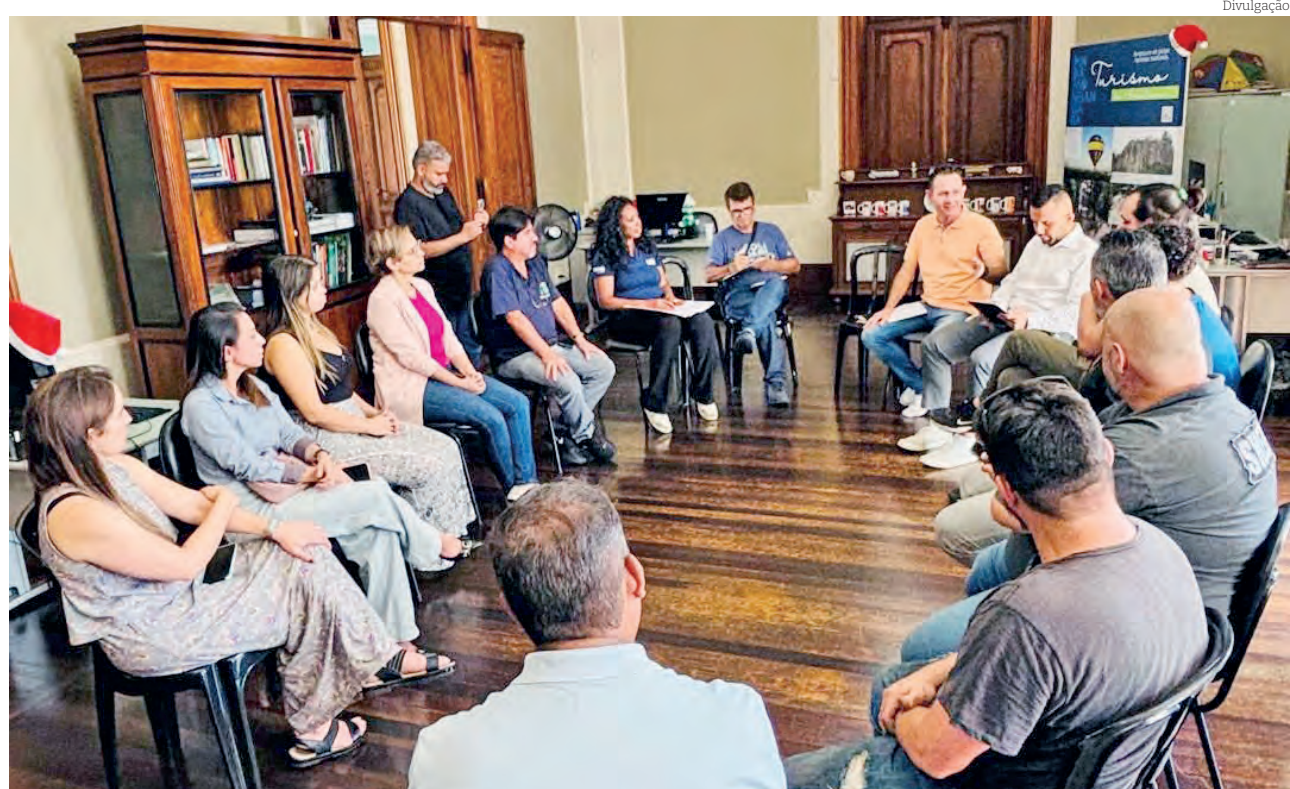
Reunião acertou os últimos detalhes para a chegada do Papai Noel em Pindamonhangaba