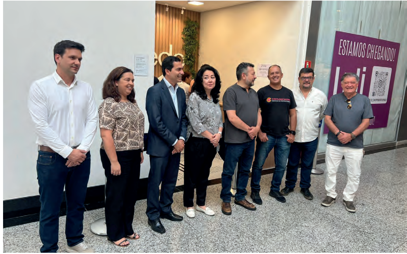
A nova agência vai oferecer a melhor experiência aos clientes