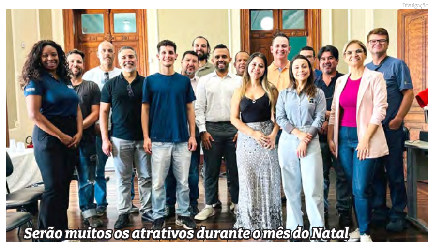
Serão muitos os atrativos durante o mês do Natal