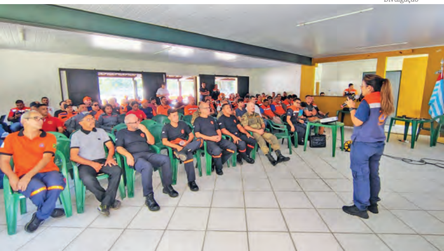
Curso faz parte da preparação para o período chuvoso