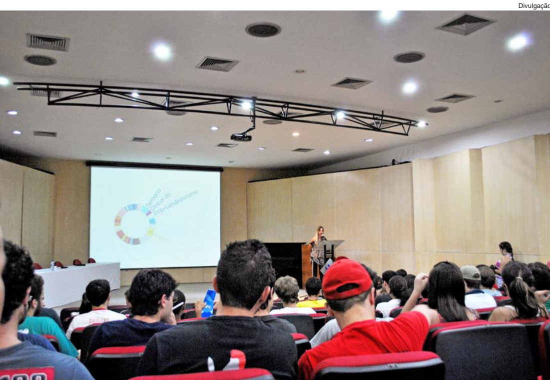
Encontro terá apresentação de "cases" de empreendedores de sucesso na cidade

A Anhanguera de Pindamonhangaba participa da Semana Global do Empreendedorismo, realizada em todo o país, com atividades na sua unidade local.