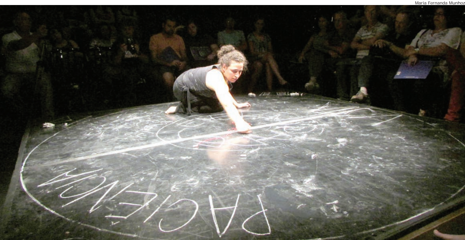
Cena do monólogo “O Halo”, melhor espetáculo adulto do Feste, segundo o público

O novo centro comunitário fica na rua José Lino de Macedo, 110.