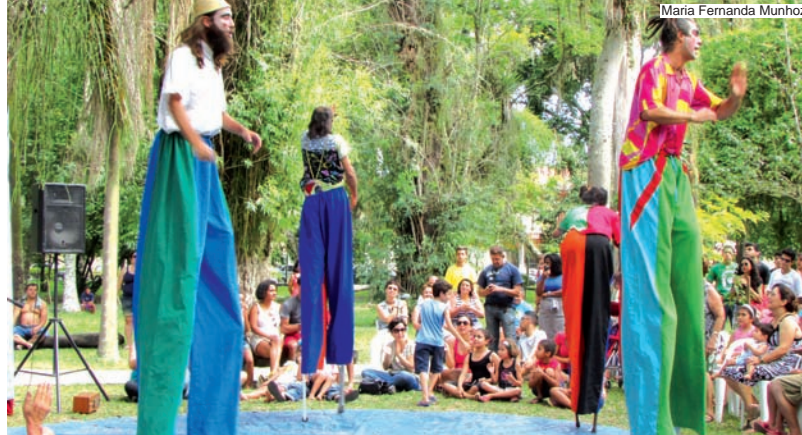
Peça preferida de rua foi "Saltimbembes Mambembancos"

Campanha de Saúde do Homem termina sábado