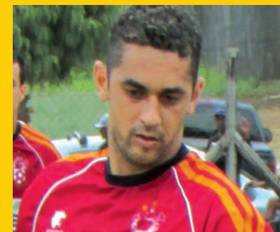
Fernando Chupacabra ESPORTES 10