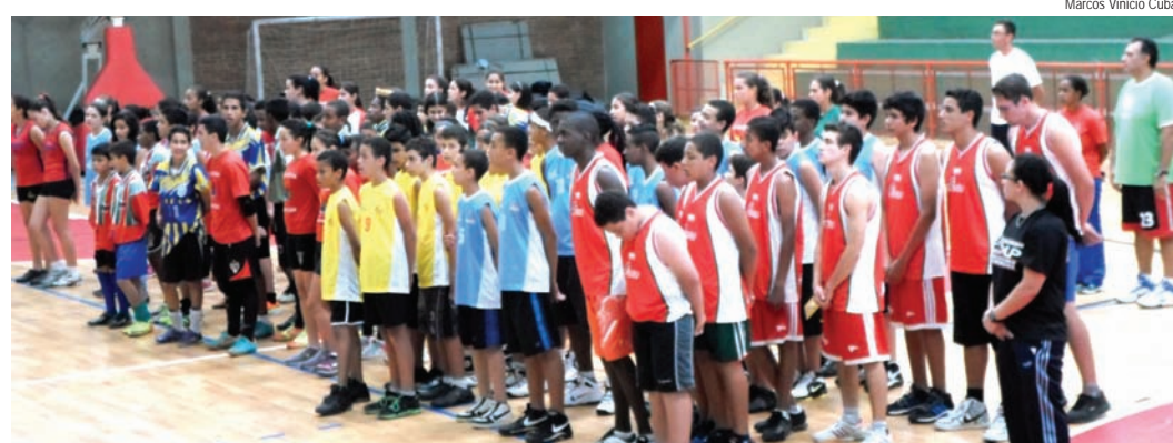
Alunos durante abertura do evento, no CE João Carlos de Oliveira

De acordo com a Secretaria, o festival tem a missão de contribuir com a formação humanística das crianças e adolescentes por meio do esporte, evitando as mazelas sociais, prevenindo doenças e promovendo a saúde. Os pais de alunos também estão convidados a comparecer nos locais para conferir o desempenho dos atletas da cidade.