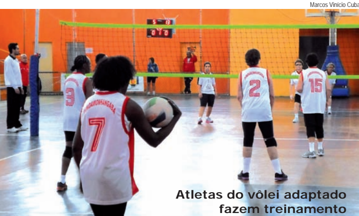
Atletas do vôlei adaptado fazem treinamento

Pindamonhangaba terá o 1º Festival da Melhor Idade e as atividades terão início nesta sexta-feira (22). O evento é organizado pela Secretaria de Esportes e Lazer da Prefeitura e podem participar todos que têm 50 anos ou mais. Os interessados podem se inscrever nas secretarias dos centros esportivos João Carlos de Oliveira, "João do Pulo", José Ely Miranda, "Zito", e no Rita Eni Cândido, "Ritoca", no Araretama.