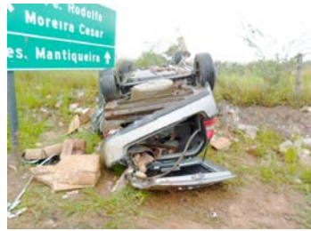
CAPOTAMENTO DE VEÍCULO, APÓS COLISÃO NA RODOVIA ENG. LUÍS DUMONT VILLARES