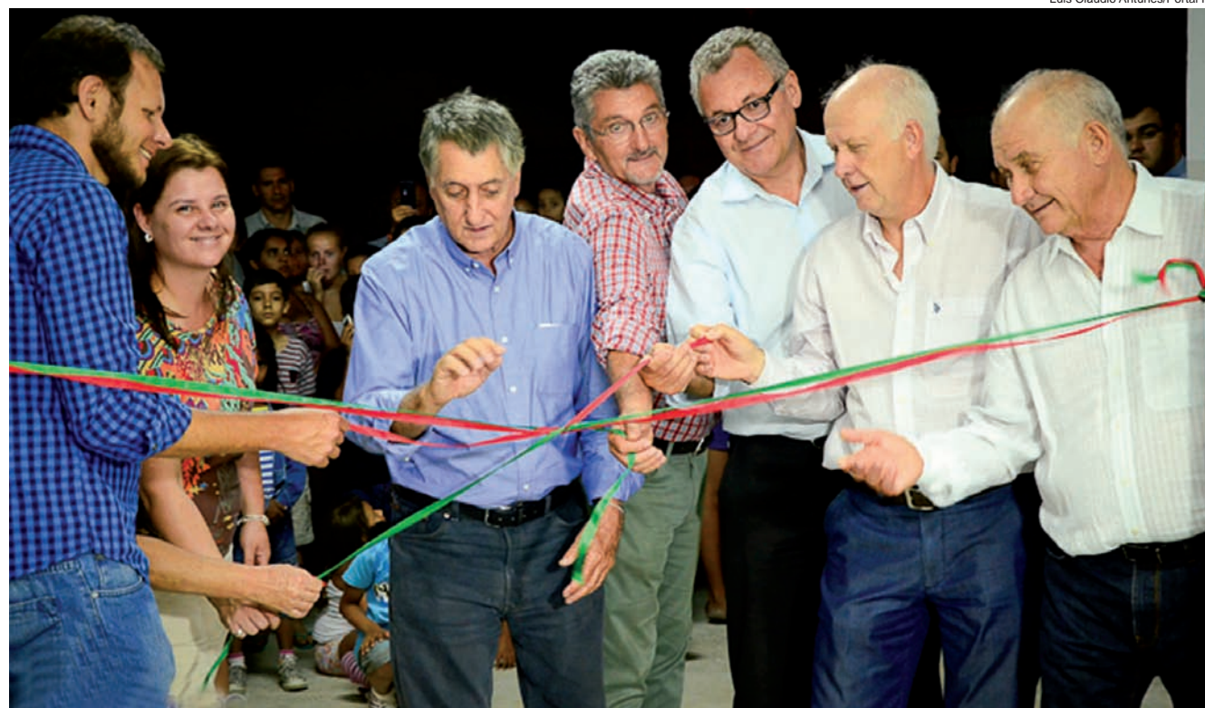
Autoridades descerraram a fita do prédio, que fica na rua José Lino de Macedo, 110, Vila São Paulo