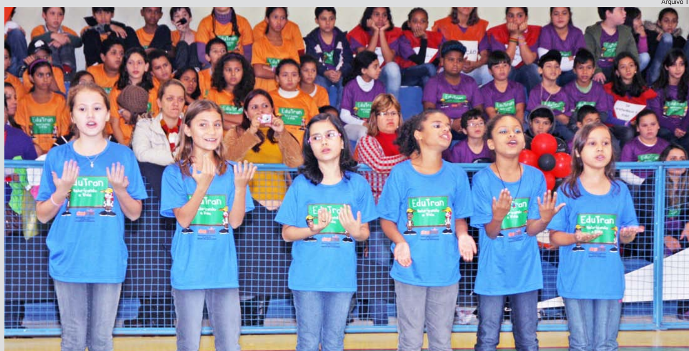
Todos os anos, o Projeto Edutran forma centenas de alunos da Rede Municipal de Ensino de Pinda

dos alunos da rede municipal e autoridades. O Edutran tem como objetivo formar cidadãos conscientes no trânsito, por meio de ações educativas e de lazer.