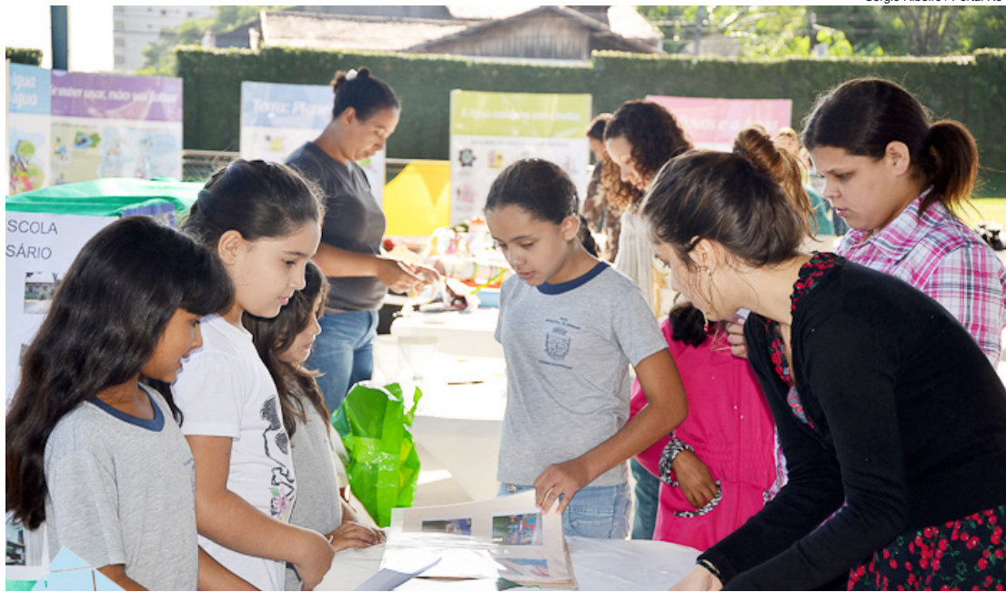
Sérgio Ribeiro / Portal R3

Agora, com o encerramento do ano, as unidades participantes receberam certificação e começam a integrar a Rede Escolas Sustentáveis, que reúne conteúdo teórico e prático. A intenção