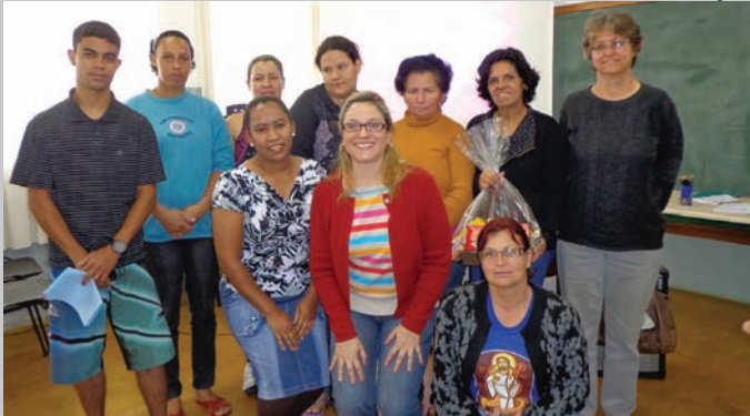
Participantes da palestra desenvolvida no NAP