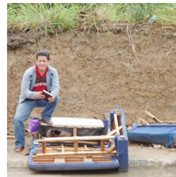
RETIRADA DE ENTULHO DA RUA CASTRO ALVES (AO LADO DO RIBEIRÃO)