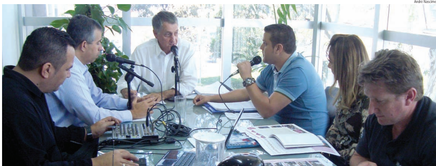
Parceria com empresa da cidade foi destacada para o desenvolvimento dos projetos