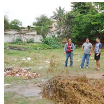
LIMPEZA DA ÁREA PRÓXIMA AO PESQUEIRO, NO FINAL DA RUA CASTRO ALVES