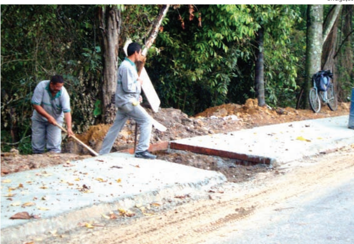
Calçada está sendo construída para proteger a APP