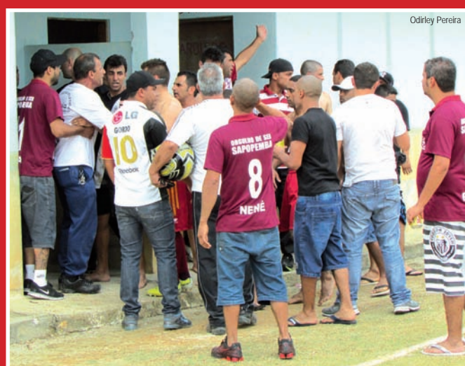
Torcedores em frente aos vestiários no Azeredo

Pelo Sapopemba, Vicente lamentou o resultado. "Faltou um pouco de atenção, de colocar a bola no chão. Acho que fomos prejudicados, mas futebol é isso. A maior falha foi nossa".