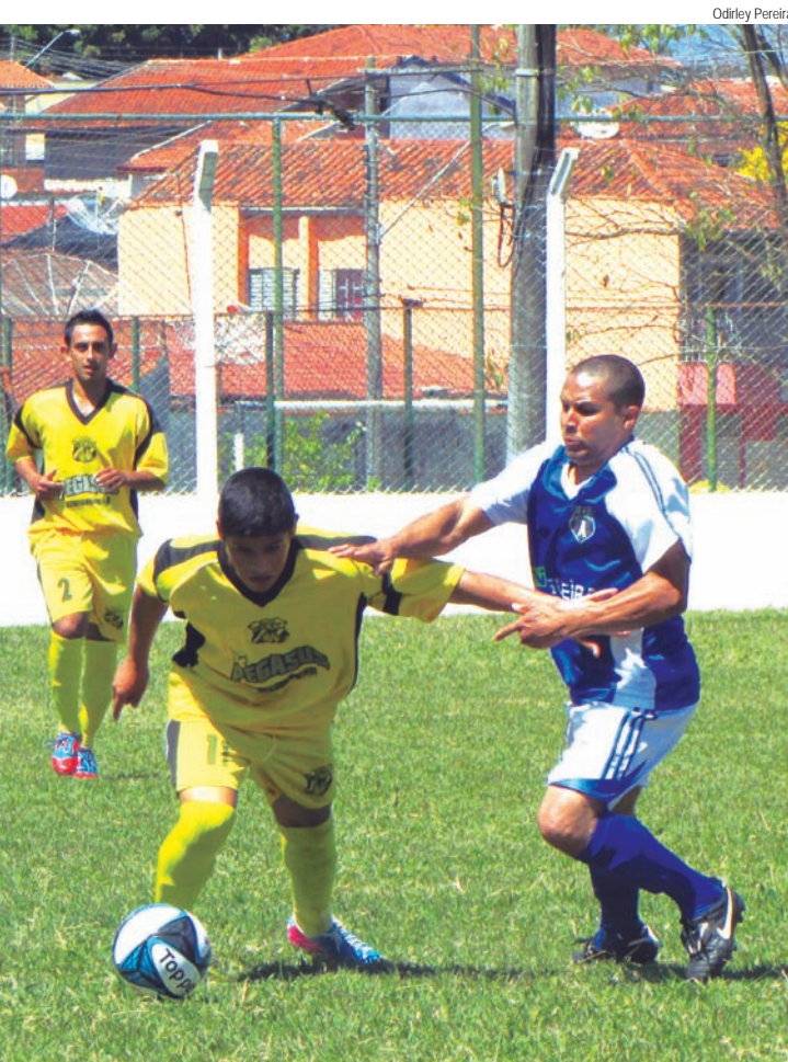
Marcação cerrada foi a tônica da partida

O Araretama reverteu a vantagem que era do 100 Nome e agora vai jogar por um empate na próxima semana para buscar a vaga nas semifinais da Primeira Divisão. Em partida disputada no Jardim Resende no domingo (8), o time da região Oeste bateu o 100 Nome por 2 a 1.