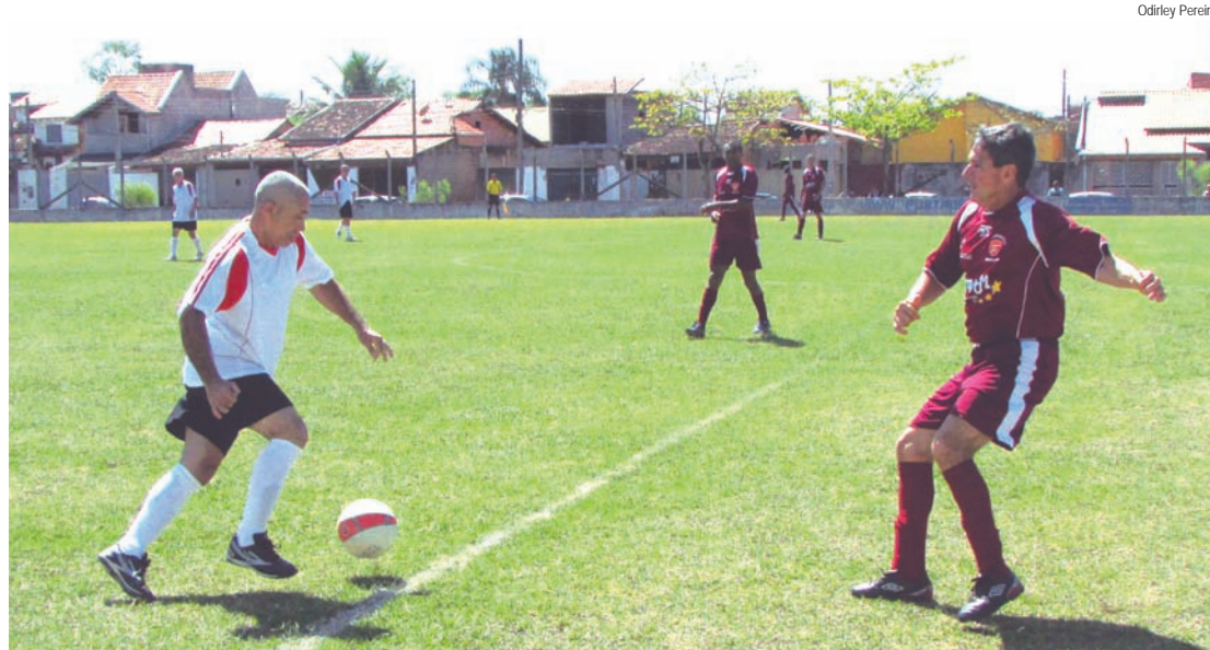
Lateral Carioca (Imperial) avança para cima dos adversários pela esquerda

No segundo tempo, o Independente foi para cima e abriu espaço para o contra-ataque. Djavan e Tiganá tiveram várias chances, mas