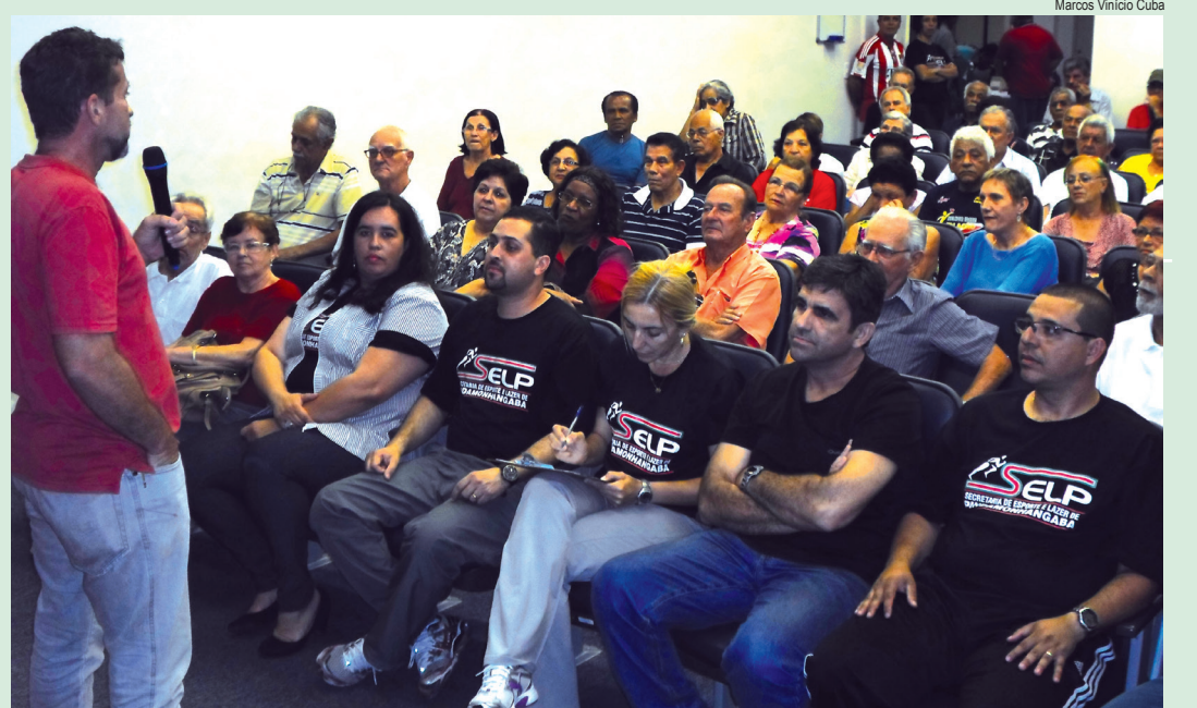
A delegação participará de uma nova reunião para receber os kits e orientações