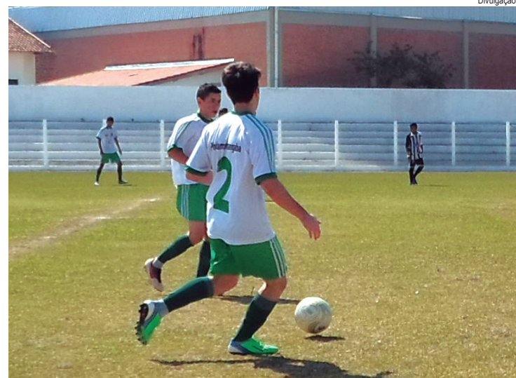
A equipe pindense não deu chances para o Atlético, de São José dos Campos, e é a líder no grupo C

Placar final 4 x 1, o quarto gol veio numa cobrança de falta, após uma forte entrada do josenense. A equipe de Pindamonhangaba é líder no grupo C da Copa.