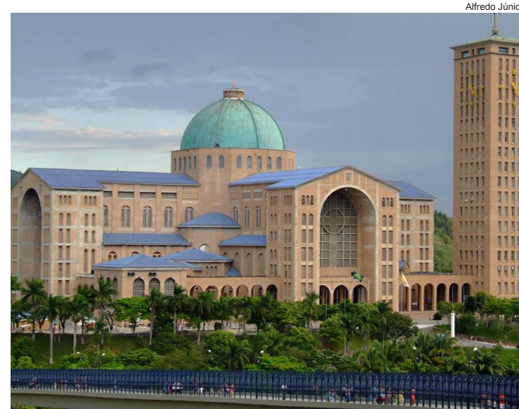
Grupo caminhou até o Santuário Nacional em Aparecida

Por causa deste fato, ele passou a ser venerado e invocado como o protetor contra o câncer. Muitas pessoas têm alcançado graças e milagres de cura dessa doença ainda hoje pedindo a intercessão de São Peregrino.