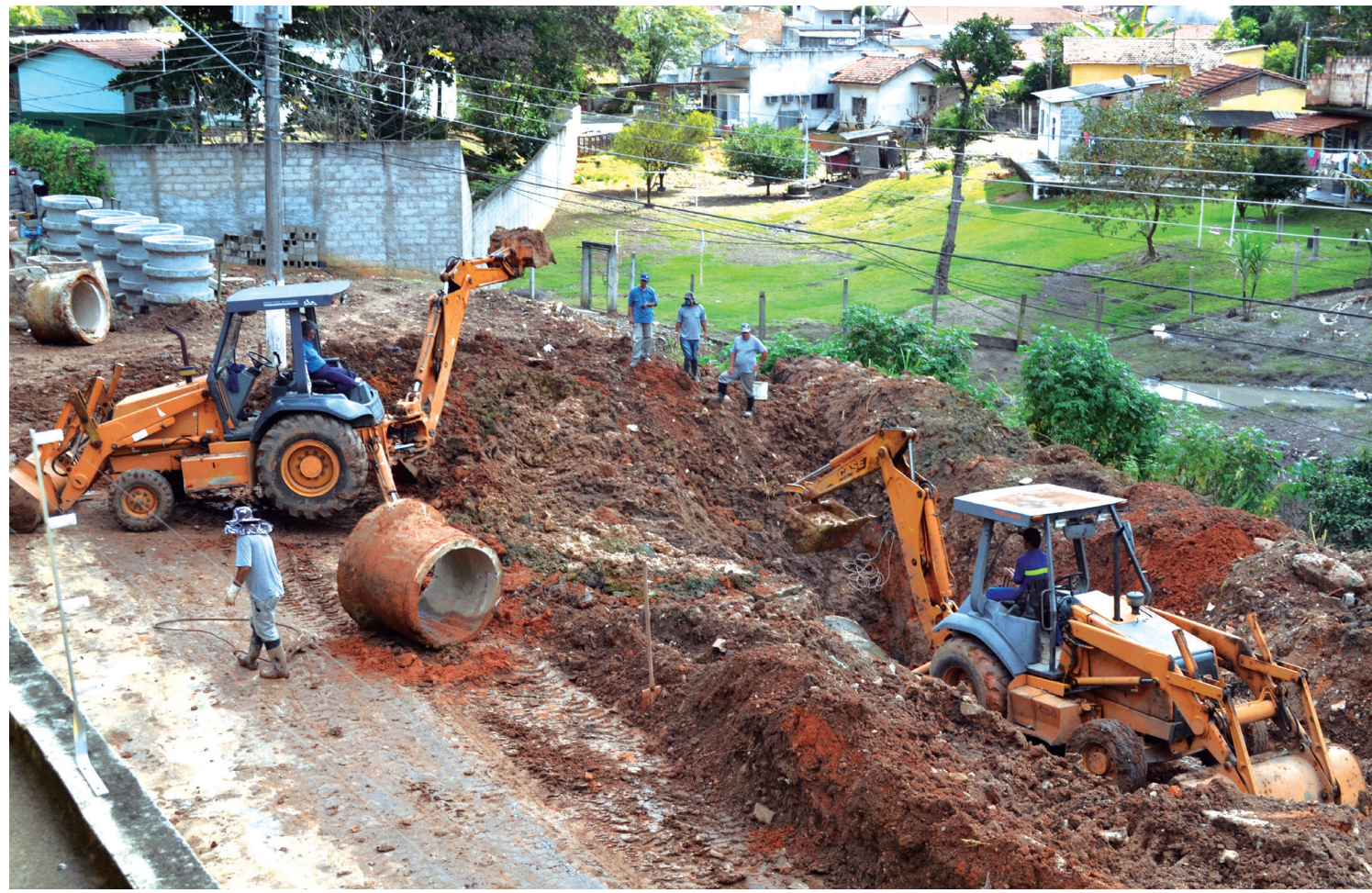
Rede coletora tem eixo principal na rua Simão Dênis. Foto foi registrada em julho durante abertura de canaleta

novo coletor de captação no seu eixo principal ligando as redes das ruas Simão Dênis e Caraguatubá. O serviço também contribui com o meio ambiente, pois evita que as residências lancem esgoto no córrego. PÁGINA 5