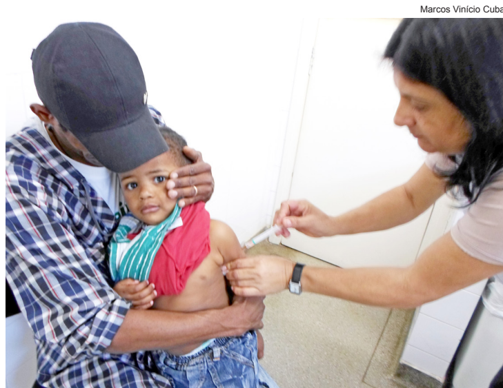
Vacinas estão disponíveis em todas as unidades de Saúde

Vacinas contra sarampo, caxumba e rubéola são algumas das que estão sendo fornecidas durante a campanha de atualização, que segue até sexta-feira (30), conforme prevê o Ministério da Saúde. O atendimento nos postos e unidades é de segunda a sexta-feira.