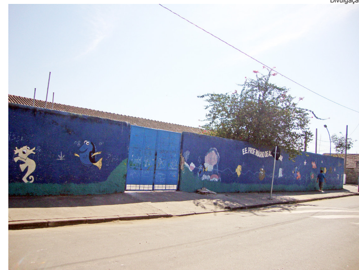
Os serviços de melhoria iniciaram no começo do mês

No último final de semana, uma equipe da Subprefeitura esteve novamente na unidade escolar para finalizar os reparos necessários, sem atrapalhar o andamento normal das aulas.