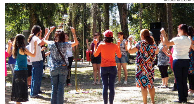
Marcos Ivan/Canal 39

mo domingo do mês. Cada vez mais pessoas têm participado do evento, que é indicado para pessoas de todas as idades e proporciona benefícios como melhora da autoestima, da coordenação motora, da sociabilização, além de todas as melhorias na qualidade de vida que a prática esportiva proporciona.