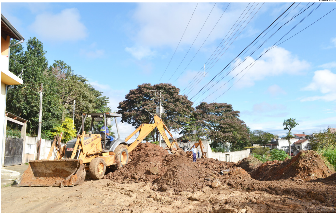
O eixo principal do novo coletor está localizado na rua Simão Dênis