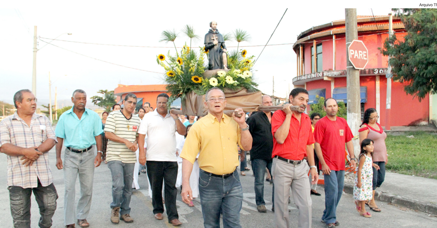
A festa já é uma tradição da paróquia São Cristóvão e, neste ano, será realizada de 28 a 31 de agosto