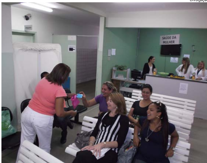
Programa teve início no dia 9 e vai até o fim do mês

Na sexta-feira (9), foi realizada uma palestra com uma nutricionista e foram convidadas 50 gestantes. De acordo com as informações da Secretaria de Saúde e Assistência Social, na quarta-feira