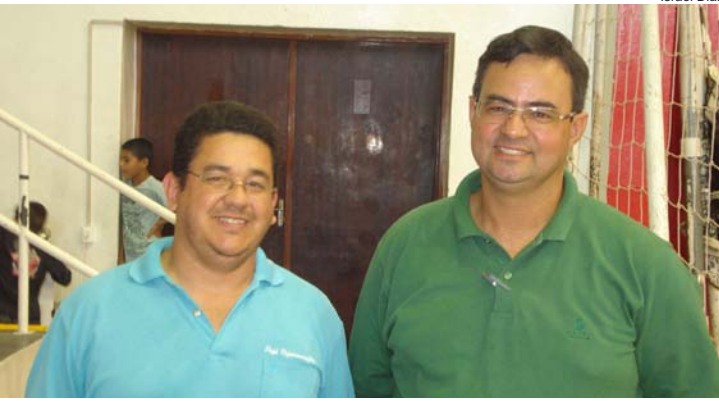
Representantes aprovaram criação da cooperativa

No sábado (11), às 14 horas, no ginásio Juca Moreira, aconteceu mais uma reunião dos ex-colaboradores da Nobrecel.