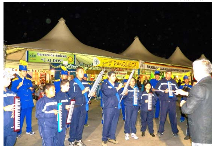
Fanfarra da Apae se apresentou durante a festa