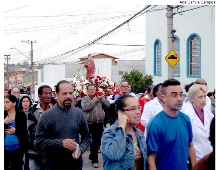
Procissão percorreu as ruas do Mombaça