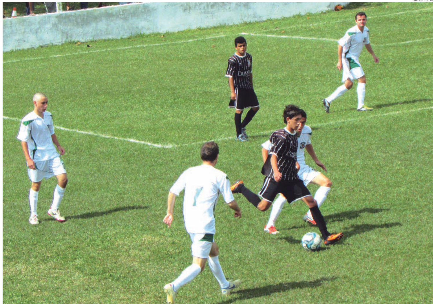
Defesa da Ferroviária anulou o ataque do Corinthians e impediu as principais chances do Timão, no Cardoso