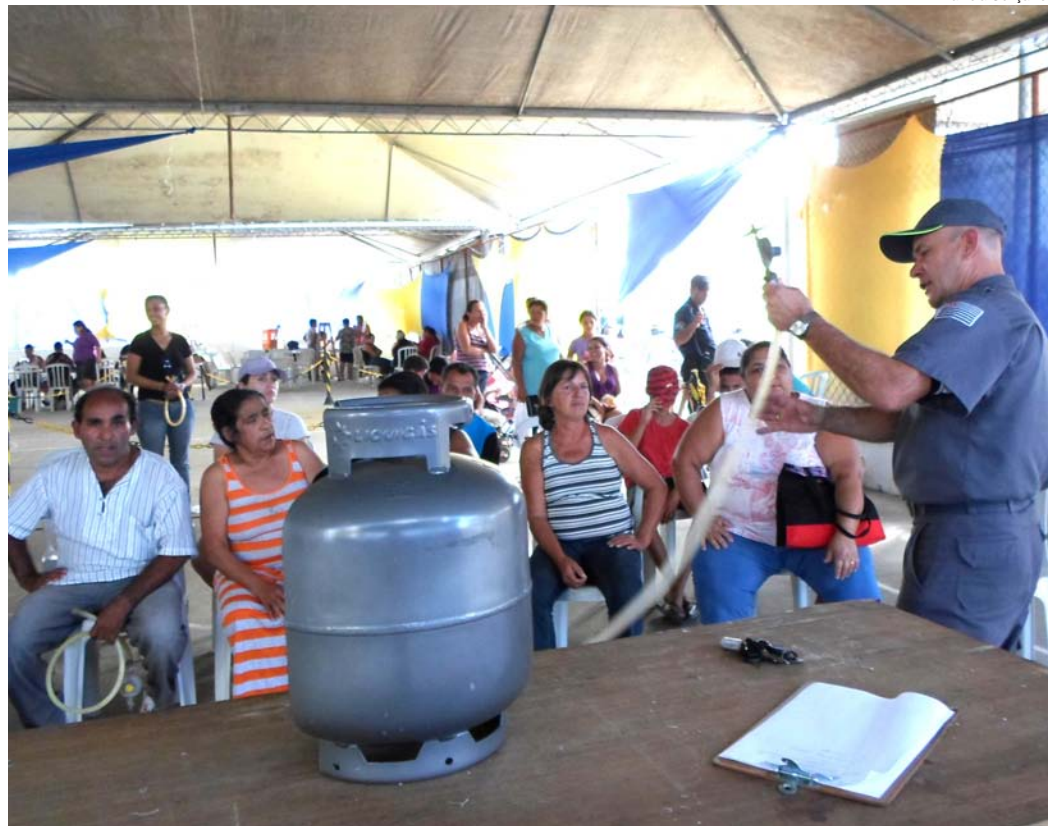
Membro do Corpo de Bombeiros instrui população sobre o manejo do botijão de gás

É a primeira vez que o "Chama Segura" é realizado em Pindamonhangaba. As orientações foram feitas no espaço cedido pelo projeto Nosso Bairro e, na oportunidade, também ocorreu a entrega gratuita de aproximadamente 150 kits de instalação (mangueiras, reguladores e brachadeiras). Houve ainda a retirada de circulação de equipamentos em situação de risco, ou seja, fora do prazo de validade e em condições inadequadas de conservação.