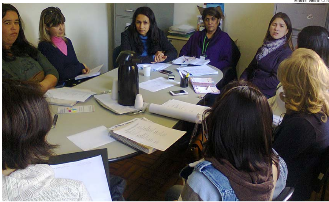
Reunião definiu a programação da Campanha, que começa no final de agosto

Em breve, será divulgada a programação completa da