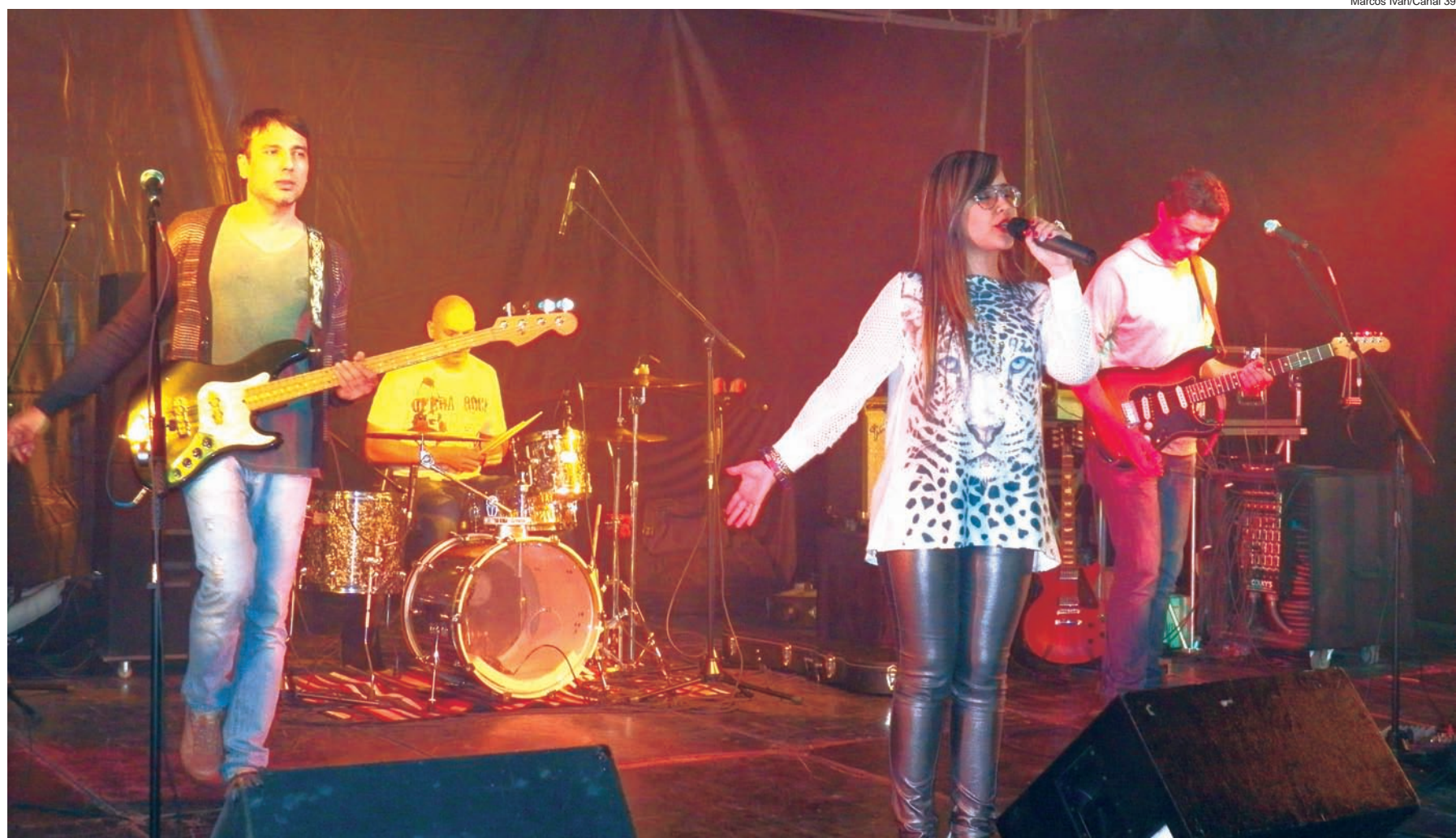
Banda Bela Cruela foi uma das atrações do evento, que arrecadou fundos para atividades da Apae de Pindamonhangaba