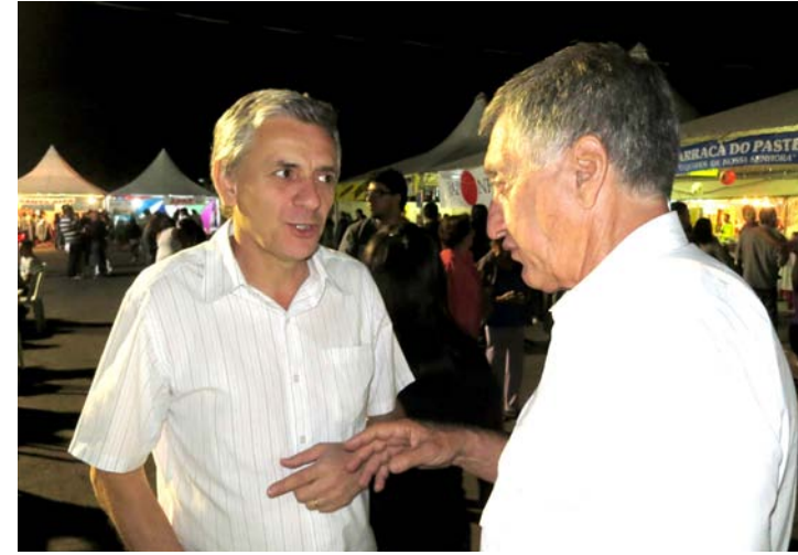
Prefeito prestigiou o evento e conversou com o povo

Além disso, aconteceram diversas atrações com grupos de dança da cidade e apresentações especiais de projetos