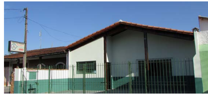
Após reforma, prédio voltará a ser usado pelo Conselho

O Conselho é um órgão público do município, vinculado à Prefeitura e autônomo em suas decisões. O ECA determina que em cada município deve haver, no mínimo, um Conselho Tutelar composto por cinco membros, escolhidos pela comunidade por eleição direta para mandato de três anos, permitida uma recondução.