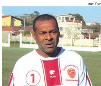
Pelé, artilheiro do torneio