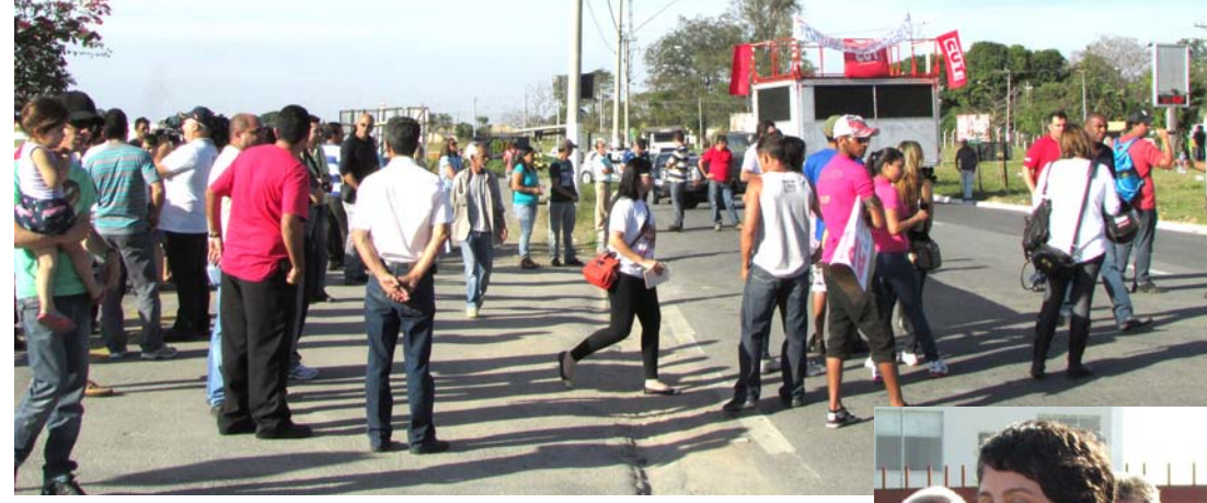
Manifestantes bloquearam a av. Alcides Ramos Nogueira