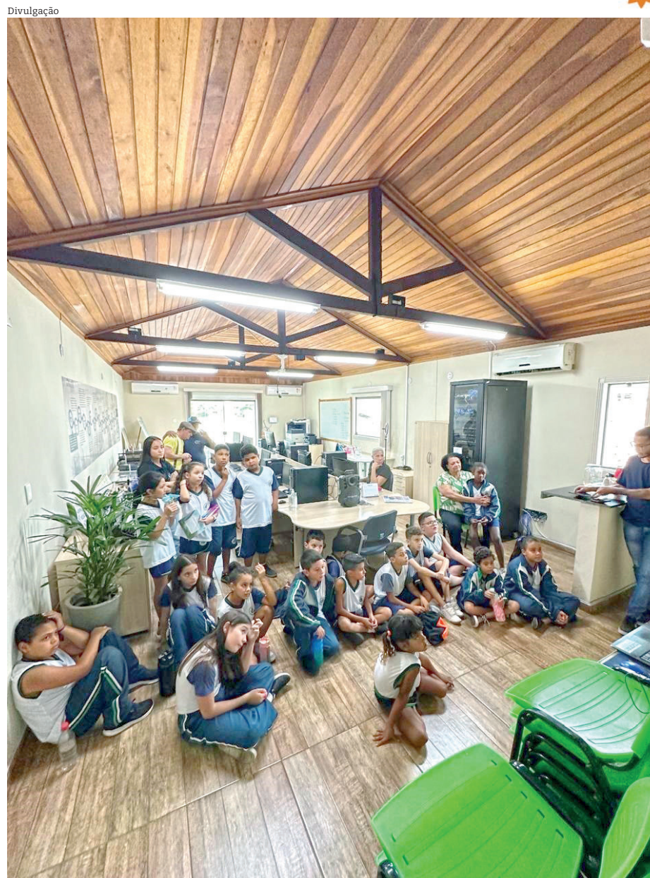
Estudantes de escola do Araretama visitaram a Tribuna no dia 11 de outubro