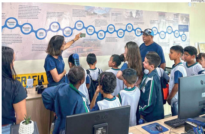
Alunos da escola Professor Elias Bargis Mathias visitaram a Tribuna

O projeto 'Estação Tribuna' continua a todo vapor, recebendo semanalmente uma escola da rede municipal. No último dia 11