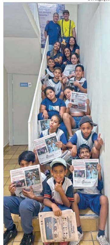
Alunos recebem exemplares do jornal Tribuna do Norte